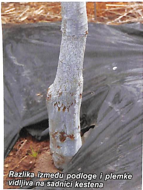
Razlika između podloge i plemke vidljiva na sadnici kestena

zička podloge i plemke mora odgovarati praznim usječenim prerezima, kako bi se podloga i plemka potpuno uklopile. Spoj se omota najlonskom trakom (strech folija) iznad i ispod prereza, u cilju boljeg spajanja cijepa.