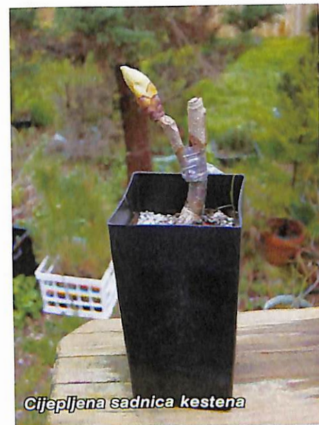
Cijepljena sadnica kestena

Engleski spoj ili cijepljenje na jezičak ima prednost u odnosu na obično spajanje zbog boljeg nalijeganja plemke na podlogu cijepa. Specijalnim sječivom, s duplim paralelnim nožem, usijeku se dvije razine kosog reza. Na kosom dvostrukom rezu se nožem za cijepljenje izvadi dio tkiva drugoga reza, te na podlozi u sredini ostane jezičak. Identičan dvostruki rez radi se i na plemki tako da se jezičak ukloni i izrezani prostor podloge. Jezički podloge i plemke nalaze se na trećini punog prereza podloge i plemke. Duljina je-