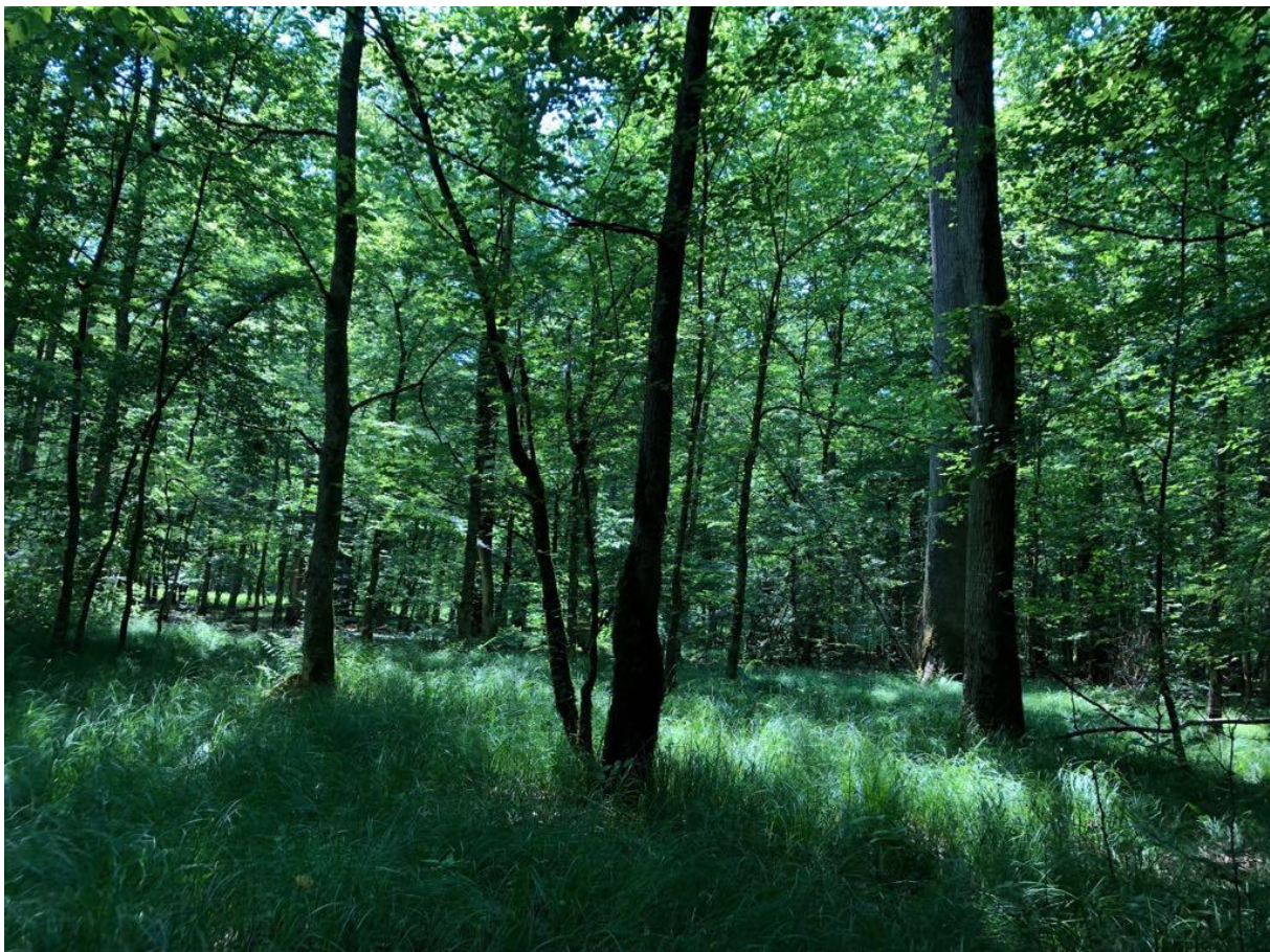
Slika 2. Zajednica Frangulo-Alnetum glutinosae u GJ Opeke (Ptić)

višeplodnički glog ( Crataegus lavigata ), crna bazga ( Sambucus nigra ) i obična hudika ( Viburnum opulus ). Sloj prizemnog rašća je zastupljen velikim brojem vrsta kao što su dugoklasi šaš ( Carex elongata ), debeli šaš ( Carex riparia ), žuti šaš ( Carex vesicaria ), šumski rožac ( Cerastium sylvaticum ), obična bahorica ( Circea lutetiana ), močvarna mlječika ( Euphorbia palustris ), čvorasti smrdelj ( Galeopsis tetrahit ), zečja stopa ( Geum urbanum ), obična dobričica ( Glechoma hederacea ), plivajuća pirevina ( Glyceria fluitans ), vodena perunika ( Iris pseudacorus ), vodena leća ( Lemna minor ), obična vučja noga ( Lycopus europaeus ), obični protivak ( Lysimachia vulgaris ), močvarna potočnica ( Myosotis scorpioides ), močvarna pukovica ( Peucedanum palustre ), širokolisni grešun ( Sium latifolium ), paskvica ( Solanum dulcamara ), uspravni ježinac ( Sparganium erectum ), močvarni čistac ( Stachys palustris ), obična kopriva ( Urtica dioica ), močvarna kopriva ( Urtica radicans ) i dr.