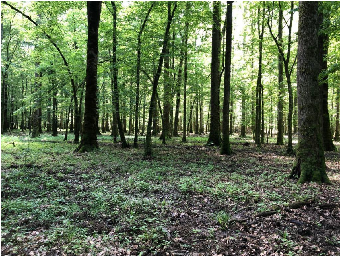
Slika 5. Zajednica Carpino betuli-Quercetum roboris na području GJ Opeke (Ptić)

najpovoljnijim uzgojnim oblikom visokih regularnih šuma hrasta lužnjaka te predstavljaju klimaks u ovom području (Rauš, 1973).