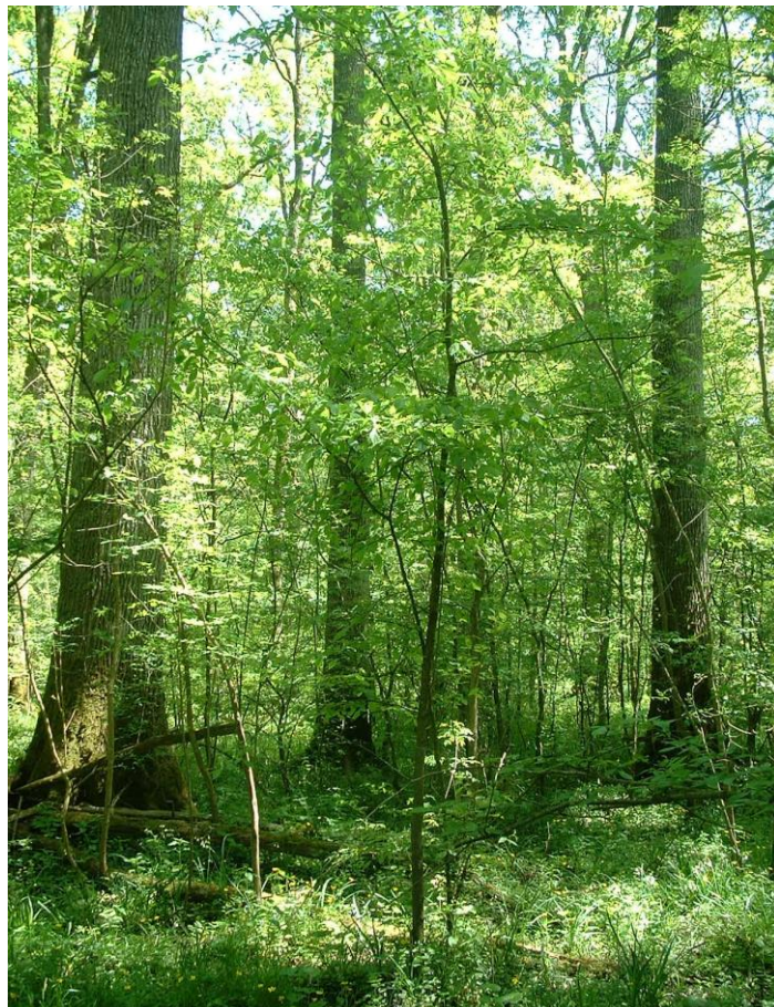
Slika 4. Zajednica Genisto elate-Quercetum robri u GJ Opeke (Baričević)

U sastojinama hrasta lužnjaka vlažnog tipa moguće je uzgojiti hrastova stabla najfinije građe i u duljim ophodnjama (160 – 200 godina) proizvesti visoko vrijedne sortimente. Ova se šuma pod utjecajem poplavnih i podzemnih voda razvija kao trajni stadij (Rauš, 1973).