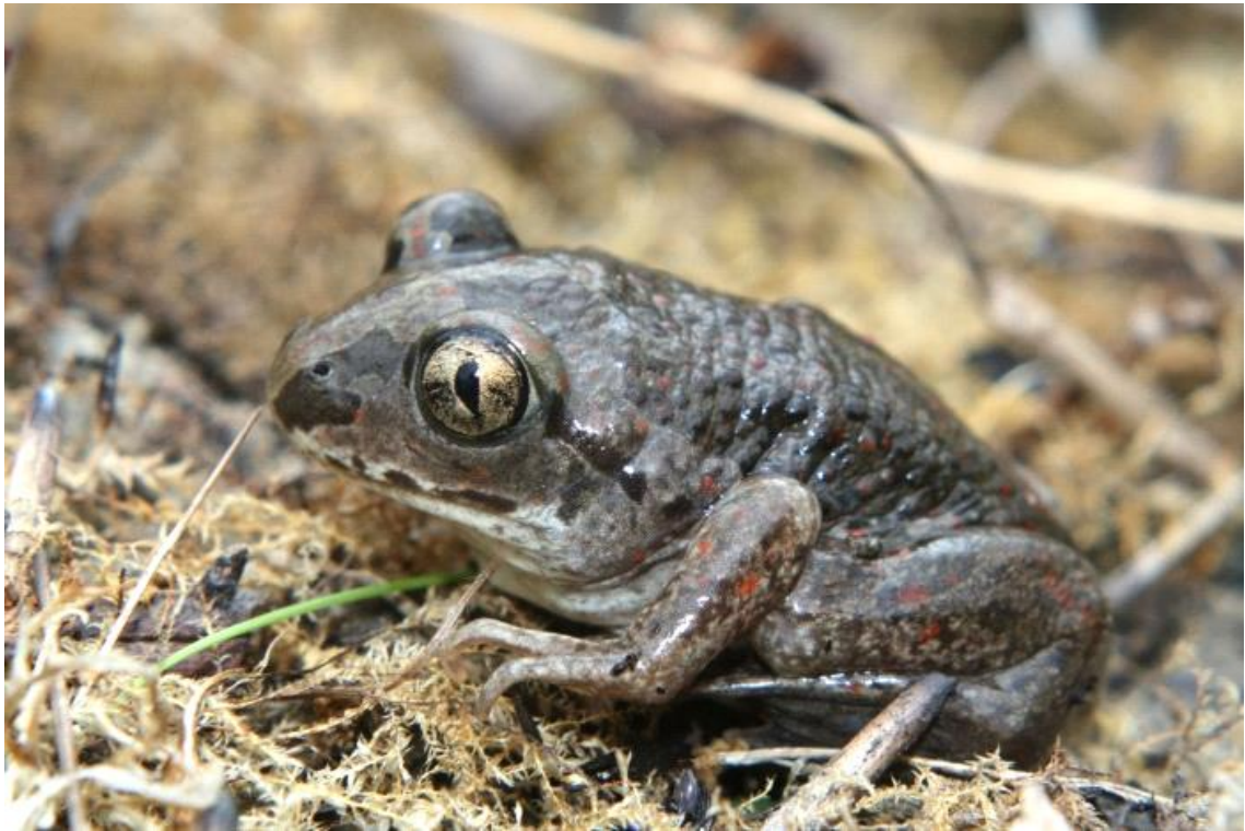
Slika 6. Obična češnjača

Obična češnjača (slika 6.) je velika 4-8 cm i posjeduje sive lopataste tvorevine na stražnjim udovima uz pomoć kojih se natrag ukopava u tlo. Obitava na kopnu, a staništa joj su travnjaci, livade, ledine i obradive površine. Nalazi se u srednjoj i istočnoj Europi, te na zapadu Azije. Pri uznemirenju joj kožne flijezde porizvode izlučenu koja mirisom podsjeća na češnjak, te služi za odvratanje grabljivaca. Osim toga tokom opasnosti može i udahom zrakadi i tijelo na sve 4 noge kako bi dala iluziju veće veličine. Hrani se kukcima i ostalim manjim beskraljevcima. Razmnožava se tokom proljeća, a njeni punoglavci su najveći punoglavci Hrvatske i mogu doseći čak 12 cm.