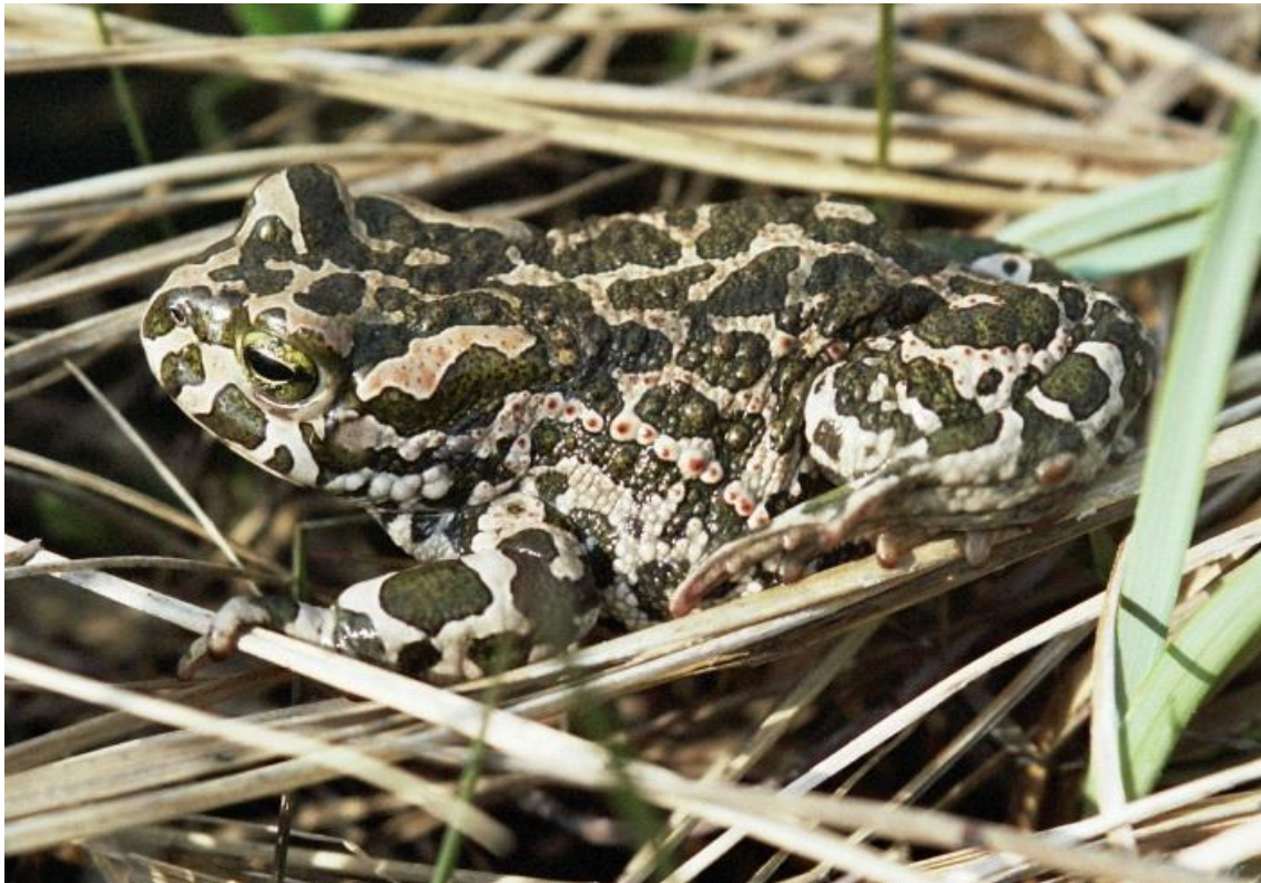
Slika 8. Mramornozelene mrlje i crvene pjege zelene krasta e

Zelena krasta a mofle narasti do oko 14 cm, odozgo je maslinastosme e do maslinastozelene boje sa velikim mramornozelenim mrljama i crvenim pjegama (slika 8.). Kao i ostale krasta e posjeduje bradavi astu koflu. Ve inom nastanjuje nizinska i pje– ana stani-ta, ali mofle do i i do urbanih podru ja te preffivjeti u planinskim predjelima. tokom zimskih i su–nih razdoblja se sakriva ispod panjeva, stijena ili se zakopava ispod trule vegetacije. Aktivna je no u i hrani se kukcima. Razmnoflavanje se odvija tokom prolje a i jeseni, a mufljak tokom udvaranja proizvodi visoke zvukove da privu e flenku. fienka mofle polofliti oko 10000 i 12000 jaja.