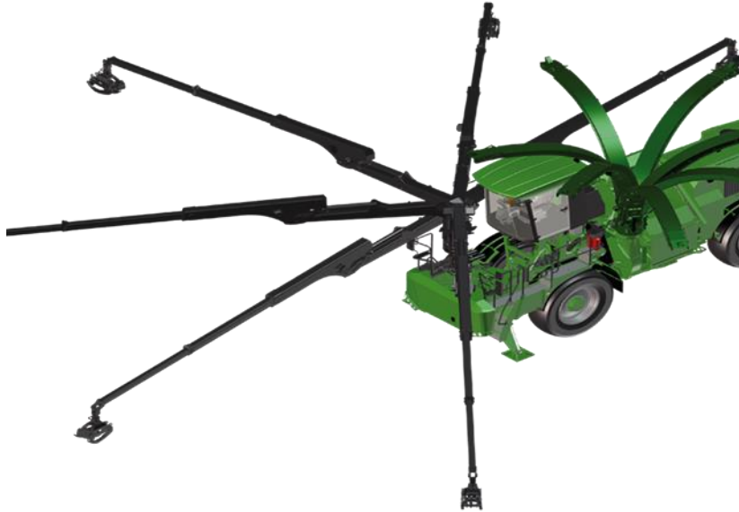
Slika 13. Prikaz radijusa okretanja kрана dizalice i tornja za istovar ( http://www.albach-maschinenbau.de/de_DE/ )