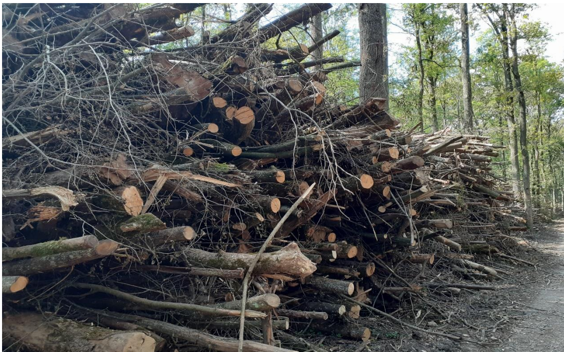
Slika 8. Uhrpana sirovina na radilištu Strošinci