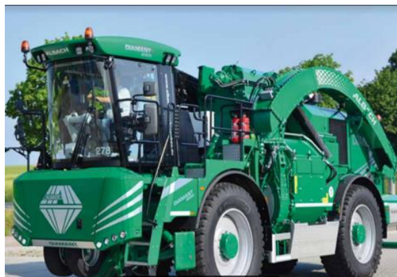
Slika 2. Samohodni iverač - Albach