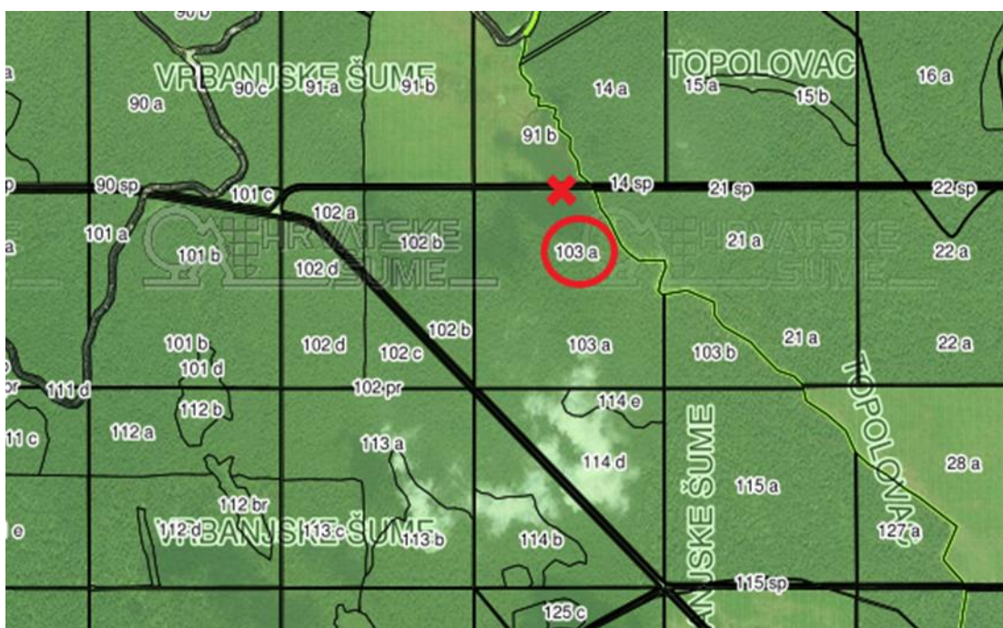
Slika 9. Odsjek 103a, G.J. „Vrbanjske Šume“ i mjesto iveranja (X) ( http://javni-podaci.hrsume.hr/ )

Istraživanje se odvijalo na pomoćnom stovarištu formiranom duž šumske ceste koja se pruža uz odsjek 103a. Pripremni sijek u odsjeku obavljen je u krajem 2018. Po završetku sječe i izrade izvezena je tehnička oblovina. Ovršine su forvarderima izvezene na pomoćno stovarište u srpnju, a složajevi su formirani na odvodni jarak kako bi potpuno oslobodili cestu te omogućili nesmetan mimoilazak iverača i kamiona tijekom iveranja.