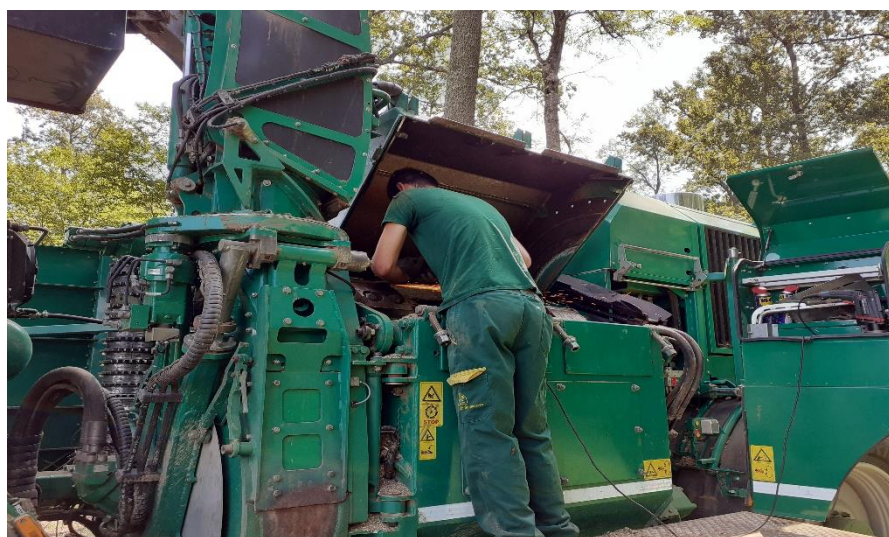
Slika 18. Oštrenje noževa na iveraču

Sljedeći je značajni čimbenik postupak oštrenja i/ili promjene noževa. Prema rezultatima istraživanja promjena noževa čini 5 – 7 % ukupnog vremena rada, dok oštrenje u oba slučaja iznosi 5 %. Dodatnom analizom pokazalo se da je na području radilišta Strošinci bilo potrebno u prosjeku oštriti ili mijenjati nož svake 122,97 t, dok je na radilištu Vrbanja isto bilo nužno nakon svake 143,64 t. Odnosno, za oštrenje i promjenu noževa je na radilištu Strošinci utrošeno 0,21 min/t, a na radilištu Vrbanja 0,15 min/t. Razlog češćeg oštrenja, odnosno promjene noža na radilištu Strošinci je veća količina blata koja se nalazila na sirovini. Naime, strana tijela i blato oštećuju i tupe nož puno brže nego što je to slučaj prilikom iveranja nekontaminirane sirovine.