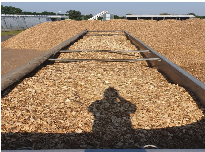
Slika 5. Skladišni prostor drvene sječke, „UNI VIRIDAS“ Babina Greda

Iveranje kod energane čini transport i iveranje međusobno neovisnim pri čemu se sirovina transportira u obliku šumskog ostatka, cijelih stabala(ca) ili oblog energijskog drva. Nedostatak iveranja biomase kod energane je potreba za velikim stovarišnim prostorom transportirane drvene sirovine, ali i problematičan daljinski transport šumskog ostatka.