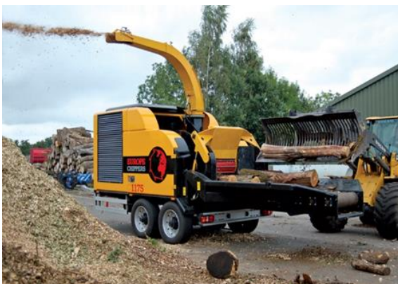
Slika 1. Iverač ugrađen na poluprikolicu

Prema Slabaku (1987) iverači se dijele na iverače priključene na poljoprivredne traktore (snage do 50 kW), djelomično pokretne iverače (ugrađene na prikolicu), te pokretne iverače ugrađene na forvarder ili kamion koji su ujedno i najveći i najsnažniji strojevi ove vrste.