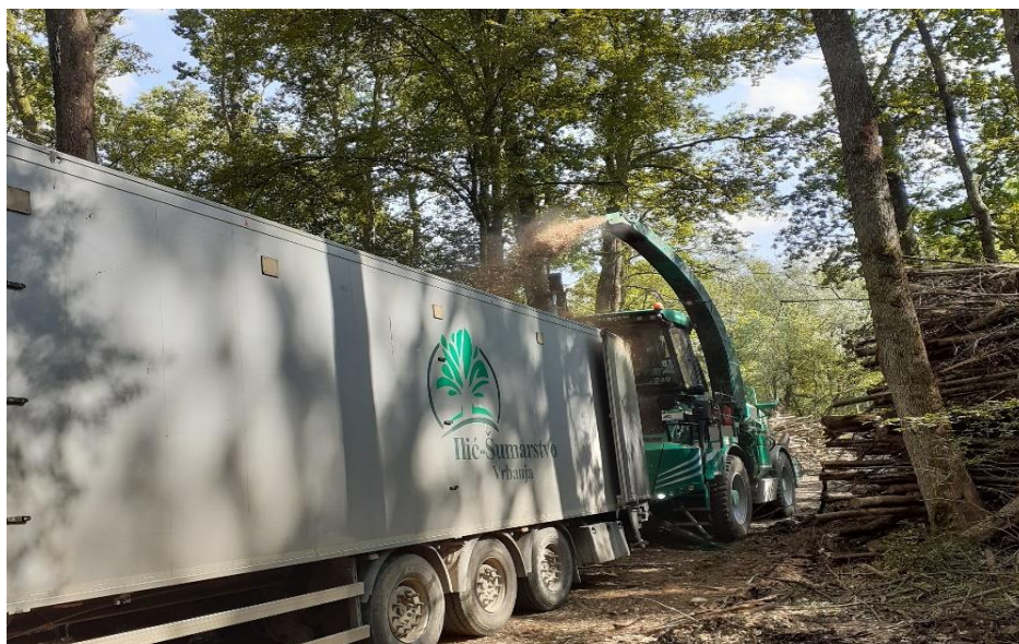
Slika 14. Proces iveranja na radilištu Strošinci

Evidentirana je masa svakog tovara drvne sječke temeljem službenih odvaga. Uzorak za određivanje tehničkog masenog udjela vode utvrđen je pomoću instrumenta za brzo određivanje vlage iz nasumično odabranih tovara drvne sječke tri do četiri puta dnevno.