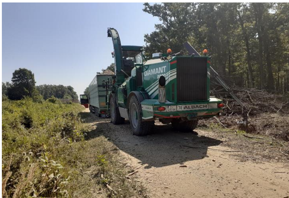
Slika 15. Proces iveranja na radilištu Vrbanja