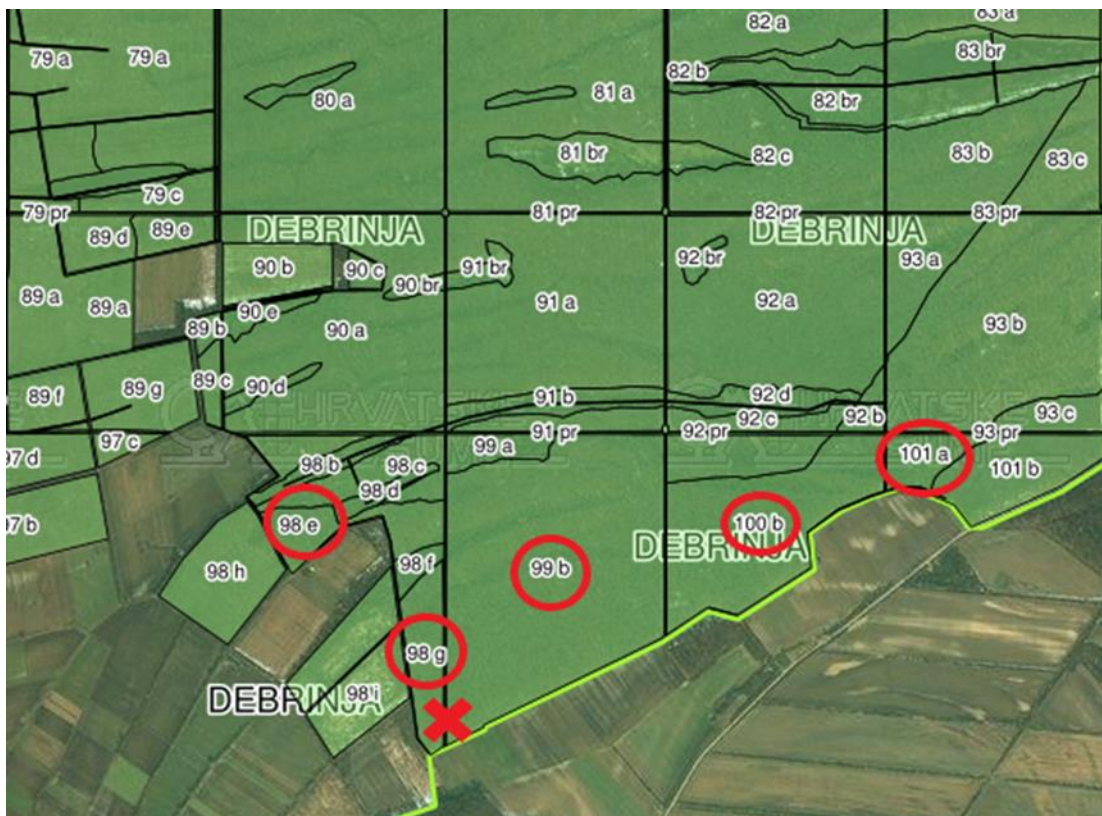
Slika 7. Odsjeci 98e, 98g, 99b, 100b, 101a, G.J. „Debrinja“ i mjesto iveranja (X) (http://javni-podaci.hrsume.hr/)

U navedenim odsjecima napravljen je pripremni sijek, a nakon izvoženja tehničke oblovine ovršine su izvožene forvarderima na pomoćno stovarište formirano uz rub odsjeka 99b kojim prolazi šumska cesta. Izvoz i iveranje provodili su se paralelno, s tim da je operater forvardera složajeve formirao na mjestima gdje se nije obavljalo iveranje kako ne bi ometao rad iverača.