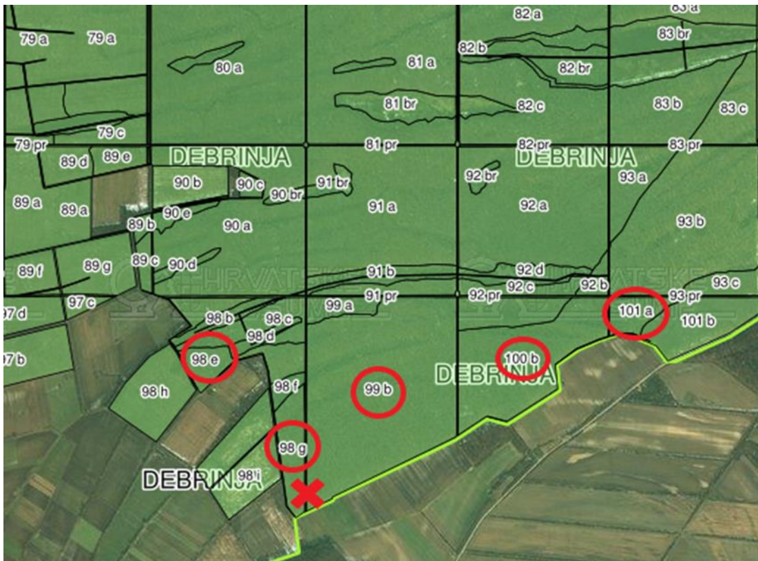
Slika 7. Odsjeci 98e, 98g, 99b, 100b, 101a, G.J. „Debrinja“ i mjesto iveranja (X) (http://javni-podaci.hrsume.hr/)

U navedenim odsjecima napravljen je pripremni sijek, a nakon izvoženja tehničke oblovine ovršine su izvožene forvarderima na pomoćno stovarište formirano uz rub odsjeka 99b kojim prolazi šumska cesta. Izvoz i iveranje provodili su se paralelno, s tim da je operater forvardera složajeve formirao na mjestima gdje se nije obavljalo iveranje kako ne bi ometao rad iverača.