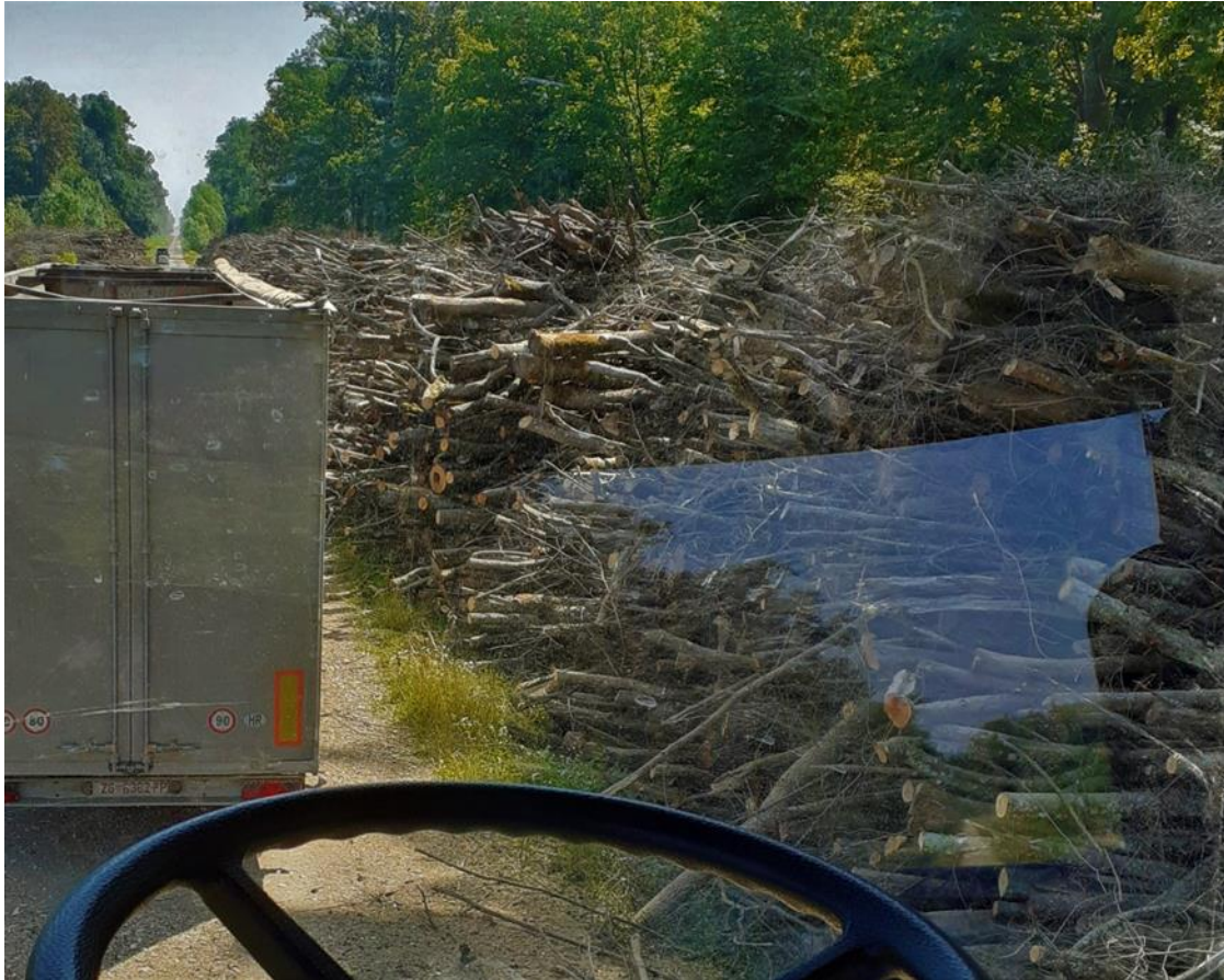
Slika 10. Uhrpana sirovina na radilištu Vrbanja