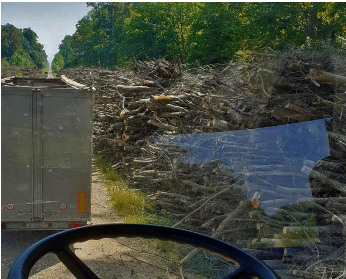
Slika 10. Uhrpana sirovina na radilištu Vrbanja