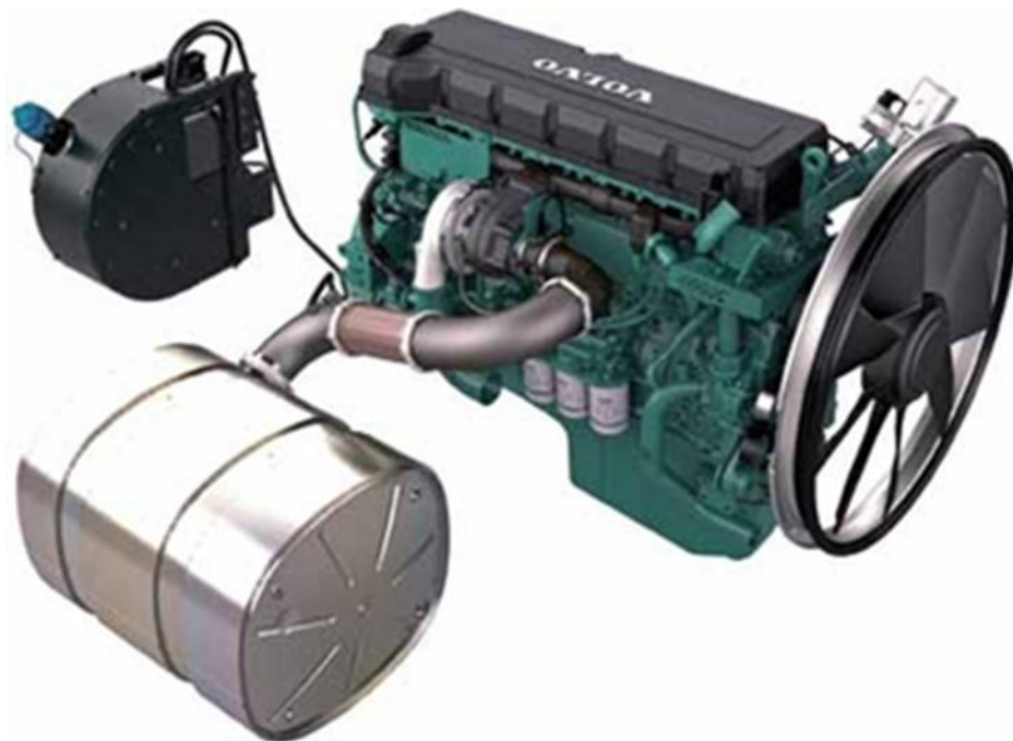
Slika 11. Motor iverača Diamant 2000 ( http://www.albach-maschinenbau.de/de_DE/ )

Masa je istraživanog iverača 32 t, a pokreće ga vlastiti Volvo motor snage 565 kW. Dizajn mjenjača i hidraulike osiguravaju snažan, dinamičan i ekonomičan rad, s dovoljnom snagom motora i niskom potrošnjom goriva ( http://www.albach-maschinenbau.de/de_DE/ ).