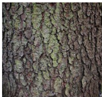
Slika 3. Kora bodljikave smreke.