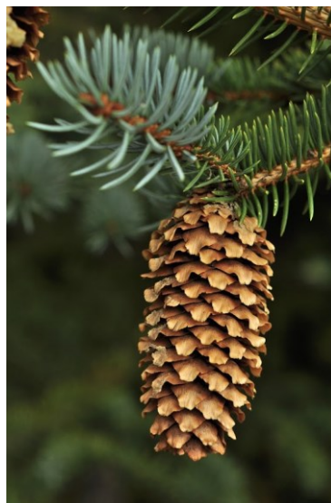
Slika 1. Božićno drvece bodljikave smreke. Slika 2. Češer bodljikave smreke.