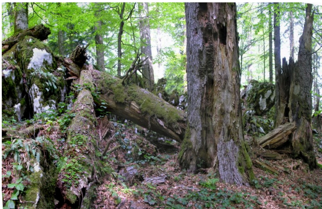
Slika 5. Faza raspadanja u prašumi Čorkova uvala u Nacionalnom parku Plitvička jezera

Prpić je u svojim radovima utvrdio prijelaz prašume iz kasne optimalne faze u fazu starenja (Tikvić i sur., 2018). Prevladava optimalna faza, a na manjim se površinama pojavljuje faza raspadanja i faza pomlađivanja. U omjeru je smjese utvrđeno smanjenje udjela obične jele, a povećanje udjela obične bukve. Također je utvrđena raznodobna struktura sloja drveća s pomlatkom jele ispod stabala bukve i pomlatkom bukve ispod stabala jele. Ta činjenica dokazuje da se bukovo-jelovim šumama pravilno gospodari prebornim načinom gospodarenja, odnosno da se oponašaju prirodni procesi u prašumama.