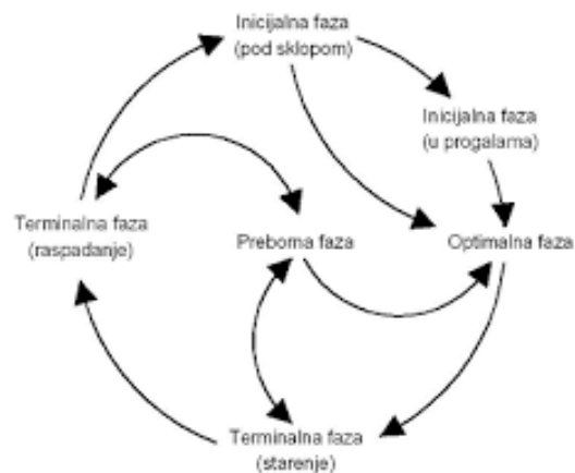
Slika 3. Shematski prikaz razvojnih faza prašume prema Aniću