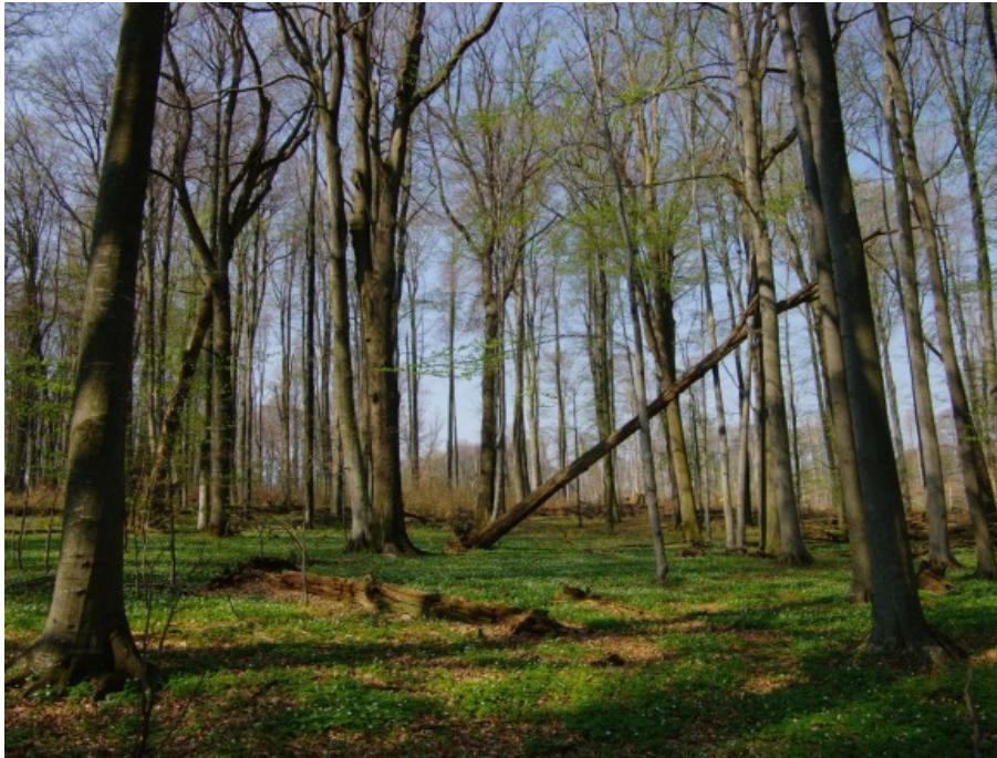
Slika 6. Bukovo - kitnjakova prašuma Muški bunar na Psunju

obilan, kao i dobrim strukturnim odnosima sastojima. Dinamična ravnoteža održava ekosustav stabilnim, a budućnost takvog ekosustava se može osigurati trajnom aktivnom zaštitom prostora.