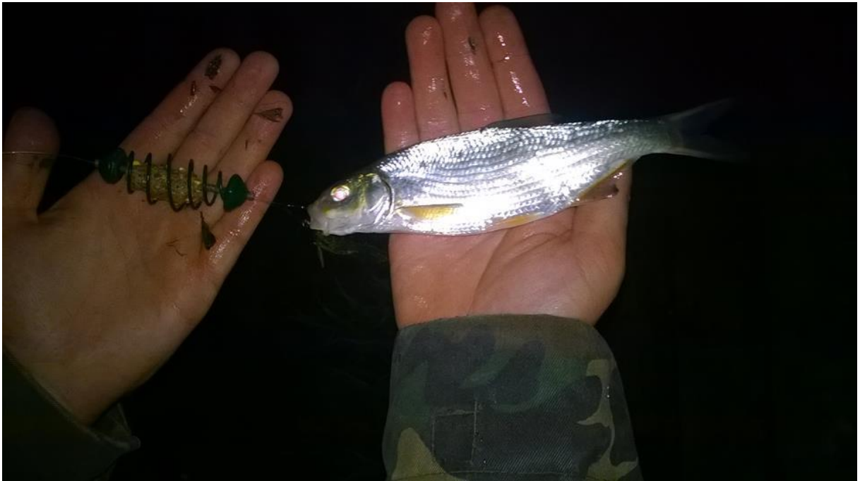
Slika 1. Osjetljiva (VU) vrsta nosara ( Vimba vimba ) registrirana na starom toku Drave prije utjecanja u akumulaciju HE Donja Dubrava

tok rijeke Drave posebno ugrožava vađenje šljunka i pijeska iz korita što uzrokuje izravan gubitak staništa za brojne vrste riba, ali i ostale životinje (Mrakovčić i sur., 2006).