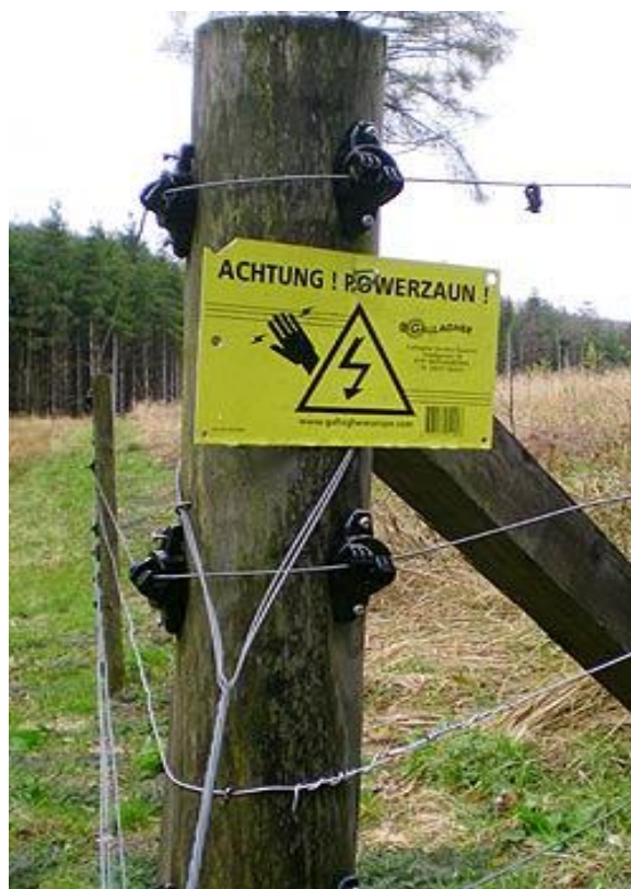
Slika 11. Električna ograda

U šumama se najčešće koriste ograde od žičane mreže. Vrlo često se mogu vidjeti armaturne mreže koje su s jedne strane jednostavne za korištenje i postavljanje, a s druge strane može doći do ozljeđivanja divljači u koliko ipak dođe do preskakivanja. Iz tog razloga preporuča se postavljanje tri reda trake iznad najgornje žice. Mreže moraju biti dobro ukopane u zemlju kako se divljač, pretežito svinje, ne mogu provući ispod njih. Postoje električne ograde koje sprječavaju ulazak divljači u ogradaenu površinu tako što životinja koja dodirne ogradu doživi neugodni strujni udar, te neko vrijeme izbjegava ogradu. Taj električni udar nema nikakvih zdravstvenih posljedica na životinju. Za zaštitu od srneće i jelenske divljači preporuča se ograda visine do 140 - 150 cm, s pet ili šest vodiča (reda žice), razmak između stupova 3-4m, a za zaštitu od divljih svinja visina 55-75 cm s tri vodiča (reda žica), razmak između stupova 3-4m.