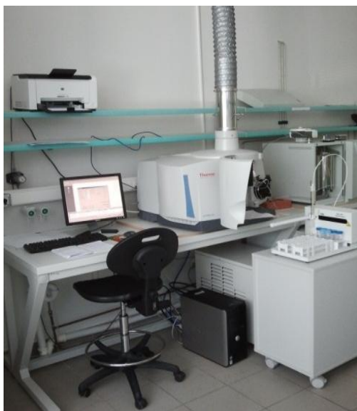
Slika 3. Spektrometar Thermo Fischer iCAP6300 Duo

Koncentracije istraživanih elemenata u priređenim otopinama (ekstraktima) određivane su tehnikom atomske emisijske spektrometrije, uz induktivno spregnutu plazmu (ICP-AES). Uređaj je podešen na stabilne uvjete rada te je obavljena vanjska kalibracija serijom standardnih otopina, koje su prikazane u tablici 1 . Također, u tablici 1 . vidljivi su osnovni podaci o atomskom emisijskom spektrometru uz induktivno spregnutu plazmu. Spektrometar korišten za istraživanje, Thermo Fischer iCAP6300 Duo , prikazan je na slici 3 .