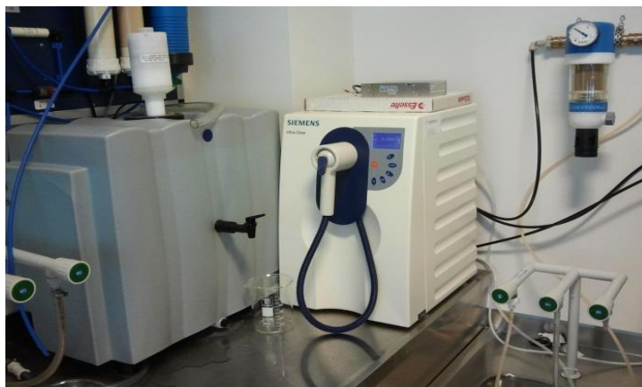
Slika 2. Uređaj za pripremu ultračiste vode Siemens Ultraclear

Razrjeđivanje standardnih otopina i uzoraka te pranje posuda rađeno je ultračistom vodom (0,055 μS/cm) priređenom uređajem Siemens Ultraclear. Na slici 2. vidljiv je uređaj za pripremu ultračiste vode Siemens Ultraclear.