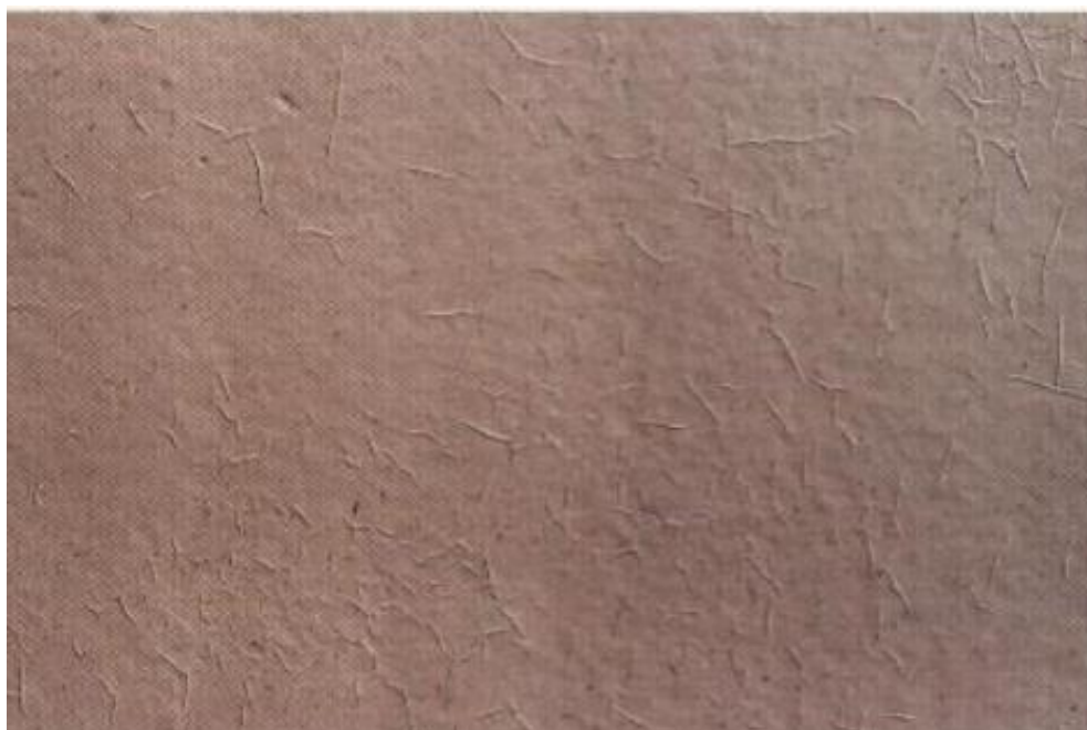
Slika 11. Raspucavanje u obliku vranine noge

( http://www.daryatamin.com/uploads/Books%20File/Fitz's%20Atlas%20of%20coating%20defects.pdf )