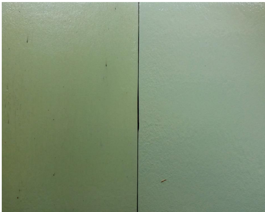
Slika 1. Žućenje