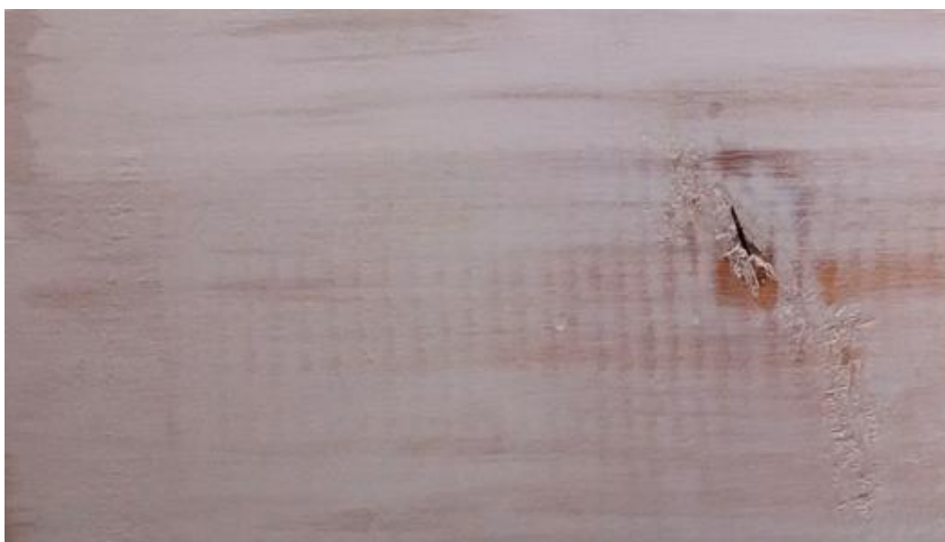
Slika 19. Nedovoljna prekrivenost

e) Nanošenje više laka u više prolaza raspršivačem (Fitzsimons, 2012).