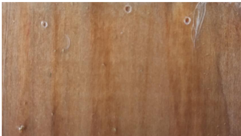
Slika 17. Nastajanje mjehurića