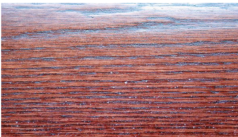
Slika 18. Nastajanje rupičastih oštećenja

( https://www.popularwoodworking.com/woodworking-blogs/flexner-on-finishing-application-problems/ )