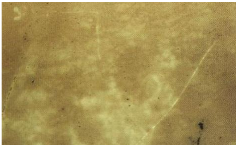
Slika 3. Cvjetanje

( http://www.daryatamin.com/uploads/Books%20File/Fitz's%20Atlas%20of%20coating%20defects.pdf )