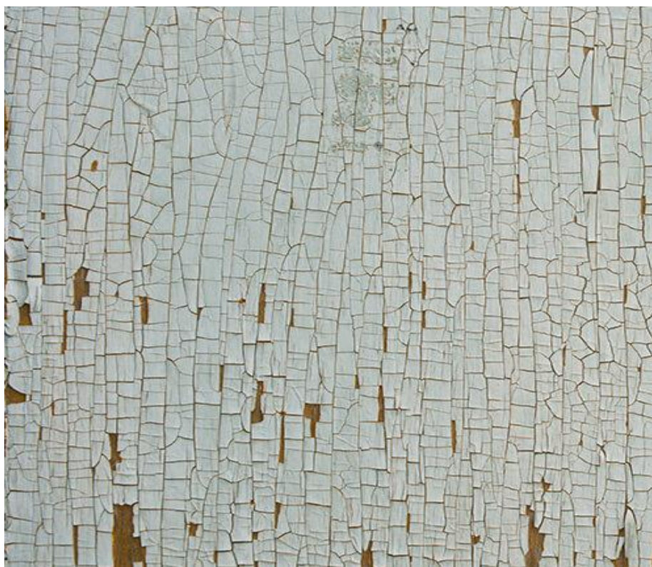
Slika 4. Krokodilska koža ( https://www.ppgpaints.com/pro/pro-painting-tips/how-to-fix-alligatoring-with-paint )