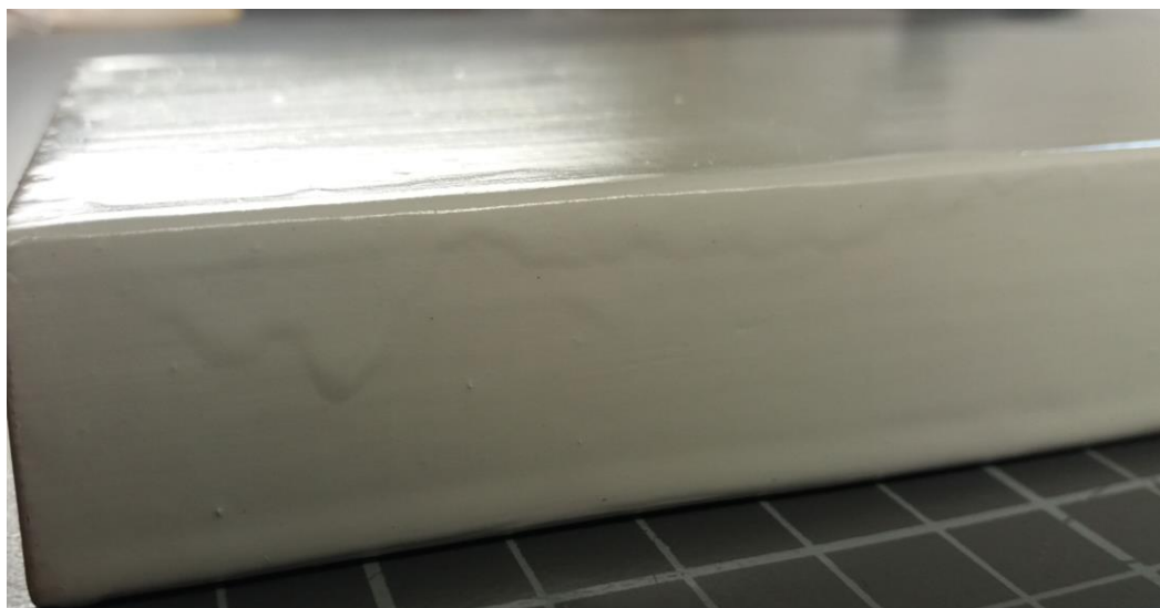
Slika 2. Nastajanje curaka