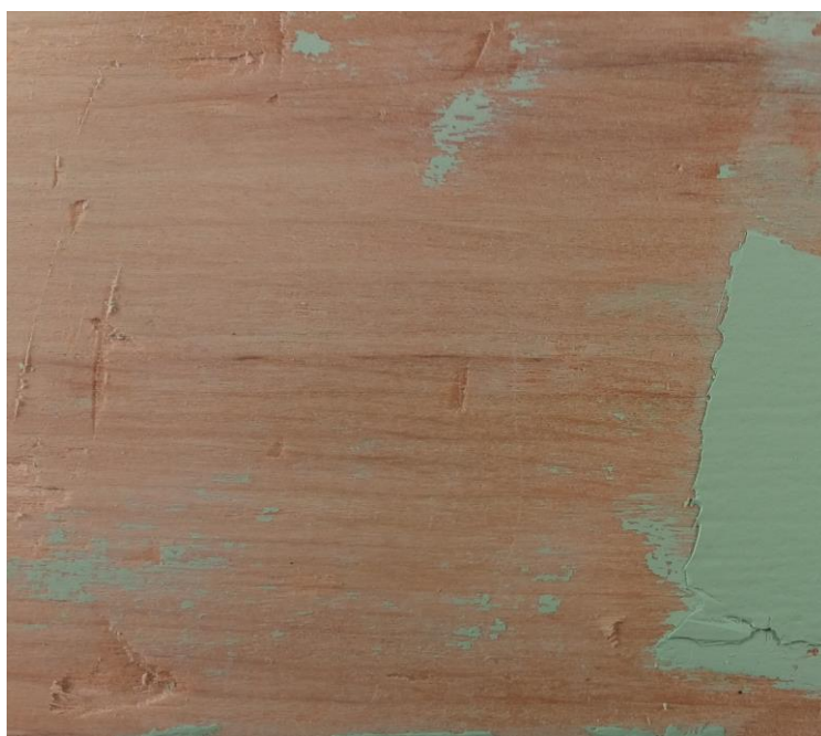
Slika 14. Loša adhezija prema površini