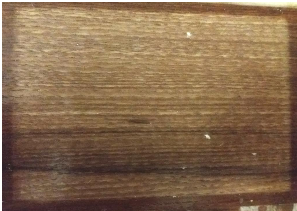
Slika 5. Krvarenje