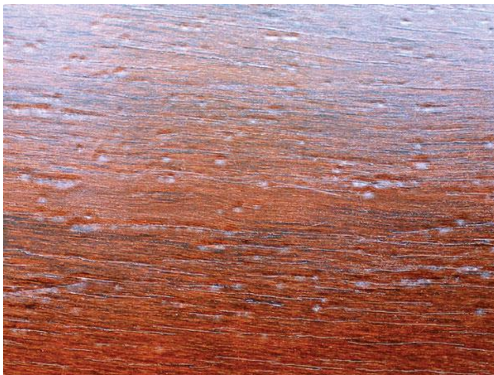
Slika 12. Riblje oči