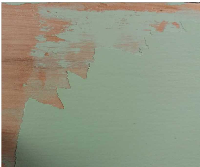
Slika 15. Loša adhezija između slojeva