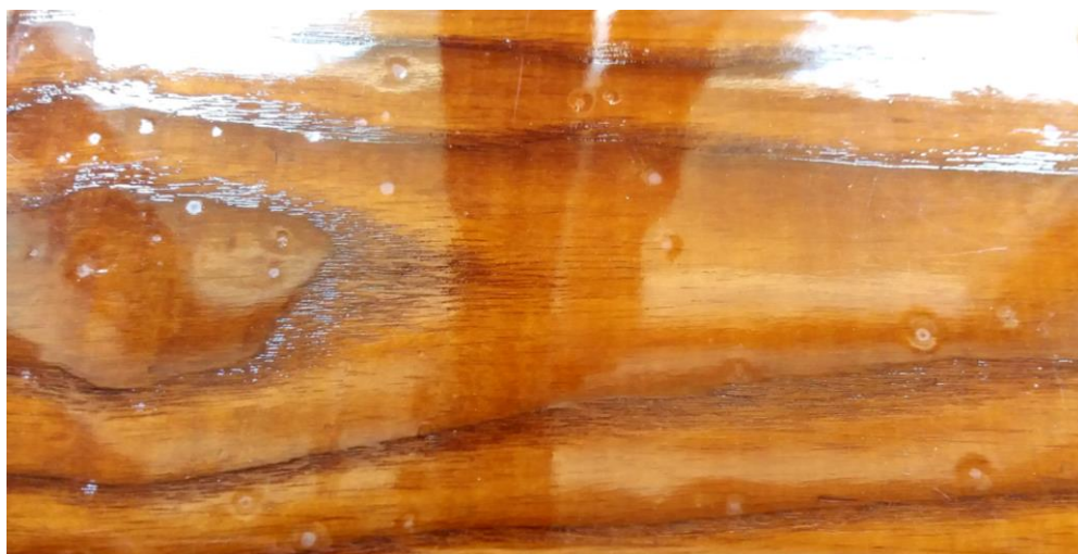
Slika 9. Nastajanje kratera