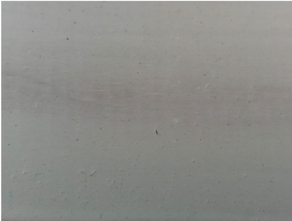
Slika 21. Zrna prašine u laku