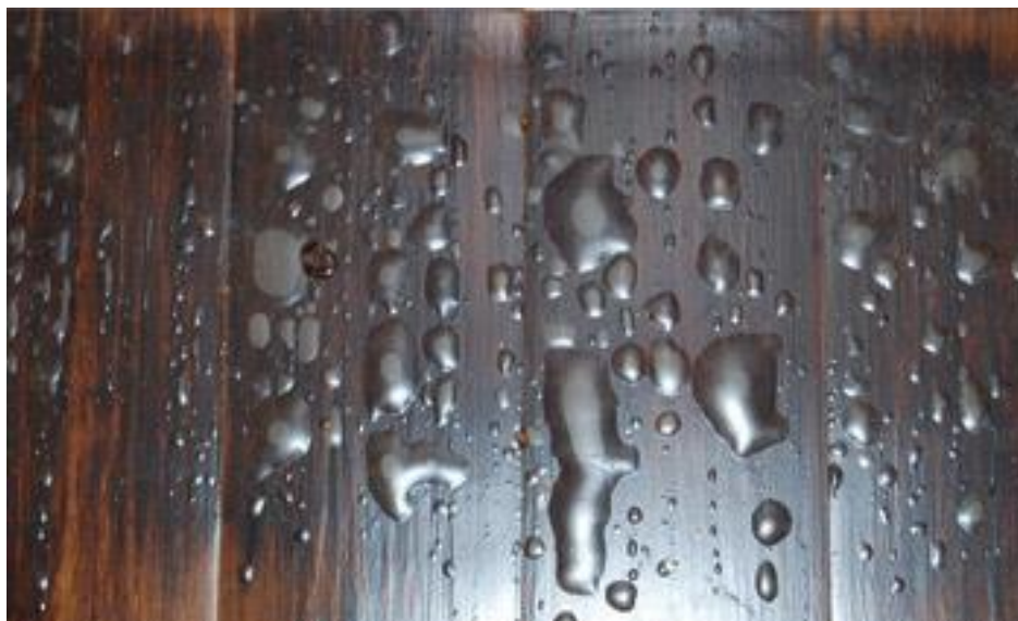
Slika 16. Mjehurenje

( https://www.woodfloorbusiness.com/troubleshooting/slab-moisture-heat-create-finish-blisters-in-a-floating-floor.html )