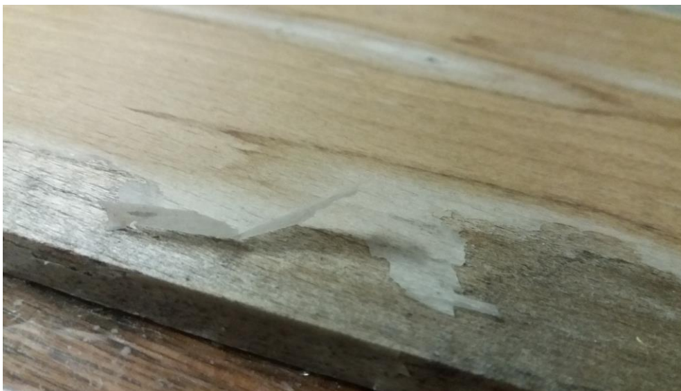
Slika 6. Ljuštenje