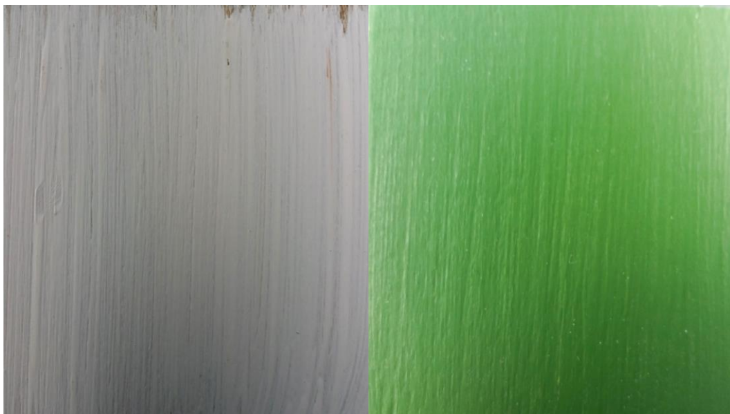
Slika 20. Tragovi kista