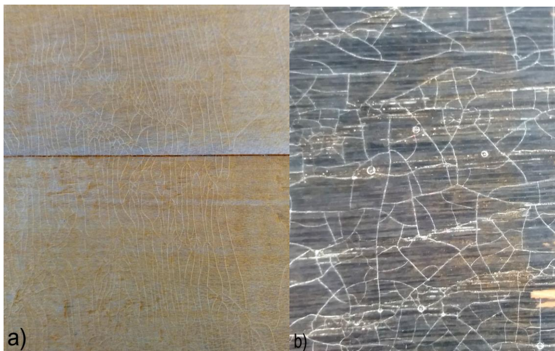
Slika 10. a) Radijalne pukotine, b) Mrežaste pukotine