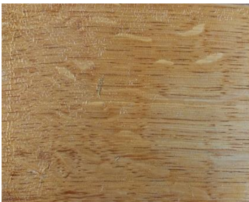
Slika 13. Dizanje sloja