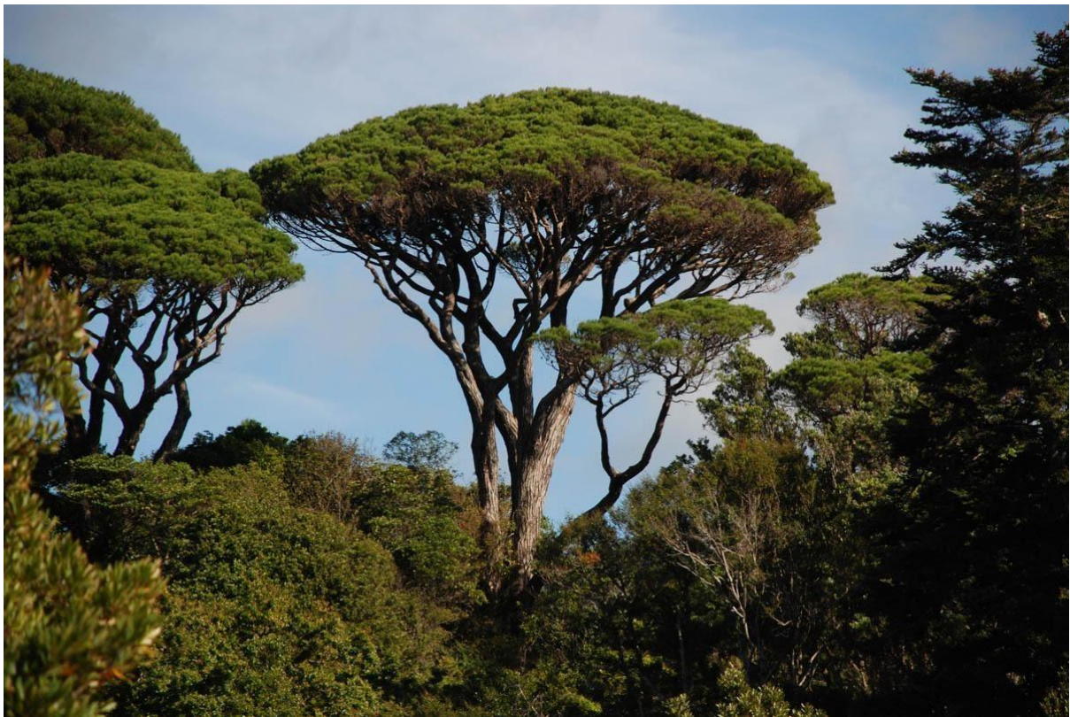
Slika 14. Pinija ( Pinus pinea L.)