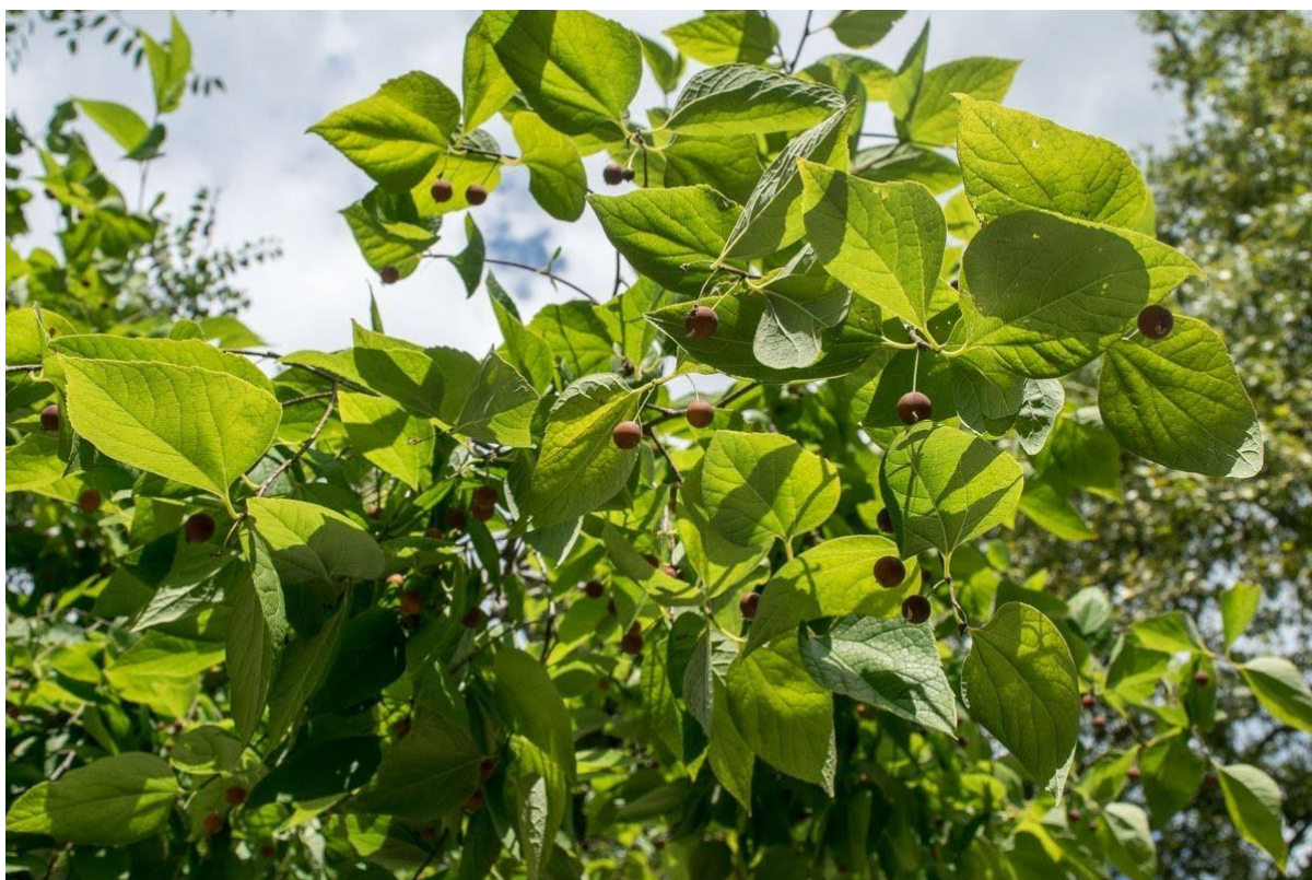
Slika 16. Crni kopriivić ( Celtis australis L.) ( https://www.plantea.com.hr/kostela/ )