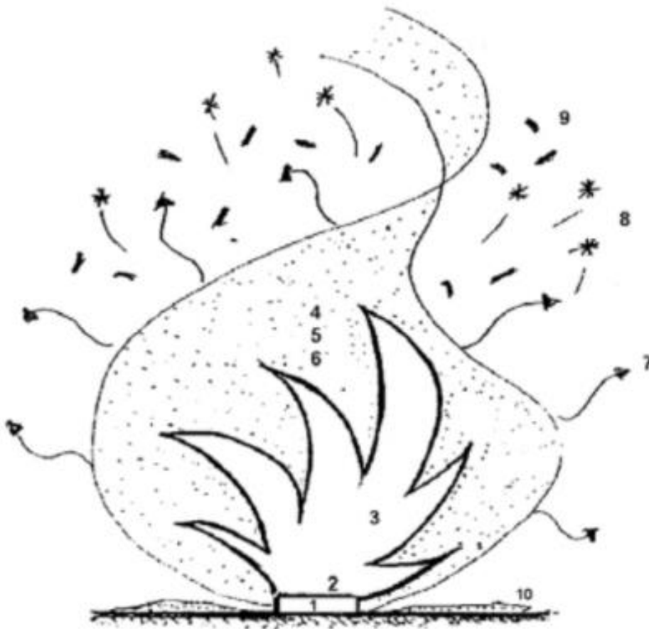
Slika 1. Svojstva požara (Legenda: 1. goriva tvar, 2. žar, 3. plamen, 4. dim, 5. plin, 6. para, 7. toplina, 8. iskra, 9. gorive čestice, 10. pepeo) (Pichler, 2008)

Šumski požari nanose šumama značajne štete, izravne i neizravne, a veličina štete ovisi o nekoliko faktora: starosti i površini šume, vrstama drveća (vegetacije) te o vrsti požara i njegovoj jačini (Jurjević i sur., 2009). Izravne štete koje mogu uzrokovati odnose se na štete na drvnj masi, štete na općekorisnim funkcijama šuma te troškovima sanacije požarišta i obnove, dok se neizravne štete očituju u poremećajima ekoloških uvjeta, vodenim i eolskim erozijama tla te neizravnim štetama na općekorisnim funkcijama šuma.