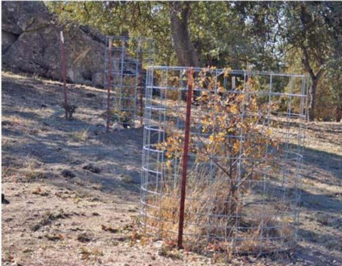
Slika 11. Individualni valjkasti štitnik (Vlahoviček, 2018)

kraju ophodnje; na pošumljenoj površini zadržava se više funkcija a što je jako pogodno za šumarstvo i ruralni razvoj (Dubravac i Hrvoj, 2015).