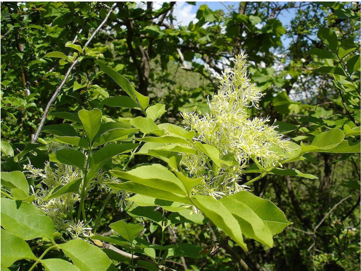
Slika 15. Crni jasen ( Fraxinus ornus L.) ( https://www.plantea.com.hr/crni-jasen/ )