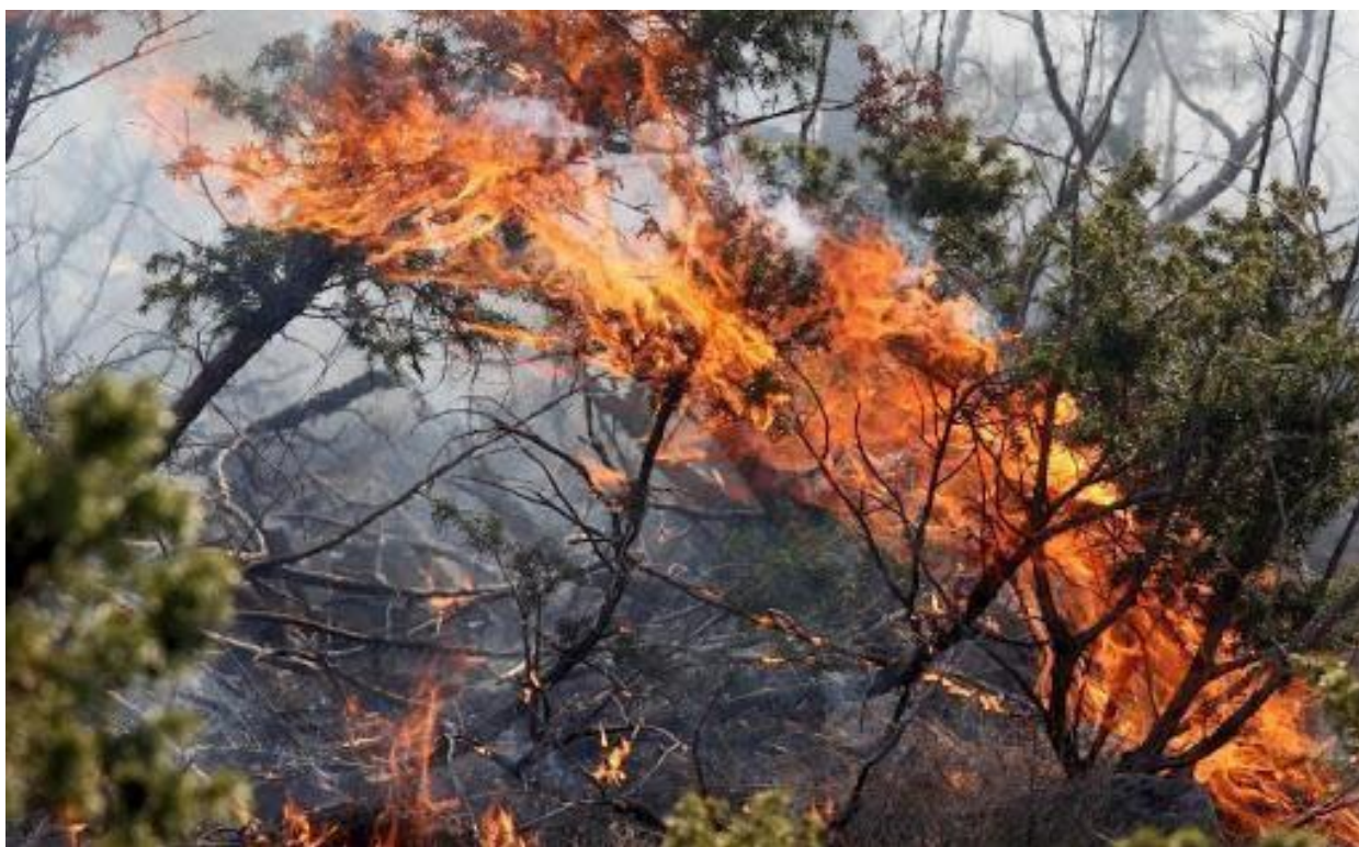
Slika 5. Visoki ili ovršni požar ( http://bih-x.info/stanje-s-pozarima-u-bih-povoljnije-nego-proteklih-dana/pozar-suma-6/ )

Posljednja vrsta požara po tipu gorivog materijala je požar osamljenog drveća i grmlja. Ovakav požar uobičajeno nastaje prilikom udara groma, a u većini slučajeva izgore čitava stable šuma. Osim prirodnim putem, ovaj požar nastaje i umjetnim putem, odnosno djelovanjem čovjeka. Najčešći uzročnici požara osamljenog drveća i grmlja su pastiri, šumarski radnici ili izletnici koji lože vatru uz drveće (Španjol i sur., 2008).