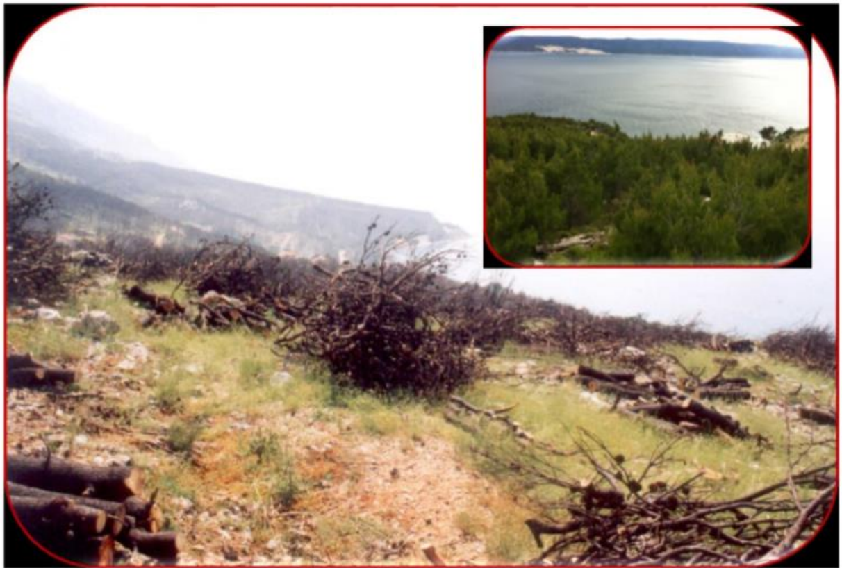
Slika 8. Obnova opožarene šumske površine načinom uhrpavanja opožarenog biljnog materijala u manje hrpe, ljeto 2001. U gornjem desnom kutu je ta ista sastojina snimana nakon provedene šumske obnove 2014.god.

Mjera zaštita tla odnosi se prvenstveno na sječu i usitnjavanje preostale biomase opožarenog područja i njezino raspoređivanje na cijelu površinu. Ovaj prvi korak u zaštiti tla nužan je kako bi se spriječilo isušivanje tla i odnošenje materijala vjetrom i vodom. Učinkovitim metodom za zaštitu tla nakon požara pokazalo se i postavljanje brana po reljefnim konturama, posebno na terenima gdje je tlo mekše, a nagibi su veći. Ovom metodom smanjuje se erozija tla. Drugi korak u zaštiti tla je utvrđivanje stanja opožarene površine te mogućnost njezine prirodne obnove. Ukoliko se utvrdi da se područje ne može prirodno obnoviti, potrebno je što prije pristupiti umjetnoj obnovi sadnjom sadnica ili sjetvom sjemena.