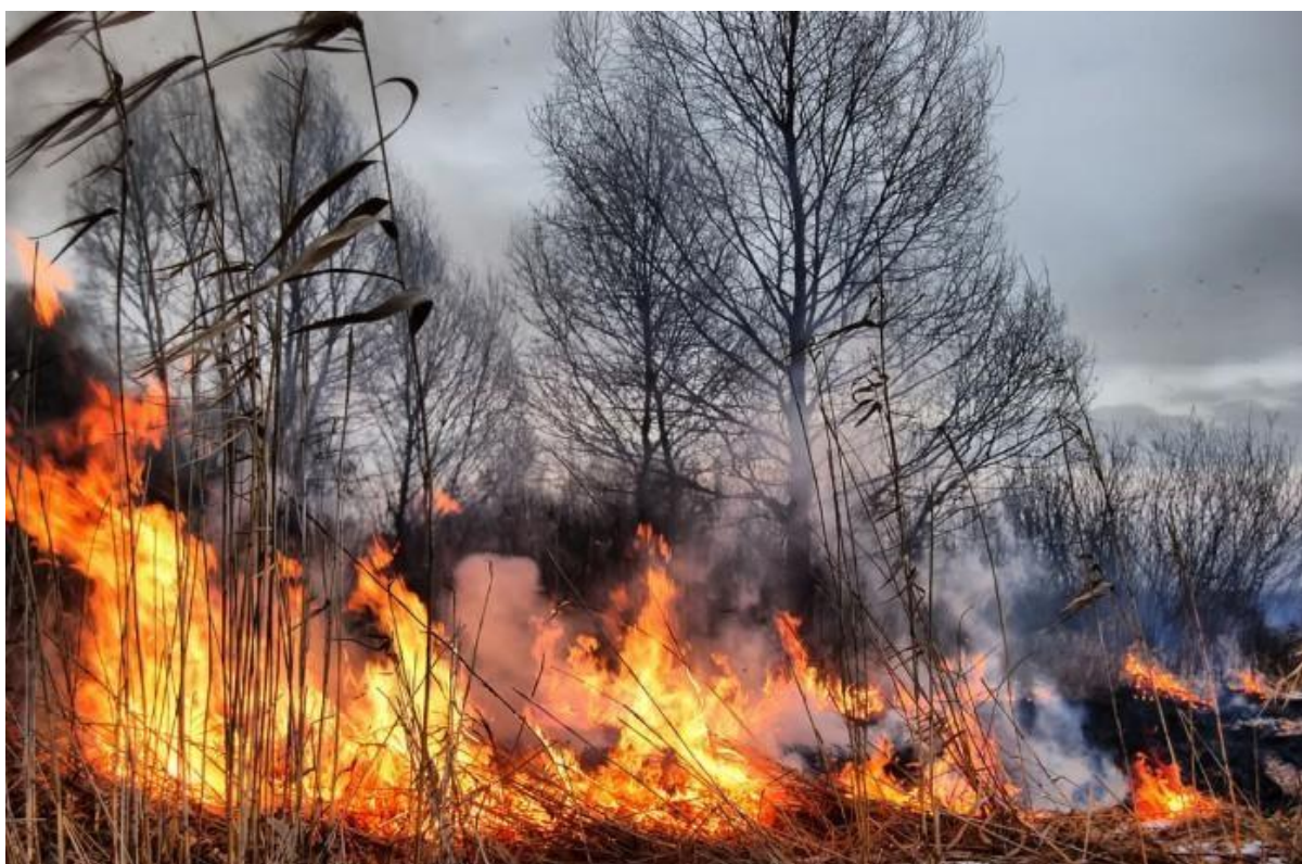
Slika 3. Požar otvorenog prostora

Povećanje broja požara utjecalo je na smanjenje prirodne regeneracije mediteranskog ekusustava, a kao posljedica toga na nekim područja došlo je do smanjenja bioraznolikosti i povećanja erozivnosti tla. Sve to može u konačnici dovesti do opustošenja prostora što dovodi do povećanja troškova obnove tih prostora i njihovog povratka u prvobitno stanje (Rosavec, 2012.).