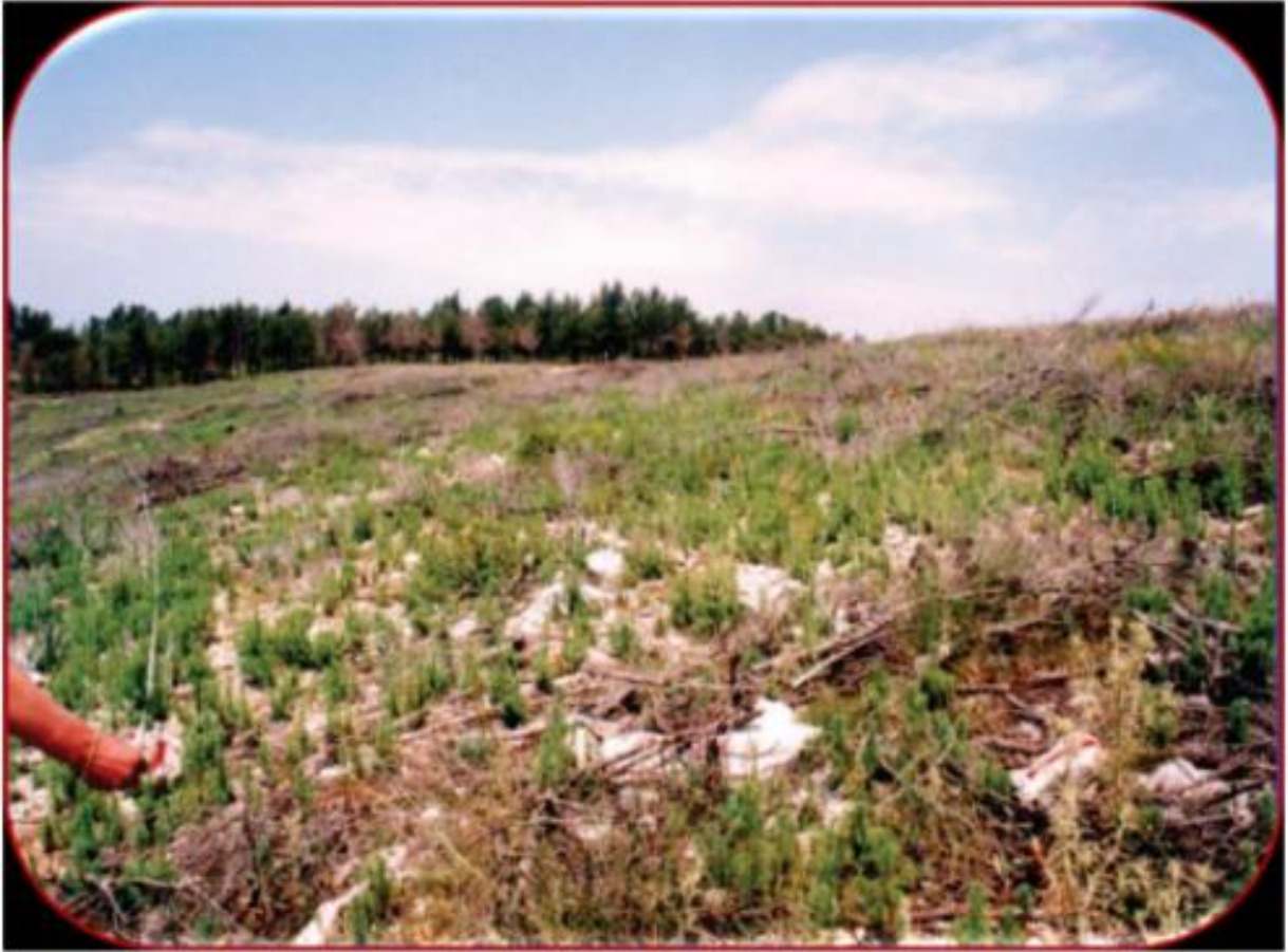
Slika 7. Sanitarna sječa preostale vegetacije nakon požara - nagorena drvena masa je usitnjena te položena/ pritisnuta na tlo

Sanitarna sječa preostale vegetacije podrazumijeva sječicu (uklanjanje) preostalih stabala i grmlja nakon požara u svrhu postizanja boljih uvjeta za daljnji rast i obnovu. Na tom području nova vegetacija može se razviti iz preostalih panjeva, korijenja i sjemenja na plohi i prirodnim naseljavanjem površine sjemenom okolnih biljaka koje okružuju opožarenu površinu (širenje sjemenki vjetrom ili životinjama). Posječenu drvenu masu ako postoji mogućnost i potražnja tržišta može se izvesti i prodati. Ostatak treba usitniti, poleći i rasporediti po cijeloj površini gdje će ona štititi mlade biljke i tlo te dozvoliti razvoj biljaka po cijeloj površini.