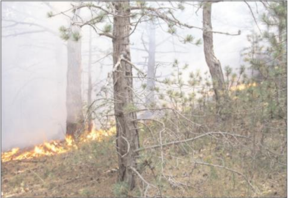
Slika 4. Prizemni požar u sastojini crnog bora na području Paklenice

Prizemni požar (Slika 4.) je najčešći tip požara koji se pojavljuje u svim tipovima šuma, a nastaje u slučaju kada se zapali gornji sloj šumske organske prostirke, podstojno grmlje i pomladak šumskog drveća.