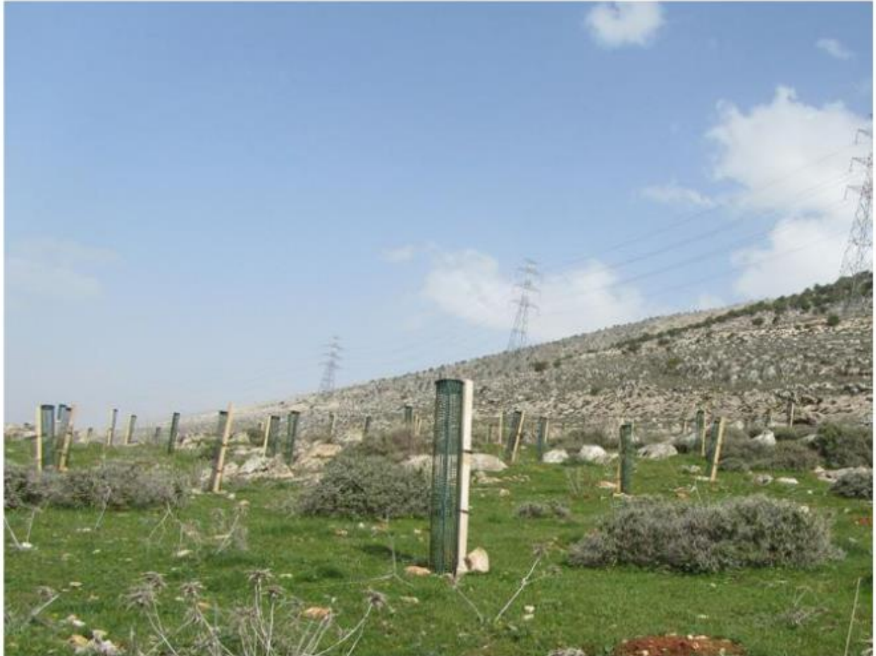
Slika 9. Plastično mrežasto skrovište (Vlahoviček, 2018)

raste pokraj sadnice (Lebanon Deforestation Initiative (LRI) 2014: A guide to reforestation best practices).