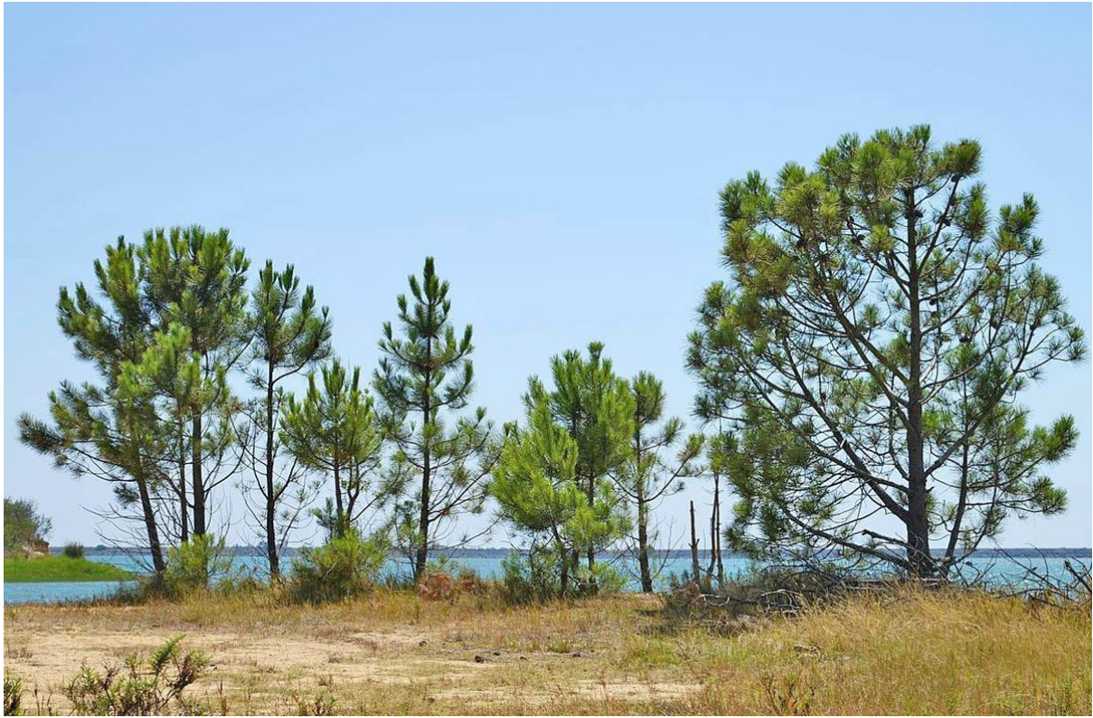
Slika 13. Primorski bor ( Pinus pinaster Mill.) ( https://www.plantea.com.hr/primorski-bor/ )