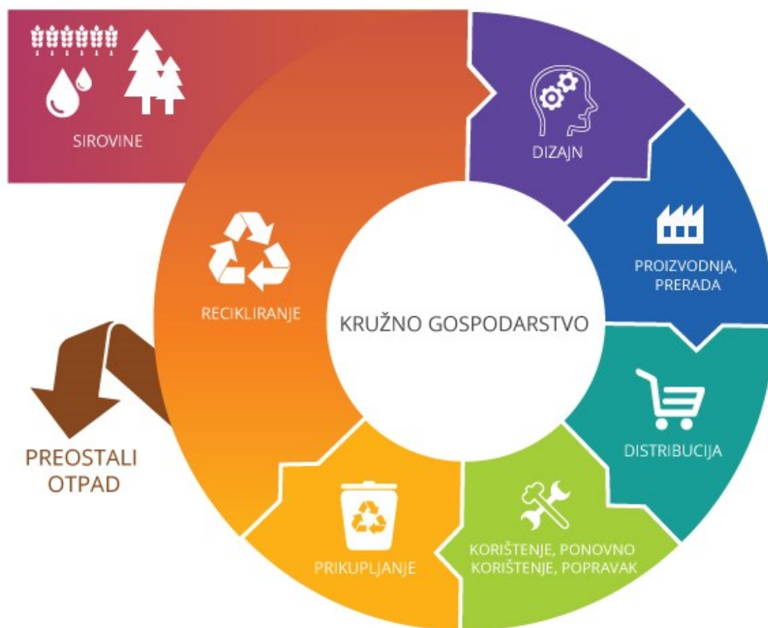
Slika 1. Prikaz cirkularnog gospodarstva (Europski parlament a, 2018).

4. Kupci više nisu potrošači, nego korisnici. To bi značilo da kompanije žele nazad proizvod u poduzeća kad se završi s upotrebom, na kraju njihovog korisnog vijeka što znači i veći poticaj za povrat, iznajmljivanje ili dijeljenje proizvoda (Williams, 2014).