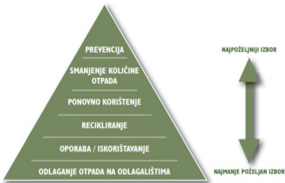
Slika 5. Hijerarhija gospodarenja otpada (Regionalni centar zaštite okoliša, 2009).

Prevenција – odnosi se na mjere koje se poduzimaju prije no što određena tvar, materijal ili proizvod postanu otpad, a koje smanjuju: količinu otpada kroz ponovno korištenje proizvoda ili produženje životnog ciklusa proizvoda, štetan učinak stvorenog, nagomilanog otpada na okoliš i zdravlje ljudi, sadržaj štetnih tvari u materijalima i proizvodima.