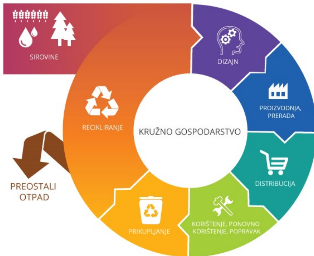
Slika 1. Prikaz cirkularnog gospodarstva (Europski parlament a, 2018).

4. Kupci više nisu potrošači, nego korisnici. To bi značilo da kompanije žele nazad proizvod u poduzeća kad se završi s upotrebom, na kraju njihovog korisnog vijeka što znači i veći poticaj za povrat, iznajmljivanje ili dijeljenje proizvoda (Williams, 2014).