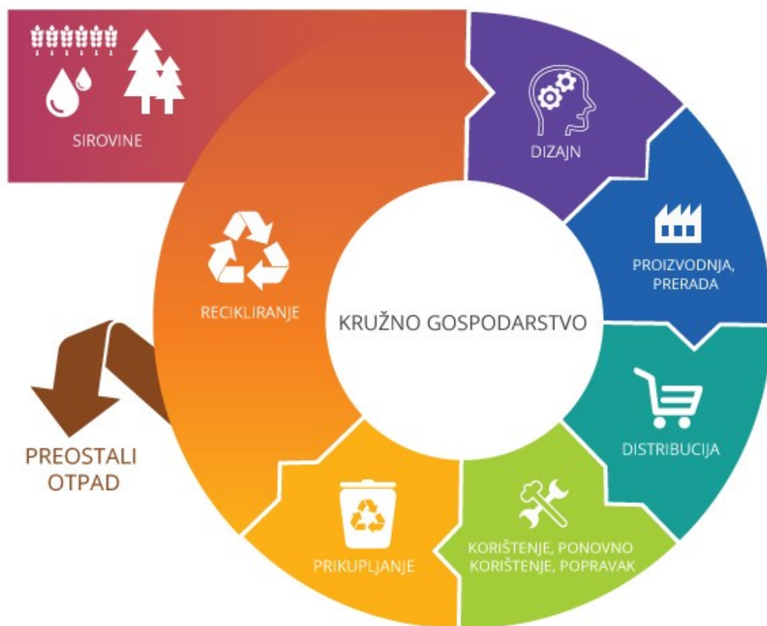
Slika 1. Prikaz cirkularnog gospodarstva (Europski parlament a, 2018).

4. Kupci više nisu potrošači, nego korisnici. To bi značilo da kompanije žele nazad proizvod u poduzeća kad se završi s upotrebom, na kraju njihovog korisnog vijeka što znači i veći poticaj za povrat, iznajmljivanje ili dijeljenje proizvoda (Williams, 2014).