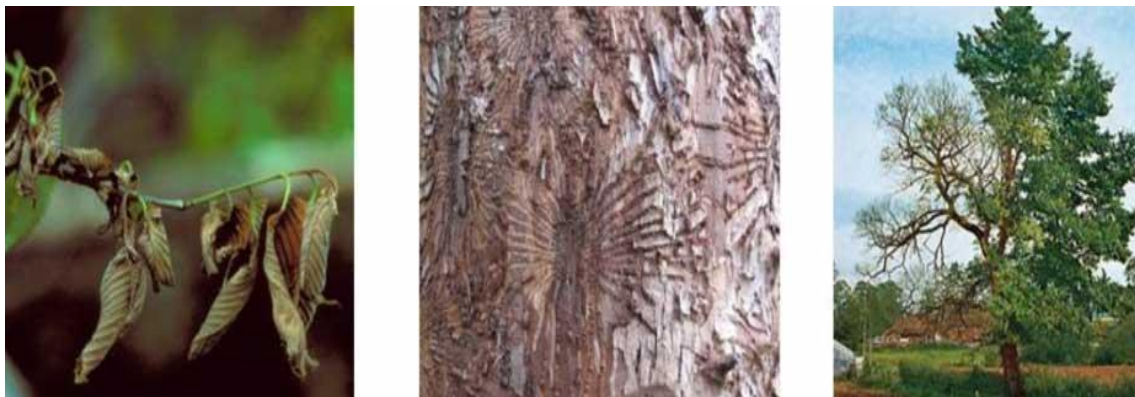
Slika 5. Štetni učinak patogena Ophiostoma novo-ulmi .

O. novo-ulmi 20-22 °C. Vrstu O. ulmi karakterizira glatka, voštana konzistencija micelija, a dnevne zone rasta su slabo vidljive, dok izolati vrste O. novo-ulmu razvijaju zračni micelij te imaju dobro uočljive dnevne zone rasta (Brasier 1981, 1991).