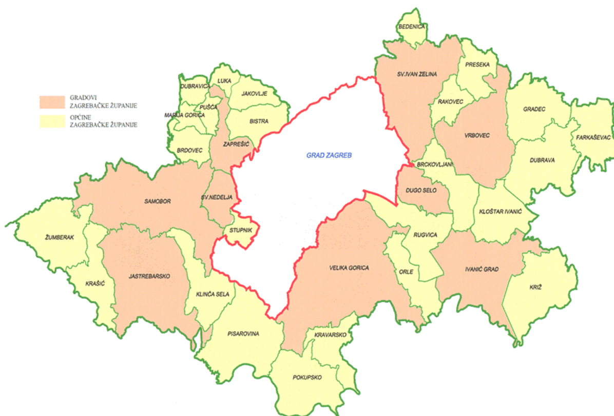
Slika 1. Gradovi i općine Zagrebačke županije

Zagrebačka županija prostire se na površini od oko 3.000 km 2 oko Grada Zagreba na sjeverozapadu Republike Hrvatske čineći „zagrebački prsten“. Obuhvaća prostor između granice sa Slovenijom i Moslavine, te prostor između Zagreba i rijeke Kupe na kojemu živi oko 300.000 stanovnika. U sastavu ove županije je 9 gradova i 25 općina (slika 1.), te 697 naselja.