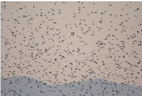
Slike 10. i 11. Ornitološki rezervat Crna mlaka