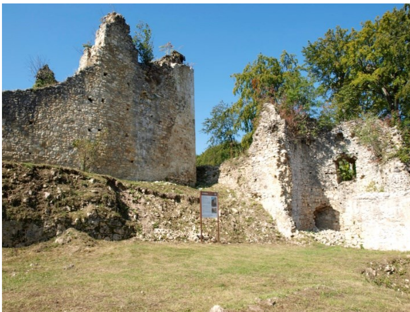
Slika 6. Zelinska glava

Zaštićeno područje Zelinske glave smješteno je na najistočnijim obroncima Medvednice, sjeverozapadno od grada Sveti Ivan Zelina ukupne površine 951,56 ha. Status zaštite značajnog krajobraza ima od 1991. godine prije svega zbog brdskih livada i šuma koje dominiraju krajobrazom. Unutar zaštićenog prostora nalaze se i zidine srednjovjekovnog grada Zelingrada (slika 6.), a put prema njemu obrastao je ljeskovom šumom.