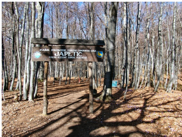
Slika 15. Posebni rezervat šumske vegetacije Japetić

Posebni rezervat šumske zajednice Japetić (slika 15.) ukupne površine 28,20 ha pod zaštitom je od 1975. godine. Stara bukova šuma je osnovna značajka ovog rezervata, ali je značajan i po planinskoj flori gorskih livada.