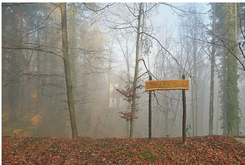
Slika 5. Park šuma Anindol

Područje Tepec-Palačnik-Stražnik status zaštite u kategoriji park šuma dobio je 1970. godine. Ukupna površina zaštićenog područja je 350,15 ha i sastoji se od tri djela. Dio Tepec se još naziva i Anindol, koji je kao kultivirana park šuma iznad Samobora zaštićen 1963. godine ukupne površine 29 ha i predstavlja omiljeno izletišta. Ime je dobio po kapelici Sv. Ane, najmlađoj baroknoj sakralnoj građevini koja se nalazi unutar ovog zaštićenog područja (slika 5.). Dio Palačnik je prirodna bukova zajednica s primjesama unesene crnogorice, dok je treći dio Stražnik obrastao crnim borom ( Pinus nigra Arnold) s primjesama obične smreke ( Picea abies (L.) Karsten), europskog ariša ( Larix decidua Mill.), pitomog kestena ( Castanea sativa Mill.) i hrasta kitnjaka ( Quercus petraea L.). Ova park šuma je prepoznatljiva krajobrazna cjelina grada Samobora.