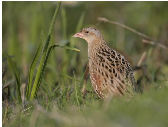
Slika 8. Ptica kosac

luga nastanjuju ptice kao što su orao štekavac ( Haliaeetus albicilla ), crna žuna ( Dryocopus martius ), sova jastrebača ( Strix uralensis ) i dr. i sisavci kao što su šišmiši i alpski voluharić; glacijalni relikv koji, osim Turopolja, na području Hrvatske jedino još obitava u Motovunskoj šumi u Istri. Rijeka Odra je važna za održavanje ovih zaštićenih staništa a ujedno je bogata i ihtiofaunom.