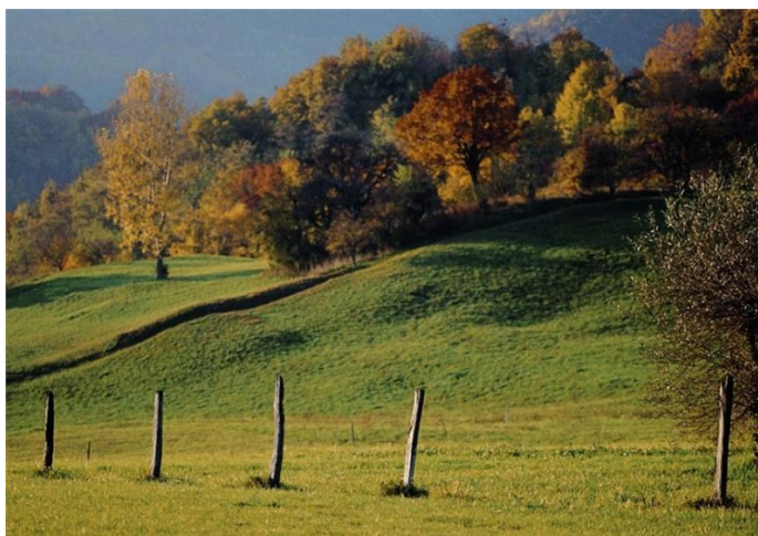
Slika 3. Žumberak-samoborsko gorje

U kategoriji parka prirode područje Žumberka i Samoborskog gorja zaštićeno je 1999. godine. Površina parka koja se nalazi na području Zagrebačke županije iznosi 26.031,33 ha. S gledišta zaštite prirode Žumberačko-Samoborsko gorje vrlo je vrijedan i još uvijek očuvan prostor. Šume i travnjaci su dva glavna ekosustava (slika 3.) koje nastanjuju rijetke i zaštićene vrste biljaka poput: blagajev likovac ( Daphne blagayana Freyer), crveni uskolisni likovac ( Daphne cneorum L.), vazdazeleni likovac ( Daphne laureola L.), kranjski ljiljan ( Lilium carniolicum Bernh.), planinski božur ( Paeonia mascula (L.) Mill.), obična tisa ( Taxus baccata L.), obična božikovina ( Ilex aquifolium L.), endemična samoborska gromotulja ( Alyssum montanum L.) itd. i životinja. Vodno bogatstvo je također odlika ovog prostora, a očituje se kroz brojnost izvora i vodotoka.