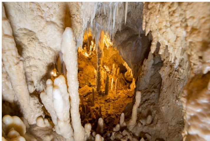
Slika 16. Kalcitni ukrasi u Grgosovoj spilji

Grgosova spilja se nalazi 4 km od Samobora i zaštićena je kao spomenik prirode 1974. godine. Ovaj podzemni objekt je značajan po bogatstvu kalcitnih ukrasa koji su nastali uslijed snižavanja podzemnih voda (slika 16.).