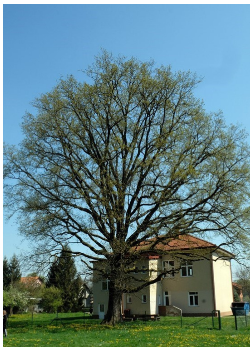
Slika 17. Hrast lužnjak u dvorištu škole u Rakitovcu

U školskom dvorištu područne škole u Rakitovcu nalazi se hrast lužnjak ( Quercus robur L.), prsnog promjera 102 cm i opsega debla 320 cm (slika 17.). Stablo je staro oko 85 godina i visoko oko 20 m. Zaštićeno je 2001. godine u kategoriji spomenika prirode.