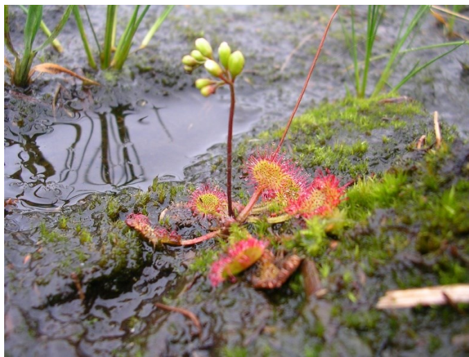
Slika 9. Okrugolisna rosika

Cretne površine s okolnom šumom kod Dubravice ukupne površine 6,00 ha pod zaštitom su od 1996. godine. Cijelo područje pokriveno je niskom vegetacijom i okružene su šikarom johe, a jedno su od posljednjih nalazišta okrugolisne rosike ( Drosera rotundifolia L.) u Republici Hrvatskoj (slika 9.).