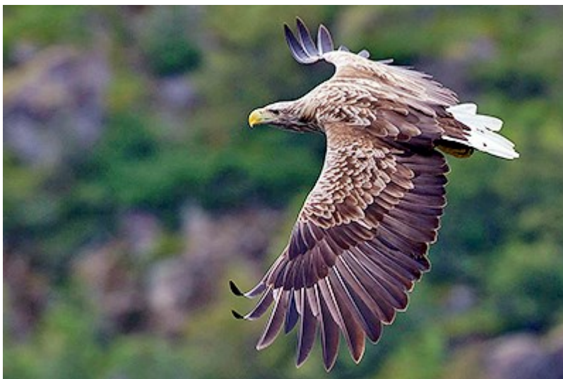
Slika 12. Orao štekavac

Jastrebarski lugovi su 1967. godine proglašeni ornitološkim rezervatom kao obitavalište orla štekavca ( Haliaeetus albicilla ) (slika 12.). Površina mu je 61,18 ha. Područje je u depresiji i podložno dugotrajnom zadržavanju vode što je utjecalo i na šumsku sastojinu hrasta lužnjaka ( Quercus robur L.), običnog jasena ( Fraxinus excelsior L.), poljskog brijesta ( Ulmus minor Mill.), klena ( Javor campestre L.) i dr.