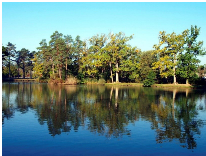
Slika 19. Park Jaska

Od 1517. do 1922. godine dvorac Jastrebarsko bio je u posjedu obitelji Erdody. Zaštićena površina parka oko dvorca iznosi 9,47 ha, a pod zaštitom je od 1961. godine. Oblikovan je u prirodnom stilu i predstavlja nastavam prirodne šume (slika 19.). Pored autohtone vegetacije, u parku su zastupljene i egzotične vrste bilja.