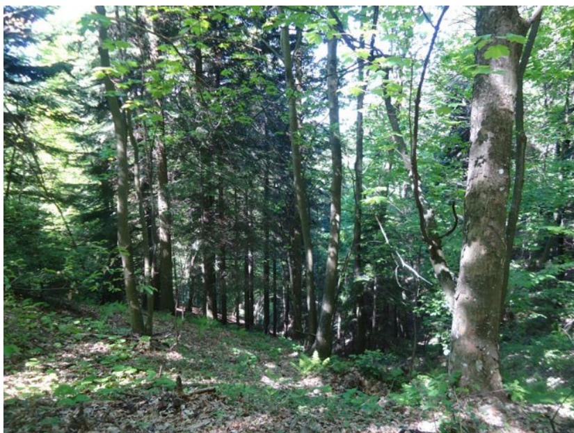
Slika 14. Šumska zajednica bukve i jele

Rezervat Markovčak –Bistra smješten je na sjevernim obroncima Medvednice u slivu potoka Bistra. Ukupna površina ovog rezervata šumske zajednice obične bukve ( Fagus silvatica L.) i obične jele ( Abies alba Mill.) (slika 14.) iznosi 250,24 ha od čega se u Zagrebačkoj županiji nalazi 151,46 ha, odnosno 60,53% zaštićenog područja. Pojedini primjerci jele dosežu visinu i do 40 m i promjera do 150 cm. U istočnom dijelu zaštićenog područja karakteristična je vegetacija s mnogo stabala obične tise ( Taxus baccata L.), s pojedinim primjercima debljine u prsnom promjeru 35 – 45 cm.