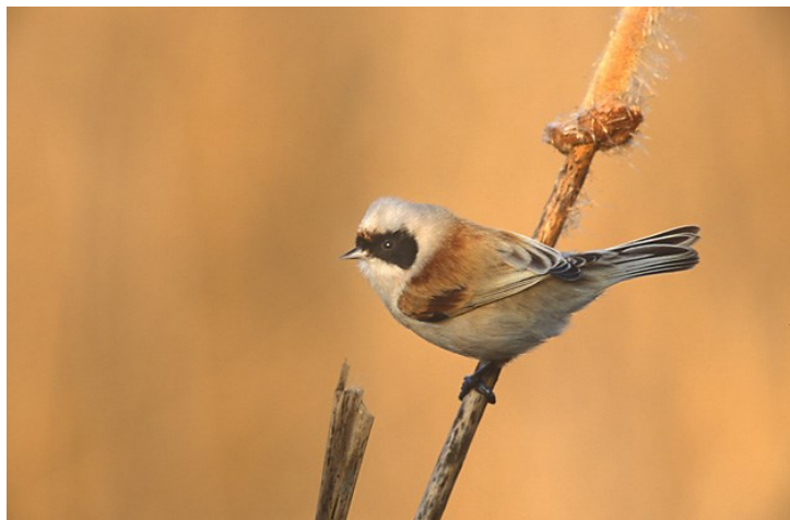
Slika 13. Plazica vuga