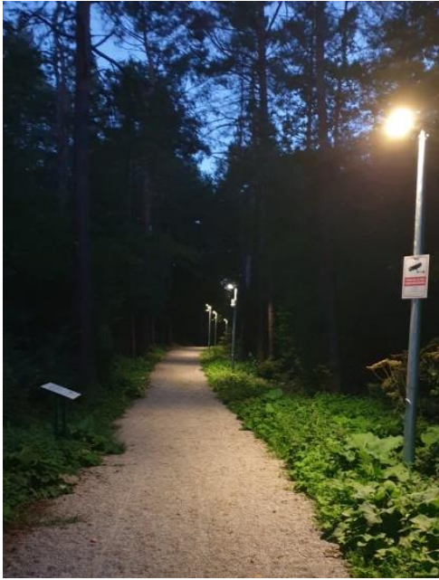
Slika 6. Rasvjeta na glavnim stazama u park-šumi Jasikovac

Zbog neposredne gradske blizine i raznolikosti šumskog fonda, šuma je privlačna ljubiteljima prirode, pa su zbog nepristupačnosti većeg dijela šume u sklopu projekta izgrađene nove staze, a postojeće su uređene. Postavljeni su solarni paneli iz kojih se napaja rasvjeta glavnih staza, sustav evidencije posjetitelja (dva brojača postavljena na glavne ulaze u šumu), sustav za video nadzor i pametne klupe. Uz staze se nalaze informativne ploče čiji je sadržaj napisan Braillovim pismom za lakše snalaženje slijepih i slabovidnih osoba.