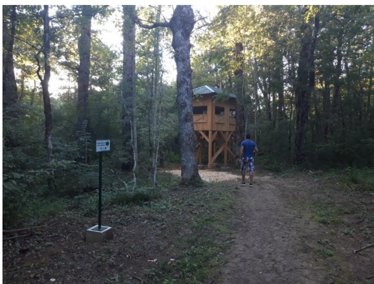
Slika 10. Promatračnica za ptice

U park-šumi Jasikovac su 2014. godine pronađeni ptići šumske šljuke ( Scolopax rusticola ) koja je prema priručniku Crvena knjiga ptica (2013) klasificirana kao strogo zaštićena i kritično ugrožena gnjezdarica Republike Hrvatske, a njezina je brojnost procijenjena na između 10 i 50 parova. Iz toga je razloga u park-šumi Jasikovac podignuta promatračnica za ptice, kao i edukativne ploče.