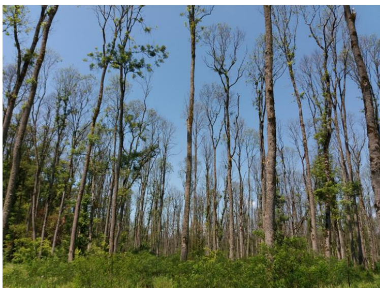
Slika 2. Sastojina poljskog jasena ( Fraxinus angustifolia Vahl) zahvaćena intenzivnim odumiranjem stabala

Da bi šume mogle pružati sve usluge i funkcije, one moraju biti u optimalnom stanju. S obzirom da su šume u novije vrijeme izložene brojim prirodnim i antropogenim nepogodama i pritiscima, šumarskoj struci je potrebna pomoć zajednice kako bi se šume održale u što povoljnijem stanju. Općekorisne funkcije šuma su dobro od šireg društvenog interesa te su sve pravne i fizičke osobe koje u Republici Hrvatskoj obavljaju gospodarsku važnost, dužne plaćati naknadu za korištenje općekorisnih funkcija šuma u iznosu koji je propisan Zakonom o šumama. U Republici Hrvatskoj je naknada za korištenje općekorisnih funkcija propisana Zakonom o šumama iz 1990. godine (NN 52/1990), te je ona do 2010. godine iznosila 0,07% od ukupnog prihoda ili ukupnih primitaka pravnih osoba godišnje. Od 2010. do 2012. godine, naknada je iznosila 0,0525%, a trenutačno iznosi 0,0256%. Iz tih se sredstava financiraju radovi biološke obnove šuma, radovi gospodarenja šumama na kršu, radovi na sanaciji i obnovi sastojina ugroženih sušenjem, izgradnja šumskih prometnica, razminiranje šumskih površina, ostali radovi potrebni za očuvanje i unapređenje općekorisnih funkcija šuma, radovi sjemenarske i rasadničarske djelatnosti u šumarstvu, očuvanje genofonda, podizanje klonskih sjemenskih plantaža i znanstveni radovi iz područja šumarstva. Uvođenje naknade za općekorisne funkcije šuma bio je najveći iskorak u šumarstvu Hrvatske u 20. stoljeću s obzirom na ostvareni prihod od nekoliko milijardi kuna temeljem te naknade.