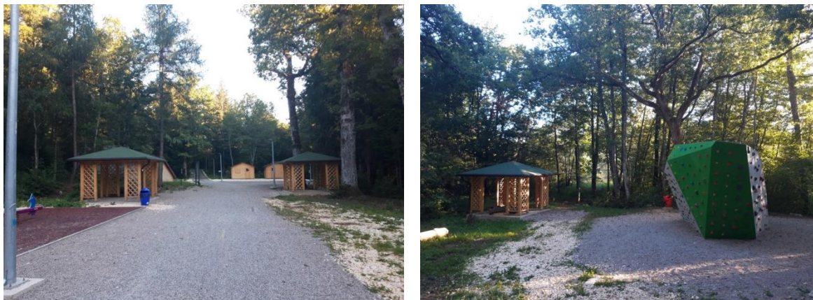
Slika 8 i 9. Središnji dio park-šume s postavljenu infrastrukturuom

Središnji otvoreni prostor osmišljen je kao amfiteatar s pozornicom za održavanje raznih manifestacija. Krase ga dječje igralište, fitness vježbalište, umjetna stijena za penjanje, nekoliko drvenih sjenica i promatralište za ptice.