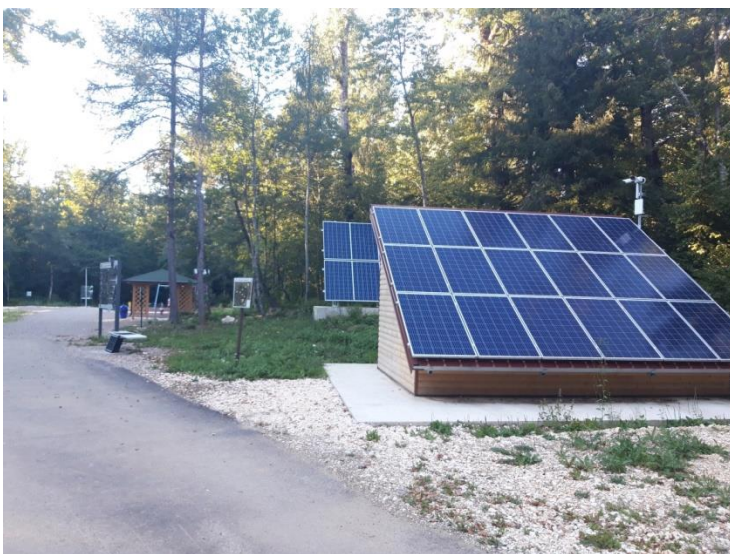
Slika 7. Solarni paneli u park-šumi Jasikovac