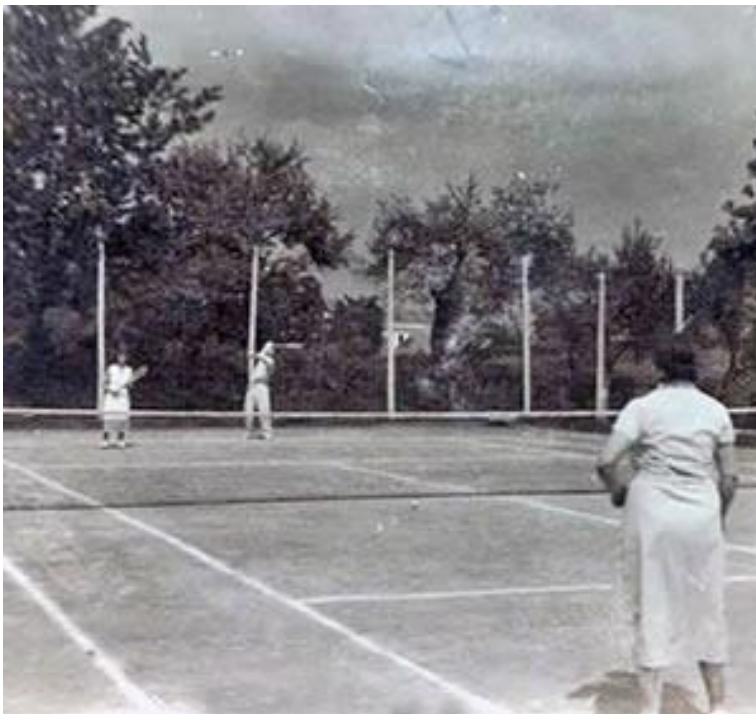
Slika 4. Tenisko igralište u park-šumi Jasikovac ( www.visitgospic.com/sport/48-tenis )

Šuma je od urbanog dijela grada udaljena manje od jednog kilometra. Povijest Jasikovca počinje 1743. godine kada je austrijski general Prve ličke regimente Jasyk pokrenuo uređenje prostora i sadnju žira hrasta lužnjaka ( Quercus robur ) na oko 30 hektara današnje šume. Tada su ostatak današnje šume činile podvodne livade, takozvane „Jasikovačke bare“ na koje su 1790. godine zasađeni hrast lužnjak ( Quercus robur ), hrast kitnjak ( Quercus petraea ), bijeli bor ( Pinus sylvestris ), crni bor ( Pinus nigra ) i ariš ( Larix decidua ). Sljedećih gotovo dvjesto godina Jasikovac je služio građanima za šetnju i rekreaciju što dokazuje i prvo tenisko igralište izgrađeno 1900.g. koje je bilo popularno u cijeloj regiji. Postojale su uređene šetnice, klupe i zgrada za ples. Osim rekreacijske namjene, do 20. stoljeća Jasikovac se koristio i kao prostor za izvođenje vojnih vježbi.