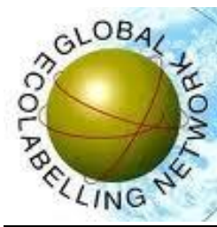
Slika 2. Logo globalne mreže ekološkog označavanja

Organizacija slična ISEAL-u jest GEN (engl. Global Ecologabelling Network ), osnovana 1994. kao neprofitna udruga sa sjedištem u Ottawi, Kanada. Premda je njezina primarna zadaća promicanje sektora eko-oznaka, ono što ju razlikuje od ISEAL-a (koji se orijentirao na procese certifikacije) jest posvećenost ujednačavanju samih standarda pružanja eko-oznaka, pa su preko svojih članica participativnim putem razvili temeljne generičke standarde za pojedine grupe proizvoda. Organizacija trenutno broji 34 članica koje predstavljaju oko 60 država diljem svijeta (GEN). Hrvatska je kao članica EU također dio GEN organizacije unutar Ministarstva gospodarstva i održivog razvoja RH (MZOE). Većina inicijativa za nacionalne eko-oznake su članice GEN-a.