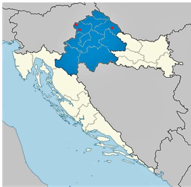
Slika 6. Karta Hrvatske sa obilježenim područjima provedenog istraživanja

Za potrebu izrade ovog diplomskog rada, autorica je provela dva radna dana na terenu sa ovlaštenom kontrolorkom iz poduzeća HŠ d. o. o. Zagreb. Terenski izvid obuhvatio je pet OPG-a koja se bave poljoprivrednom proizvodnjom, što spada prema Pravilniku u A kategoriju- Proizvođači, potkategorija - biljna proizvodnja. Pregledani OPG-ovi imaju sklopljen ugovor na neodređeno, temeljem članka 18. Pravilnika o kontrolnom sustavu ekološke poljoprivrede, sa ovlaštenim kontrolnim tijelom HŠ d.o.o. Zagreb. Terensko istraživanje provedeno je na područjima: Desinić, Tuhelj i Đurđevac (Slika 6).