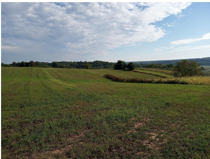
Slika 8. Prikaz prirodne drvenaste grmolike zaštitne barijere

Usljed reljefnih promjena parcele se mogu nalaziti na različitim visinama (slika 9). Zbog korištenja kemijskih sredstava na konvencionalnim poljima poželjnije je da se parcele pod ekološkim uzgojem nalazi na povišenijem dijelu zbog ispiranja tla vodom.