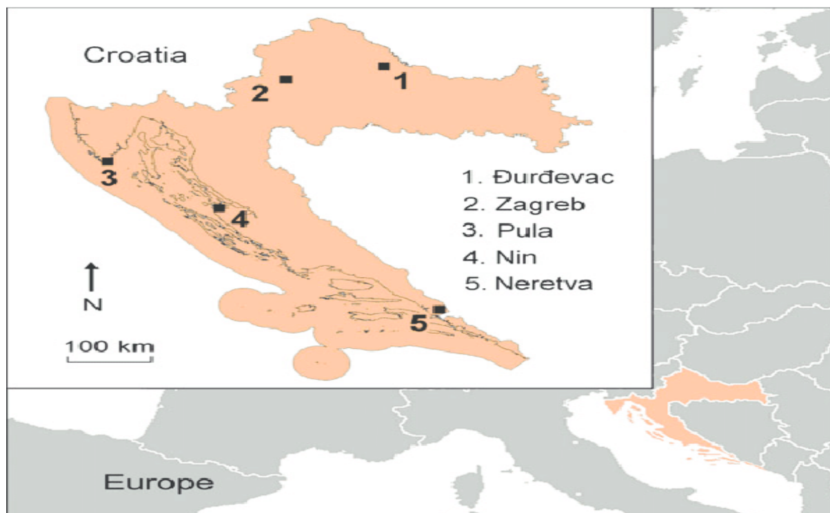
Slika 3. Rasprostranjenost nizinskog brijesta u Hrvatskoj.