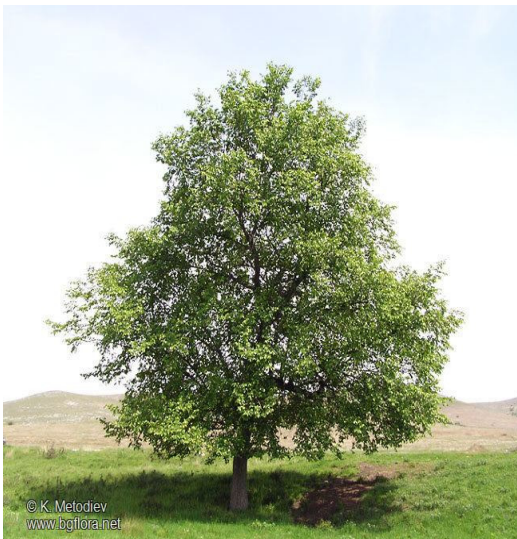
Slika 1. Izgled krošnje.

Nizinski ili obični poljski brijest ( Ulmus minor Mill.) je listopadno stablo koje pripada porodici brijestova (Ulmaceae). Uspravnog je rasta i naraste do 30 metara visine tvoreći široku i gustu krošnju (slika 1). Deblo je promjera do 2 metra, kora je debela i crvenkastosmeđa koja je u početku glatka, a kasnije postane duboko izbrazdana. Korijenski sustav je jak i dobro razvijen. Pupoljci su tamnosmeđi i prekriveni ljuskama dugim oko 3 mm. Listovi su ovalni ili eliptični, asimetrične osnove, dugi 5-10 cm, široki 4-5 cm, izraženih žila, ušiljenih vrhova, dvostruko pilasto nazubljeni, na licu tamnozeleni, sjajni i goli, naličje im je svjetlije i malo dlakavo, nalaze se na peteljka dugim 6-12 mm i dvoredno su raspoređeni (slika 2). Cvjetovi su dvospolni, sjedeći, skupljeni po 15-20 u čuperke na prošlogodišnjim izbojima. Jedan je tučak, a prašnika ima pet. Cvatu prije listanja u ožujku i travnju. Plod je svijetlosmeđi oraščić, velik do 2,5 cm te visi na kratkoj stapci. Dozrijeva u svibnju i lipnju (Šilić, 1990).