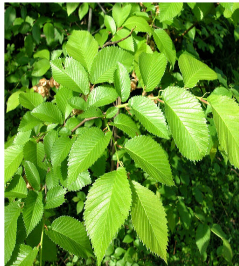
Slika 2. Izgled lista.