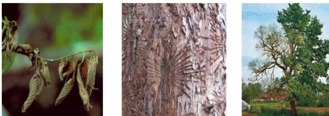
Slika 5. Štetni učinak patogena Ophiostoma novo-ulmi .

O. novo-ulmi 20-22 °C. Vrstu O. ulmi karakterizira glatka, voštana konzistencija micelija, a dnevne zone rasta su slabo vidljive, dok izolati vrste O. novo-ulmi razvijaju zračni micelij te imaju dobro uočljive dnevne zone rasta (Brasier 1981, 1991). Slika 5 prikazuje štetne učinke O. novo-ulmi na nizinski brijest. Promjene se očituju na kori i na cijeloj krošnji.