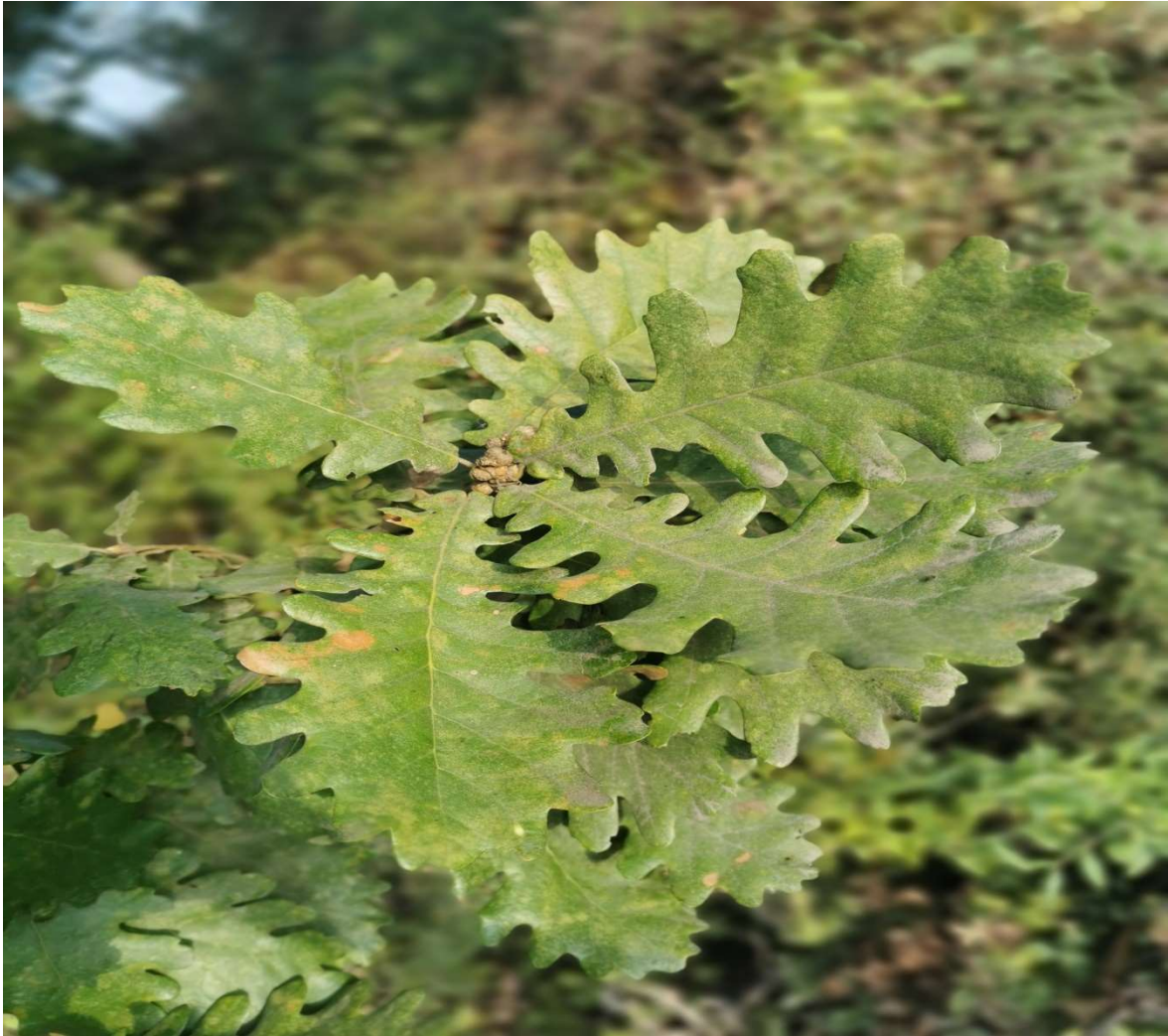
Slika 1. List hrasta sladuna.