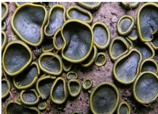
Slika 3: Catinella olivacea