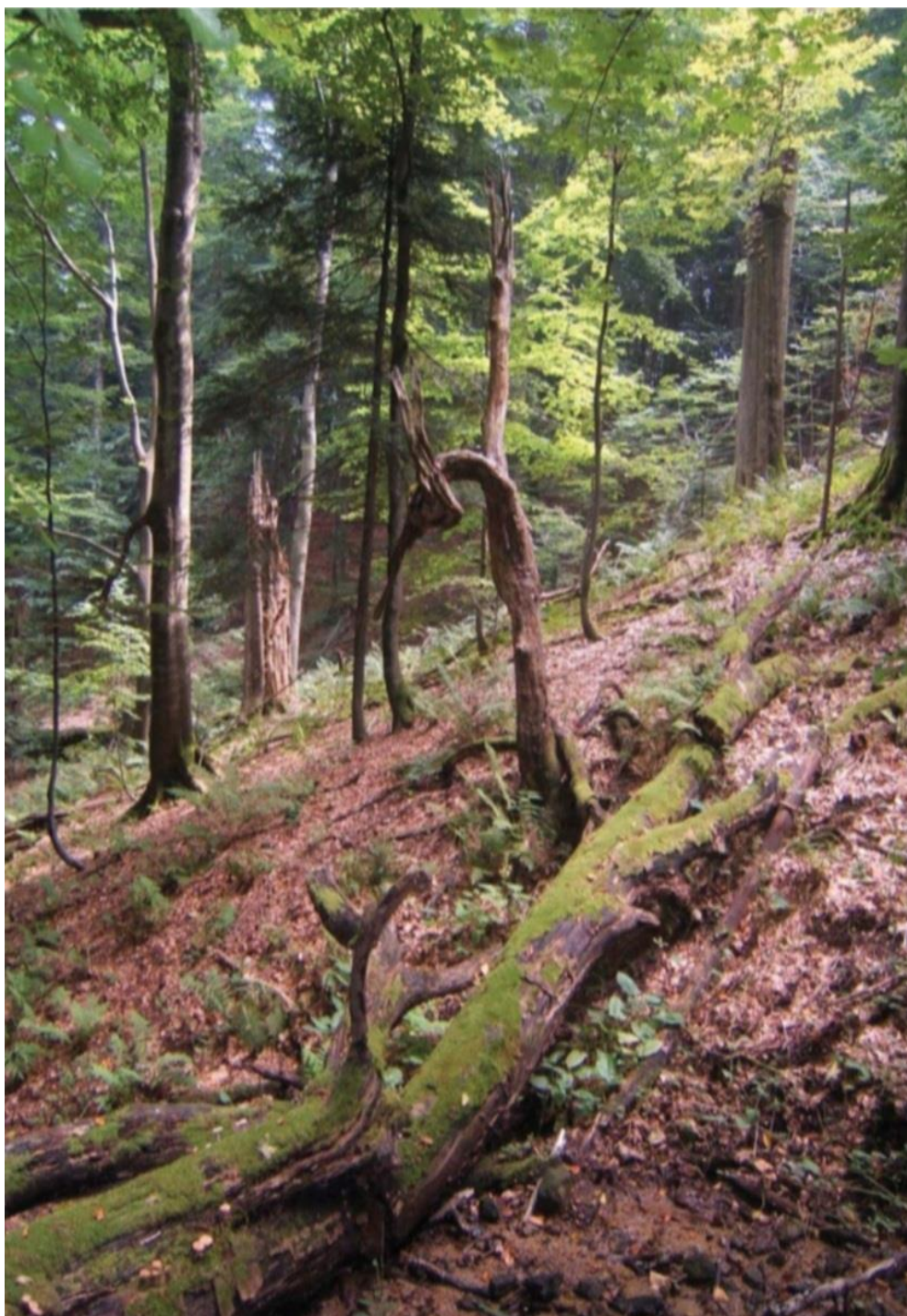
Slika 5: Posebni rezervat šumske vegetacije „Sekulinačke planine“