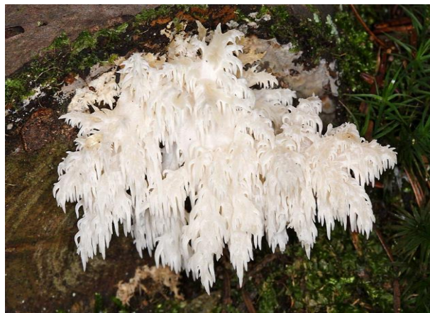
Slika 8: gljiva koraljasti igličar ( Hericium coralloides )