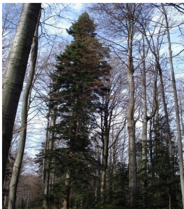
Slika 4: suživot bukve i jele u Posebnom rezervatu