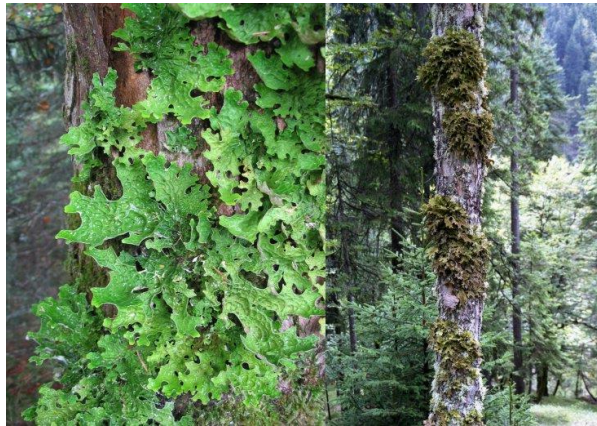
Slika 7: lišaj Lobaria pulmonaria (foto: Odjel za uređivanje šuma, UŠP Našice)

rezervata. Navedene aktivnosti dozvoljene su u granicama koje ne ugrožavaju opstanak vrste te uz dozvolu nadležnog tijela državne uprave. Uz prethodno spomenutu gljivu Catinella olivacea unutar Posebnog rezervata pronalazimo i koraljastog igličara ( Hericium coralloides ), to su gljive koje se pojavljuju u šumama sa velikom količinom odumrlog drva. Utvrđena je i pojava ugrožene i rijetke vrste lišaja ( Lobaria pulmonaria ) koji pridolazi u šumama prašumskog tipa na sjevernoj polutci, a u mnogim europskim šumama je nestao.