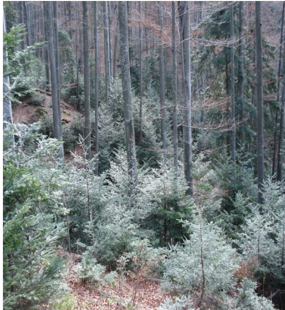
Slika 1: mlada jelova stabla

zaštićeno je područje od 1966. godine, a proglašava ga Skupština općine Podravska Slatina na prijedlog Republičkog zavoda za zaštitu prirode Zagreb te obuhvaća lokalitet površine 11 ha. Nakon proglašenja Parka prirode Papuk nadležnost upravljanja Posebnim rezervatom (odjel 34a) preuzima JU Park prirode Papuk.