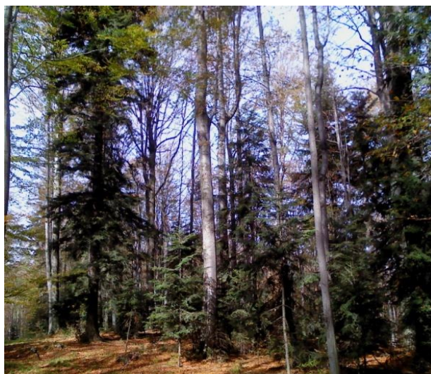
Slika 5: Mješovita sastojina

Obzirom na to da unutar područja Posebnog rezervata nisu dopuštene nikakve gospodarske aktivnosti (pridobivanje drva) koje bi mogle narušiti prirodnu strukturu, u tom se području provode samo one djelatnosti koje služe u svrhu poboljšanja ili održavanja postojećih uvjeta važnih za očuvanje posebnosti zbog kojih je Posebni rezervat proglašen.