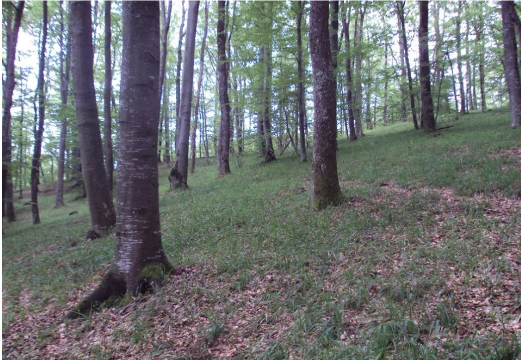
Slika 4 Bukova šuma sa dugolisnom naglavicom.