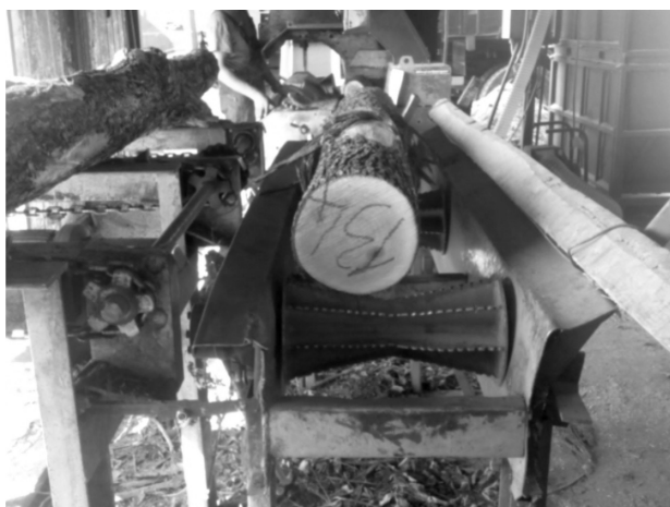
Slika 2. Položaj digitalne kamere prilikom snimanja Fig 2 Position of the digital camera when recording

kivanoga obujma proizvoda. Efektivno je vrijeme prikazano pripadajućom regresijskom jednadžbom radnoga zahvata i prosječnim utroškom vremena po komadu radnoga zahvata za koji nije utvrđena ovisnost o dimenzijama obloga energijskoga drva. Očekivani obujam proizvoda izračunat je na temelju dimenzija obloga energijskoga drva zanemarujući otpad (duljine su zaokružene na četvrtinu metra sukladno duljinama komada kratko rezanoga i cijepanoga drva).