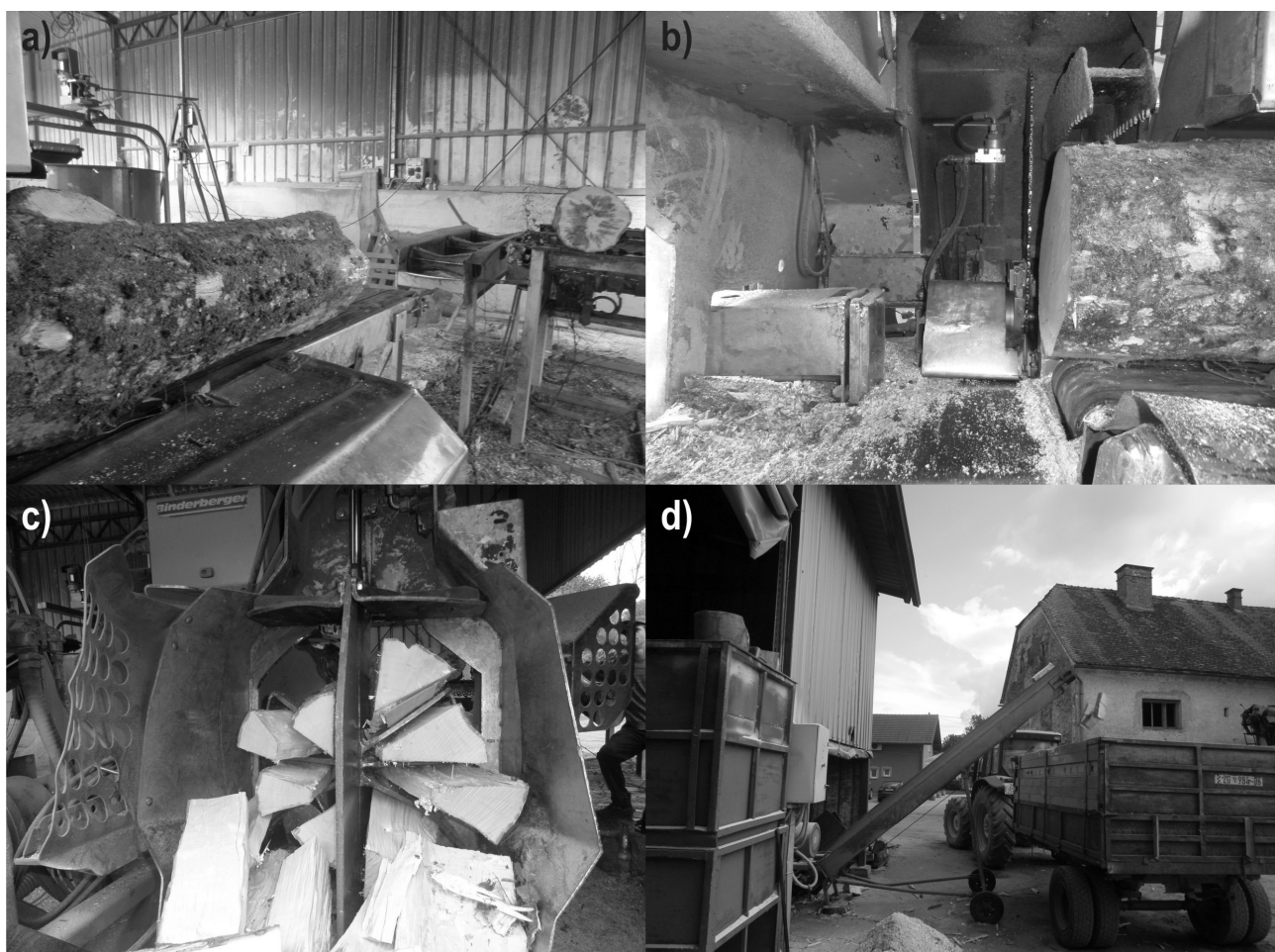
Slika 1. Radni zahvati pri izradi kratko rezanoga i cijepanoga ogrjevnoga drva: a) transport obloga energijskoga drva do mjesta prerezivanja; b) prerezivanje; c) cijepanje; d) transport kratko rezanoga i cijepanoga ogrjevnoga drva

Fig 1 Work elements in chopped firewood production: a) transport of round fuelwood to the place of cross-cutting; b) cross-cutting; c) splitting; d) transport of chopped firewood