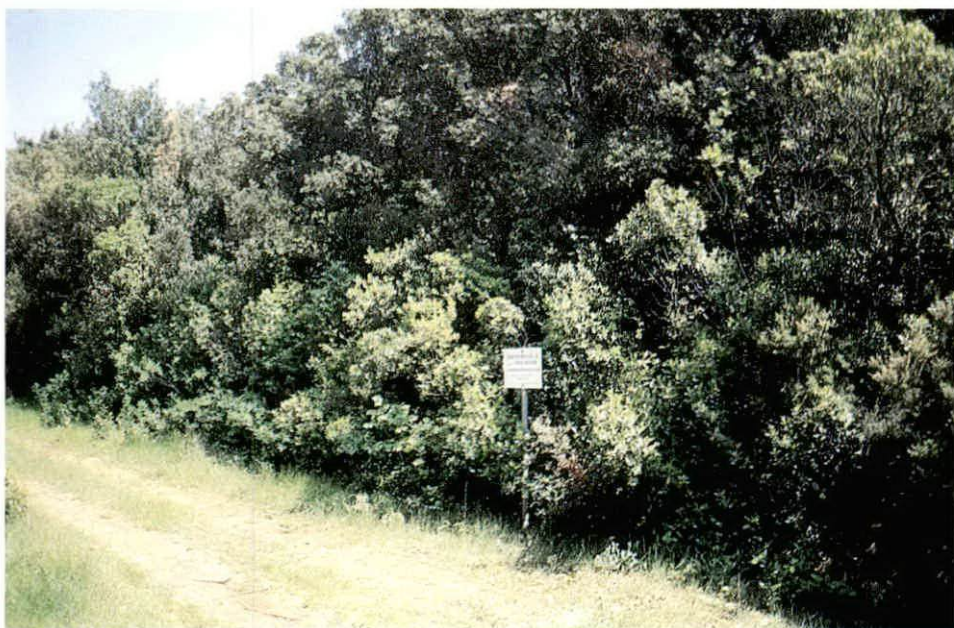
Sl. – Fig. 2. Trajna pokusna ploha br. 36 na NPŠO Rab na otoku Rabu – A continual experimental plot Nr. 36, the Island of Rab