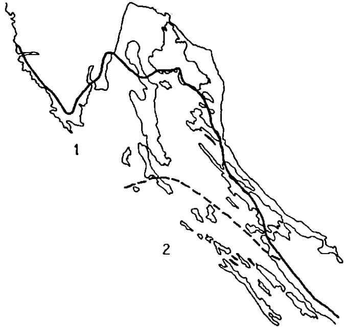
Fig 2. PLANT/GEOGRAPHIC SITUATION OF THE ISLAND OF RAB

1. sjeverno i 2. srednje područje vazdazelene eumediteranske zone istočno- jadranskog primorja