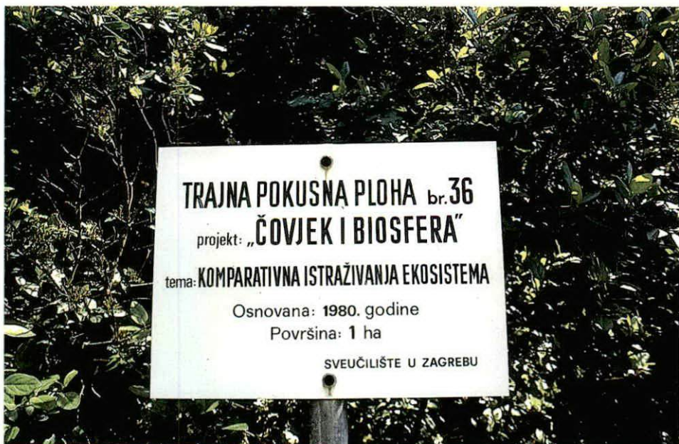
Sl. – Fig. 1. Trajna pokusna ploha br. 36 na NPŠO Rab na otoku Rabu – A continual experimental plot Nr. 36, the Island of Rab