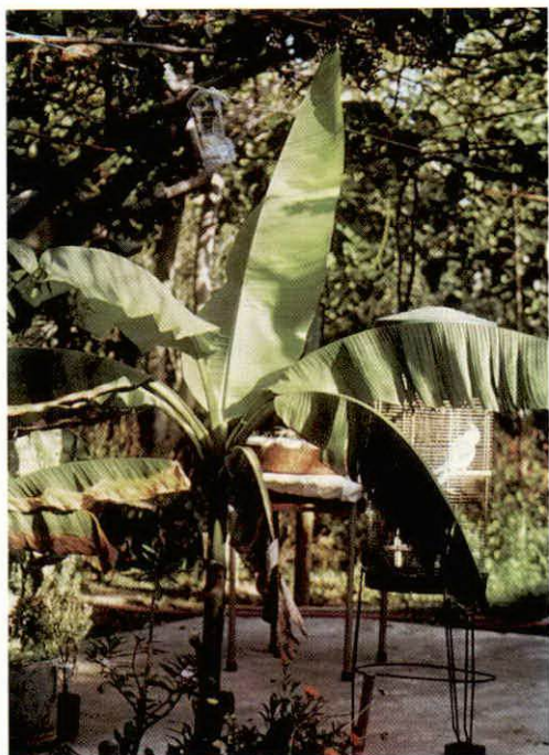
Sl.—Fig. 4. Musa x Paradisiaca — banana — Musa x Paradisiaca