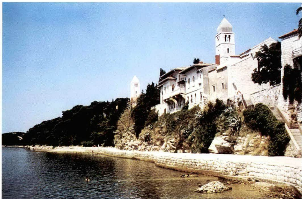
Sl.—Fig. 1. Park-šuma »Komrčar« — zeleni dragulj oko grada Raba — Park forest Komrčar — the green jewel around the city of Rab