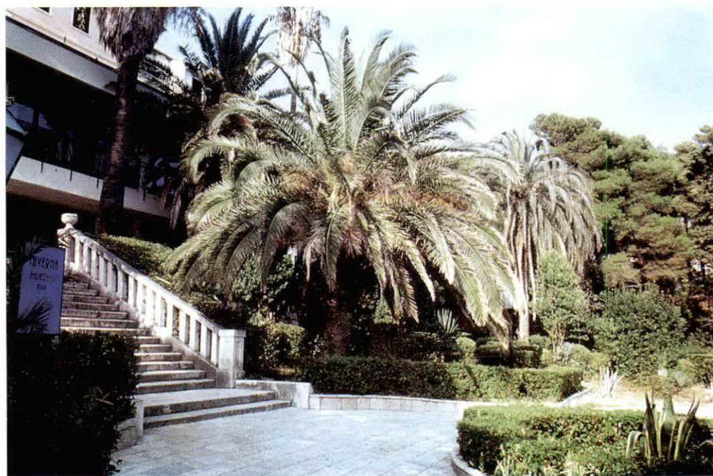
Sl.—Fig. 6. Pejzažno oblikovno rješenje ispred hotela »Imperial« — Horticultural design of one part of the hotel Imperial park