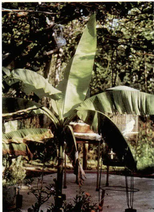
Sl.—Fig. 4. Musa x Paradisiaca — banana — Musa x Paradisiaca