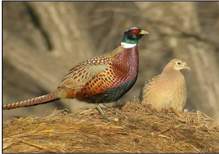
Slika 8. Mužjak i ženka fazana

opasnosti od vode posljedica nasljednih svojstava, jer u njegovoj pradomovini prevladavaju pretežito stepska područja (**2015; Janjenčić, 2004; Darabuš.; 2004).