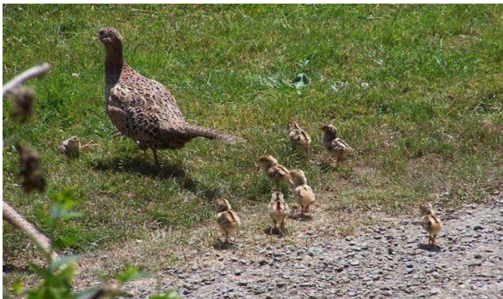
Slika 11. Koka i pilići