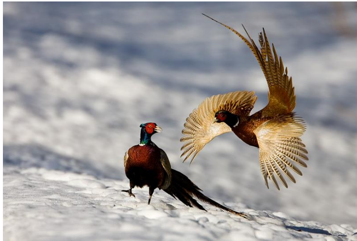
Slika 7. Preživljivanje fazana na snijegu

fazansku populaciju. Nadalje, fazanu šteti vjetar, snijeg, mraz, tuča i led. Fazan je divljač koja voli svjetlost pa zbog toga najčešće nastanjuje lovišta s 15.000 sunčanih sati godišnje (Darabuš, 2004).