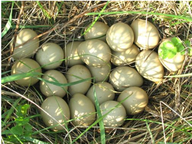
Slika 10. Gnijezdo fazana u staroj travi

Razlika je u nagonu za parenje kod mužjaka i ženki. Kod mužjaka taj nagon traje šezdeset dana, dok kod ženki traje kraće, odnosno dvadeset dana. Fazanke svoje partnere izabiru prema njegovom izgledu, a ne prema teritoriju za gniježđenje. Ženke iz istog jata najčešće izabiru istog pijevca koji je najiskusniji u njihovoj obrani od vanjskih neprijatelja. Ženka sama izabire prostor za gniježđenje koji je uvjetovan vegetacijom koju zateknemo u proljeće. Prostor za gniježđenje je najčešće livada, polje ili obrasli šumarak. Često se gnijezde u poljskim živicama ili staroj travi (Slika 10).