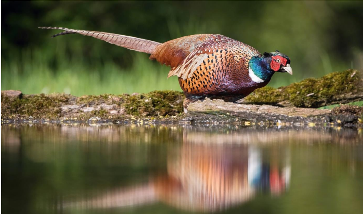
Slika 13. Napajanje fazana

kad sunce zalazi. U noćnim satima, fazan se smjesti na grane drveća gdje spava do izlaženja sunca. Oko podneva se fazani odmaraju i onda ne traže hranu (Darabuš, 2004; Beuković i Popović, 2014; Lovrić, 2004).