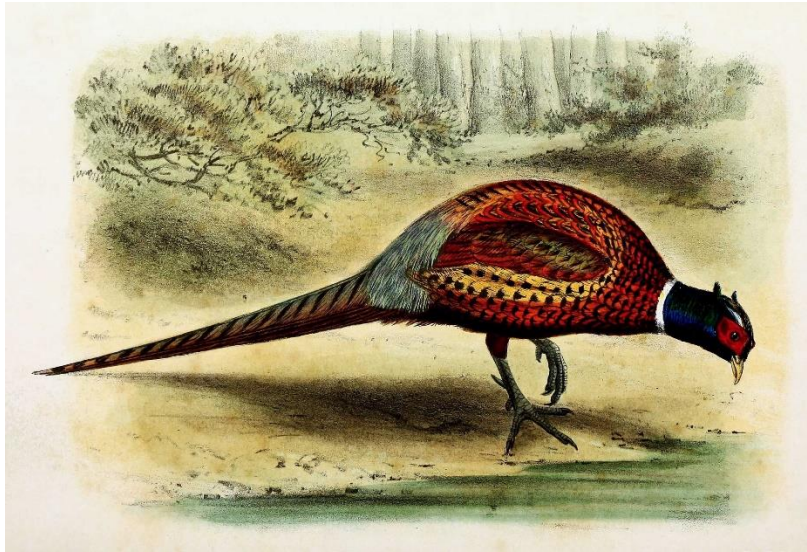
Slika 2. Kineski fazan ( Phasianus colchicus torquatus )

prugama. Prsa su žutozelene boje dok su letna pera žutozelena s brojnim crnim točkicama (Slika 2).