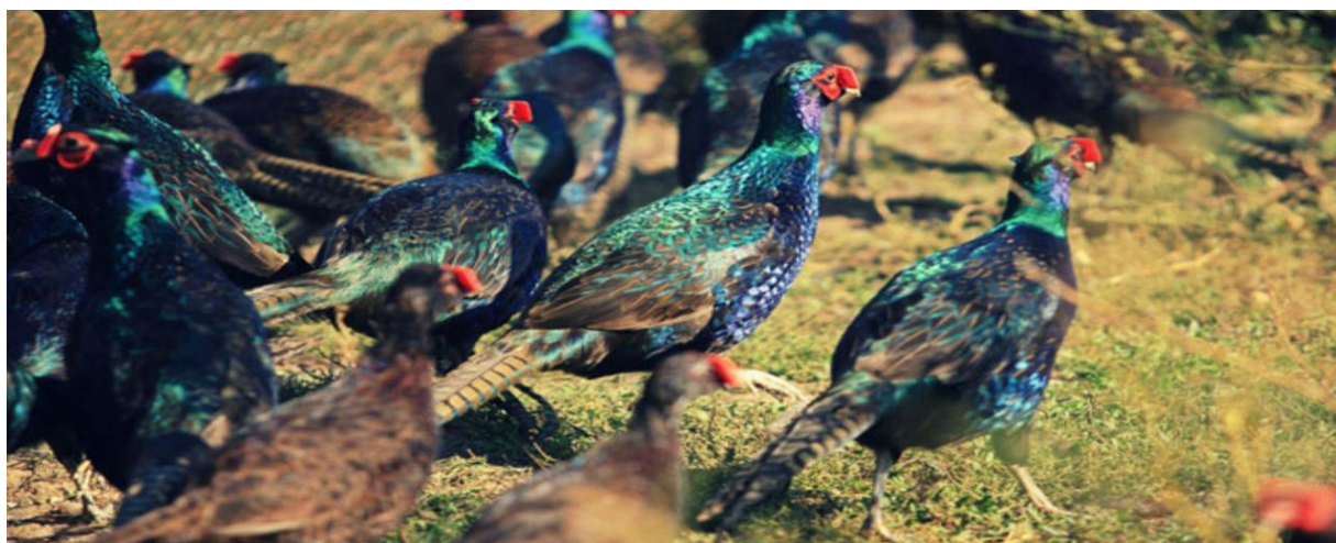
Slika 14. Jato fazana

U proljeće prilikom parenja dolazi do značajne promijene društvenog života jer se od jata najprije odvoje mužjaci koji biraju svoj prostor i brane ga. Ne podnose prisustvo drugih mužjaka na svoj teritoriju što često dovede do borbi između muških jedinki. Mužjak svojim glasanjem okupi do osam ženki i za njih se brine tokom parenja. Fazan nije vezan za svoje područje gdje živi. Često zna skitati i po deset kilometara kada je u potrazi za boljim uvjetima (Janjenčić, 2004 ; Darabuš, 2004).