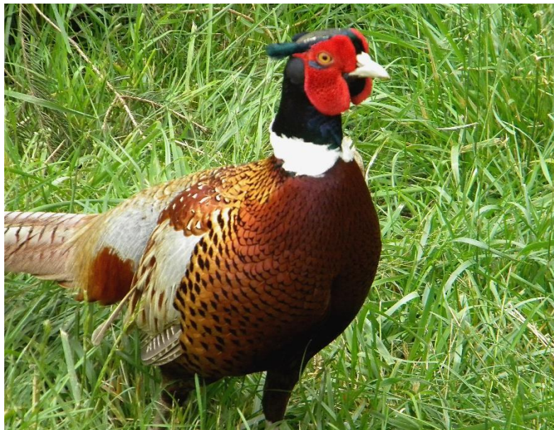
Slika 3. Mongolski fazan ( Phasianus colchicus mongolicus )

Mongolski fazan ( Phasianus colchicus mongolicus ) je u Europu uvežen početkom 20. stoljeća. Mužjak na vratu ima široki bijeli ovratnik sačinjen od dva polumjeseca koji se na prednjem i stražnjem dijelu vrata spajaju. Od svih fazana uzgojenih za lov, ova podvrsta se odlikuje najvećom masom. Glava je tamne boje s ljubičastim sjajem, boja tijela je boja mahagonija, a rep je crvenkastocrn. Pera koja služe za let su srebrnosiva. Ženka je svjetlije boje od prethodne dvije podvrste (Slika 3).