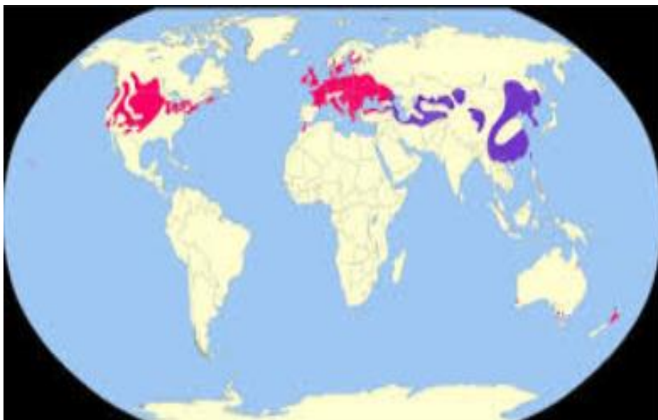
Slika 6. Geografska rasprostranjenost fazana u svijetu