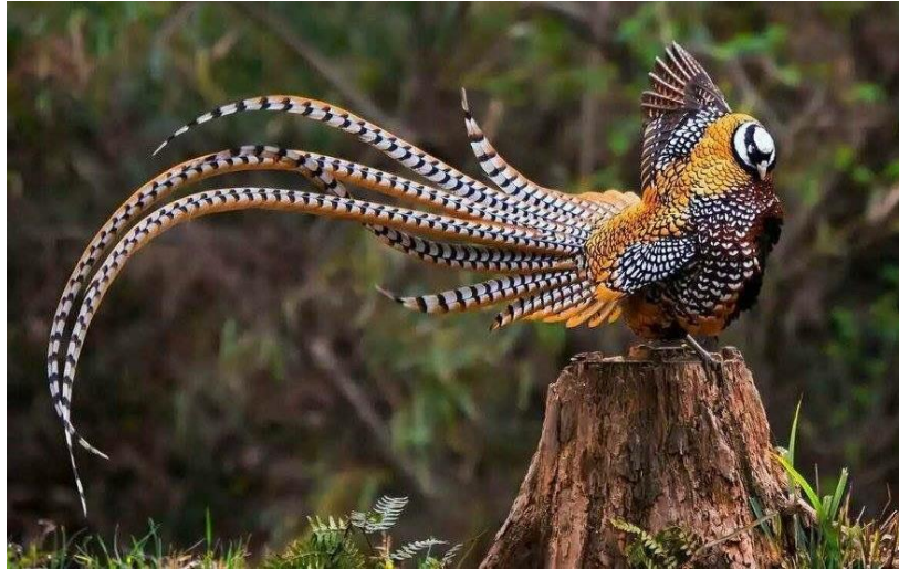
Slika 4. Kraljevski fazan ( Syramaticus reevesii )

Kraljevski fazan ( Syramaticus reevesii ) također je porijeklom iz Azije. Boja mužjaka je zlatnožuta, a krila su mu crnobijele boje. Tjeme glave mu je bijelosive boje. Oko cijele glave nalazi se tamna pruga koja ga karakterizira. Još jedna od karakteristika je i jako dugačak rep koji doseže do 200 centimetara dužine. Na repu se nalaze poprečne pruge (Slika 4).