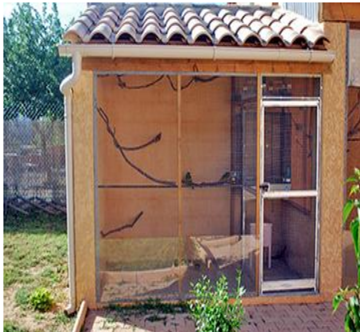
Slika 17. Volijera za ptice

Kombinirani uzgoj koristi se u krajevima gdje se u vrijeme intenzivnog gniježđenja koka jaja skupljaju i stavljaju pod kvočke koje kvocaju. Osnovna uloga kombiniranog uzgoja je podizanje broja fazana na perifernim mjestima lovišta (Janjenčić, 2004).