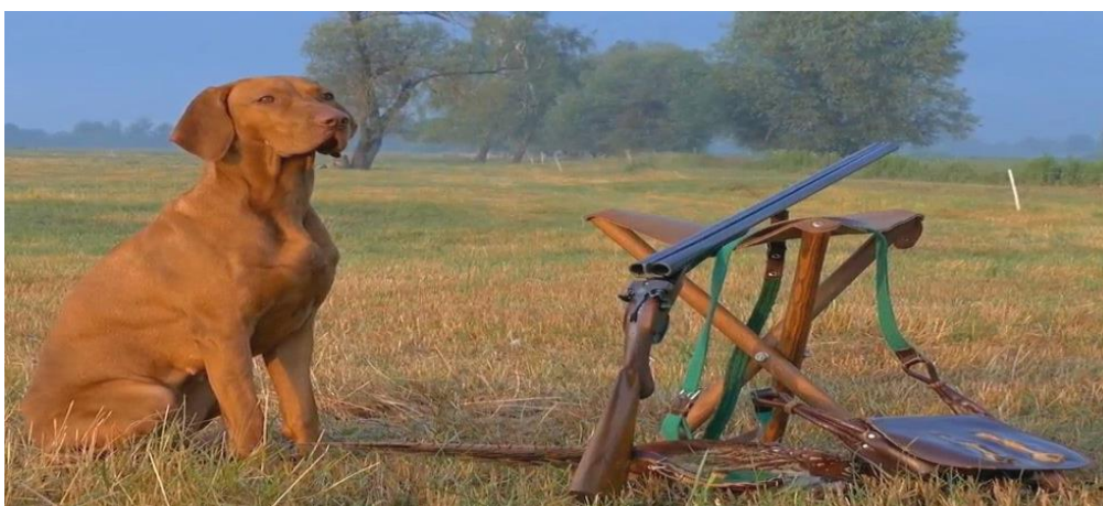
Slika 18. Lovački pas i oprema za lov

Pravilnikom o lovostaju (Pravilnik, 2010) razdoblje kad se ne smiju loviti je od 1. veljače do 15. rujna. Temeljem Pravilnika o načinu upotrebe lovačkog oružja i naboja (Pravilnik, 2006) fazana je dozvoljeno odstreljivati krupnoćom sačme od 3,0 – 3.5 uz maksimalnu udaljenost strijeljanja 40 m.