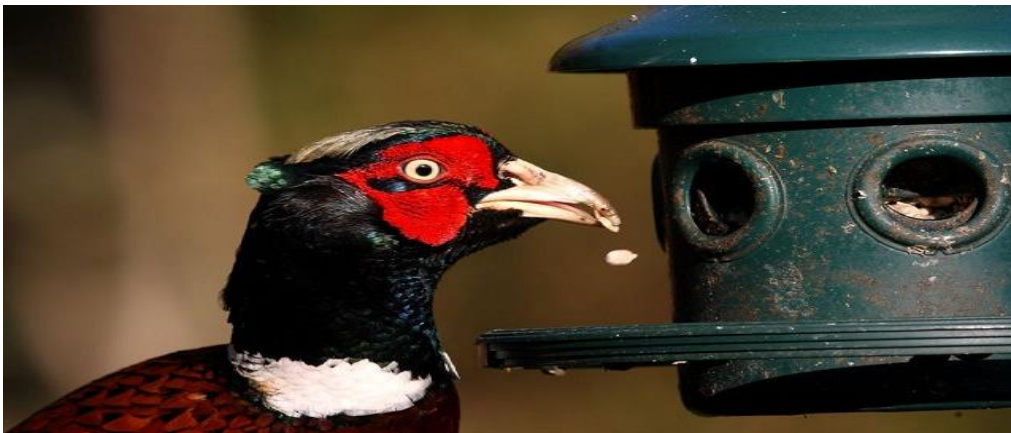
Slika 12. Hranjenje fazana na hranilici

Odrasli fazan do hrane dolazi čeprkanjem kljunom ili nogama do dubine od 6 cm. Prilikom tog čeprkanja često čini štete jer razgrče korijenje bilja i sjemena koje sija. Kod odraslih jedinki fazana prevladava hrana biljnog podrijetla dok u prehrani kod pilića u prvim tjednima života prevladava prehrana životinjske hrane. Najmanje hrane životinjskog podrijetla fazan konzumira tijekom zimskog razdoblja, jer mu snijeg često onemogućava hranjenje uslijed ledene pokorice. Zbog toga je u zimskom periodu neophodno prihranjivanje fazanske divljači kao što je prikazano na Slici 12 (Darabuš, 2004).