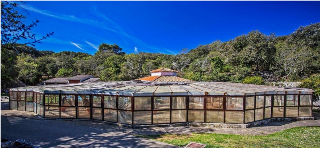
Slika 16. Fazanerija u N.P. Brijuni

ispusti u lovište, obavezno ih cijepimo protiv kuge i kolere. U ovoj fazi hrane se sa smjesama koje sadrže 18-20% sirovih proteina. (Beuković i Popović, 2014).