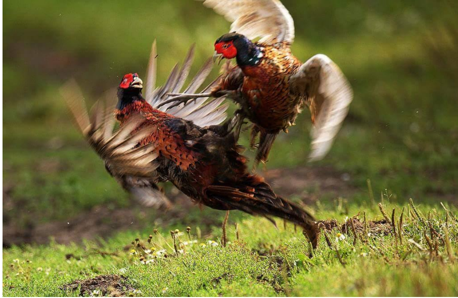
Slika 9. Borba fazana u vrijeme parenja

Razlika je u nagonu za parenje kod mužjaka i ženki. Kod mužjaka taj nagon traje šezdeset dana, dok kod ženki traje kraće, odnosno dvadeset dana. Fazanke svoje partnere izabiru prema njegovom izgledu, a ne prema teritoriju za gniježđenje. Ženke iz istog jata najčešće izabiru istog pijevca koji je najiskusniji u njihovoj obrani od vanjskih neprijatelja. Ženka sama izabire prostor za gniježđenje koji je uvjetovan vegetacijom koju zateknemo u proljeće. Prostor za gniježđenje je najčešće livada, polje ili obrasli šumarak. Često se gnijezde u poljskim živicama ili staroj travi (Slika 10).