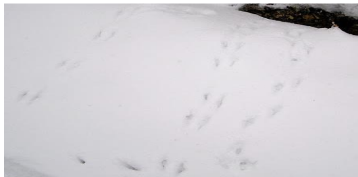
Slika 15. Tragovi fazana u snijegu

Fazan preferira hodanje, u odnosu na let koji ga često umara. Prilikom polijetanja stvara buku zbog toga što su njegova krila mala u odnosu na tijelo. Najčešća visina na kojoj leti je 7 metara, a visina koju postiže iznosi od 60 do 80 km/h. Trag fazana, sličan je tragu od kokoši (Slika 15). Tri prsta se nalaze naprijed, a jedan iza. Mužjak ostavlja veće tragove od ženke. Kada fazan ostavi trag u snijegu često se vidi i trag repa u obliku tanke crte (Darabuš, 2004).