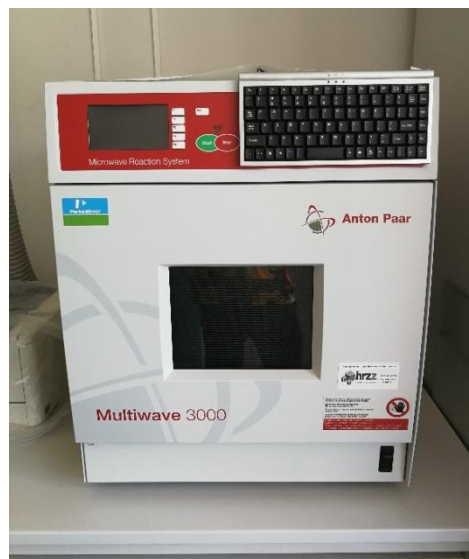
Slika 4. Mikrovalni sustav Anton Paar Multiwave