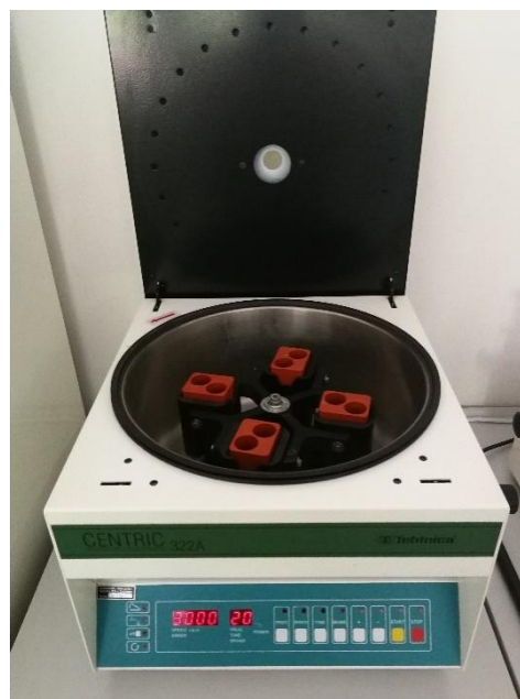
Slika 5. Uređaj za laboratorijsku centrifugu – Tehtnica Centric 322A

Nakon raščinjavanja uzoraka tla, bilo je potrebno odijeliti priređenu otopinu od krutog ostatka. Razdvajanje je vršeno pomoću centrifuge (3000 okr./min., 20 min), u kojem su otopine u kivetama od 10 mL bile izložene centrifugalnoj sili koja se javlja prilikom rotiranja pri određenoj brzini (slika 5.).