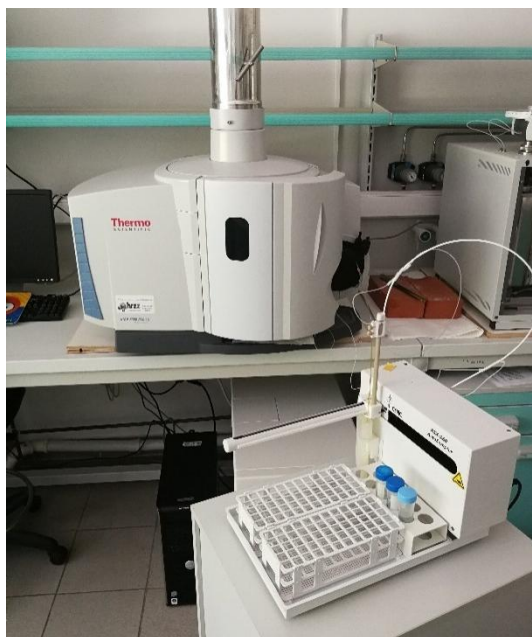
Slika 6. Emisijski spektrometar ICP-OES

U ovom istraživanju korištena je tehnika ICP-OES (engl. Inductively coupled plasma – optical emission spectrometry ) koja omogućuje kvantifikaciju mnogih kemijskih elemenata (slika 6.). Osnovni podaci o optičkom emisijskom spektrometru prikazani su u tablici 3. koja se nalazi u Prilogu.