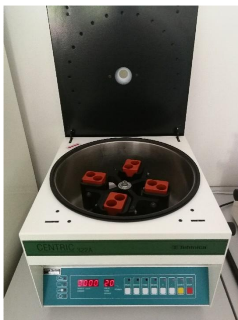
Slika 5. Uređaj za laboratorijsku centrifugu – Tehnica Centric 322A

Nakon raščinjavanja uzoraka tla, bilo je potrebno odijeliti priređenu otopinu od krutog ostatka. Razdvajanje je vršeno pomoću centrifuge (3000 okr./min., 20 min), u kojem su otopine u kivetama od 10 mL bile izložene centrifugalnoj sili koja se javlja prilikom rotiranja pri određenoj brzini (slika 5.).