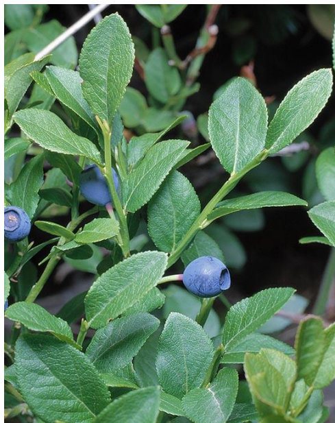
Slika 1. Vaccinium myrtillus L. (obična borovnica)

Obična borovnica (engl. European blueberry) je biljka iz porodice Ericaceae (slika 1.). Rasprostranjena je na području sjeverne i srednje Europe kao i na području sjeverne Azije (slika 2.). Vrlo je prilagodljiva ekološkim čimbenicima, što znači da ima široku ekološku valenciju. Općepoznato je da dolazi na izrazito kiselim tlima, čiji se pH kreće u rasponu 3,4 – 6,4. U prirodi ju je moguće naći u obliku grma visine do 50 cm. Budući da raste na kiselim tlima, spada u acidofilne vrste; također je i listopadno-entomofilna vrsta. Cvjeta u V. i VI. mjesecu, a plodovi dozrijevaju u VII. i VIII. mjesecu. Listovi borovnice sadrže arbutin i znatnu količinu vitamina C, pa se koriste za čaj (Franjić i Škvorec 2010). Izvor su tanina, flavonoida, antocijanina, fenolnih kiselina te nutritivnih vrijednosti kao što su: vitamini, minerali, ulja, šećer... Zbog kvalitetnih nutritivnih svojstava, često se koristi i u narodnoj medicini. Pojedini dijelovi biljke se koriste za suzbijanje cirkulacijskih problema, problema s vidom kao i za tretiranje dijabetesa (Drózd i dr. 2017).