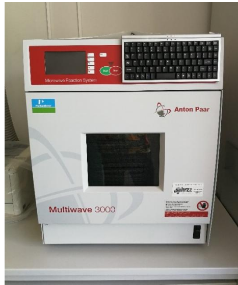
Slika 4. Mikrovalni sustav Anton Paar Multiwave