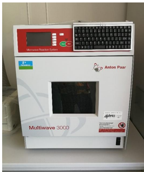
Slika 4. Mikrovalni sustav Anton Paar Multiwave