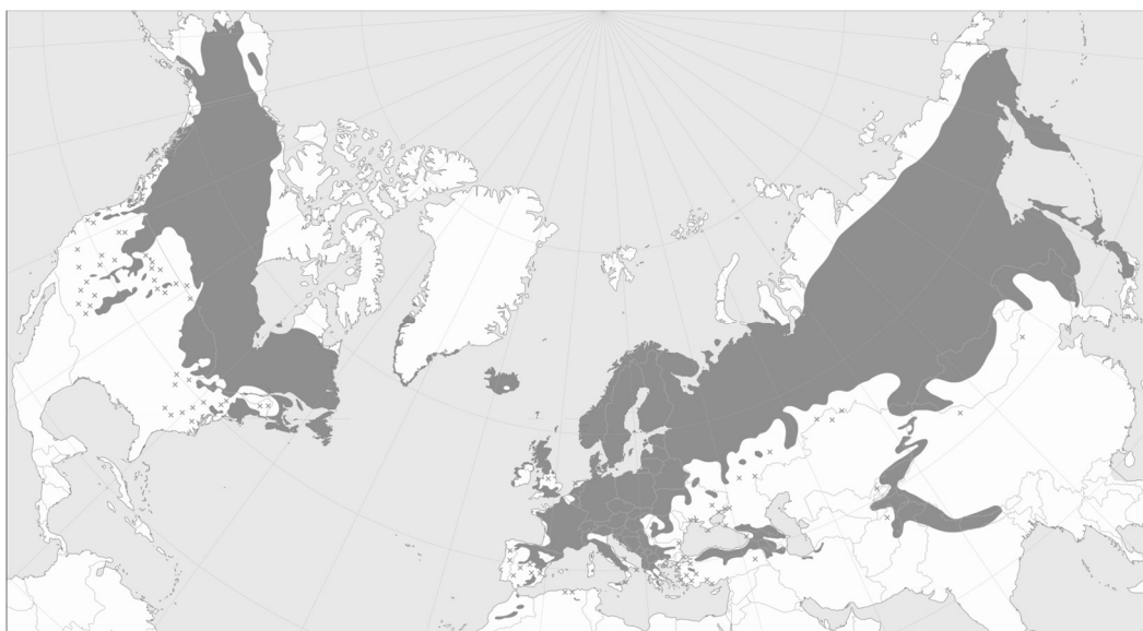
Slika 4. Prirodna rasprostranjenost obične borovice.