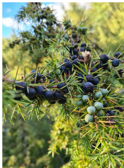
Slika 3. Bobuljasti češeri.