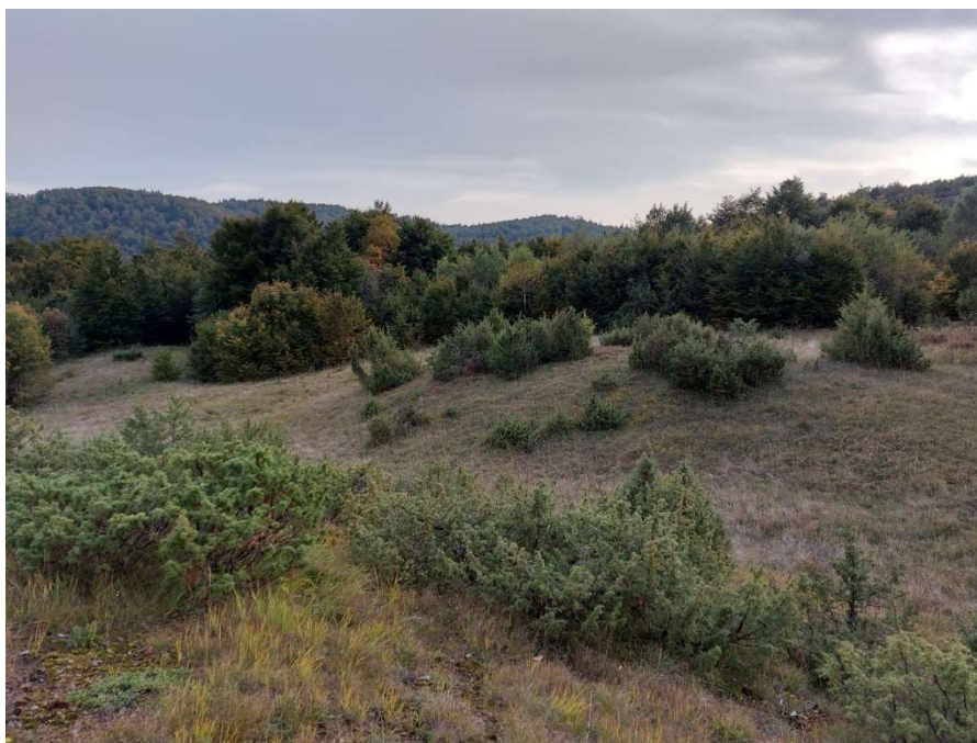
Slika 1. Habitus obične borovice.

Juniperus communis , obična borovica ili kleka, je dvodomni, vazdazeleni grm ili stablo (slika 1 i 2). Obično naraste 3 – 5 m, iako može doseći visinu i do 15 m. Deblo je žljebasto, a krošnja raznoliko formirana, od posve nepravilne do izrazito stupolike. Grane mogu biti uzdignute ili viseće i nisu u pršljenima. Kora je u početku glatka, a kasnije izbrazdana te se odvaja u obliku ljsaka i traka. Korijenov sustav značajno je razgranat sa žilom srčanicom, a zabilježena je i razvijena endotrofna mikoriza.