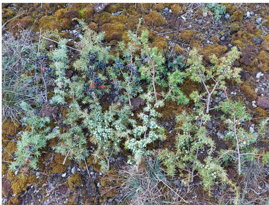
Slika 5. Uzorci obične borovice za morfometrijska istraživanja.