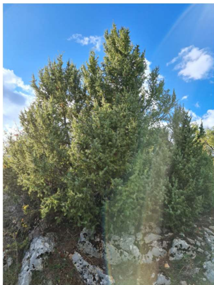
Slika 2. Habitua obične borovice.

veoma sporo pa stoga najčešće ima oblik grma, ali može imati i habitus stabla s vitkom čunjastom krošnjom. Pojedini primjerci mogu postići visoku starost (Herman 1971).