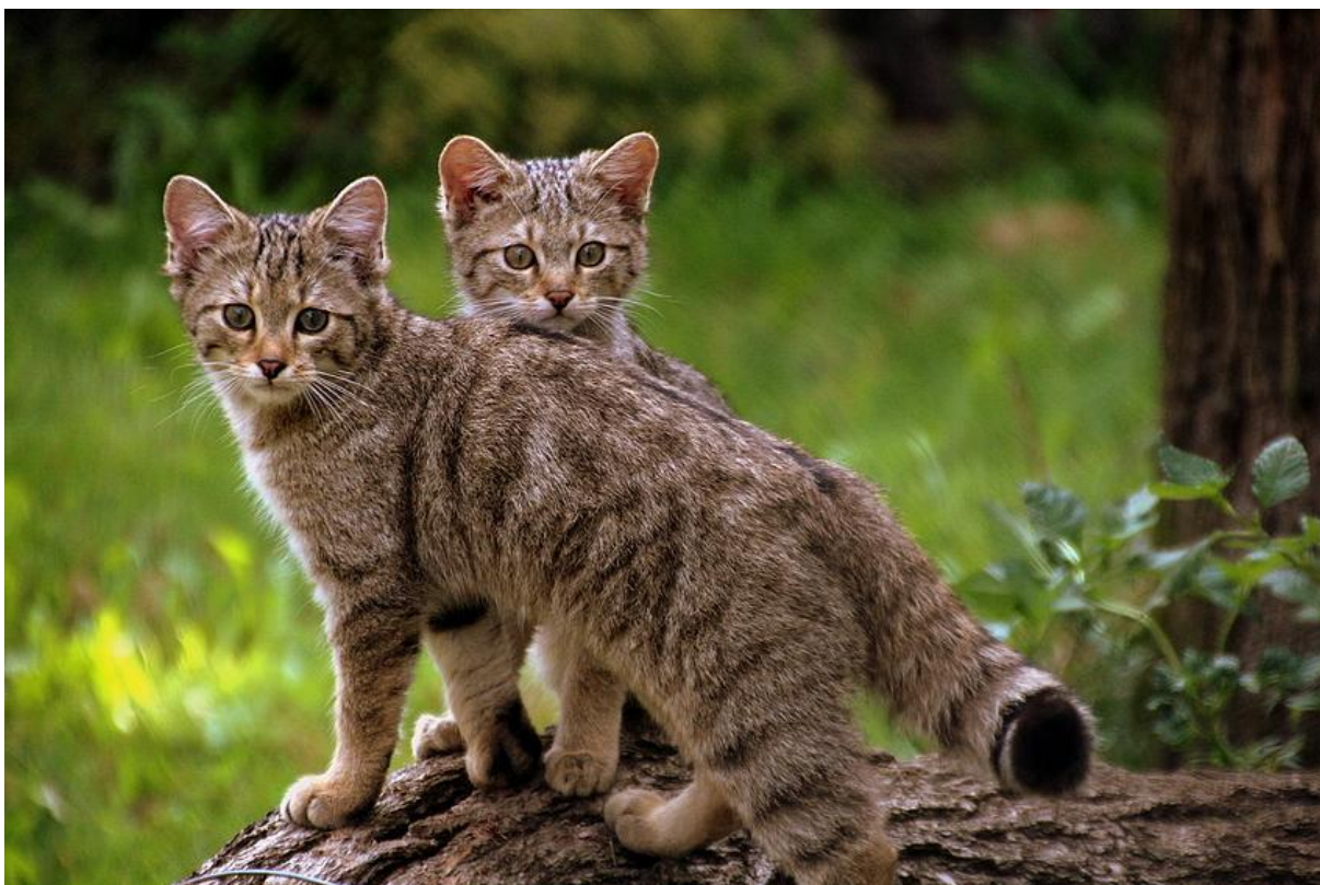
Slika 3. Potomci divlje mačke (mačići) u šumskom staništu