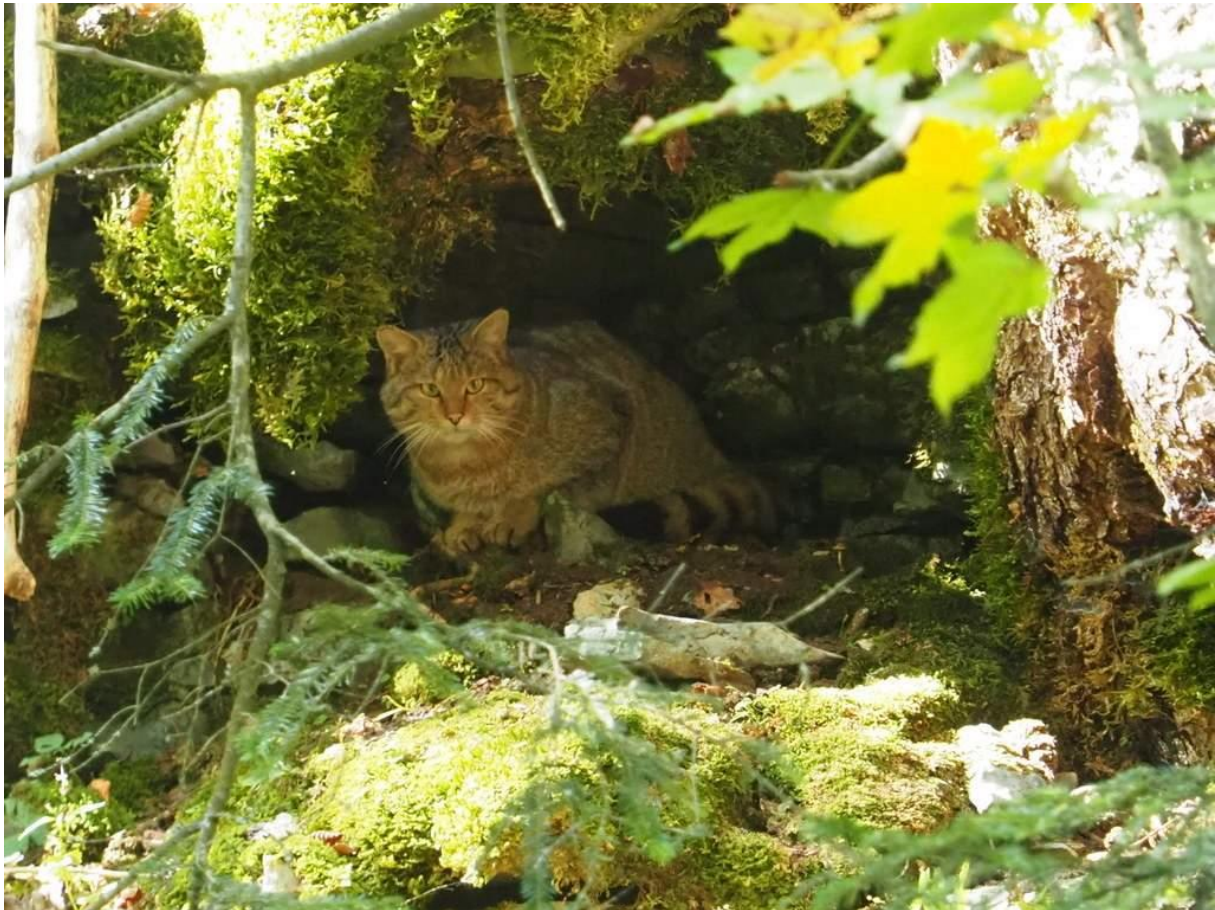
Slika 2. Odrasla divlja mačka ( F. silvestris ) u šumskom staništu

Divlja mačka dosta je slična običnoj domaćoj mački po boji dlake te po građi tijela. Razlikuje ih krupnija i snažnija građa divlje mačke koja može težiti 10 i više kilograma. Krzno joj je neujednačeno sivo, prošarano tamnom linijom uzduž hrpta te poprečnim prugama po truhu i leđima. Na vratu i podbratku dlaka je žućkasto blijeda, dok je trbuh zagasito sivo-žute boje. Kraćeg je repa u odnosu na običnu domaću mačku, no on je lako prepoznatljiv i uočljiv po svojih osam crnih krugova. Većinom mlađe divlje mačke imaju na čelu bijelu mrlju koja se s linjanjem izgubi. Veća i zaobljenija glava sa snažnim vratom te jake noge u odnosu na običnu domaću mačku. Mužjak je veći od ženke te spolni dimorfizam nije izražen.