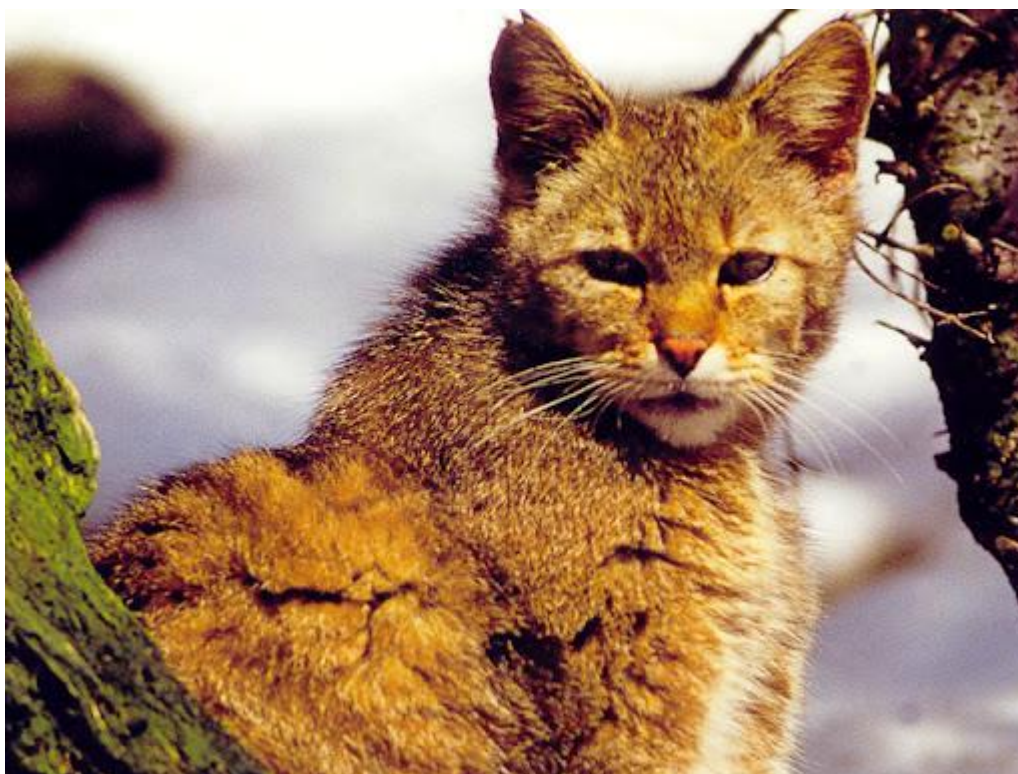
Slika 4. Divlja mačka u svom prirodnom okruženju; NP Krka

Starije visoke šume najpogodnije su stanište za divlju mačku. Nalazimo ju u bjelogoričnim šumama po čemu se razlikuje od ostalih podvrsta divlje mačke koje nalazimo u stepama. Najčešće ju nalazimo u gorskim i planinskim područjima, mediteranskoj makiji (Ragni, 1981), u obalnim, poplavnim šumama velikih rijeka kao i u nekim priobalnim područjima (Scott i sur., 1992). Zimzelene šume za divlju se mačku smatraju marginalnim staništem zbog nedostatka resursa za prehranu i skloništa. Sječom šuma dolazi do gubitka potencijalnih skloništa za divlju mačku, pogotovo u vidu uklanjanja suhih stabala. Divlja mačka smatra se krovnom vrstom (umbrella species) zbog odabira staništa i velikog životnog prostora. Od zaštite staništa divlje mačke s ciljem očuvanja potencijalnih skloništa može profitirati ris i ostale vrste iz porodice Mustelidae (Jerosch i sur., 2010).