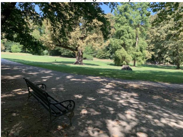
Slika 66. Klupa s pogledom na livadu i soliterna stabla