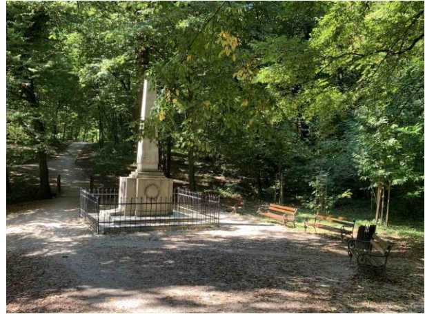
Slika 63. Obelisk oko kojeg je postavljeno nekoliko klupa

Vrlo je važno kamo je pogled usmjeren prilikom sjedenja na parkovnoj klupi. Dobri primjeri iz Maksimira su klupe koje su usmjerene prema otvorenim slikovitim scenama, livadama i jezerima (Slike 64, 65 i 66). Oko dječjih igrališta su postavljene klupe usmjerene prema igralištu kako bi roditelji sa njih mogli promatrati svoju djecu u igri (Slika 67). Isto kao i u prethodnim parkovima, u Maksimiru nisam naišla ni na jedan stol.