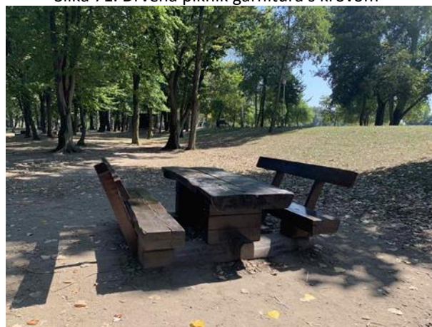
Slika 73. Drvena garnitura za piknik rustikalnog dizajna s naslonom

Osim u sjenicama, setovi rustikalnih klupa i stolova smješteni su i na ne natkrivenim površinama parka (Slika 73). Baš kao i u prethodnim parkovima, parkovne klupe na Bundeku smještene su tako da se pogled korisnika pruža prema odabranim vizurama. U ovom slučaju je to pogled na soliterno stablo i livadu (Slika 74) te jezero (Slika 75).