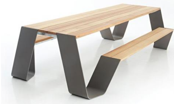
Slika 28. Moderna piknik garnitura