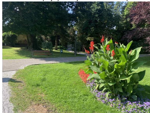
Slika 57. Klupa s pogledom na cvjetnu gredicu