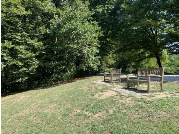
Slika 62. Formalne drvene klupe sa pogledom na dolinu