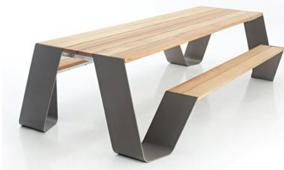
Slika 28. Moderna piknik garnitura