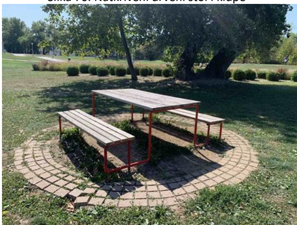
Slika 72. Garnitura za piknik u kombinaciji metala i drva na popločenom postolju