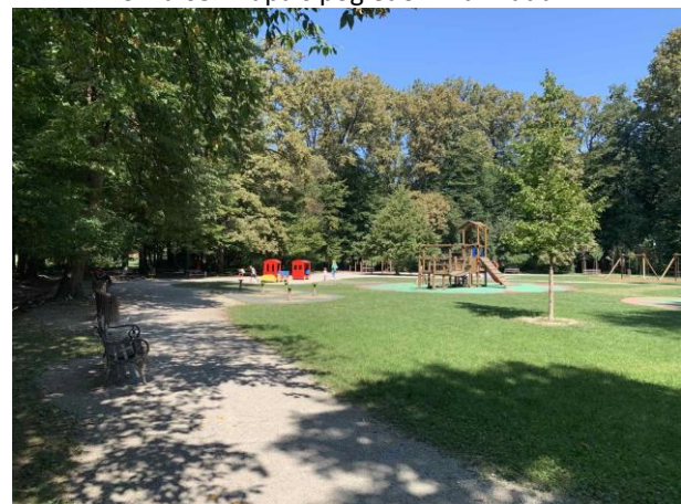
Slika 67. Klupe uz rubove dječjeg igrališta