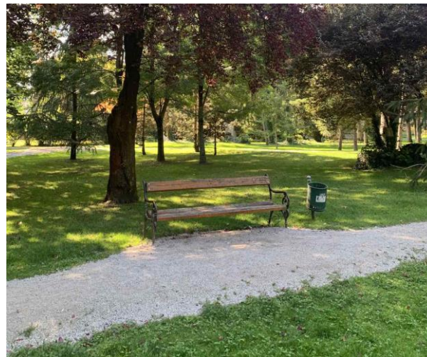
Slika 55. Primjer klupe postavljene na proširenju, u hladu. Uz klupu je postavljena košarica za otpatke.