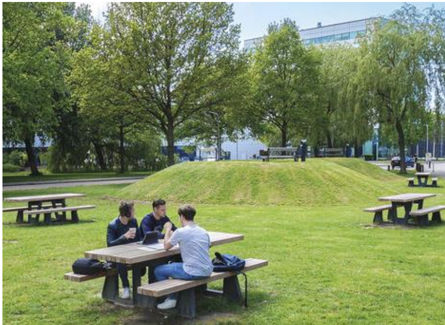
Slika 7. Druženje za parkovnim stolom

S obzirom da sve više građana želi što više vremena provesti na otvorenom, nije rijetkost druženja i održavanja piknika za parkovnim stolovima i klupama. Ručajući u parku, možete poboljšati raspoloženje, povećavajući tako koncentraciju i produktivnost na poslu. Odvajanje vremena izvan kuće i njezinih električnih uređaja može pomoći potaknuti više ljudi na komunikaciju. Dan upotpunjen razgovorima s prijateljima ili obitelji pomaže u borbi protiv posljedica izolacije i depresije. Postavljanjem stolova i klupa za piknik, potiče se korisnike zelenih površina da objeduju na otvorenom (Broxap 2017).