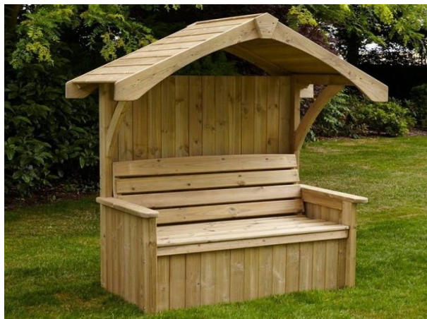
Slika 15. Natkrivena klupa