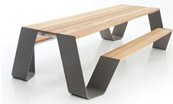
Slika 28. Moderna piknik garnitura