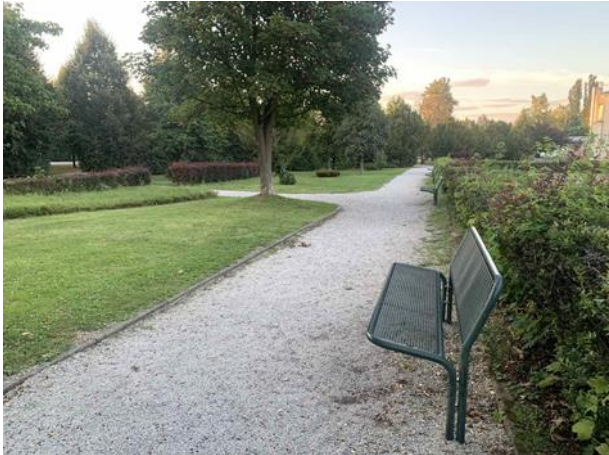
Slika 50. Klupa na stabilnoj podlozi okrenuta prema unutrašnjosti parka

U parku se može vidjeti dobar primjer postavljanja klupa u sjenu velikih stabala, što omogućuje ugodnije korištenje klupe tijekom ljetnih mjeseci (Slika 52). Kako bi se osigurala čistoća parka, uz klupe su postavljene košarice za otpatke (Slika 53).