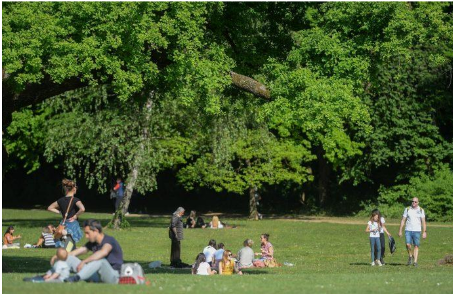
Slika 1. Korisnici zagrebačkog parka Maksimir

Vrijednosti urbanog zelenila mogu se podijeliti u kategorije pa razlikujemo: biološke, ekološke, estetske, sociološke, zdravstvene i ekonomske vrijednosti.