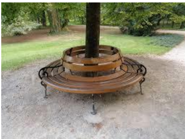
Slika 10. Kružna drveno-metalna klupa u parku Maksimir