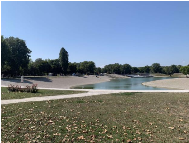
Slika 68. Park Bundek

Najčešći dizajn parkovnih klupa je dizajn koji sadrži metalnu konstrukciju sa drvenim naslonom i sjedištem bez naslona za ruke. Klupe su trajno postavljene na stabilna i čvrsta proširenja uz staze. Obično su postavljene tako da budu u sjeni visokih stabala. Pošto je Bundek omiljeno odredište za roštiljanje, u njemu sam naišla na brojne primjere dizajna piknik garnitura. U parku se nalazi mnogo sjenica u kojima se nalaze rustikalni drveni stolovi sa pripadajućim drvenim klupama (Slika 70). U parku se nalaze i natkrivene drvene piknik garniture. One čine jednu cjelinu, naime klupe i stol su povezani sa konstrukcijom koja drži krov (Slika 71). U Bundeku su prisutne i piknik garniture sa metalnom konstrukcijom i tablom stola i sjedištima od drva. Takve garniture smještene su na popločene površine kružnoga oblika (Slika 72).