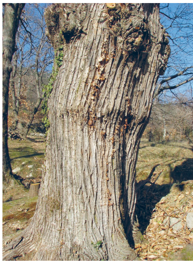
Slika 3. Lovranski marun: (A) plodovi; (B) spoj između podloge i plemke. Figure 3 Lovran marron: (A) fruits; (B) graft union between rootstock and scion.

stavlja komplementaran kvadrat kore s kambijem plemke, koji na sebi ima pup. Ova je metoda primjerena u slučaju već odebljale kore starijih izbojaka, kada su pločasto okuliranje i T-okuliranje neizvedivi (Carroll 2017).