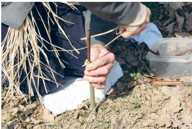
Slika 4. Cijepljenje u raskol. Figure 4 Cleft graft.

tic acid ). Osim pravilno izvedenog cijepljenja, velik je utjecaj pravilne njege te uzgoja cijepljenih biljaka. Niske temperature usporavaju kalusiranje spoja cijepa te oslabljuju ili umanjuju uspješnost primanja plemke na podlogu. Također, utvrđena je razlika u uspješnosti pojedine tehnike cijepljenja turskih kultivara europskog pitomog kestena na hibridne podloge, ovisno o načinu uzgoja sadnica (Serdar i Soylu 2005). Prilikom uzgoja na otvorenome polju, uspješnijim se pokazalo cijepljenje na engleski spoj, dok je u biljaka uzgajanih u kontejnerima veći uspjeh postignut Tokuliranjem. Odabir pravilnog načina uzgoja stoga ovisi o proizvodnome planu – biljke uzgajane u kontejnerima imaju veći uspjeh u prilagodbi nakon presađnje, no spremne su za prodaju tek u trećoj uzgojnoj godini. Biljke uzgajane na otvorenome u prodaju mogu već najesen, ako su cijepljene u proljeće.