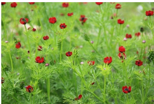
Slika 5. Adonis aestivalis L.

Opis: ljetni gorocvijet je višegodišnja biljka, biljka naraste do 40 cm visine. Listovi su mu naizmjenični a cvjetovi pojedinačni, krupni i dvospolni, cvjetaju od svibnja do srpnja. Plodovi su jednosjemeni oraščići. Biljka je najviše rasprostranjena u Europi osim krajnjeg sjevera europa, raste na suhim i sunčanim zapuštenim zemljištima. Cijela biljka je otrovna (Nikolić 2021).