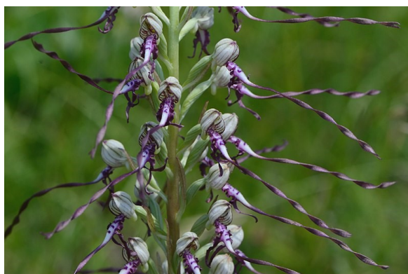
Slika 66. Himantoglossum adriaticum

Opis: na doljen dijelu stabljike su veliki listovi dok su na gornjem dijelu manji. Cvjeta u svibnju i lipnju. Ova biljka raste na suhim područjima poput livada, šikara i šumskih čistina.