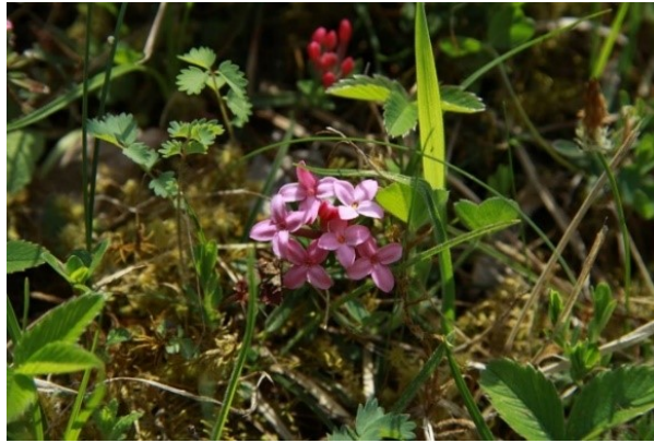
Slika 26. Daphne cneorum L. www.freenatureimages.eu

Opis: zeljasta trajnica čiji su listovi kožasti i obrnuto jajasti. Cvjetovi su dvospolni i skupljeni u cvatove, cvjetaju od svibnja do kolovoza. Plodovi su bobice. Raste na sunčanim i suhim mjestima (Žitković 2009).