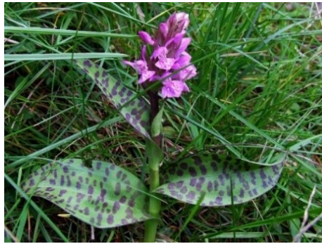
Slika 60. Dactylorhiza maculata (L.) Soo.

Opis: trajna biljka čija je stabljika uspravna, valjkasta i vitka. Listovi su joj naizmjenični, obrnuto jajasti ili kopljasti. Cvjetovi su joj dvospolni i nepravilni, cvjeta u lipnju u srpnju. Plod je kapsula koja sadrži mnogo sitnih sjemenki. Raste na vlažnim i rastresitim tlima (Nikolić 2021).