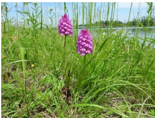
Slika 52. Anacamptis pyramidalis (L.)

Opis: trajna zeljasta biljka čija je stabljika uspravna i tanka. Listovi su naizmjenični i duguljasti. Cvjetovi su dvospolni i skupljeni u grozdasti cvat, cvjetaju od travnja do srpnja. Plod je višesjemeni tobolac. Raste na sunčanim zemljištima poput livada, travnjaka (Franjić i Škvorc 2014).