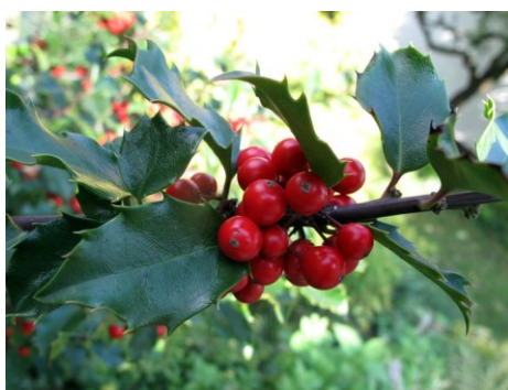
Slika 42. Ilex aquifolium L.

Opis: grm ili niže stablo koje naraste do 5 m visine. Kora je tanka i glatka a lišće je naizmjenično poredano i jajolikog oblika, ima bodlje na rubovima, zimzeleno je. Cvijet je je jednospolan dvodoman, cvjeta u travnju, svibnju i lipnju. Plodovi su koštunice koje su otrovne. Raste na brdskim, gorskim i vlažnim područjima (Ravlić 2021).