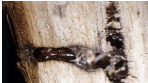
Slika 20. Na fotografiji vidimo karakterističan hodnik azijskog drvenara ( Xylosandrus germanus ) u obliku slova L

On ima zaobljeni protonum i pokrilje koje je za pola dulje od vratnog štita. (CABI, 2019) Pojavljuje se kao sekundarni štetnik na zdravim stablima, na odumrlim i oborenim. (CABI,2019) Ženka u hodnike unosi gljivice Ambrosiella hartigii i Ambrosiella grosmaniae . (Galko i drugi, 2018.) Te gljivice omekšavaju drvo i olakšavaju ovom štetniku bušenje hodnika.