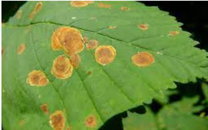
Slika 5. Mine kestenovog moljca minera ( Cameraria ohridella ) na listu divljeg kestena ( Aesculus hippocastanum )

Najznačajniji štetnik stabala divljeg kestena ( Aesculus hippocastanum L.) je kestenov moljac miner. Iz tog zaključujemo da je isključivo vezan za urbane šume i parkove jer divlji kesten ne nalazimo na prirodnim šumskim staništima u Hrvatskoj. Ličinke stvaraju mine na gornjoj strani listova divljeg kestena. Mine su diskolorirana mjesta na listu na kojima je parenhimsko staničje pojedeno. Na taj način kestenov moljac miner smanjuje asimilacijsku površinu lista divljeg kestena.