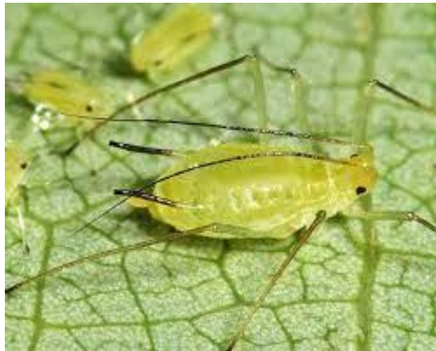
Slika 26. Odrasli stadij uši na listu tulipanovca

Napada samo tulipanovac ( Liriodendron tulipifera L.) pa ju možemo opisati kao monofagna vrsta. Radi oštećenja na listu. Ako je napad jači biljka jako oslabi. Lišće već u kolovozu požuti i počne opadati. Napadajući list tulipanovca, uš smanjuje njegovu asimilacijsku površinu i oslabljuje biljku u cjelini. Tulipanovac u Republici Hrvatskoj nije autohtona vrsta, ali je značajna ukrasna vrsta u urbanim sredinama poput parkova. Sukladno tomu ima važnu estetsku funkciju koja je narušena napadom uši.