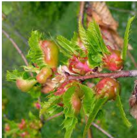
Slika 8. Kestenova osa šiškarića ( Dryocosmus kuriphilus ) stvorila je šiške na peteljci pitomog kestena ( Castanea sativa )