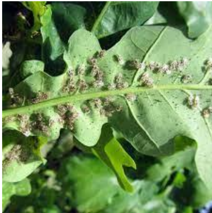
Slika 12. Mrežasta hrastova stjenica ( Corythucha arcuata ) u odraslom stadiju, na listu hrasta lužjaka ( Quercus robur ), šiše biljne sokove

opasne za čovjeka. Posljednjih nekoliko godina širi se velikom brzinom kontinentalnim hrastovim šuma. Posebno je ugrožen hrast lužnjak u bazenu Spačve. Napadajući lišće uništavaju asimilacijsku površinu i smanjuju ishranu biljke. Takva oslabjela biljka ima smanjenju mogućnost obilnog uroda bez kojeg nema obnove sastojina i šuma hrasta lužnjaka. Iz takve situacije proizlaze ekonomski i gospodarski problemi gospodarenja šumama.