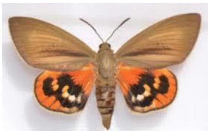
Slika 24. Palmotoč ( Paysandisia archon ) u zadnjem razvojnom stadiju imaga