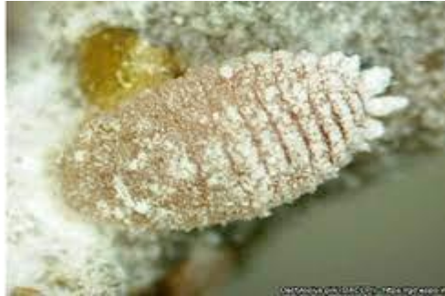
Slika 16. Na fotografiji je prikazan Crissicocus pini u odraslom stadiju na iglici bora

Ovaj invazivni šumski štetnik prvi put je pronađen u Europi 2015. godine u Italiji. Pripada redu Hemiptera i porodici Coccidae . Uхваćena je na stablima primorskog bora ( Pinus pinaster Aiton) i pinije ( Pinus pinea L.). Najvjerojatnije je došla iz Azije. Iz nje je se proširila u Sjevernu Ameriku i Europu. Vektor širenja ovog invazivnog šumskog štetnika je zaraženi biljni materijal.