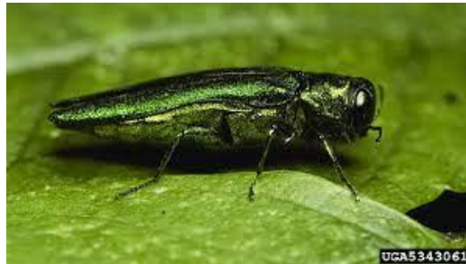
Slika 15. Jasenov krasnik ( Agrilus planipennis ) u stadiju imaga na listu jasena ( Fraxinus spp. )

U godinu dana razvije jednu generaciju. Od sredine svibnja do sredine srpnja vidljiva je aktivnost odraslih oblika. Kada izađu iz kukuljice, hodaju prema vrhu krošnje gdje se hrane lišćem 3 – 4 sata i nakon toga odlete. Odrasli stadij preko dana boravi na otvorenom, a preko noći se nalaze na lišću. Kada se izlegu, jaja odlažu na koru, među pukotine.