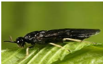
Slika 3. Imago brijestove muhe listarice ( Aprocerus leucopoda ) na listu brijesta ( Ulmus spp. )

U Europi napada nizinski ( Ulmus minor Mill.) i turkeštanski i brijest ( Ulmus pinato – ramosa Dieck ex Koehne). Od ovih vrsta, turkeštanski brijest sadi se kao ukrasna vrsta u urbanim područjima u obliku drvoreda. Brijestova osa listarica ima četiri generacije godišnje. Njezine ličinke koje napadaju lišće mogu potpuno obrstiti stablo brijesta i počiniti golobrst. Na fotografiji 4. je prikazana brijestova osa listarica u stadiju ličinke tokom hranjenja na listu brijesta. Ovakav oblik oštećivanja stabla vidljiv je u urbanim sredinama gdje ličinke brijestove ose listarice napadaju turkeštanski brijest. Stabla koja su ostala bez lišća u napadu, vlastitom snagom obnove svoju krošnju, ali već sljedeće godine dolazi do sušenja grana. U Hrvatskoj još nije došlo do pojačanog napada na lišće i njihovo odumiranje., no to ne mora značiti da se ne će dogoditi. Kod nas je nizinski brijest gotovo nestao, a ako ga napadne još nekakav štetnik, okončao bi ovu nekad važnu gospodarsku vrstu. Brijestova osa listarica napada vrste samo jednog roda pa ju možemo opisati kao monofag.