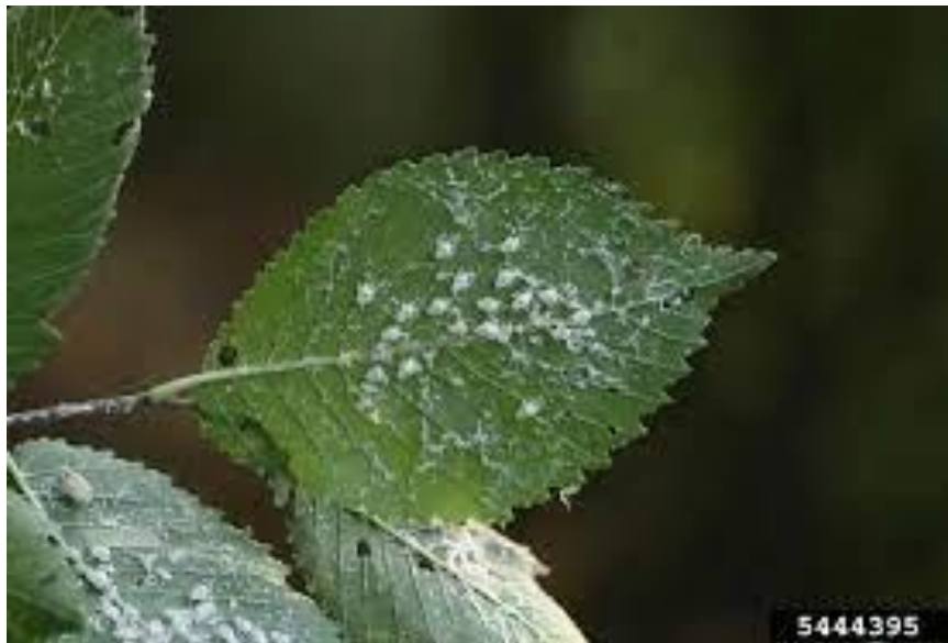
Slika 10. Medna rosa zajedno s voštanim presvlakama medećeg cvrčka ( Metcalfa pruinosa ) na listu zeljaste biljke

Medeći cvrčak svojim napadom na stablo uzrokuje dvije vrste šteta: izravne i neizravne. Izravne su povezane sa slabijim rastom biljke. Obilno izlučivanje medne rose opisujemo kao neizravna šteta. Medna rosa je ljepljiva tekućina koju izlučuju ličinke. Gljive čađavice naseljavaju ljepljive lisne površine i izbojke i tako smanjuju asimilacijsku površinu i uništavaju ugodan estetski izgled biljke.