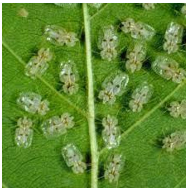
Slika 13. Mrežasta platanina stjenica ( Corythuca ciliata ) u odraslom stadiju siše biljne sokove na platani

Štetu izazivaju u urbanim područjima gdje na lišću platane ( Platanus x acerifolia (Aiton) Wild.) ličinke sišu biljne sokove. Tako skupljaju hranjive tvari. Na listu platane izazivaju žućenje ili diskoloraciju. Tako narušavaju estetsku funkciju koju platane imaju u urbanim sredinama.