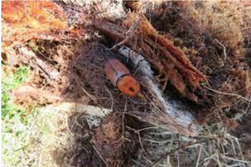
Slika 22. Crvena palmina pipa ( Rhynchophorus ferrugineus ) u stadiju imaga čini štetu u mekom tkivu palme