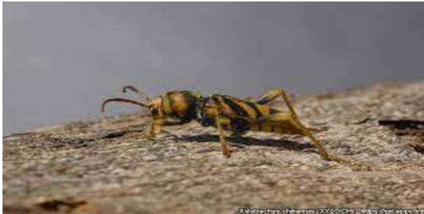
Slika 18. Na fotografiji je prikazan Xylotrechus chinensis u odraslom stadiju imaga na kori

Xylotrechus chinensis napada vrste iz roda Morus . Neke od tih vrsta su Morus alba L. i Morus nigra L. U Hrvatskoj je štetan za rodove Malus i Pyrus koji su bitni za šumske ekosustave. Ličinke u drvu buše hodnike i tako sprječavaju transport mineralnih tvari i vode s gornjeg dijela biljke u donji. Kako stablo otežano obavlja protok, ono počinje slabjeti. U daljnjem napredovanju ovog štetnika može doći do potpunog odumiranja stabla.