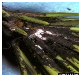
Slika 17. Na fotografiji je prikazan C.pini prilikom napada koji uzrokuje nekrozu iglice bora

C.pini napada samo vrste porodice Pinaceae . Zabilježen je na P. nigra Arnold, P. parviflora „Glauca“, P. radiata D. Don, P. pinea i P. halepensis Miller. Hrani se i razvija na borovim iglicama. Upravo na njima i pravi najveću štetu. Napadnute iglice postaju žute i nekrotiziraju. Ovaj štetnik razvija specifičnu sluz zbog koje iglice napadne plijesan. Krošnje nakon napada obilježi djelomično do potpuno odumiranje.