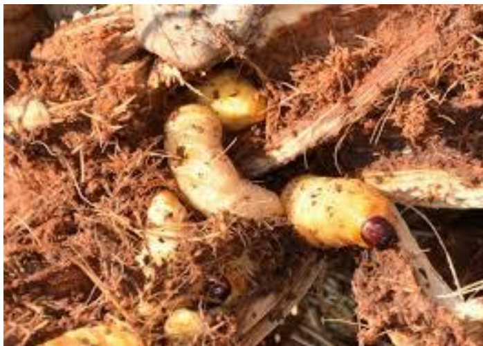
Slika 23. Crvena palmina pipa ( Rhynchophorus ferrugineus ) u stadiju ličinke čini štetu u mekom tkivu palme