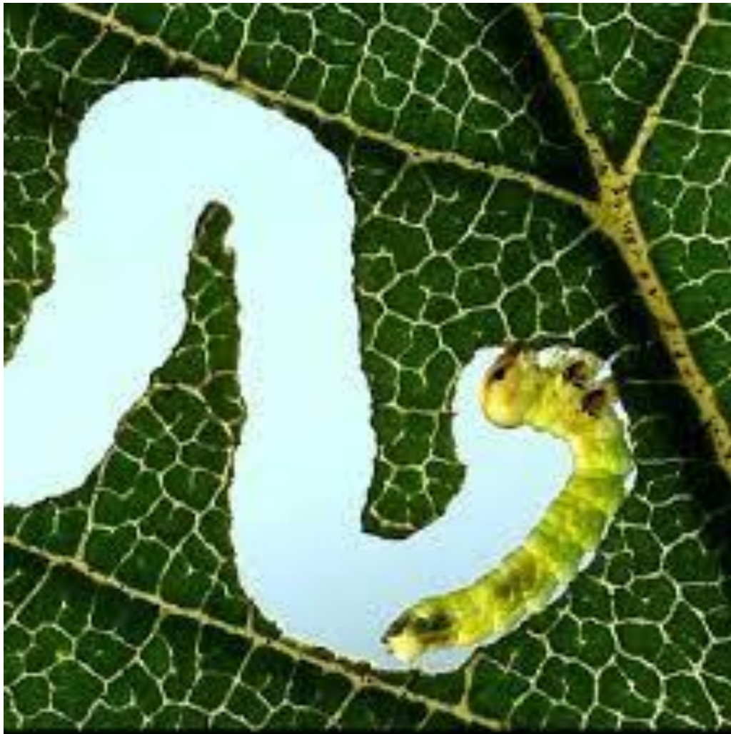
Slika 4. Ličinka brijestove muhe listarice ( Aprocerus leucopoda ) na listu brijesta ( Ulmus ) prilikom brsta