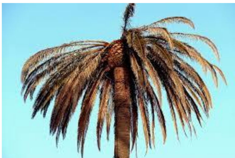
Slika 25. Izgled oslabjele palme napadnute palmotočem ( Paysandisia archon )