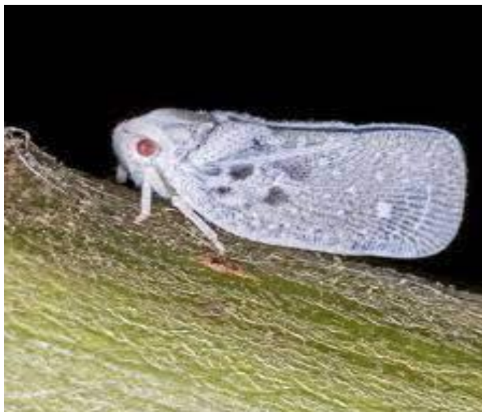
Slika 9. Medeći cvrčak ( Metcalfa pruinosa ) u odraslom stadiju

Napada brojne biljne vrste pa ga možemo opisati kao polifag. Na U kori, pukotinama i pupovima drveća i grmlja prezimljuju jaja. U drugoj polovici svibnja iz tih jaja izlaze ličinke. Na fotografiji 9. je prikazan medeći cvrčak u zadnjem, odraslom stadiju imaga. Na listovima se stvara siva do crna presvlaka i estetska vrijednost biljke se gubi. Neuredan izgled i bijele voštane prevlake (svlakovi ličinki na pupovima i donjem dijelu lista) obilježavaju jako zaražene biljke.