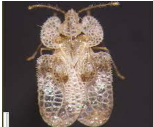
Slika 11. Odrasli stadij mrežaste hrastove stjenice ( Corythucha arcuata )

Mrežasta hrastova stjenica pripada porodici Tingidae koja se nalazi u redu Hemiptera . Ona je sitan kukac. Na fotografiji 11. je prikazana mrežasta hrastova stjenica u zadnjem, odraslom stadiju. Mrežasta hrastova stjenica je kukac male veličine koji ima prozirno pokrivanje i mrežastu nervaturu. U jednoj godini stvori nekoliko generacija.