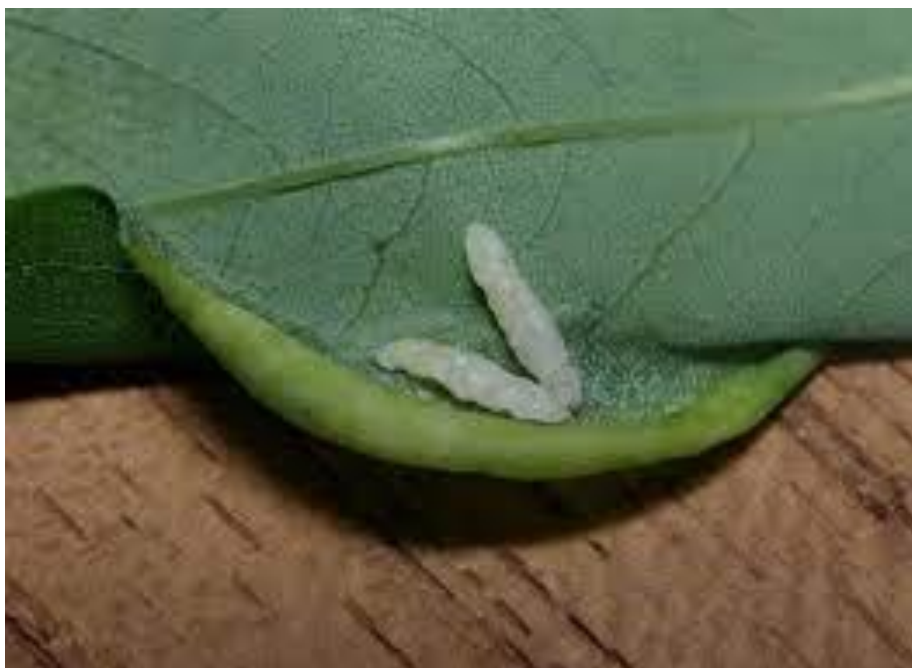
Slika 1. Ličinke bagremove muhe šiškarice ( Obolodiplosis robiniae ) na bagremu ( Robinia pseudoacacia ) i njihovo karakteristično uvijanje listova prema dolje