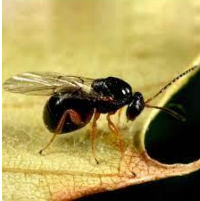
Slika 7. Kestenova osa šiškarića ( Dryocosmus kuriphilus ) u odraslom stadiju na listu pitomog kestena ( Castanea sativa )