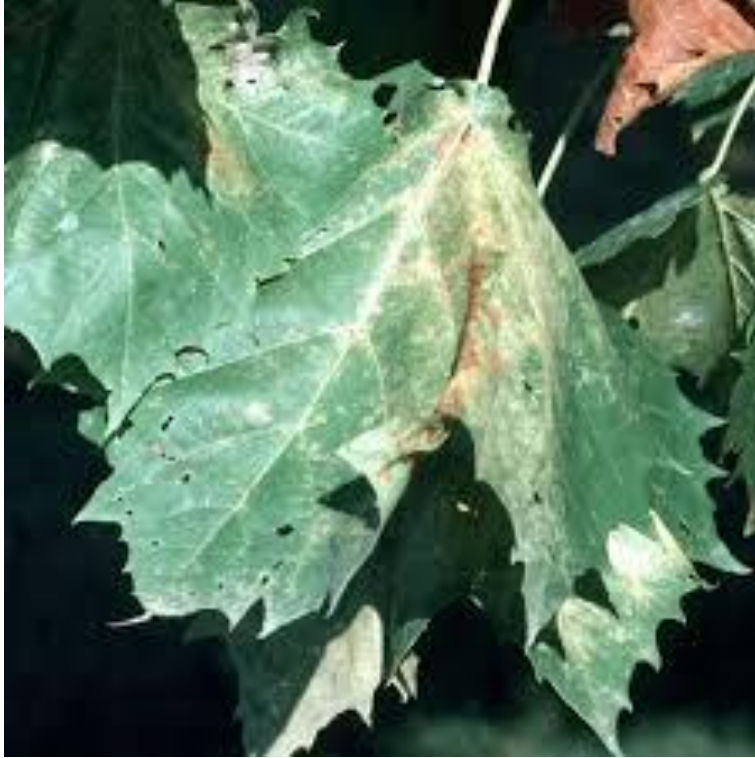
Slika 14. Mrežasta platanina stjenica ( Corythuca ciliata ) izazvala je diskoloraciju na lišću lišću platane ( Platanus x acerifolia )