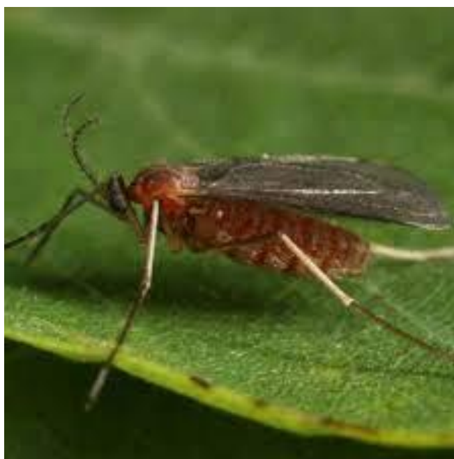
Slika 2. Odrasli stadij bagremove muhe šiškarice ( Obolodiplosis robiniae ) na listu bagrema ( Robinia pseudoacacia )