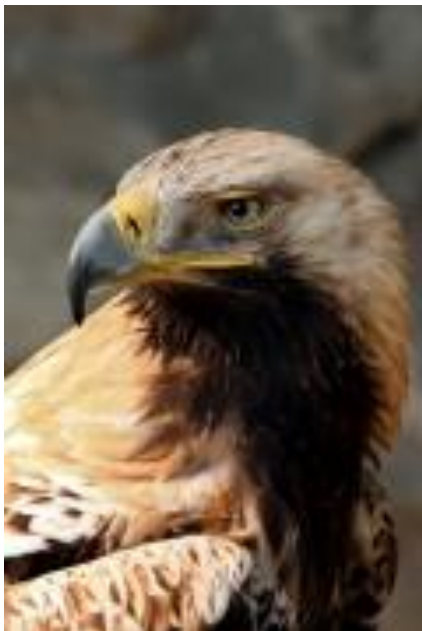
Slika 21. Orao krstaš