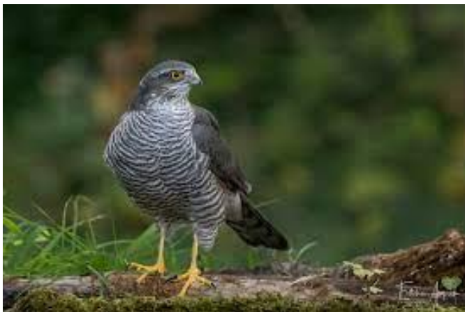
Slika 36. Obični kobac