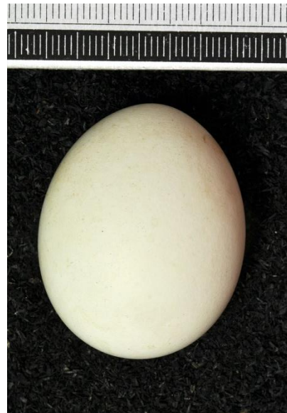
Slika 8. Jaje eje livadarke