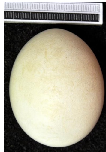
Slika 20. Jaje orla zmijara