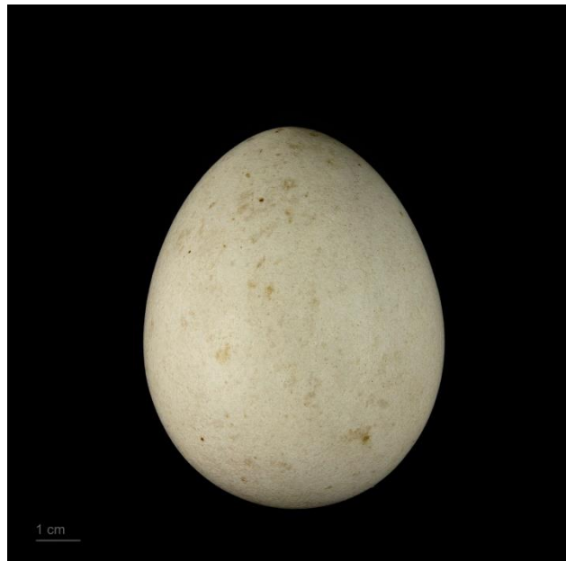
Slika 22. Jaje orla krstaša