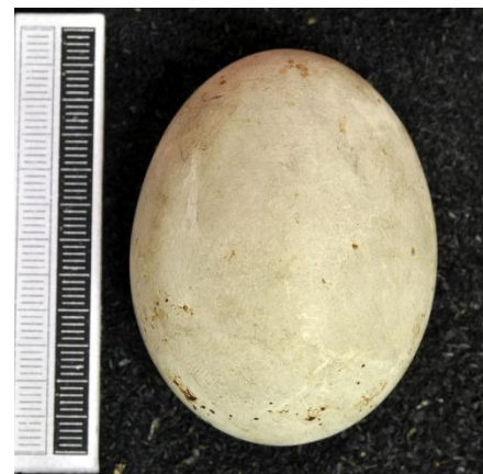
Slika 35. Jaje običnog jastreba