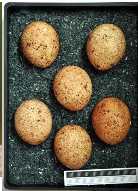
Slika 28. Jaja od vjetruše