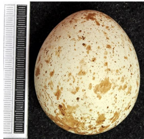
Slika 14. Jaje orla kliktaša