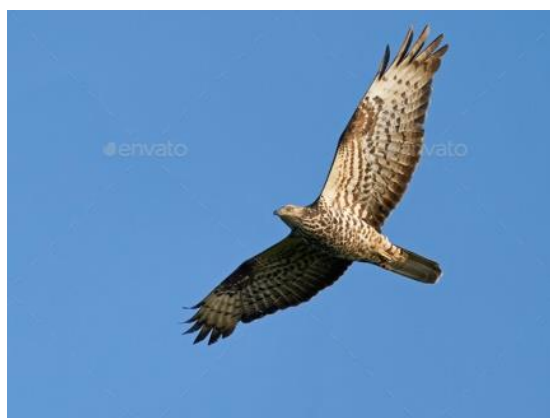
Slika 29. Škanjac osaš u letu

To je ptica grabljivica iz porodice jastrebova koja je duga 52 – 60 cm, s rasponom krila 135 – 150 cm. Ima duži vrat s malom glavom. Rep mu je duži, obično s dvije uske tamne trake i širokom tamnom trakom. Spolovi se mogu razlikovati po perju, što je neobično za veliku pticu grabljivicu. Mužjak ima plavo-sivu glavu, dok je glava kod ženke smeđa. Ženka je djelomično veća i tamnija od mužjaka. Monogamni su, a veze im traju najmanje jednu sezonu. Gnijezda grade na granama velikog drveća. Na jajima leže i o mladima brinu oba roditelja. U leglu su obično 2 jaja. Inkubacija traje 30-35 dana, a mladi su sposobni za let nakon 75-100 dana. Hrani se saćima, odnosno ličinkama i kukuljicama opnokrilaca, a u manjoj mjeri se hrani i drugim kukcima, vodozemcima, gmazovima, manjim sisavcima i dr. Na tlu se zadržavaju znatno duže od drugih predatorskih ptica. Prilikom leta, klizi blago nadolje svinutih krila, jedri s ravnim krilima. U Hrvatskoj je redovita gnjezdarica i preletnica, najviše u području panonske Hrvatske, a prisutan je od travnja do listopada. Gnijezdeća populacija kod škanjca osaša je procijenjena na 150 – 250 parova.