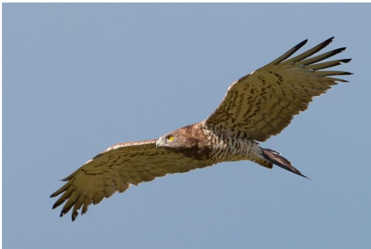
Slika 19. Orao zmijar u letu