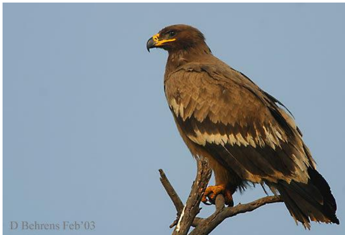
Slika 13. Orao kliktaš