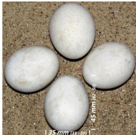
Slika 12. Jaje eje strnjarice