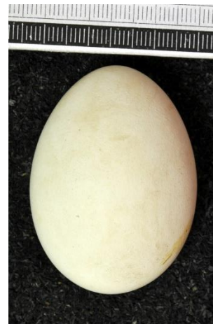
Slika 10. Jaje Eje močvarice