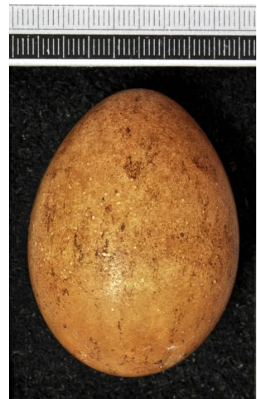
Slika 26. Jaje stepskog sokola