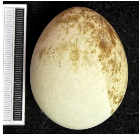
Slika 16. Jaje orla klokotaša