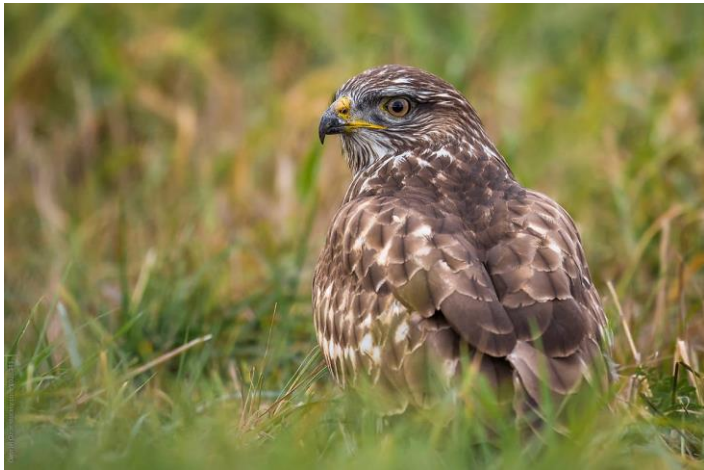
Slika 32. Obični škanjac