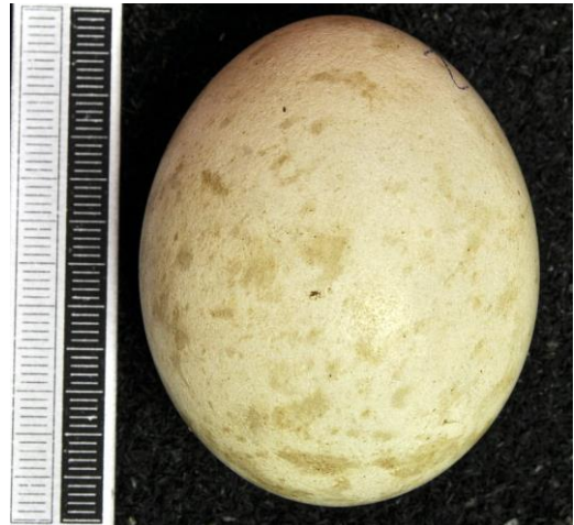
Slika 33. Jaje običnog škanjca