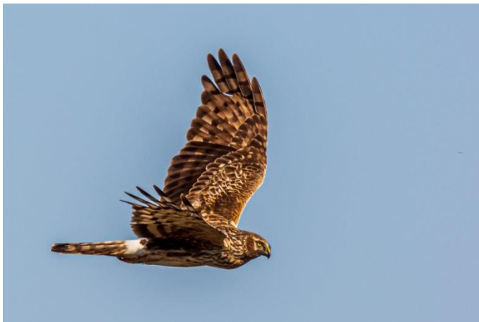
Slika 11. Eja strnjarica u letu

Eja strnjarica je duga 41-52 cm, s rasponom krila od 97-122 cm. Sličnost s drugim ejama pokazuje u vidu različitog muškog i ženskog perja. Ženke su u prosjeku teže od mužjaka. Mužjak je uglavnom siv odozgo i bijel odozdo osim gornjeg dijela grudi, koji je siv, i zatka, koji je bijel, dok su krila siva s crnim vrhovima. Ženka je odozgo smeđa, a na gornjem dijelu repa ima bijeli pokrov. Razmnožava se na močvarama, prerijama, obalnim prerijama na poljoprivrednim površinama, travnjacima, i na mladim crnogoričnim nasadima. Pri lovu kruže oko područja nekoliko puta osluškujući i tražeći plijen. Redovito koriste sluh kako bi pronašli plijen, jer imaju izuzetno dobar sluh za dnevnog predatora. Hrane se na otvorenim područjima s raštrkanim grmljem. Glavninu njihove zimske hrane čine sisavci i ptice. Gniježđenje počinje od ožujka do svibnja, a završava jesenskom selidbom i stizanjem na zimovališta od kolovoza do listopada. Gnijezda gradi na zemlji ili na nakupinama blata i vegetacije. Grade ih od grančica, a iznutra ih oblažu travom i lišćem. Obično se polaže od 4 do 8 jaja, a iznimno 2-10. Poligamna je vrsta (jedan mužjak se pari s nekoliko ženki). Prilikom inkubacije ženka sjedi na gnijezdu, a mužjak lovi i donosi hranu za ženku i ptiće. Inkubacija traje 31-32 dana, a mladi se osamostaljuju za 36 dana. Spolna zrelost kod ženki nastupa s 2 godine, a kod muškaraca s 3 godine. Ova vrsta se ne gnijezdi u Hrvatskoj, ali se u njoj zadržava zimi.