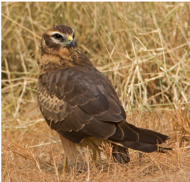
Slika 7. Eja livadarka