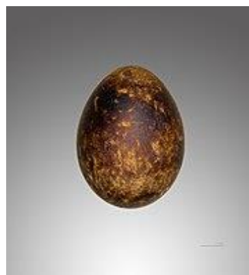
Slika 31. Jaje škanjca osaša