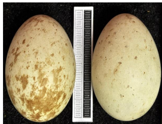
Slika 6. Jaje crvene lunje