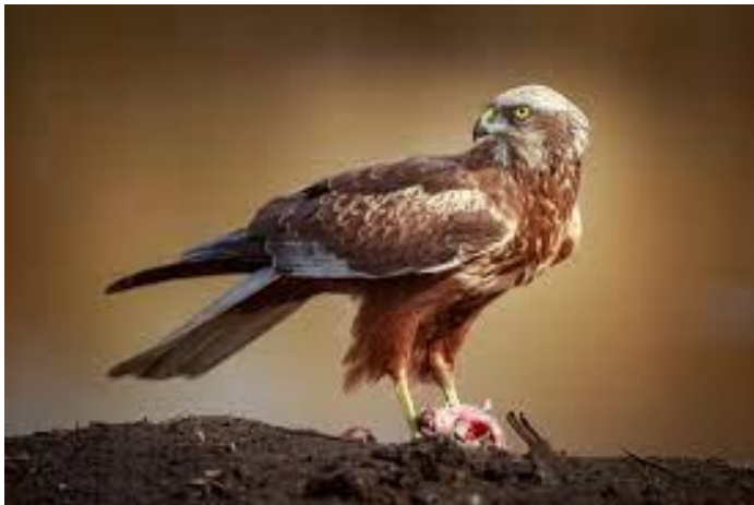
Slika 9. Eja močvarica

Ova vrsta je duga je od 43 do 54 cm, s rasponom krila od 115 do 130 cm. Ženke su teže od mužjaka. Perje mužjaka uglavnom je crveno-smeđe boje sa svjetlijim žućkastim prugama, koje su posebno istaknuti na prsima. Glava i ramena blijede su sivo-žute boje. Kod perja ove vrste prisutan je melanizam. Najčešće se gnijezdi na otvorenim staništima gdje joj pogoduje prostor uz slatke i bočate vode, močvare, bare, jezera, i rijeke obala gdje je veća prisutnost bujnog močvarnog bilja. Pored navedenog rjeđe se gnijezdi i na travnjacima, solanama, rižinim poljima ili poljima drugih žitarica. Gnijezda najčešće grade u gustim tršćacima na tlu, i njih gradi ženka koja i leži na jajima. Gnijezdo je napravljeno od štapa, trske i trave. Obično se gradi u trstici, ali će se vrsta gnijezditi i na oranicama. Obično se polaže 3 do 6 jaja, a vrijeme koje je potrebno da se ptici izvaljaju je 31-38 dana. Mladi su sposobni za let za 35-40 dana, a od roditelja se osamostaljuju nakon 2 do 3 tjedna. Početak sezone razmnožavanja varira od sredine ožujka do početka svibnja. Najčešće lovi klizeći nisko po ravnom otvorenom terenu u potrazi za plijenom, s krilima u plitkom obliku slova V i često s visećim nogama, plijen love na prepad. Hrani se malim sisavcima, malim pticama, kukcima, gmazovima i žabama, a tijekom zime se hrane i strvinom. Ova vrsta je gnjezdarica močvarnih područja u panonskoj (gdje je rasprostranjenija i brojnija) i primorskoj Hrvatskoj. Najviše zapažena u baranjskom dijelu Podunavlja.