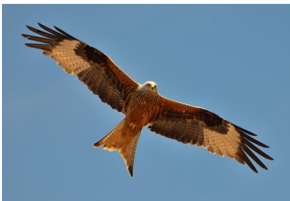
Slika 5. Crvena lunja u letu