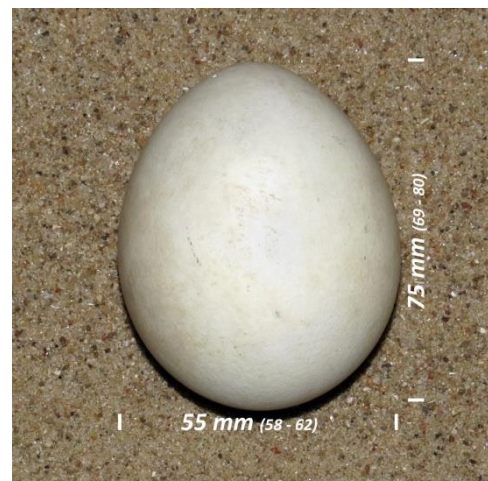
Slika 18. Jaje orla štekavca