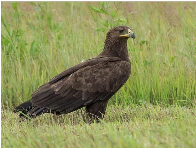
Slika 15. Orao klokotaš

Dosta je sličan orlu kliktašu, s tim da je nešto veći. Ova vrsta je duga od 65 – 72 cm, s rasponom krila od 157 – 179 cm, a tjelesna masa mu iznosi 1,6 – 2,5 kg. Srednje je veličine i ima široka krila koja završavaju dugim perima. Obično je crno-smeđe boje s kontrastnom žutom bojom. Ova vrsta ima kratak vrat, ali ima veliku, često prilično čupavu glavu, jak kljun i kratku zjapeću liniju s okruglim nosnicama. Krila su široka i nešto duža, dok je rep relativno kratak i zaobljen. Odrasli oraon na trtici ima svijetlu oznaku u obliku polumjeseca, dok je ostali dio tijela tamnije boje. Hrane se manjim sisavcima, uglavnom glodavcima, pticama, gmazovima, vodozemcima, krupnim kukcima i strvinom. Love na otvorenim područjima, ponajviše močvarama i vlažnim livadama. Obično love sporiji plijen koji napadaju na tlu. Često se pojavljuje u paru ili pojedinačno, ali zimi se ponekad javlja u malim do velikim jatima, osobito oko atraktivnog izvora hrane. Vrsta se često viđa pojedinačno u seobi, iako ponekad u dvoje, troje ili više. Monogamna je vrsta, za izgradnju gnijezda i brigu o mladima se obavezuju oba roditelja. Polazu se obično 2 jaja, iako najčešće samo jedan mladunac preživi. Inkubacija traje 42 – 44 dana, a ptici su sposobni za let nakon 60 – 65 dana. Ptici su o roditeljima ovisni još 20 – 30 dana. Zakonom o zaštiti prirode zaštićen je kao strogo zaštićena svojta. Na području Europe, uz izostanak Rusije, gnijezdi se tek oko 70 parova i to uglavnom u Poljskoj.