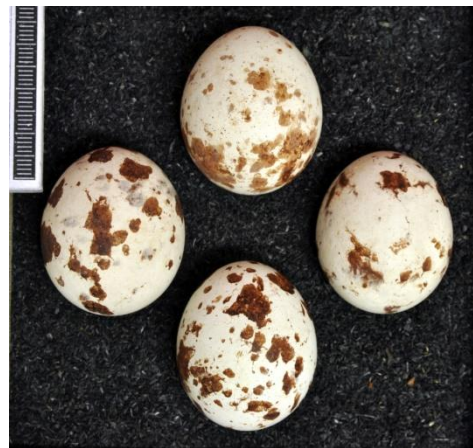
Slika 37. Jaja običnog kobca