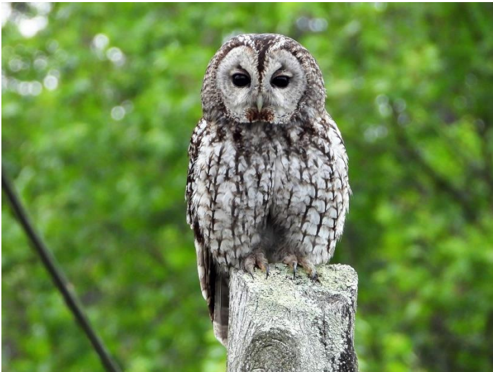
Slika 40. Šumska sova

To je vrsta ptice iz porodice sova (Strigidae). Duga je 37 do 46 centimetara, s rasponom krila od 81 do 105 cm. Prosječna težina je od 400 – 800 g, s tim da je ženka veća i znatno teža od mužjaka. Ima svjetlosmeđe do sivosmeđe tijelo s dosta pjega i tamnih pruga. Mitari se postupno između lipnja i prosinca. U sezoni gniježđenja imaju karakterističan zvuk lokomotive. Nastanjuje listopadne i mješovite šume, a ponekad je prisutna i u zrelim nasadima četinjača, preferirajući mjesta s pristupom vodi. Groblja, vrtovi i parkovi omogućili su joj da se proširi u urbana područja, ali izbjegava područja s visokom razinom buke noću. Gnijezda obično rade u dupljama stabala, napuštenim nastambama ili u pukotinama stijena, u periodu od ožujka do svibnja. U pologu je obično 4 – 5 jaja, na kojima ženka sjedi oko 30 dana. U tom periodu ženka ne napušta gnijezdo, nego mužjak lovi i donosi hranu. O mladima se brinu oba roditelja, koji se osamostaljuju nakon 4 – 5 tjedana, dok su za roditelje vezani još 3 mjeseca. Monogamni su i parovi ostaju zajedno cijeli život. Hrani se sisavcima, gmazovima, kukcima, žabama i manjim pticama. Aktivne su noću i pomoću svog sluha mogu uhvatiti plijen u potpunom mraku. Plijen osmatra s grana stabala, gdje miruje.