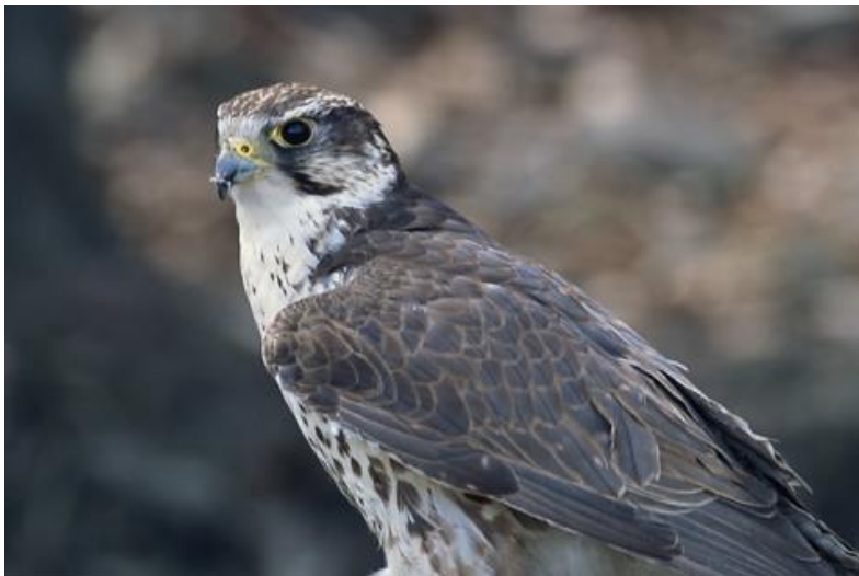
Slika 25. Stepski sokol