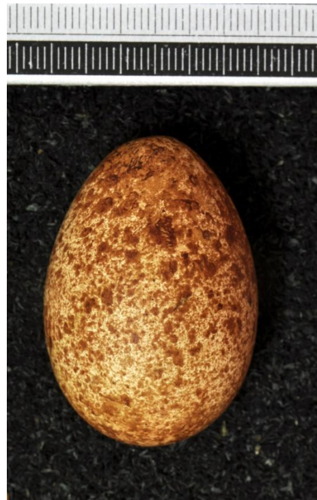
Slika 24. Jaje sokola lastavičara