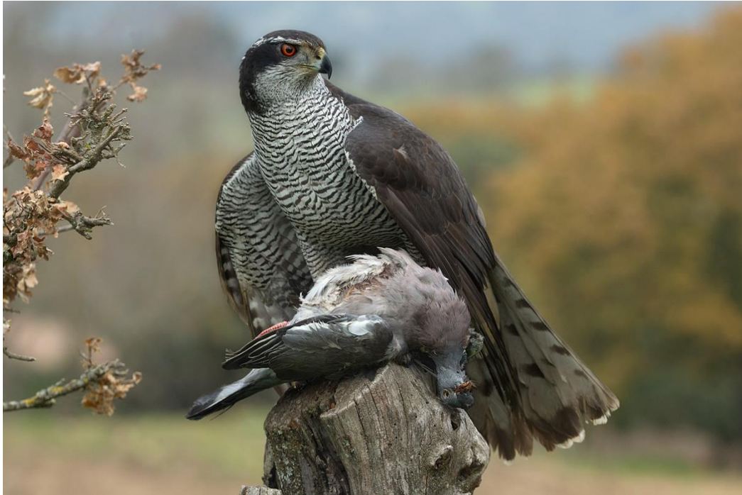
Slika 1. Jastreb s plijenom