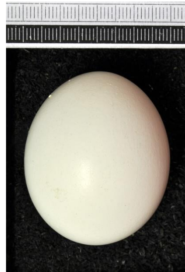
Slika 41. Jaje šumske sove