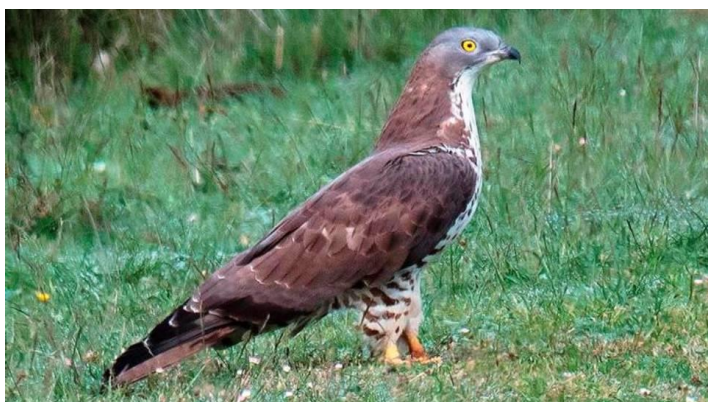
Slika 30. Škanjac osaš