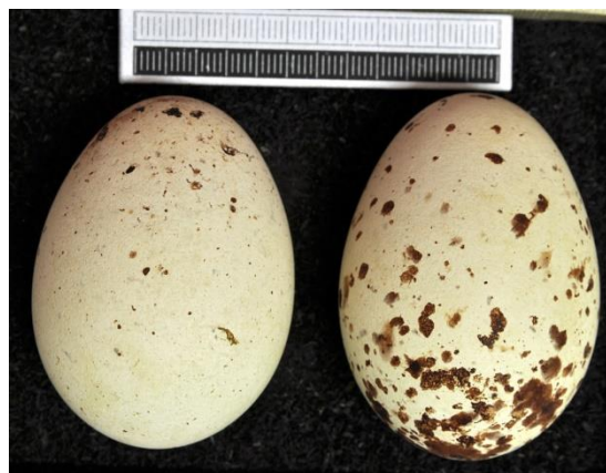
Slika 4. Jaje crne lunje