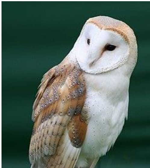
Slika 38. Mužjak kukurvije drijemavice