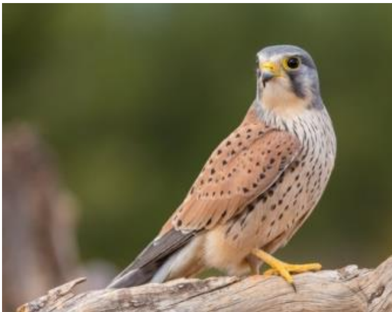
Slika 27. Vjetruša

To je najmanji sokol na području Hrvatske. Ima dužinu 32 – 39 cm, s rasponom krila od 65 – 82 cm. Ženke su u prosjeku teže od mužjaka. U gornjem dijelu tijela kod mužjaka je prisutna svjetlo – kestenasta boja s crnim pjegama, dok su im glava i rep sivo-plavi. Kod ženki su prisutne crne pruge na gornjem dijelu tijela. Hrani se uglavnom sitnim glodavcima, poljskim miševima i voluharicama, a u slučaju njihovog izostanka vjetruša se oslanja na sitne ptice poput štiglića, vrabaca ili sjenica. U procesu lova prvo lebdi u zraku na oko 10 – 20 m, pri tom osmatrajući plijen koji je na zemlji. Nakon toga se naglo spušta na nižu visinu, ponovno zastajući kako bi još jednom imala pregled situacije, a onda kreće u završni čin i lovi plijen. Najčešće naseljava stepске predjele i krajeve šuma, ali u posljednje vrijeme se često može naći i u gradskim sredinama gdje pravi gnijezda na krovovima viših zgrada. Pored toga, često se naseljavaju u gnijezda drugih ptica (vrane) ili ih grade u pukotinama litica. Parenje počinje u rano proljeće. U pologu je 3 – 6 jaja, a inkubacija traje približno do mjesec dana. Ptici ostaju ovisni o roditeljima još 4 do 5 tjedana, a spolno zreli postaju u sljedećoj sezoni parenja. U Hrvatskoj je brojna i široko rasprostranjena gnjezdarica te preletnica i zimovalica, te se s 9000 – 10000 gnjezdećih parova spada u najbrojniju gnjezdaricu među predatorskim pticama.