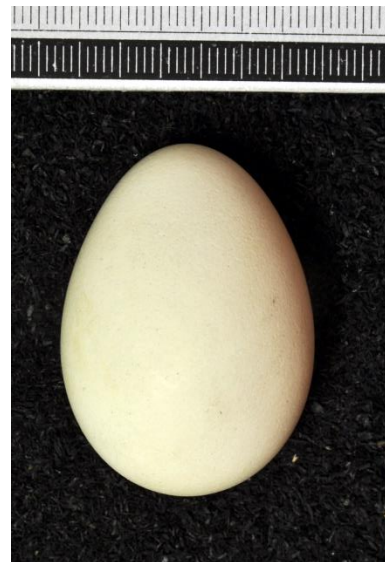
Slika 39. Jaje kukurvije drijemavice