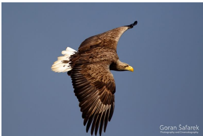
Slika 17. Orao štekavac u letu

Ova vrsta je jedna od najvećih živih ptica grabljivica, smatra se četvrtim najvećim orlom na svijetu. Duljina tijela je od 66 – 94 cm, s rasponom krila od 1,78 – 2,45 m. Općenito je sivkaste srednje smeđe boje. Perje je prilično ujednačeno na većem dijelu tijela i krila, ali su gornji pokrovi krila obično nešto bljeđi. Monogamni su, a parovi traju doživotno. Oba roditelja se brinu za gradnju gnijezda i o mladima. U pologu su obično 2 jaja, inkubacija traje 34 – 46 dana, a ptići su sposobni za let sa 70 do 90 dana. Od roditelja postaju neovisni u dobi od oko 4 mjeseca, a spolno zreli s 5 godina. Hrane se ribom, pticama vodaricama, sisavcima, često i strvinom. RIBE su obično najvažniji plijen. Plijen uglavnom traže iz niskog leta, obrušavaju se i pandžama ga grabe pri površini vode, a katkad ga napadaju i s motrilišta. Rjeđe ribu traže gacajući po plićaku. Vrlo rijetko napadaju ptice u letu. Hrane se i jajima kolonijalnih ptica (čaplji, galebova, vranaca i dr.). Najčešće love sami, ali ponekad i u paru, pogotovo kad su im plijen ptice vodarice. Otimaju plijen drugim grabljivicama i galebovima. Na razini Hrvatske danas je štekavac gnjezdarica samo u panonskom dijelu, najbrojniji u područjima Posavine (Lonjsko polje) i Podunavlja (Kopački rit).