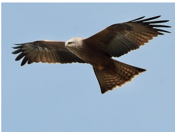
Slika 3. Crna lunja u letu