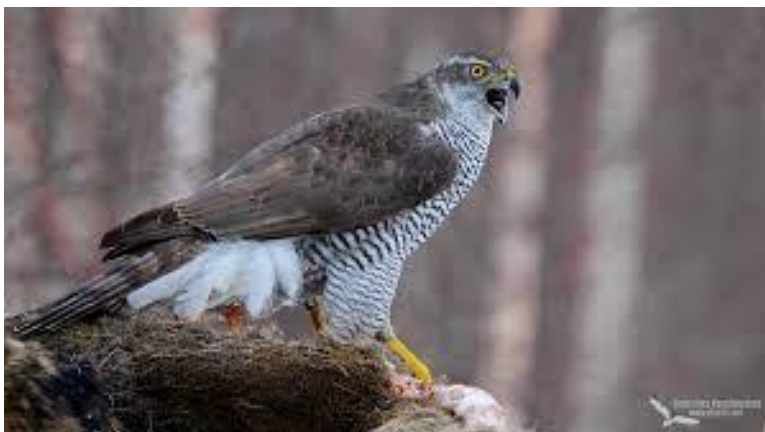
Slika 34. Obični jastreb