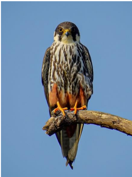
Slika 23. Sokol lastavičar