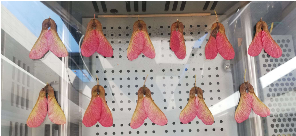
Slika 3. Acer tataricum L. subsp. tataricum – plodovi.