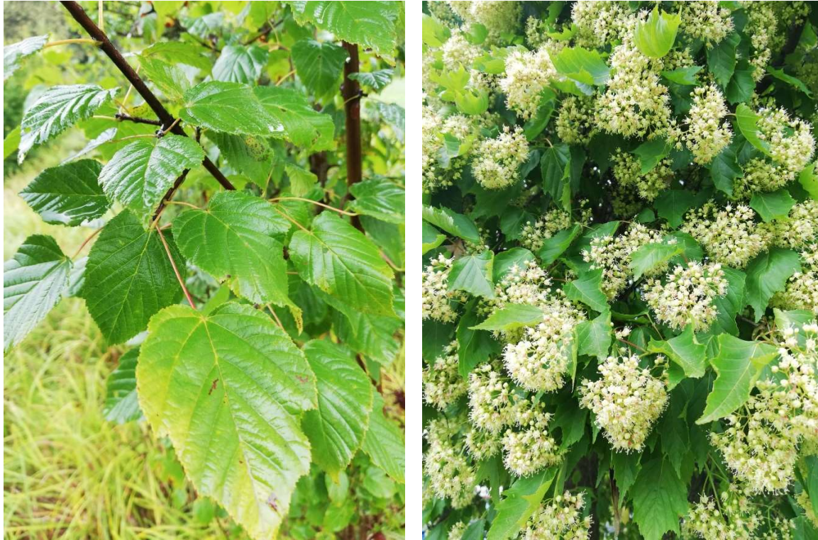
Slika 2. Acer tataricum L. subsp. tataricum – listovi i cvjetovi.