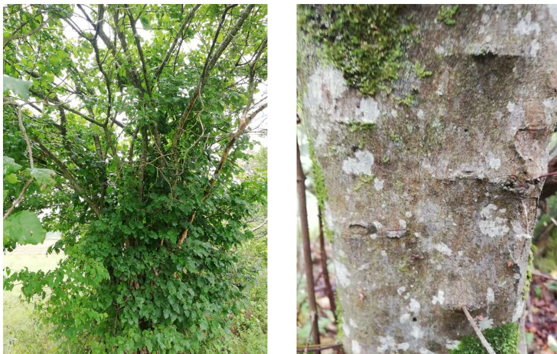
Slika 1. Acer tataricum L. subsp. tataricum – habitus i kora.

Kora javora žestilja dugo je vremena glatka, u mladosti svijetlosiva (slika 1), a tek kasnije poprimi tamniju nijansu te uzdužno ispuca. Pukotine se najprije javljaju na kori u području donjeg dijela debla te tamo ostaju najizraženije (Franjić i Škvorc 2010).