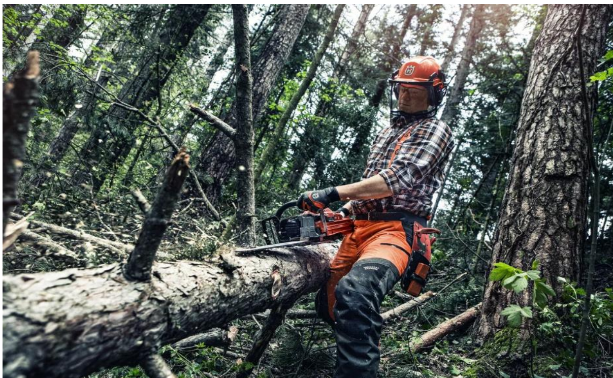
Slika 1. Šumski radnik sjekač

Uz sječu, u prvu fazu pridobivanja drva spada i izrada, a to je proces u kojem se posječeno stablo pretvara u drvene sortimente. Ona uključuje kresanje grana, razmjeravanje debela, prikrajanje, trupljenje, preuzimanje i obilježavanje drva. Uz izradbu drva vezane su i metode izradbe, koje određuju oblik drva koji se doprema (privlači) na pomoćno stovarište (stablovna, deblovna, sortimentna).