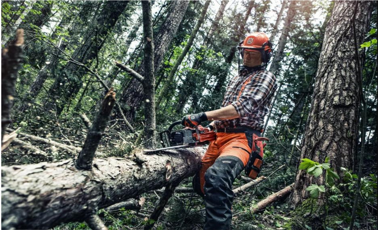
Slika 1. Šumski radnik sjekač

Uz sječu, u prvu fazu pridobivanja drva spada i izrada, a to je proces u kojem se posječeno stablo pretvara u drvene sortimente. Ona uključuje kresanje grana, razmjeravanje debla, prikrajanje, trupljenje, preuzimanje i obilježavanje drva. Uz izradbu drva vezane su i metode izradbe, koje određuju oblik drva koji se doprema (privlači) na pomoćno stovarište (stablovna, deblovna, sortimentna).