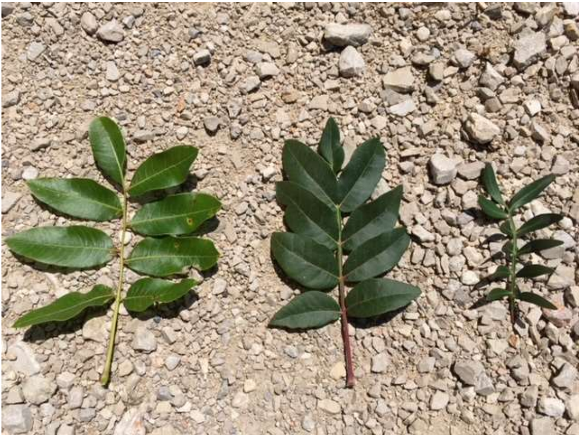
Slika 1. P. terebinthus (lijevo), P. x saportae (u sredini) i P. lentiscus (desno) (autor: Sandro Bogdanović).

Jadranski smrdelj dosad je nađen samo u jugozapadnoj Hrvatskoj, gdje raste kao endem istočnog Jadrana. Pridolazi na kamenitim vapnenačkim strminama i klisurastim odsjecima, najviše u prijelaznom području eumediterana i submediterana duž kopnene obale i nekih otoka od Kvarnera do Dubrovnika, npr. otoci Prvić, Sv. Grgur, Goli, jugoistočni Krk, velebitska obala Jurjevo-Prizna, Makarsko primorje, Pelješac i dr. Vrlo je otporna vrsta i uglavnom raste na najgorim olujnim burištima pod udarom jake posolice, na otvorenim obalnim strminama (Lovrić 1995).