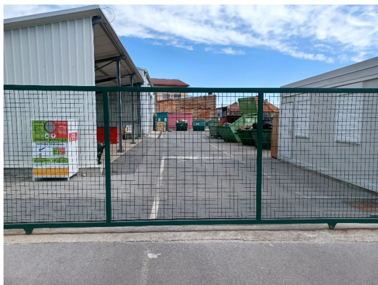
Slika 15. Reciklažno dvorište Bjelovar

Reciklažno dvorište ima tri zaposlenika. Radno vrijeme je od 07,00 do 18,00 sati radnim danom i od 08,00 do 13,00 sati subotom. Prilikom predavanja otpada, korisnici usluge moraju priložiti osobnu iskaznicu.