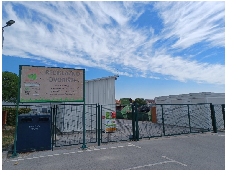
Slika 14. Reciklažno dvorište Bjelovar

Reciklažno dvorište nalazi se u ulici Tomaša Garika Masaryka. Započelo je s radom 1. lipnja 2016. godine. U reciklažnom dvorištu može se odložiti oko 50 vrsta otpada iz domaćinstva bez naknade. Na lokaciji reciklažnog dvorišta nalazi se nadstrešnica za skladištenje opasnog otpada i hala za prešanje, baliranje i skladištenje papira, kartona, folije i stiropora.