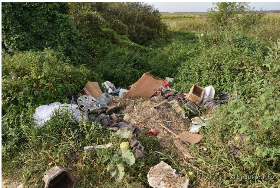
Slika 21. Nepropisno odložen otpad na lokaciji Malo Korenovo-Novi Pavljani, prije sanacije

2020. godine, na području grada i okolice, proveden je projekt „Zelena čistka“, kojom su sanirane četiri lokacije na kojima je zatečena veća količina nepropisno odbačenog otpada. To su Malo Korenovo-Novi Pavljani, Skucani, Ždralovi i Gudovac.