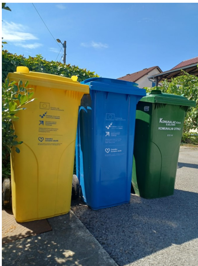
Slika 5. Spremnici za odvoz plastike, papira i komunalnog otpada