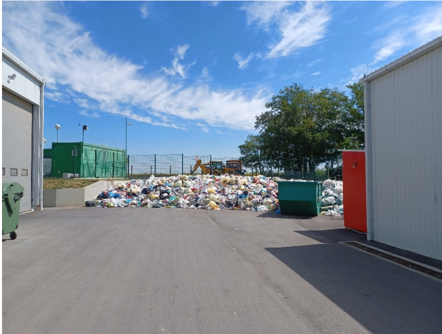
Slika 17. Reciklažno dvorište za posebne vrste otpada, prostor za plastiku