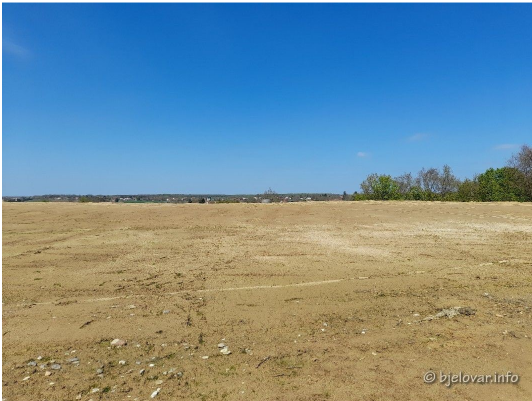
Slika 22. Sanirano odlagalište otpada Grginac-Veliko Trojstvo

Odlagalište otpada Grginac-Veliko Trojstvo bilo je službeno odlagalište neopasnog otpada za područje bivše općine Bjelovar. Ono ne spada u administrativno područje Grada, ali sanaciju provodi grad prema načelu „onečišćivač plaća“. Nalazi se na području općine Veliko Trojstvo, radi se o zatvorenom odlagalištu na koje je između 1970. i 1990. godine odloženo otprilike 178.000 t komunalnog i neopasnog otpada. Lokacija je zapravo bila neuređena površina, te je kao takva predstavljala opasnost od onečišćenja okoliša i nužno je bilo sanirati je prema Pravilniku o načinima i uvjetima odlaganja otpada, kategorijama i uvjetima rada za odlagališta otpada (NN 114/15) . Prilikom sanacije obavljani su radovi na brtvenom sloju i okolnom terenu, na odvodnji procjedne i oborinske vode. Formirani su pokosi na odlagalištu, napravljen je sustav prekrivanja i otplinjavanja, te je postavljena ograda. Radovi sanacije završeni su 23. travnja 2021. godine, te je time sanirano i trajno zatvoreno odlagalište. Nakon sanacije, grad provodi monitoring koji mora trajati najmanje 30 godina.