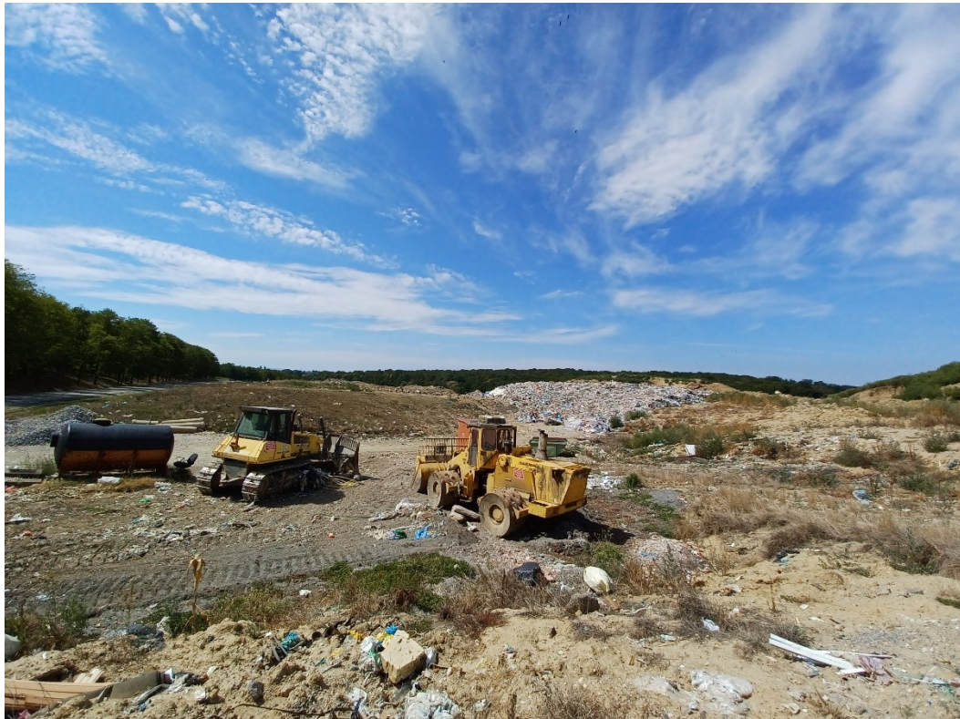
Slika 8. Prostor gdje se odlaže otpad, sa strojevima, odlagalište "Doline"

Teren na kojem se nalazi odlagalište izgrađen je od glinovitih, slabopropusnih i stabilnih materijala. Na tim materijalima formiran je donji brtveni sustav koji se sastoji od gline debljine veće od 6 m, HDPE folije, geotekstila i sloja drenaže. Brtveni sloj izgrađen je prema Pravilniku o načinima i uvjetima odlaganja otpada, kategorijama i uvjetima rada za odlagališta otpada (NN 114/15) pa nema opasnosti od prodiranja procjedne vode s odlagališta u podzemne vode.