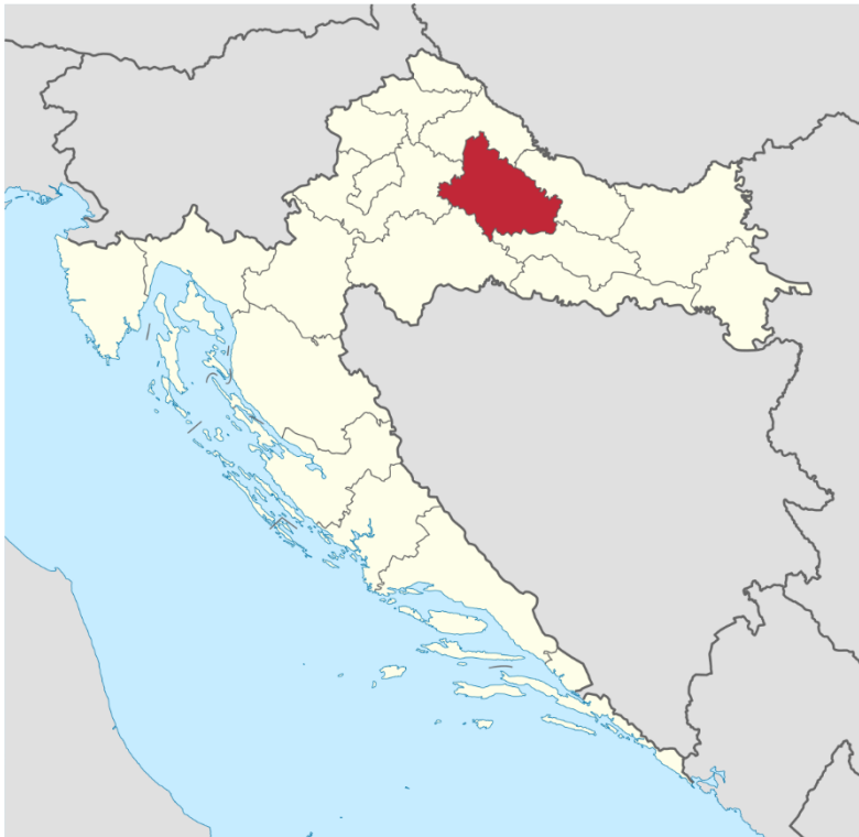
Slika 2. Položaj Bjelovarsko-bilogorske županije unutar granica RH

Grad Bjelovar jedan je od mlađih gradova Republike Hrvatske, osnovan 1756. godine. Središte je Bjelovarsko-bilogorske županije, te je smješten u sjeverozapadnom dijelu županije i najveći je od ukupno pet gradova (Bjelovar, Čazma, Daruvar, Garešnica, Grubišno Polje). Bjelovar je smješten u predjelu naplavnih ravnica potoka Bjelovacke i Plavnice te brežuljkastih predjela koji ih okružuju. Administrativno gradsko područje sastoji se od 31 naselja: Bjelovar, Breza, Brezovac, Ciglena, Galovac, Gornji Tomaš, Gudovac, Klokočevac, Kokinac, Kupinovac, Letičani, Mala Ciglena, Malo Korenovo, Novi Pavljani, Novoseljani, Obrovnica, Patkovac, Plavnice Gornje, Plavnice Stare, Prespa, Prgomelje, Prokljuvani, Puričani, Rajić, Stančići, Stari Pavljani, Tomaš, Trojstveni Markovac, Veliko Korenovo, Zvijerci i Ždralovi. Na području Grada Bjelovara, prema popisu stanovništva iz 2011. godine, živjelo je 40.276 stanovnika, što predstavlja 33,63% od ukupnog broja stanovnika Bjelovarsko-bilogorske županije i 0,94% od ukupnog broja stanovnika Republike Hrvatske.