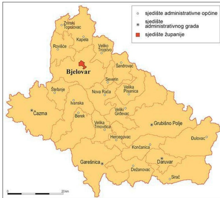
Slika 3. Položaj grada Bjelovara unutar Bjelovarsko-bilogorske županije