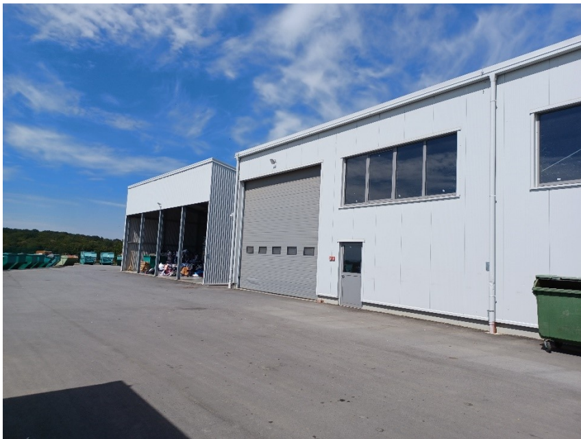
Slika 16. Reciklažno dvorište za posebne vrste otpada na lokaciji "Doline".

Prema posljednjim podacima iz 2011. godine, Grad Bjelovar ima 40.276 stanovnika, te jedno reciklažno dvorište nije dovoljno za količine otpada koje se stvaraju. Prema Zakonu o gospodarenju otpadom svaka jedinica lokalne samouprave koja ima više od 1.500 stanovnika mora osigurati najmanje jedno reciklažno dvorište i za svakih idućih 25.000 stanovnika jedno novo. Stoga je izgrađeno još jedno reciklažno dvorište, na lokaciji odlagališta neopasnog otpada „Doline“. Izgradnja je planirana na temelju Generalnog urbanističkog plana Grada Bjelovara II. Izmjena i dopuna („SGGBJ“ br.6/12) . Završetak gradnje planiran je za 2019. godinu, no reciklažno dvorište za posebne vrste otpada u funkciji je od 2020. godine.