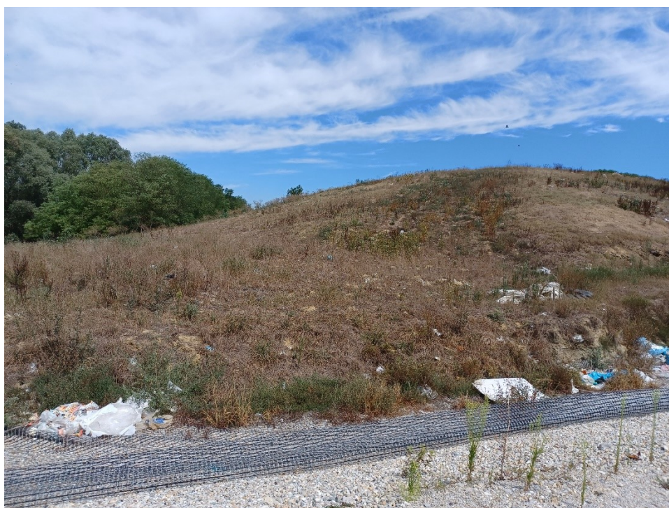
Slika 11. Sanirani dio odlagališta "Doline"