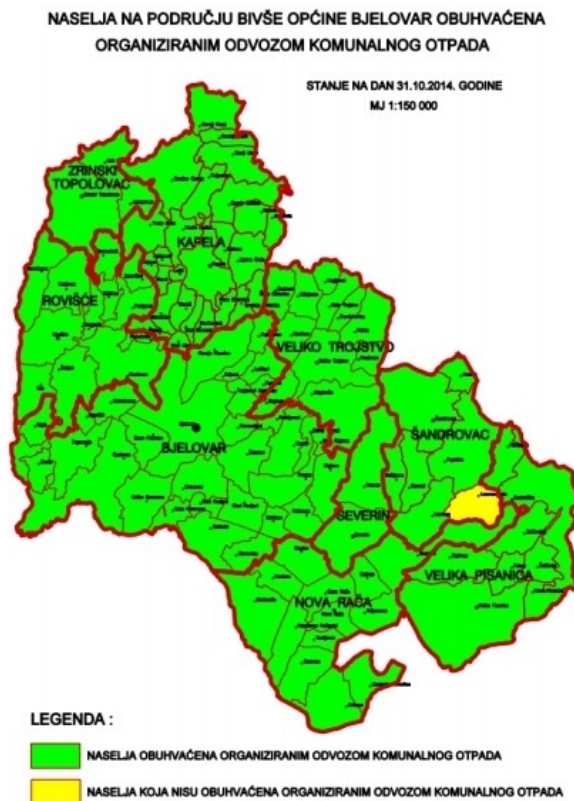
Slika 4. Naselja obuhvaćena organiziranim odvozom komunalnog otpada

Lokacija za trajno odlaganje otpada na ovom području je uređeno odlagalište neopasnog otpada „Doline“, na tom odlagalištu odlaže se otpad s područja Bjelovara i 8 općina (Kapela, Nova Rača, Rovišće, Severin, Šandrovac, Velika Pisanica, Veliko Trojstvo i Zrinski Topolovac). Otpad iz grada organizirano se odvozi dva puta tjedna, dok iz naselja sa šireg područja jedan put tjedno. Odvoz komunalnog otpada iz gospodarstva provodi se jednom do šest puta tjedno, odnosno po potrebi. Odvoz otpada iz grada i navedenih 8 općina provodi se iz 17243 kućanstva, što obuhvaća 85,85% ukupnog broja domaćinstava. Što se tiče okolnih naselja, odvoz otpada provodi se iz 112 od ukupno 113 naselja, što je 99,12% naselja.