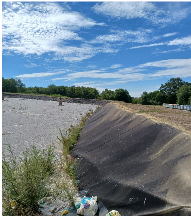
Slika 13. Prošireni dio odlagališta u izgradnji