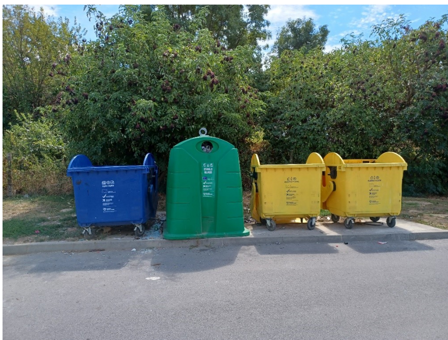
Slika 6. Primjer zelenog otoka, Radničko naselje, Bjelovar