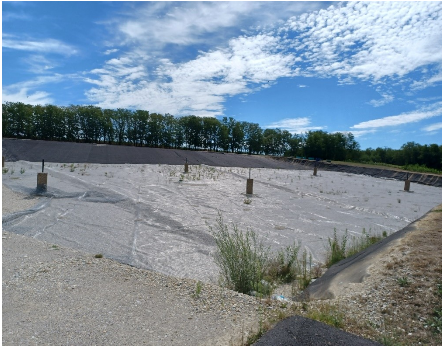
Slika 12. Prošireni dio odlagališta u izgradnji