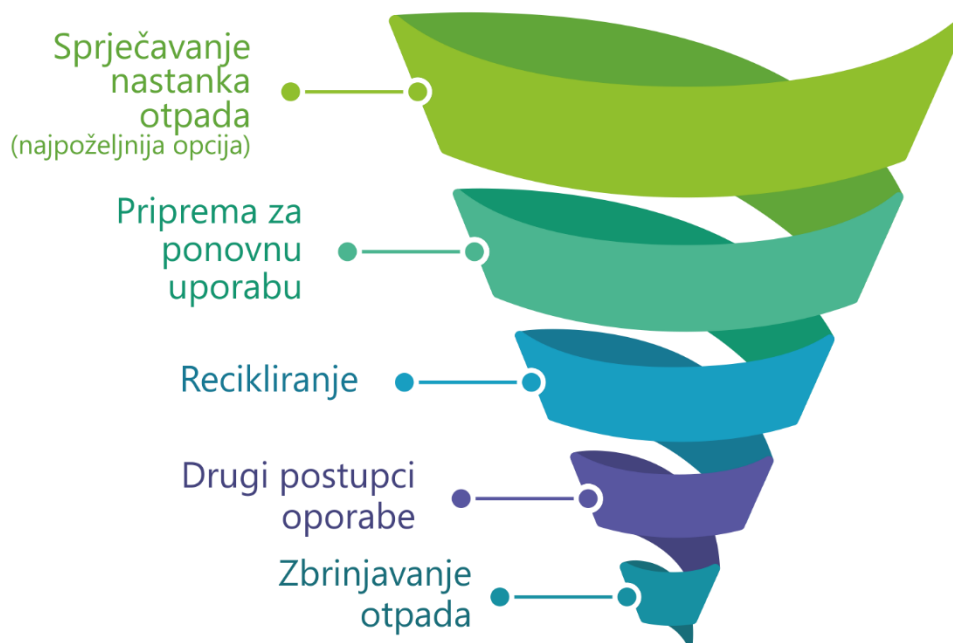
Slika 1. Red prvenstva gospodarenja otpadom

Na dnu reda prvenstva nalazi se zbrinjavanje otpada kao najmanje poželjna opcija, zatim slijede drugi postupci uporabe, na što se odnosi na primjer, energetska uporaba. Recikliranje, odnosno postupak kojim se otpad prerađuje u proizvod, tvar ili materijal koji može imati izvornu ili novu svrhu, jest na trećem mjestu. Zatim je priprema za ponovnu uporabu kao jedna od poželjnijih opcija. To su postupci uporabe kojim se proizvodi pripremaju za ponovnu uporabu bez dodatne obrade. I na prvom mjestu jest sprječavanje nastanka otpada što uključuje mjere smanjivanja količine otpada ponovnom uporabom ili korištenjem mjera kojima se produžuje životni vijek proizvoda.