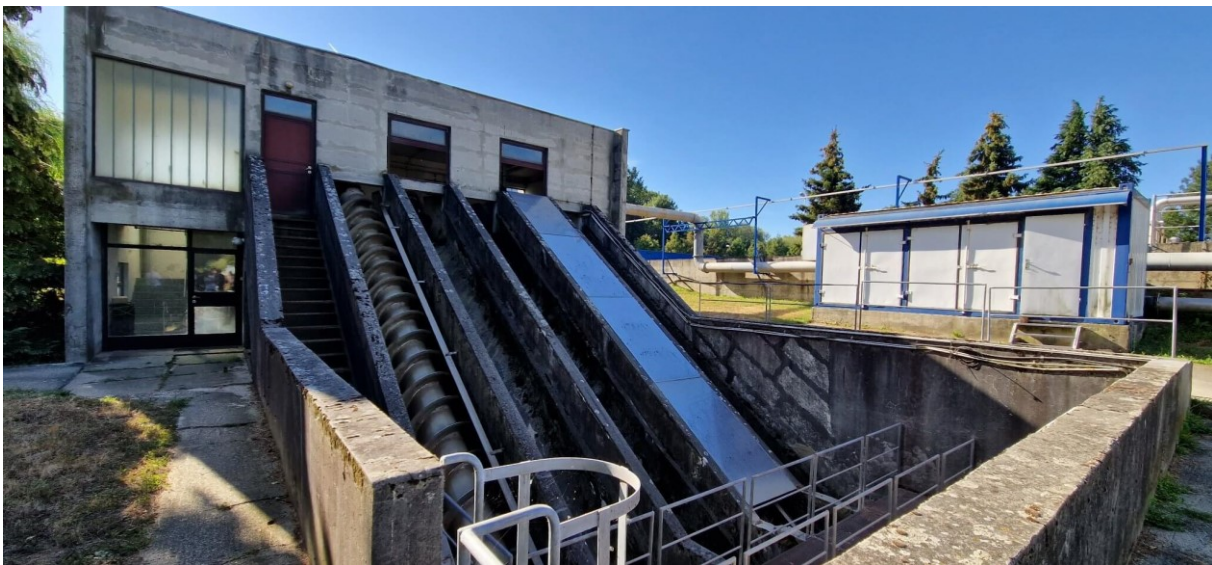
Slika 23. Crpna stanica uređaja za pročišćavanje otpadnih voda, Veliko Korenovo

taložnika, dvije taložnice i zemljane lagune za aerobnu i anaerobnu stabilizaciju viška mulja. Unutar sustava gospodarenja otpadnim muljem treba utvrditi mogućnost primjene na površinama koje su pogodne za primjenu mulja. Za korištenje na poljoprivrednom zemljištima postoje određena ograničenja. Može se koristiti na površinama koje se ne koriste za proizvodnju hrane, te je zabranjeno koristiti mulj u ekološkoj i integriranoj proizvodnji. Ako se koristi u poljoprivredi, prethodno mora biti kompostiran i stabiliziran, a sadržaj teških metala i drugih štetnih tvari mora biti u skladu sa Pravilnikom o zaštiti poljoprivrednog tla od onečišćenja (NN 9/14) i Pravilnikom o gospodarenju muljem iz uređaja za pročišćavanje otpadnih voda kad se mulj koristi u poljoprivredi (NN 38/08) .