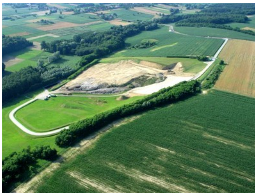
Slika 7. Odlagalište otpada „Doline“, prikaz iz zraka

Odlagalište neopasnog otpada „Doline“ službeno je odlagalište na području Grada Bjelovara. Zbrinjava se otpad s područja grada i područja osam općina (Kapela, Nova Rača, Rovišće, Severin, Šandrovac, Velika Pisanica, Veliko Trojstvo i Zrinski Topolovac). Odlagalište je u funkciji od 16.11.1998., te je prvo odlagalište u Republici Hrvatskoj koje je izgrađeno u skladu s važećim zakonskim propisima, poštujući sve mjere zaštite prirode i okoliša. Smješteno je jugoistočno od centra grada, između naselja Ždralovi i Stari Pavljani, te je od centra grada udaljeno 5 km. Mala Prespa je naselje koje se nalazi najbliže odlagalištu, na udaljenosti 500 m.