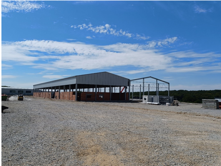
Slika 19. Sortirnica u izgradnji

Građevina za gospodarenje otpadom u kojoj se razvrstava, mehanički obrađuje i skladišti odvojeno prikupljeni komunalni otpad naziva se postrojenje za sortiranje odvojeno prikupljenog otpada, odnosno sortirnica. U planu je izgradnja takvog postrojenja na lokaciji odlagališta neopasnog otpada „Doline“. Imat će kapacitet za obradu do 10.000 t komunalnog otpada godišnje. Obrađivat će se prikupljeni komunalni otpad, te prikupljeni korisni otpad dovezen na reciklažno dvorište. U sortirnici obrađivat će se: papir koji će se odvajati na karton i bijeli papir, plastika koja će se odvajati na bijelu i šarenu foliju, tvrdi plastiku, HD boce, PET, metalna ambalaža koja će se odvajati na metalnu i aluminijsku, lampioni od kojih će se odvajati plastični dio i metalni poklopac, tetrapaci (čišćenje od nečistoća) i drugi korisni sastojci. Građevina je upisana u Prostorni plan Grada Bjelovara („Službeni glasnik Grada Bjelovara“ br. 11/03, 13/03-ispr., 01/09, 08/13, 1/16 i 5/16).