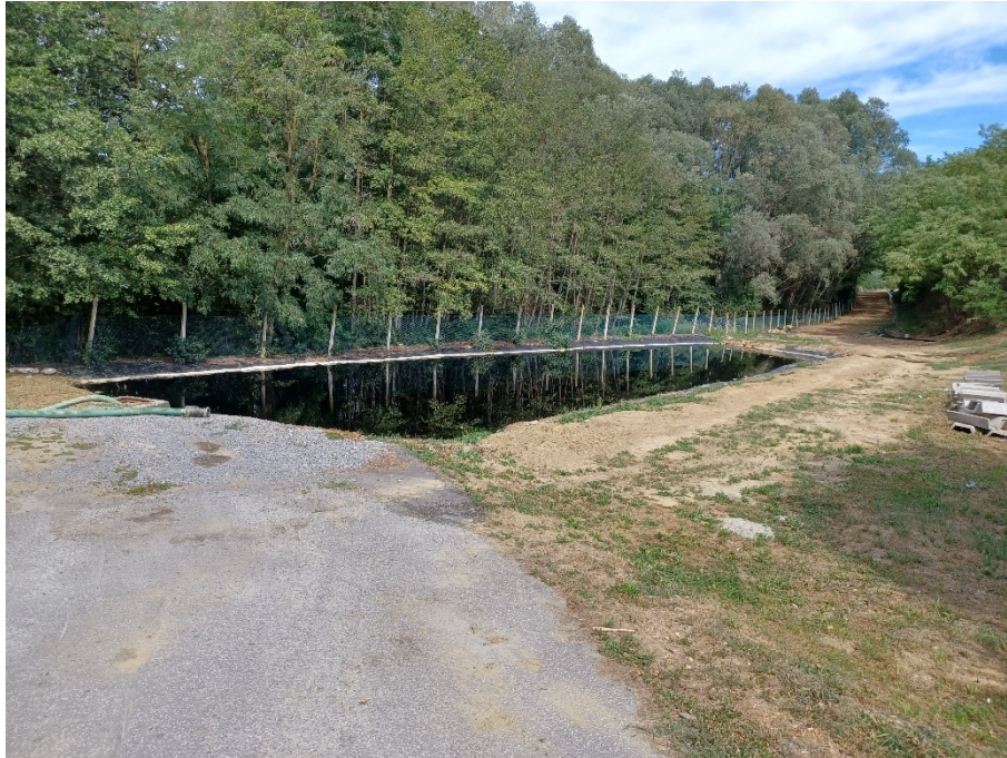
Slika 9. Sabirni bazen na odlagalištu "Doline"

Na odlagalištu provode se sve potrebne mjere za stručno odlaganje, sabijanje otpada, zatim obradu procjedne vode, ali i oborinske vode. Osim toga, provode se i mjere zaštite od požara i eksplozija koje provode čuvarska služba i osigurani protupožarni pojas. Redovito se prati stanje okolnog područja, obavezno se vode očevidnici o odlaganju, te se provodi dezinfekcija i deratizacija.