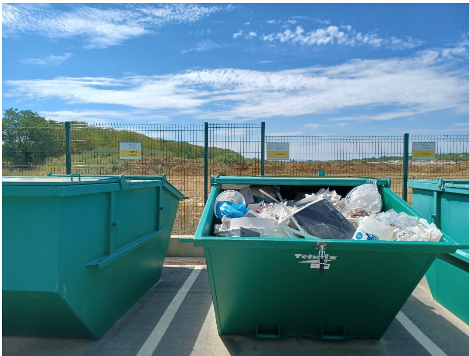
Slika 18. Reciklažno dvorište za posebne vrste otpada, spremnici za svaku vrstu otpada