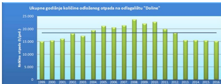
Slika 10. Grafički prikaz godišnjih količina otpada odloženog na odlagalištu „Doline“

Na odlagalištu „Doline“ odlaže se otpadni materijal iz domaćinstva i proizvodni neopasni otpad u što se ubrajaju materijali neprikladni za potrošnju ili preradu, ambalaža od plastike, drvo, ostaci na sitinama i grabljama, otpad iz pjeskolova, ostali otpad od mehaničke obrade otpada, miješani komunalni otpad, otpad s tržnica i ostaci od čišćenja ulica. Prema podacima iz 2016. godine, na odlagalištu je odloženo 15.146 t otpada. Za odlagalište je na temelju Stručne podloge zahtjeva za ishodenje okolišne dozvole odlagalište otpada izdana Okolišna dozvola (KLASA: UP/I 351-03/13-02/11; URBROJ: 517-06-2-2-1-14-36; Zagreb, 1. lipnja 2015.g) prema kojoj se obavlja prihvata otpada na lokaciji. (IPZ Uniprojekt TERRA d.o.o., Zagreb, veljača 2014.)