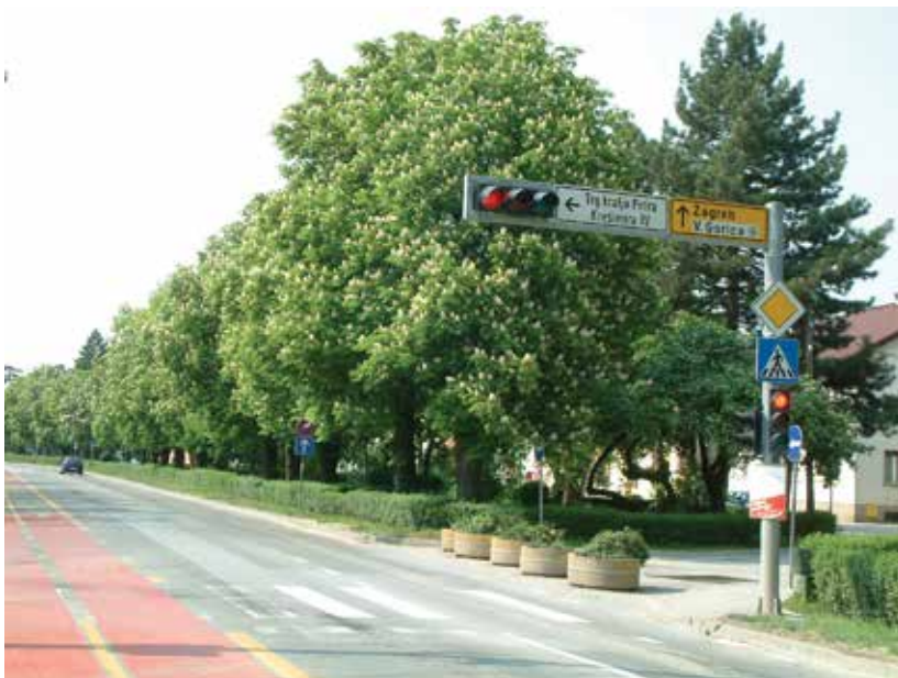
SLIKA 9. Drvored divljeg kestena u današnjoj Zagrebačkoj ulici u Velikoj Gorici iz 2013. godine