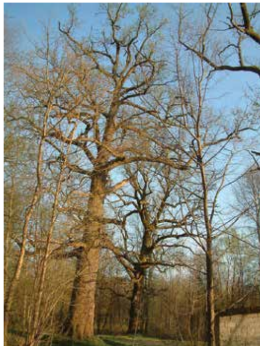
SLIKA 4. Skupina starih hrastova na Vratovu u Turopoljskom lugu iz 2011. godine

Dendrološkom determinacijom utvrđeno je kako je riječ o malolisnoj lipi ( Tilia cordata Mill.). Lipa se nalazi na čestici