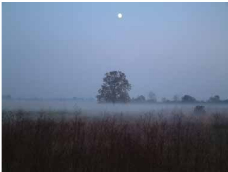
SLIKA 10. Odransko polje kao područje važno za divlje svojte i stanišne tipove iz 2008. godine