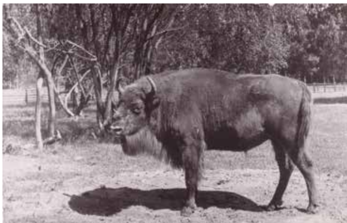
SLIKA 2. Europski bizon zvani „žubr“ u Poljskoj

aluvijalnoj ploči dužoj 45, a širokoj do 23 km, koje zauzima područje od oko 600 km 2 , s prosječnom visinom od 110 metara nadmorske visine. Turopoljska aluvijalna ploča nalazi se između Posavine (močvarnije nizine uz rijeku Savu) na sjeveru i Vukomeričke gorice (niskog zaravnjenog gorja) na jugu. Kroz Turopoljsku nizinu teče rijeka Odra s pritokom Lomnicom.