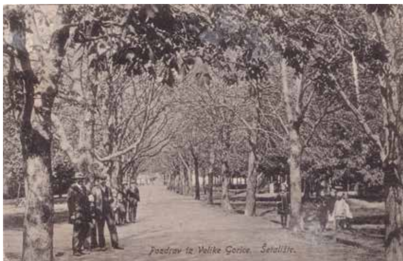
SLIKA 7. Park uz crkvu Navještenja Blažene Djevice Marije u središtu Velike Gorice iz 1917. godine