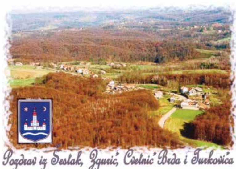
SLIKA 11. Vukomeričke gorice - Zgurić Brdo i Cvetnić Brdo kao područja važna za divlje svojte i stanišne tipove