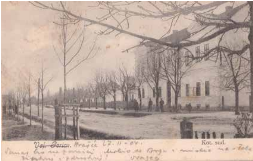
SLIKA 8. Drvored divljeg kestena u današnjoj Zagrebačkoj ulici u Velikoj Gorici iz 1904. godine