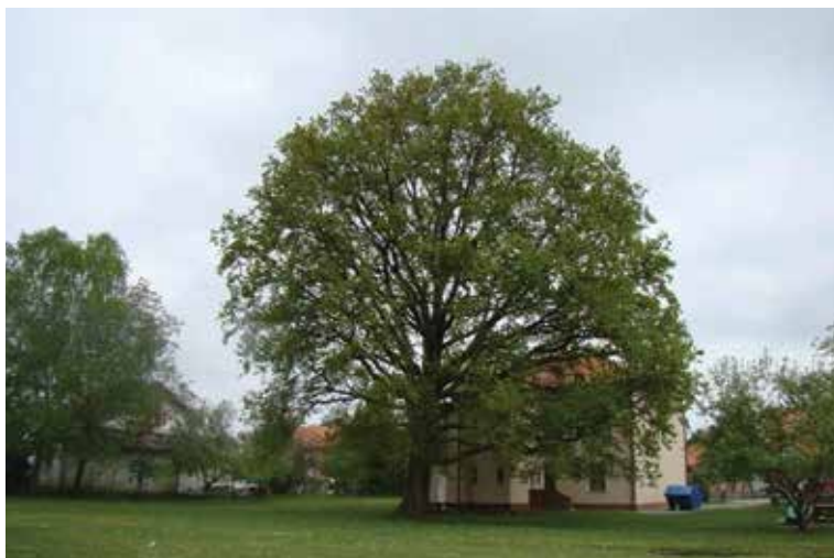
SLIKA 3. Hrast lužnjak u dvorištu područne škole u Rakitovcu 2018. godine

Za potrebe pisanja diplomskog rada na diplomskom studiju Urbano šumarstvo, zaštita prirode i okoliša na Sveučilištu u Zagrebu Šumarskom fakultetu, na hrastu su izvršena su slijedeća promatranja i mjerenja: fenologija, vaganje pojedinačnih žireva, izračun mase 1000 zračno suhih sjemenki, morfometrija žireva, okularna procjena kvalitete žireva, pro-