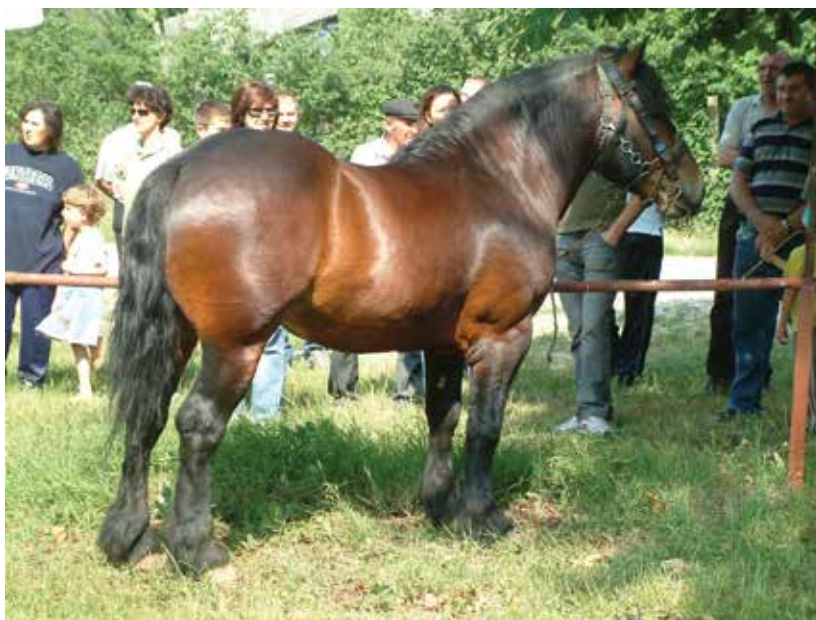
SLIKA 16. Hrvatski posavac na izložbi konja na prostoru stočnog sajma u Velikoj Gorici 2007. godine