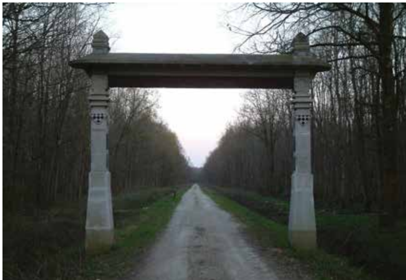
SLIKA 12. „Vrata od Krča“ u Turopoljskom lugu iz 2011. godine

like Gorice. Koristi od šumskog kompleksa većeg od 2000 ha, očituju se u radijusu od 50 km, što bi značilo kako i grad Zagreb ima koristi od prostranih šuma Turopolja. S obzirom na udaljenost od grada Velike Gorice, Turopoljski lug može se u budućnosti kategorizirati kao urbana šuma, ponajprije za odmor i rekreaciju građana. Boravkom u prirodnoj šumi u trajanju od samo 30 minuta umanjuje stres kod ljudi za 16 posto. Turopoljski lug se spominje već 1249. i 1255. godine pod nazivom Velika šuma (povelja bana Stjepana). Turopoljci 1779. godine u velikom Turopoljskom lugu iskrčiše šikaru i tlo pretvoriše u plodnu oranicu. U slavu pobjede čovjeka nad divljom prirodom podigoše "Vrata od Krča" (slika 12.), drveni turopoljski slavoluk civilizaciji. "Ovdje su rascvjetane livade plemenitih Turopoljaca koje su, ti-