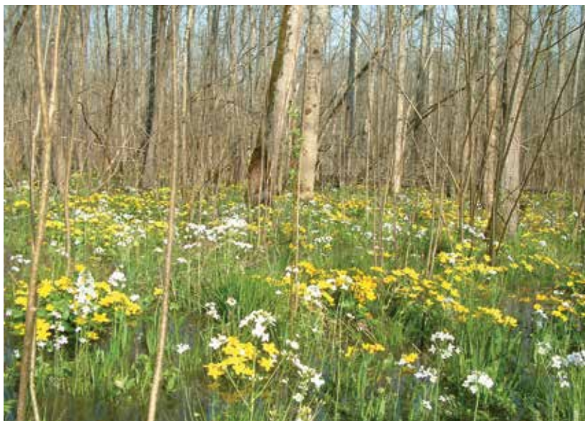
SLIKA 14. Depresije i dolovi na kojima rastu mlade jasenove sastojine snimljeno u proljeće 2009. godine

U proteklih 40. godina nije bilo velikih promjena ukupne površine. Neobraslo proizvodno i poljoprivredno zemljište su smanjivani zbog pošumljavanja istih. U tablici 2. Prikazane su institucije nadležne za pojedine segmente zaštite prirode.