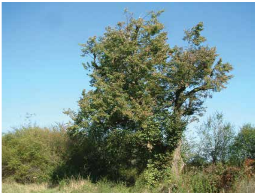
SLIKA 6. Stara lipa kod kurije Josipović u Kurilovcu iz 2019. godine