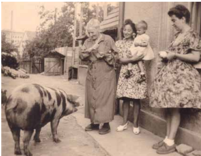
SLIKA 15. Turopoljska svinja snimljena u Novom Čiću na staroj fotografiji