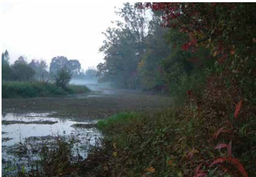
SLIKA 13. Prirodni tok rijeke Odre iz jeseni 2011. godine

Danas na ovom području razlikujemo tri cjeline: 1. očuvani kompleks poplavnih šuma hrasta lužnjaka-Turopoljski lug, 2. vlažne livade uz rijeku Odru te 3. prirodni tok rijeke Odre (slika 13.).