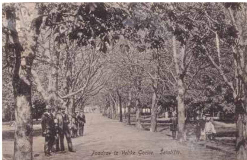
SLIKA 7. Park uz crkvu Navještenja Blažene Djevice Marije u središtu Velike Gorice iz 1917. godine