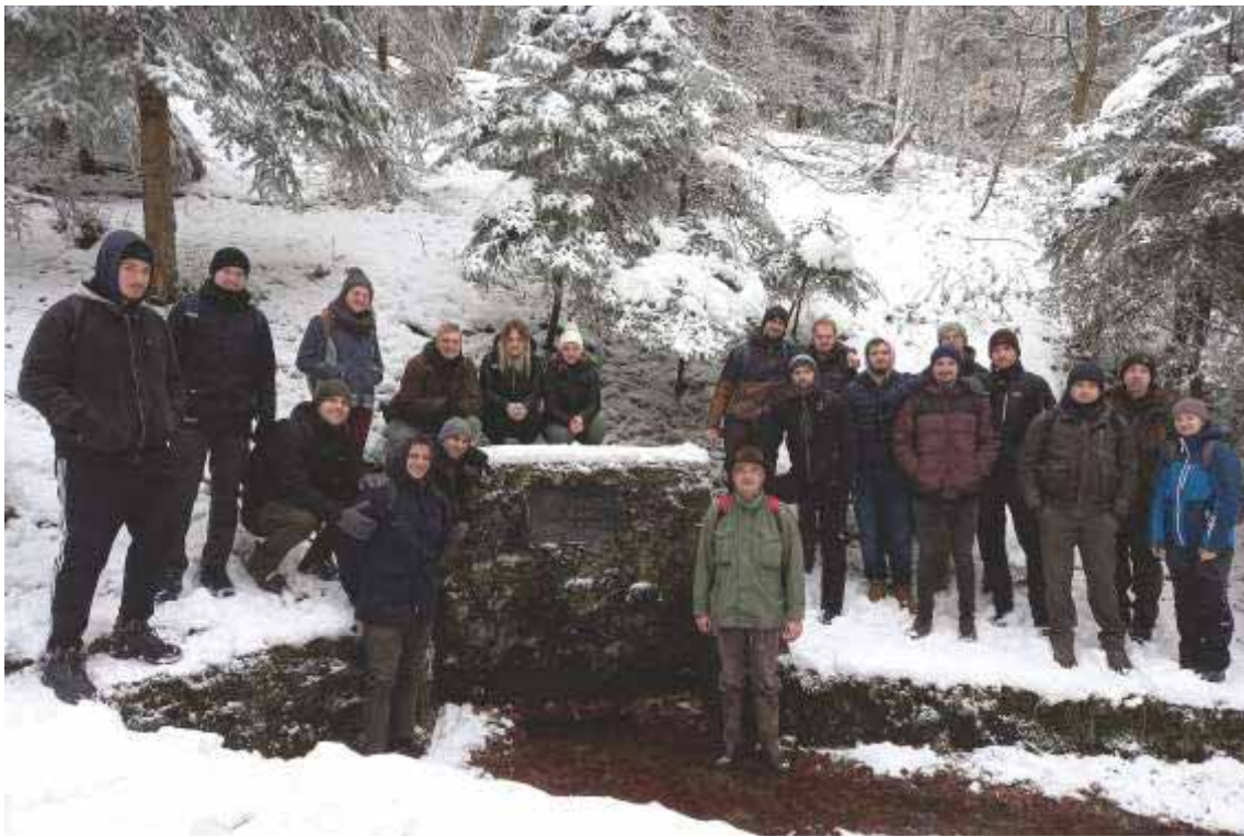
Slika 64 Terenska nastava iz Uzgajanja šuma na Medvednici pored Mićinog vrela posvećenog akademiku Milanu Aniću 2021. godine