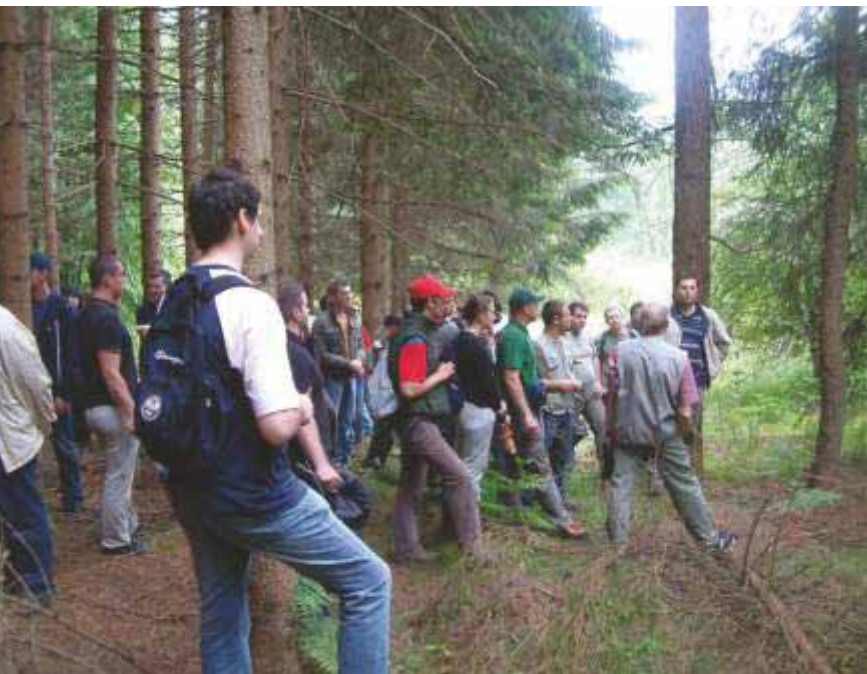
Slika 25 Prof. dr. sc. Milan Oršanić vodi terensku nastavu iz Osnivanja šuma u Bosiljevu 2007. godine

Savjeta Sveučilišta u Zagrebu (2015. – 2018.). Predsjednik je Upravnog vijeća Hrvatskoga šumarskog instituta od 2018. godine. Bio je član Upravnog vijeća Hrvatskoga geološkog instituta (2009. – 2012.) i Odbora za proračun Sveučilišta u Zagrebu (2014. – 2018.). Član je Nacionalnog vijeća za znanost, obrazovanje i tehnološki razvoj Republike Hrvatske od 2021. godine. Član je uredništva znanstvenih časopisa Šumarski list, Croatian journal of forest engineering i Glasnik za šumske pokuse. Dobitnik je posebne nagrade Rektora Sveučilišta u Zagrebu za rad u sveučilišnim tijelima i Velike medalje Mendelova sveučilišta u Brnu. Godine 2015. Šumarski fakultet Sveučilišta u Zagrebu dodijelio mu je priznanje za uvođenje sustava kvalitete.