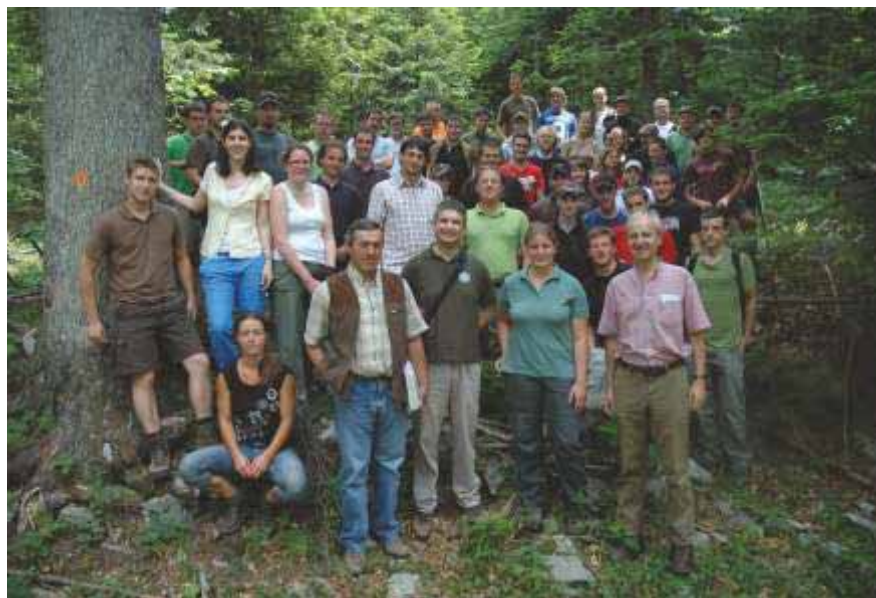
Slika 72 Studenti i profesori šumarskog odjela Sveučilišta BOKU iz Beča na terenskoj nastavi na području Šumarije Ravna gora 2010. godine

i Kanade. Puno je međunarodnih i domaćih znanstvenih skupova u čijoj je organizaciji neposredno sudjelovao netko od članova Zavoda, kao predsjednik ili član organizacijskog ili znanstvenog odbora. Zavod je vodio organizaciju najvećeg međunarodnog skupa održanog na Šumarskom fakultetu u Zagrebu, svjetskog kongresa o uzgajanju hrastovih šuma i genetici hrastova (IUFRO International scientific conference OAK – 2000: Improvement of wood quality and genetic diversity of oaks, Zagreb, 20. – 25. 5. 2000.).