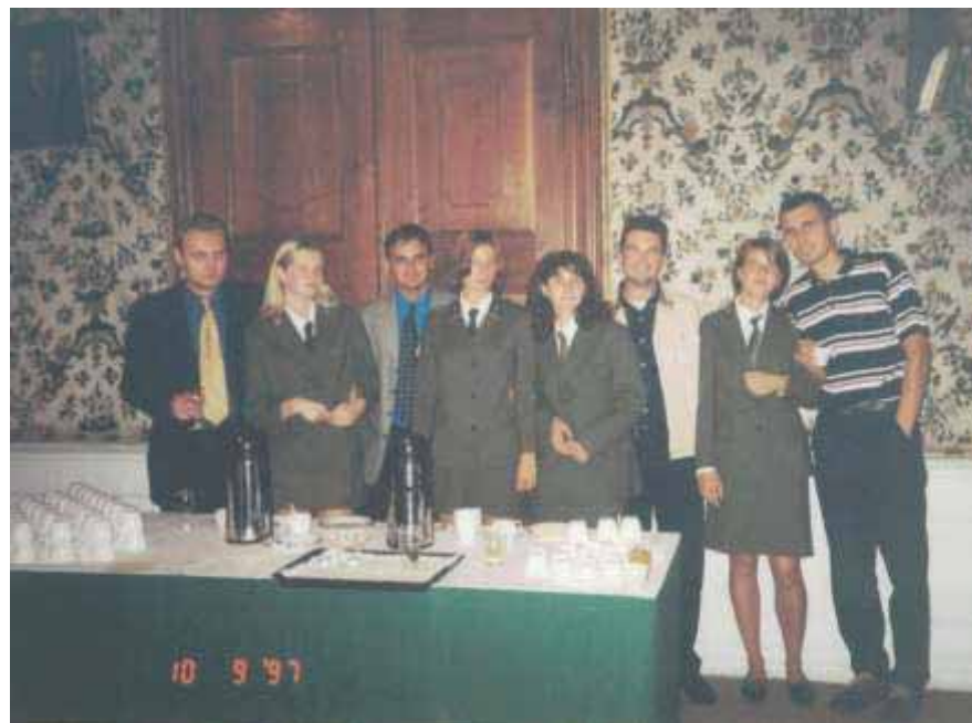
Slika 76 Domaćice međunarodnog znanstvenog skupa i asistenti šumarskog fakulteta u Banskjoj Štiavnici 1997. godine