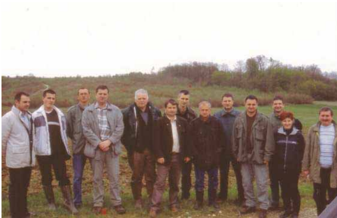
Slika 61 Zajednička terenska nastava na području Šumarije Križevci 2002. godine