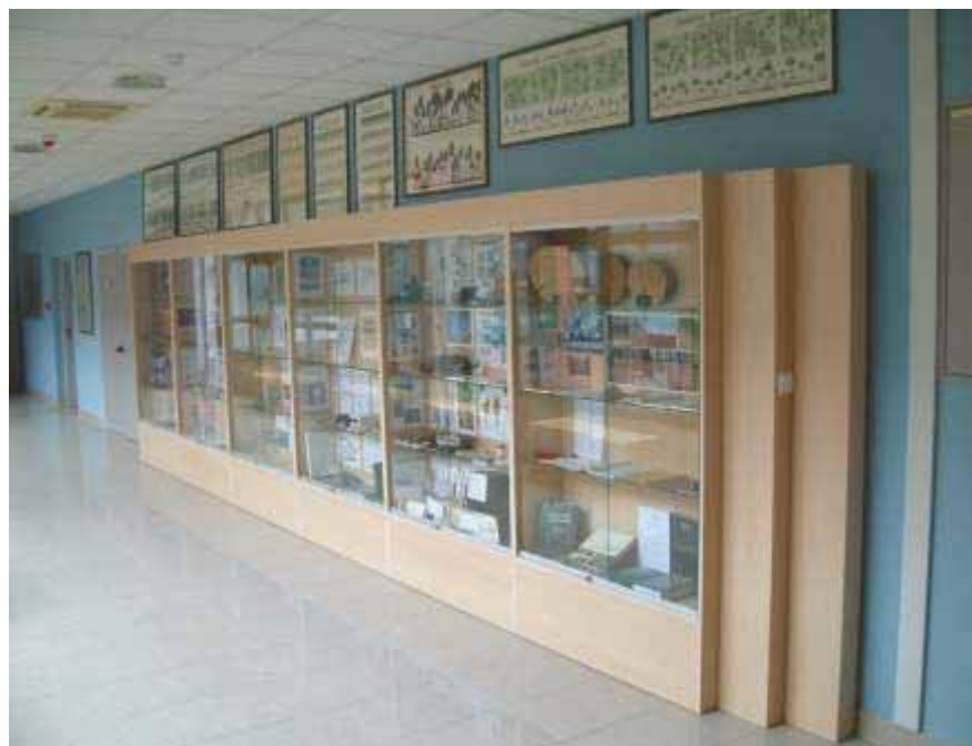
Slika 80 Vitrine u hodniku Zavoda iz pojedinih kolegija ispunjene edukativnim materijalom namijenjenim studentima za lakše savladavanje gradiva

i istočne strane smješteni: petrološka zbirka, parcijalna zbirka monolita tala, izložci laboratorijskog pribora i izložci koji se odnose na arborikulturu.