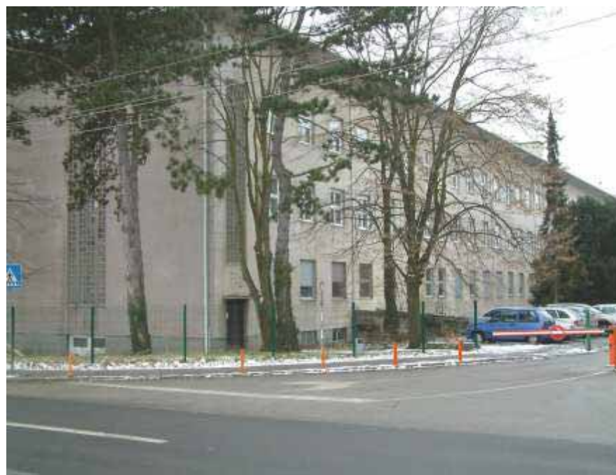
Slika 2 Stara zgrada današnjeg Fakulteta šumarstva i drvne tehnologije u kojoj se nalazio Zavod za ekologiju i uzgajanje šuma do 2007. godine

Zavod se nalazio u Šumarskom domu, u Vukotinovićevoj ulici 2 (4 sobe) do 1946., kada je preseljen u zgradu Poljoprivredno-šumarskog fakulteta poznatiju kao IV. paviljon, u Svetošimunskoj ulici 25. U toj je zgradi Zavodu pripadalo 12 soba na prvom katu lijevog krila. Tijekom lipnja i srpnja 2007. godine obavljeno je drugo preseljenje Zavoda u novu zgradu Šumarskoga odsjeka koja se nalazi u Svetošimunskoj ulici 23. Zavod je smješten u prizemlju i na prvom katu smeđeg krila zgrade.