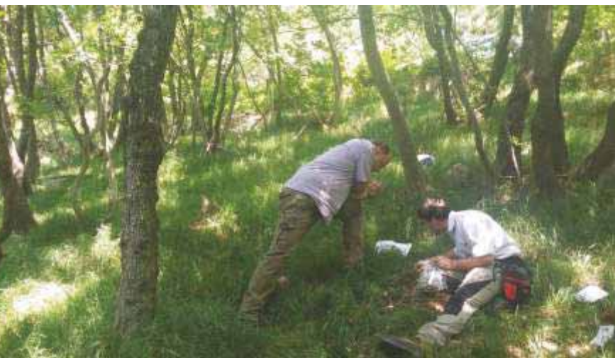
Slika 71 Kao dio međunarodne suradnje s profesorima našeg Zavoda dr.sc. Giacomo Mei sa Sveučilišta u Anconi (Italija) prikuplja biljni materijal na području Velebita 2018. godine

skupova, zajedničke organizacije i obavljanja nastave, poglavito na poslijediplomskim studijima (specijalističkom i doktorskom), sudjelovanja u radu različitih povjerenstava.