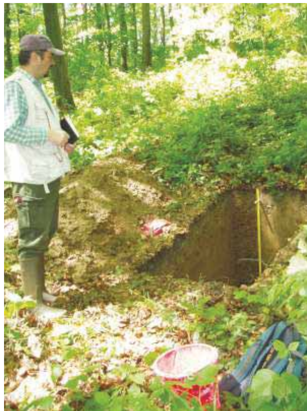
Slika 48. Prof. dr. sc. Nikola Pernar na terenskom istraživanju tla na Bilogori 2005. godine

šumskih tala i Sanacija degradiranih terena na dva diplomatska studija. Također izvodi nastavu iz 6 predmeta na doktorskom studiju i specijalističkim studijima. Na Šumarskom fakultetu obnašao je dužnost predstojnika Zavoda za istraživanje u šumarstvu i predstojnika Zavoda za ekologiju i uzgajanje šuma, bio je predsjednik Vijeća biotehničkog područja, član Senata Sveučilišta u Zagrebu i Područnog vijeća za biotehničke znanosti Nacionalnog vijeća za znanost, visoko obrazovanje i tehnološki razvoj. Dugogodišnji je član Hrvatskoga tloznanstvenog društva i Hrvatske akademije šumarskih znanosti. Dobitnik je godišnje nagrade HAZU 2019. god. za knjigu Tlo; nastanak, značajke, gospodarenje.