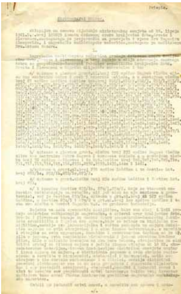
Slika 88 Prva stranica kupoprodajnog ugovora sklopljenog 16. lipnja 1921. između državnog erara Kraljevine Srba, Hrvata i Slovenaca i Zagrebačke nadbiskupske nadarbine kojim se kupuju nekretnine za Gospodarsko-šumarski fakultet

kako je Šumski vrt prvi rasadnik u Republici Hrvatskoj koji je razmnožavao sadnice ukrasnog drveća i grmlja te je u tom području prvi i u smislu znanstvenog istraživanja i praktičnog rada u hortikulturnoj proizvodnji sadnica.