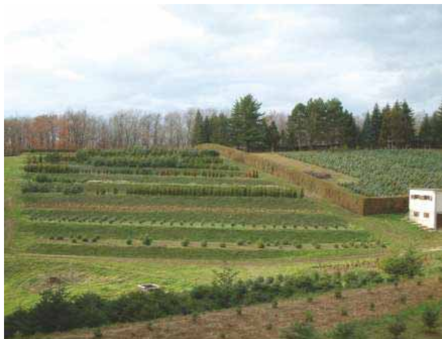
Slika 92 Izgled terasastog rasadnika Dotrščina koji pripada NPŠO-u Zagreb

- grijani staklenik s četiri stola za pikiranje dimenzija 3,6 x 2,1 m opremljen sustavom za zamagljivanje Rain bird,