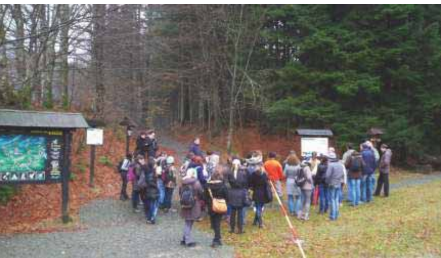
Slika 51 Terenska nastava iz predmeta Zaštita prirode u Nacionalnom parku Risnjak 2011. godine, studenti Urbanog šumarstva, zaštite prirode i okoliša

Mnogi profesori koji su predavali na Šumarskom fakultetu bili su ujedno i među prvim zagovornicima potrebe zaštite prirodne baštine, te su i aktivno sudjelovali u zaštiti prirode. Osim nastave i predavanja njihova se djelatnost očitovala u osnivanju prvih udruga i društava, Hrvatskoga šumarskog društva 1846. godine, Društva za uređenje i uljepšavanje Plitvičkih jezera i okolice 1893. godine, Hrvatskoga prirodoslovnog društva 1885. godine. Istodobno su promicali zaštitu prirode i putem raznih časopisa, npr. Šumarski list 1877. godine, Glasnik Hrvatskoga naravoslovnoga društva 1886. godine, Lovačko-ribarski viestnik 1892. godine, Hrvatski planinar 1898. godine, Priroda 1911. godine, Zaštita prirode 1938. godine.