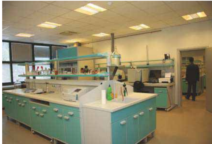
Slika 83 Moderno uređen i opremljen Ekološko-pedološki laboratorij