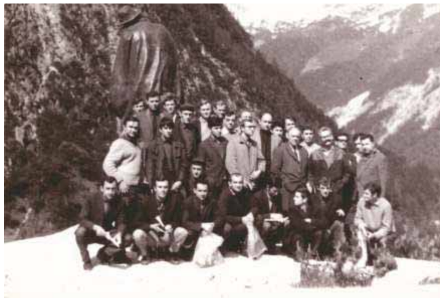
Slika 57 Posljednja fotografija akademika Milana Anića sa studentima snimljena na terenskoj nastavi u Sloveniji 1968. godine

bilateralnih ugovora o suradnji između Šumarskoga fakulteta Sveučilišta u Zagrebu i Mendelova poljoprivredno-šumarskog sveučilišta u Brnu. Već petnaest generacija studenata boravilo je na višednevnoj terenskoj ekskurziji u Češkoj, iz kolegija Uzgajanje šuma II i Silvikultura.