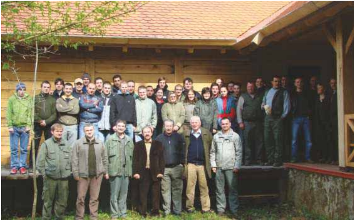
Slika 63 S domaćinima iz Uprave šuma Sisak i Šumarije Lekenik na tradicionalnoj terenskoj nastavi iz Ekologije šuma, Šumarske fitocenologije i Uzgajanja šuma u šumi Kalje 2008. godine