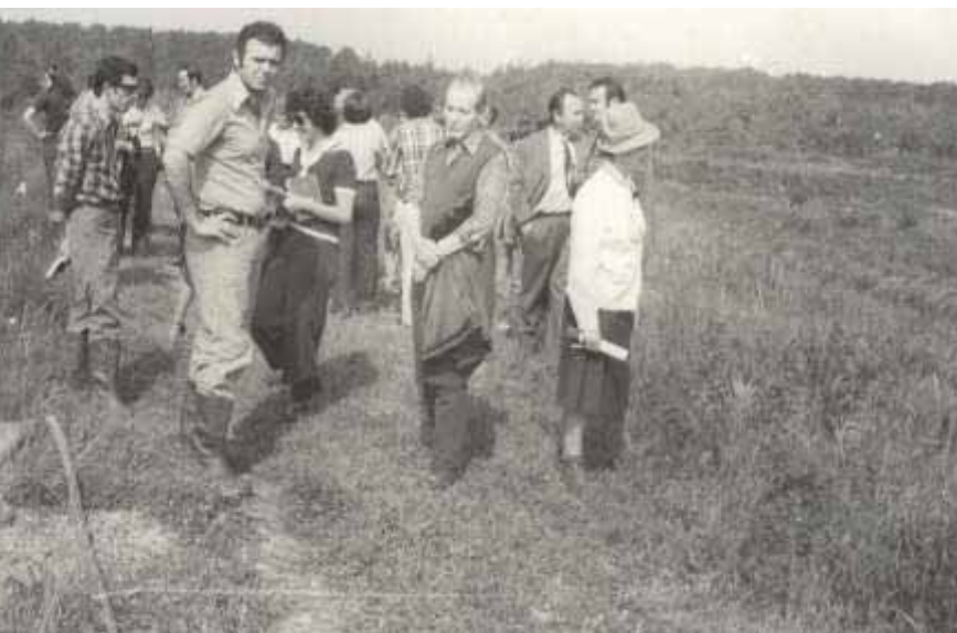
Slika 23 Akademik Slavko Matić na terenu kod Lipovljana 1975. godine

Bio je veliki zagovornik prirodnog uzgajanja šuma i promicatelj zagrebačke škole uzgajanja šuma. Afirmirao je u hrvatskom šumarstvu opredjeljenje za prirodno pomlađivanje i prirodnu strukturu sastojine te prirodne, raznolike i stabilne šume.