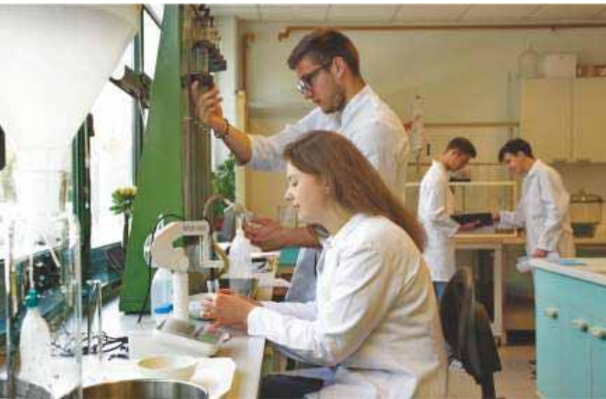
Slika 82 Studenti u Ekološko-pedološkom laboratoriju tijekom svojih laboratorijskih vježbi 2019. godine

Što se tiče znanstvenih aktivnosti, u Ekološko-pedološkom laboratoriju ponajprije se provode istraživanja s područja tloznanstva – ispituju se fizička i kemijska svojstva tala. Tako se obavljaju analize granulometrijskog sastava tla, vodopropusnosti, kiselosti tla, određivanja sadržaja karbonata, ukupnog ugljika i dušika, metala i metaloida u uzorcima tla.