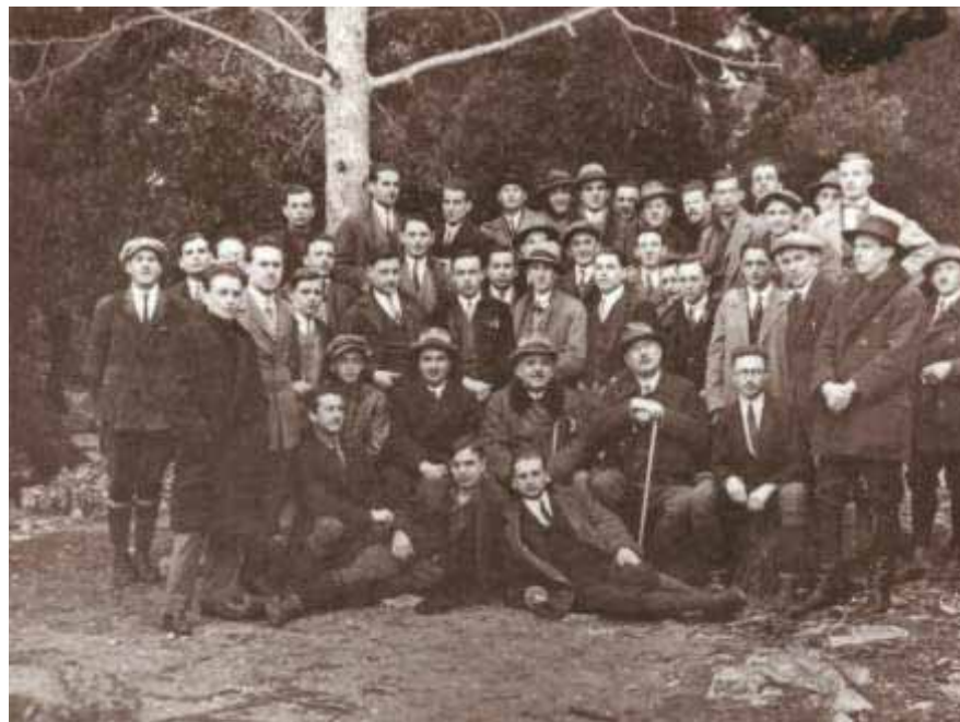
Slika 3 Profesor Andrija Petračić sa suradnicima i studentima na Rabu 1925. godine

U trećem razdoblju 1946. – 1959. godine Zavod doživljava značajan razvoj. Širi se nastava po broju kolegija i sadržaja te uvodi poslijediplomska nastava. Na Zavodu se održavaju seminari iz parkiranja i ozelenjivanja javnih površina, primjene fitocenologije u praktičnom šumarstvu iz kultiviranja drveća brzog rasta. Zanimanje za seminare bilo je veliko, posebice zanimanje stručnjaka iz prakse, pa se razvija plodna suradnja koja neprekidno traje do danas. U to su vrijeme u Zavodu izrađeni planovi za specijalističke studije iz plantažiranja, očetinjavanja, melioracije krša, parkiranja i ozelenjivanja, uređivanja bujica i suzbijanja erozije koji bi trajali tri semestra, a četvrti je semestar bio predviđen za poslijediplomski rad.