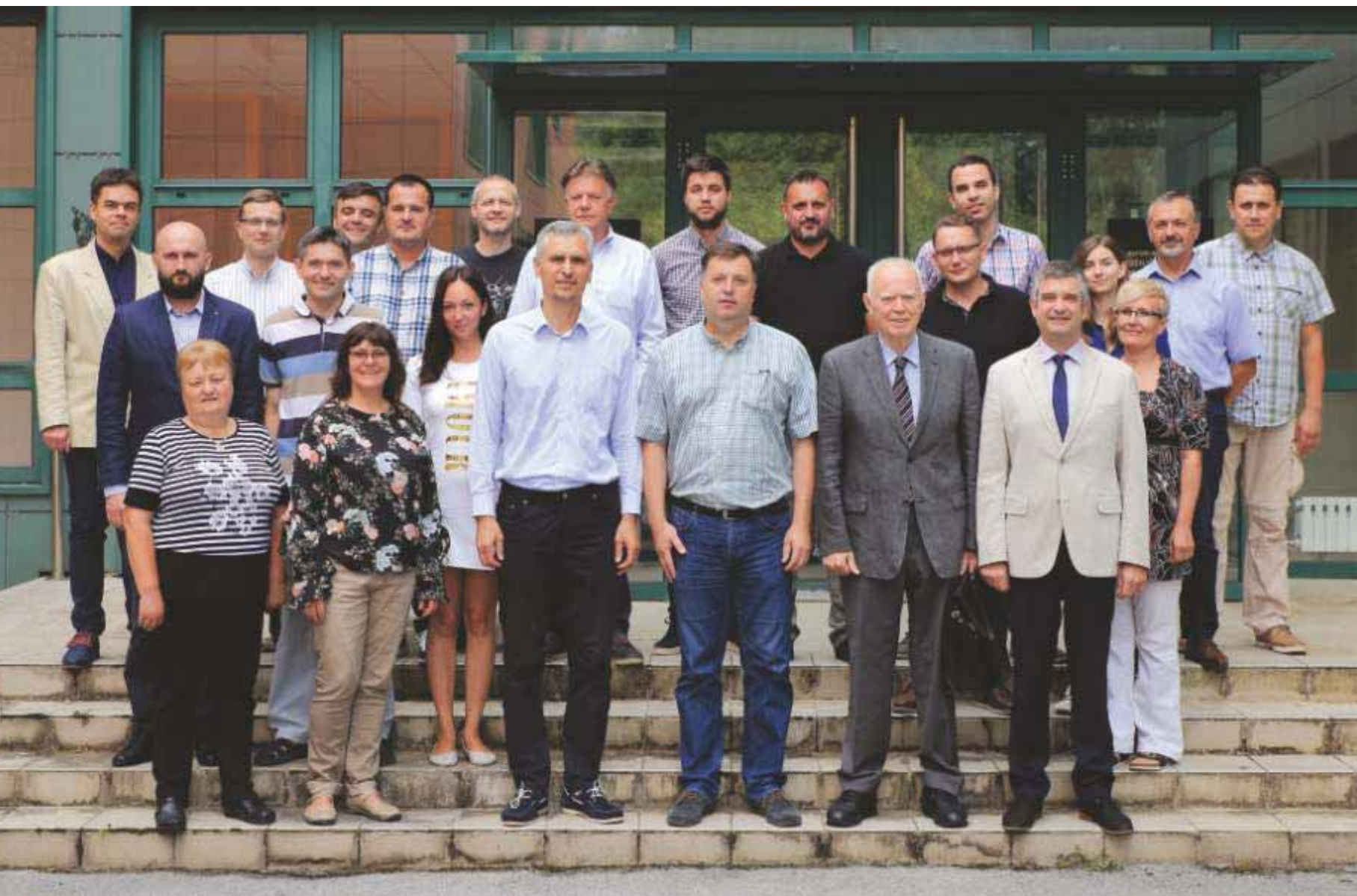
Slika 15 Zajednička fotografija članova Zavoda 2018. godine