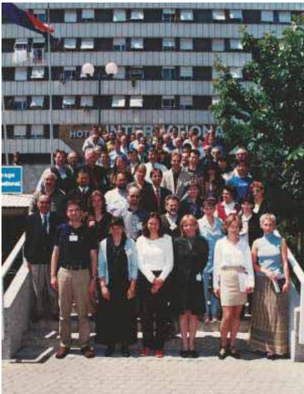
Slika 73 Sudionici IUFRO kongresa o uzgajanju hrastovih šuma i genetici hrastova (OAK 2000)