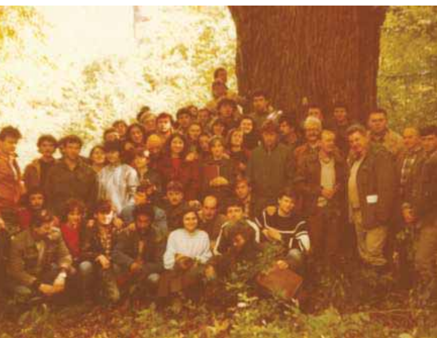
Slika 59 Zajednička terenska nastava iz Uzgajanja šuma, Ekologije šuma i Šumarske fitocenologije u šumi Prašnik 1984. godine