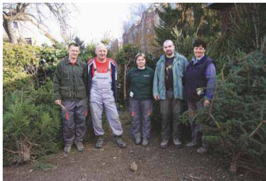
Slika 93 Djelatnici rasadnika snimljeni prilikom prodaje božićnih drvaca u rasadniku „Šumski vrt i arboretum“ 2019. godine