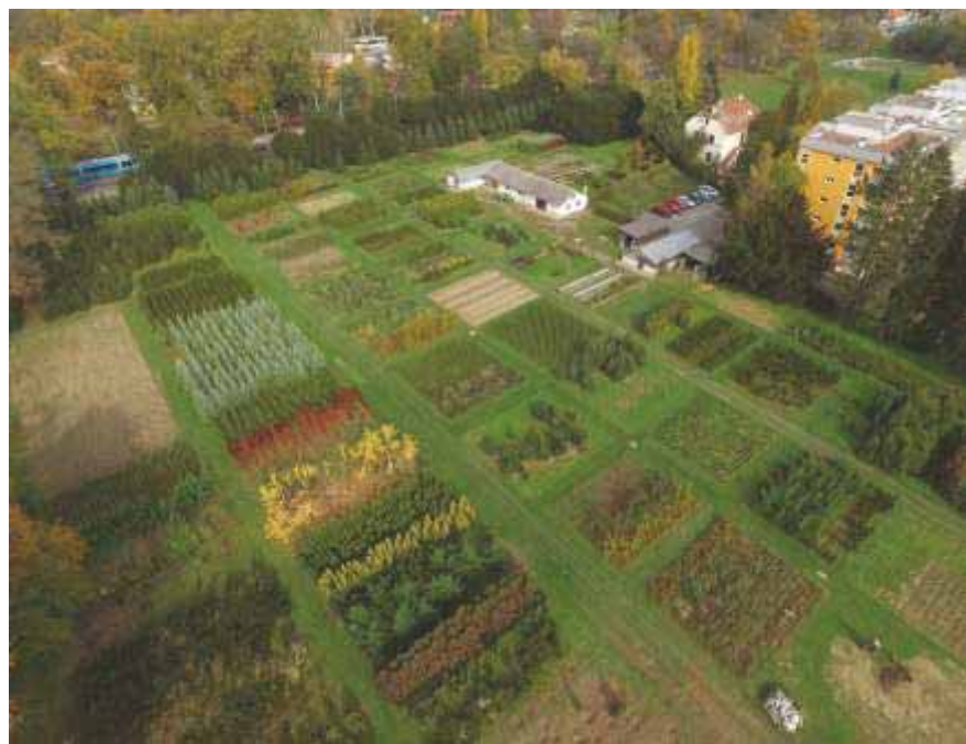
Slika 90 Snimka rasadnika „Šumski vrt i arboretum“ iz drona napravljena 2017. godine

rasadnika pri čemu je ukupno utvrđeno 94 vrsta od kojih 66 vrsta listača (70,21 %) i 28 vrsta četinjača (29,79 %). Od inicijalne sadnje od 200 vrsta vidljivo je kako je do 2004. godine preživjelo svega 47 % vrsta, a 53 % vrsta se posušilo zbog starosti i neodgovarajućeg razmaka sadnje. U 2021. godini broj vrsta i stabala u arboretumu znatno je manji, posebno vrsta i stabala četinjača, koje su se morala ukloniti zbog fiziološke zrelosti i prethodno izrađenog stručnog elaborata u kojem je utvrđeno kako su postala vrlo opasna za sigurnost ljudi i imovine.