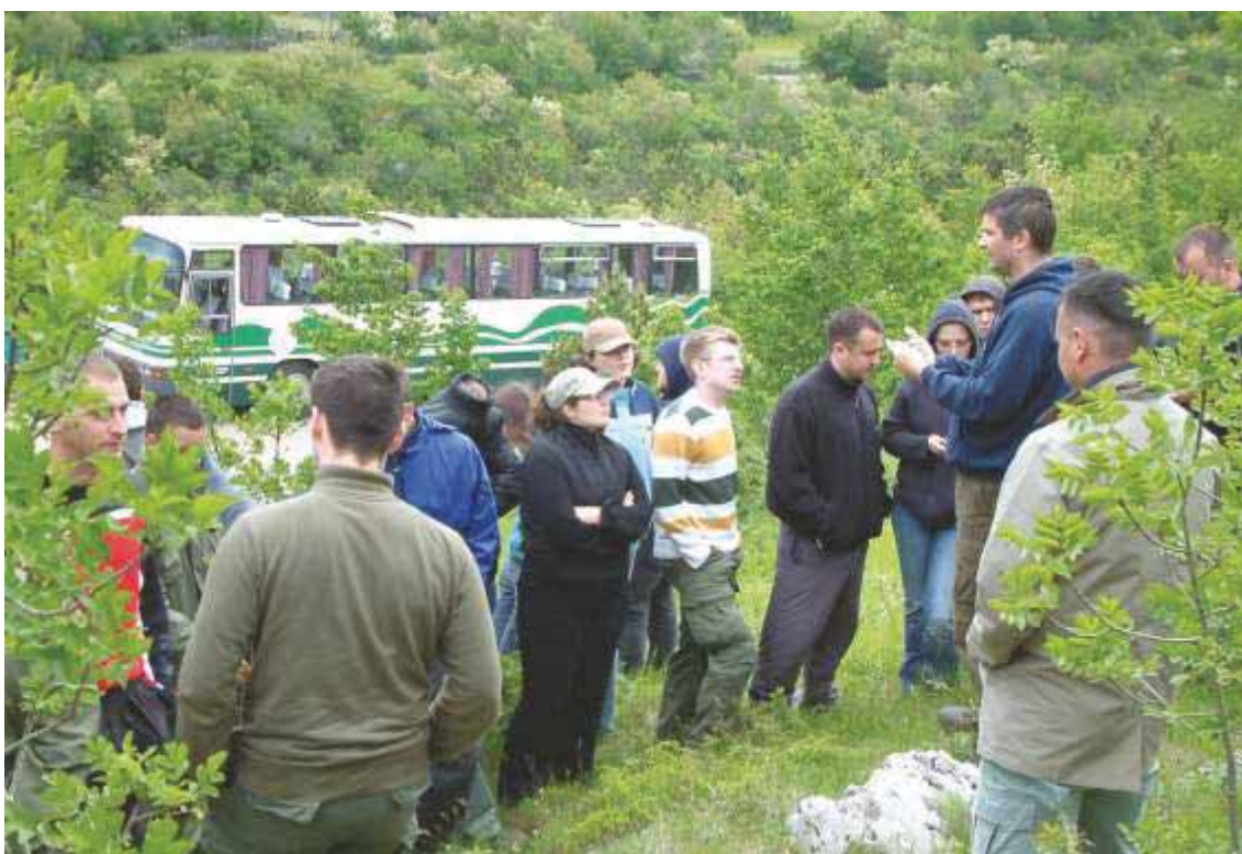
Slika 62 Terenska nastava iz Uzgajanja šuma u Senjskoj dragi 2006. godine