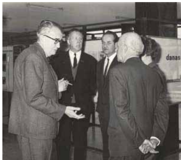
Slika 38 Prof. dr. sc. Stjepan Bertović (u sredini) na proslavi 20 godina Instituta za šumarska istraživanja 1966. god.

Potaknuo je i započeo izdavati glasilo Šumarskog instituta Radovi (1966.), čiji je bio prvi i glavni urednik.