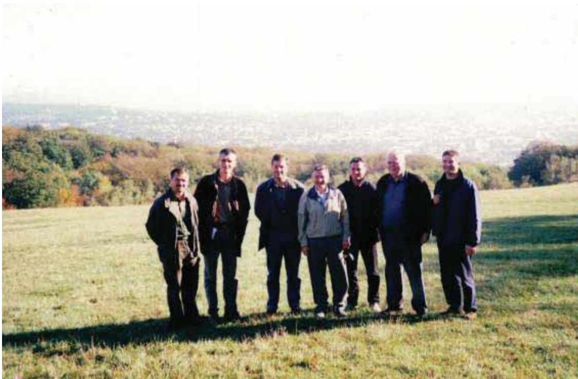
Slika 78 Na stručnoj ekskurziji u Bečkoj šumi (Wienerwald) u Austriji