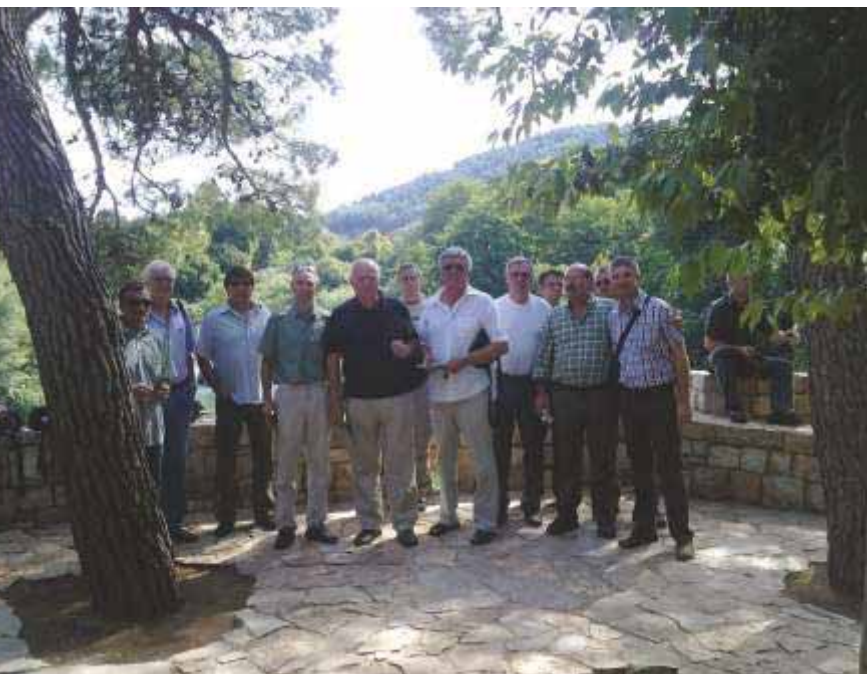
Slika 69 S prijateljima i kolegama iz Splita, Šibenika i Zvolena na Skradinskom buku 2013. godine

Ponosni smo na tradiciju i dugogodišnje prijateljske odnose s kolegama s Katedre uzgajanja šuma Tehničkog sveučilišta u Zvolenu, Slovačka, Katedre uzgajanja šuma Mendelova poljoprivredno-šumarskog sveučilišta u Brnu, Češka i Katedre uzgajanja šuma Biotehničkog fakulteta Sveučilišta u Ljubljani.