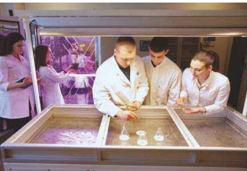
Slika 84 Studenti tijekom laboratorijskih vježbi iz problematike klijavosti sjemena i uzgoja sadnica u komori rasta Laboratorija za šumsko sjemenarstvo i rasadničarstvo 2019. godine

U Laboratoriju za šumsko sjemenarstvo i rasadničarstvo provode se nastavne i znanstvene aktivnosti. Od nastavnih aktivnosti u Laboratoriju se provode laboratorijske vježbe iz predmeta Osnivanje šuma za studente druge godine preddiplomskog studija Šumarstvo, i predmeta Uzgajanje šuma posebna namjene na trećoj godini preddiplomskog studija Urbano šumarstvo, zaštita prirode i okoliša. Studenti završnih godina preddiplomskih i diplomskih studija i doktorandi koriste se laboratorijskim prostorom i znanstvenom opremom za istraživanja prilikom pisanja svojih završnih, diplomskih i doktorskih radova.