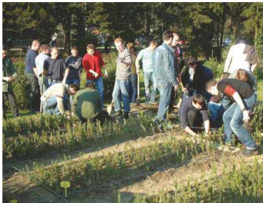
Slika 91 Studentske vježbe iz kolegija Osnivanje šuma i problematike presadnje biljaka u rasadniku 2007. godine

Rasadnik se danas temelji prije svega na proizvodnji sadnica ukrasnog drveća i grmlja, većinom četinjača, za potrebe krajobraznog uređenja prostora, hortikulture i arborikulture. U rasadniku u Svetošimunskoj cesti i Dotrščini, koji je terasastog oblika zbog nagiba terena, uglavnom se proizvode sadnice raznih vrsta četinjača za božićna drvca (do 3 metra visine), pri čemu je lijepa tradicija da svaki zaposlenik