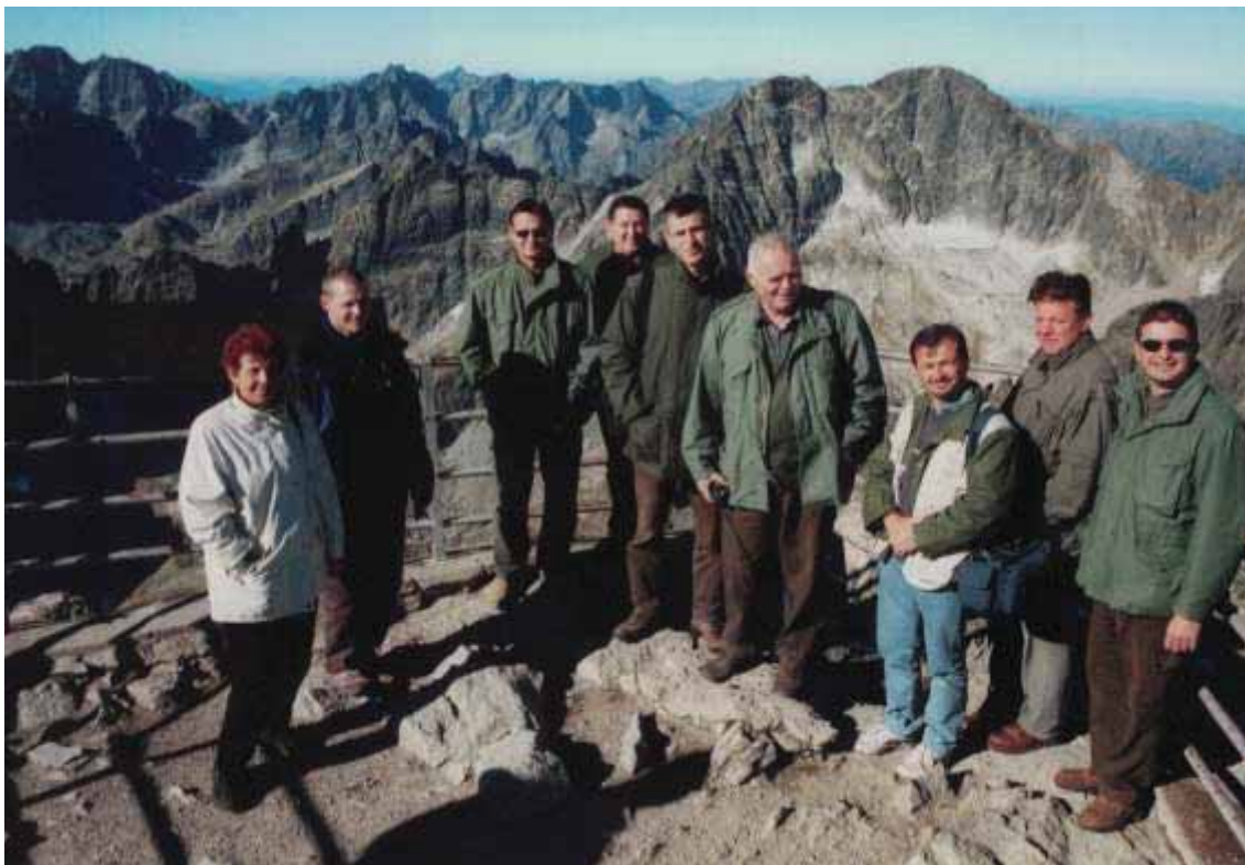
Slika 77 Na 2632 m n.m. u Visokim Tatrama (Lomnický štít), Slovačka 2000. godine