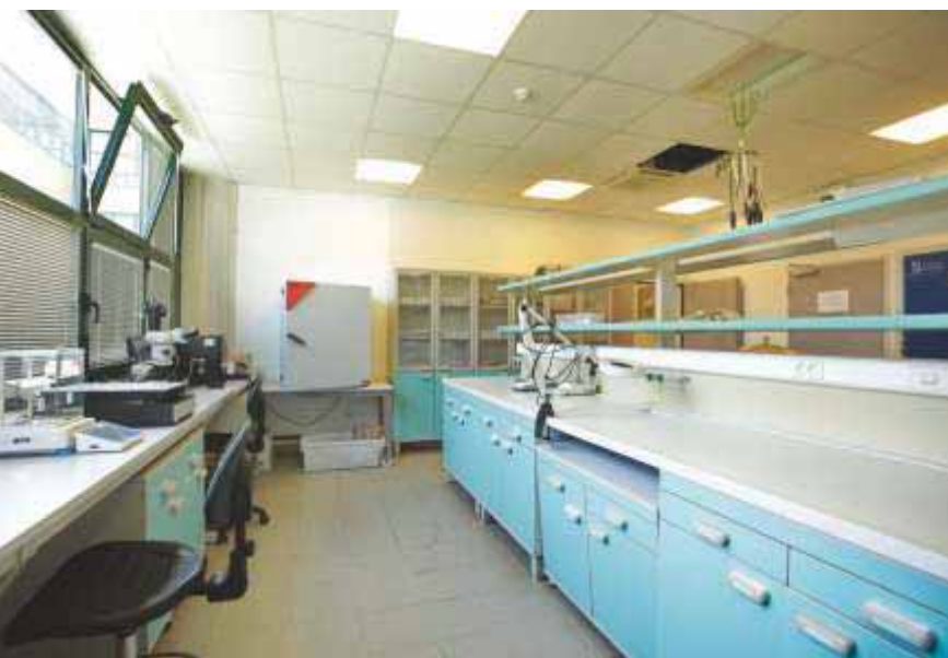
Slika 85 Znanstvena oprema i pribor u Laboratoriju za šumsko sjemenarstvo i rasadničarstvo