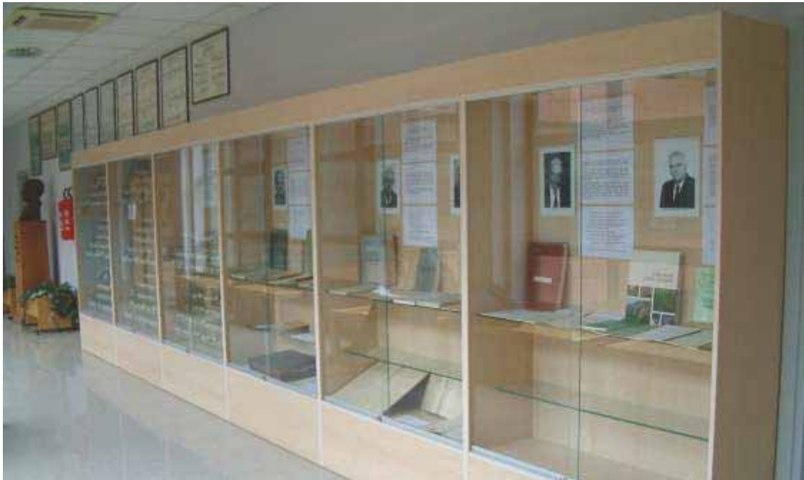
Slika 81 Poprsje akademika Milana Anića i vitrine u hodniku Zavoda posvećene najznamenitijim stručnjacima u povijesti Zavoda i zagrebačke škole uzgajanja šuma