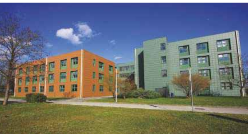
Slika 79 Zavod se danas nalazi u prizemlju i na prvom katu smeđe zgrade Šumarskog odsjeka Fakulteta šumarstva i drvne tehnologije

Zavod je smješten u prizemlju i na 1. katu smeđeg krila nove zgrade Fakulteta. Središnjim dijelom smeđeg krila dominira otvoreni monumentalni svjetlarnik koji je s tri strane ograničen hodnicima, a sa zapadne strane predavaonicama 040 (prizemlje) i 130 (1. kat). U prizemlju Zavoda nalazi se 10, a na 1. katu 11 ureda. Na obje etaže su po jedna čajna kuhinja i sanitarne prostorije.