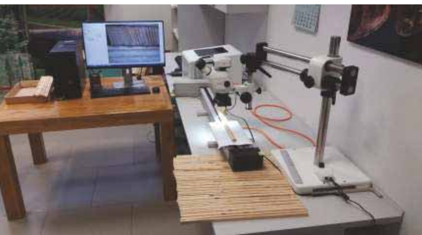
Slika 87 Dio moderne opreme za obradu i analizu uzoraka u Laboratoriju za dendroekologiju

Mjere prilagodbe klimatskih promjena za održivo upravljanje prirodnim resursima – MEMORIE (2020. – 2023.)