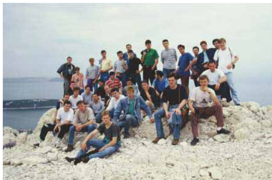
Slika 60 Kamenjak na otoku Rabu. Terenska nastava iz Uzgajanja šuma I i II, Šumarske fitocenologije i Ekologije šuma 1994. godine