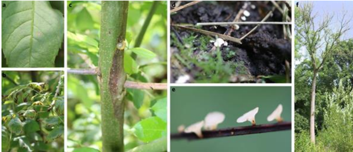
Slika 5. Simptomi zaraze gljivom H. fraxineus (Izvor: Akcijski plan za sanaciju sastojina poljskog jasena ugroženih sušenjem i propadanjem za razdoblje od 2021.-2031.)

stabala jasena te može izazvati potpuno sušenje. U slučaju da lišće padne u jesenskom periodu na tlo, kolonizirala bi ga gljiva koja stvara karakterističnu “pseudosklerocijalnu mrlju”. Tijekom ljetnih i jesenskih mjeseci (u periodu od lipnja do listopada), na pocrnjelim izraslinama te propadajućem lišću iz prethodne jeseni i zime pojavljuju se mala plodna tijela nalikom na gljive. Poslije sazrijevanja, ova sićušna plodna tijela ispuštaju velike količine mikrospora pri čemu će neke sletjeti na lišće zdravih te prethodno zaraženih stabala pri čemu ciklus ponovno počinje.