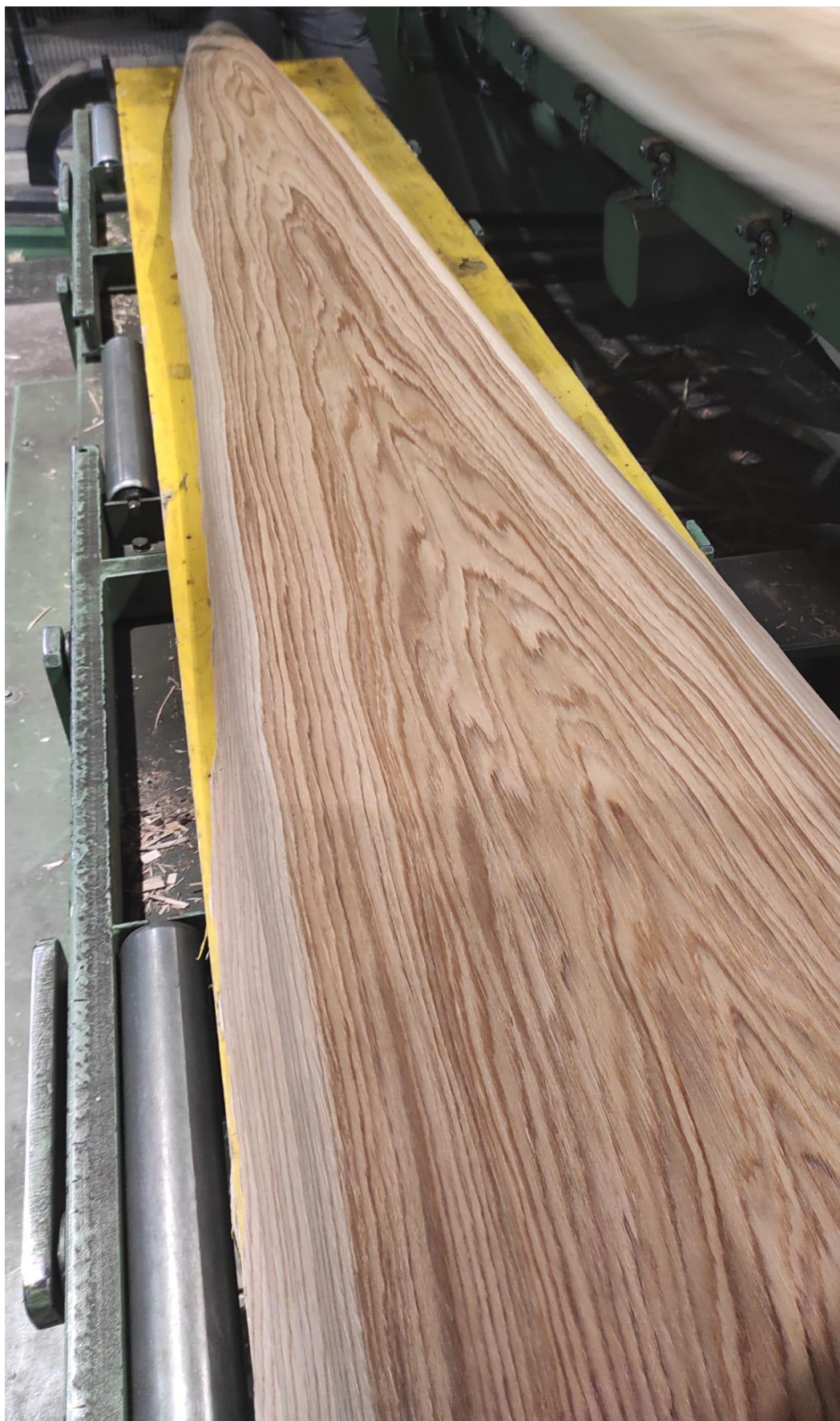
Slika 11 Listovi furnira tangentne strukture