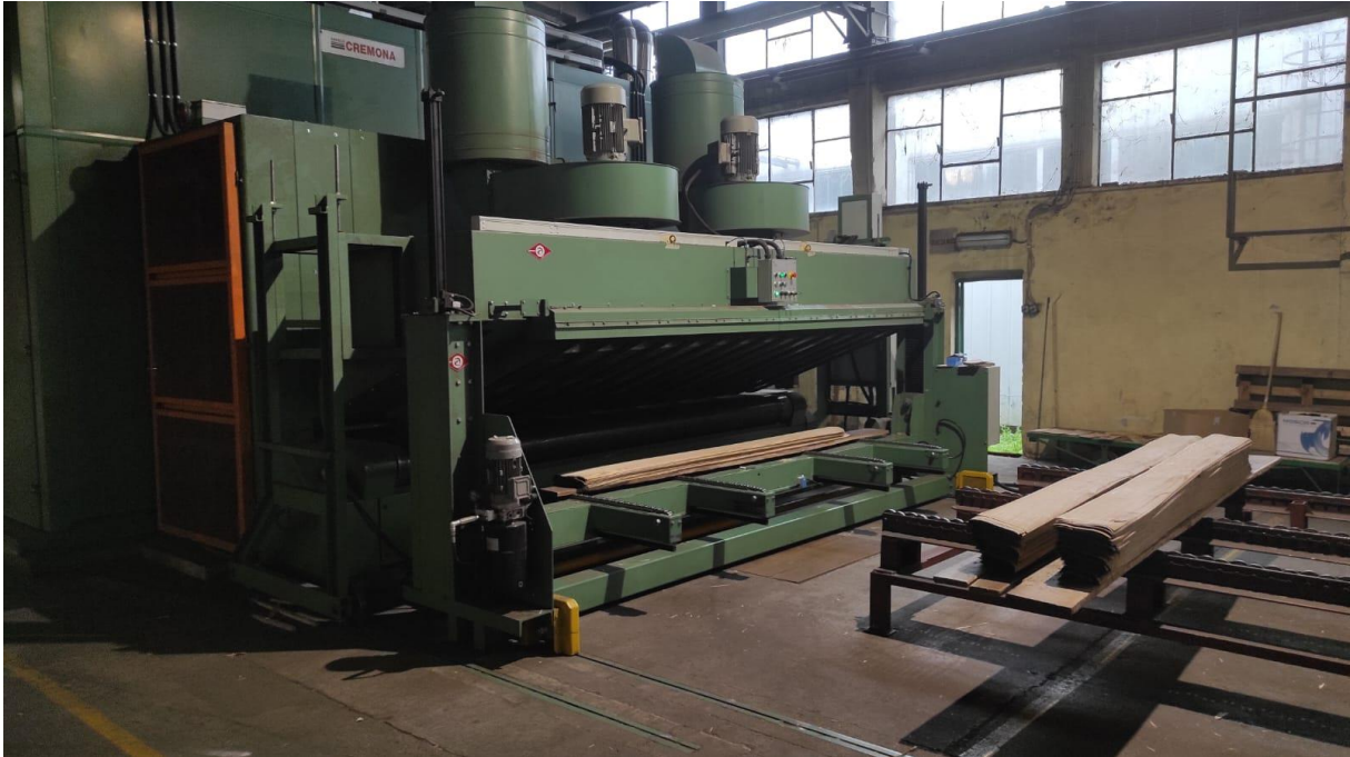
Slika 6 Sušionica furnira CREMONA PD 01-4200

Osušeni listovi furnira odlaze na završnu obradu odnosno na paketne škare (slika 7) gdje se složaj obrezuje i prikraćuje te nakon povezivanja u paketu od 32 lista transportira do skladišta. Ako je debljina listova veća od 0,6mm broj listova u paketu se smanjiva npr. debljina furnira 1mm broj listova u paketu 18, debljina furnira 1,5mm broj listova u paketu 12 itd. U skladištu se vrši sortiranje paketa po dužinama i klasama te pakiranje i priprema za otpremu.