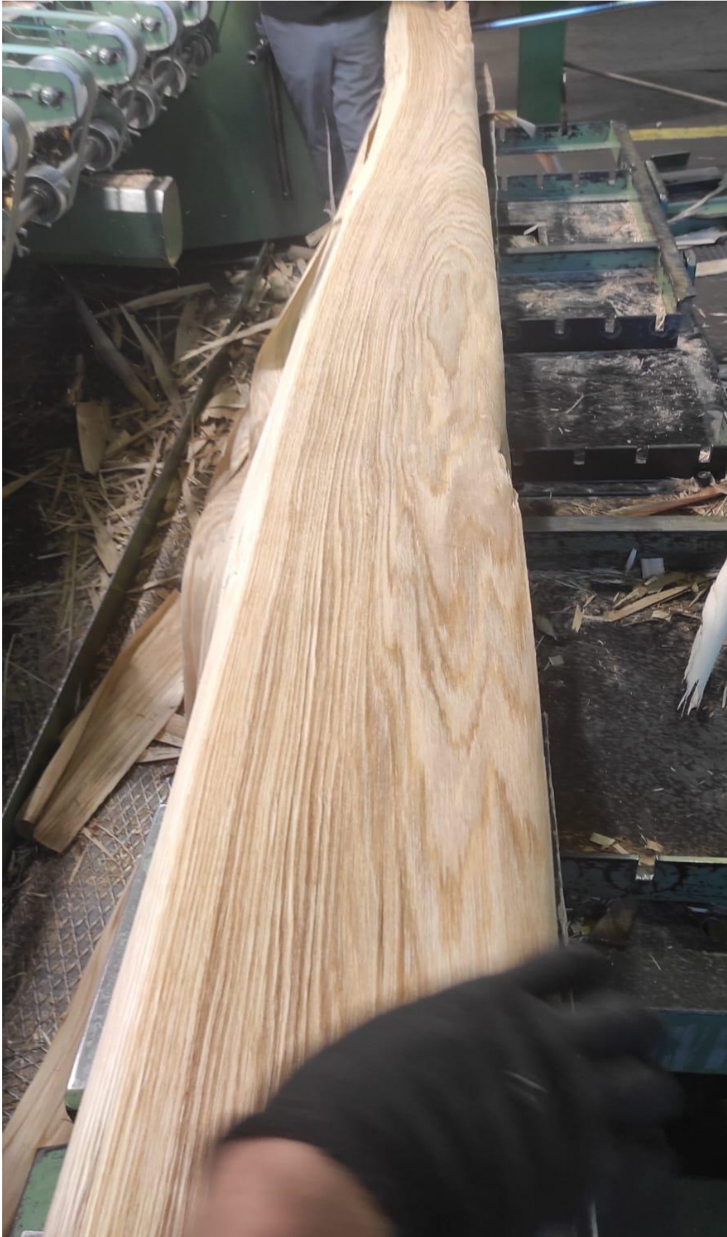
Slika 15 Listovi rezanog furnira poluradijalne i radijalne strukture