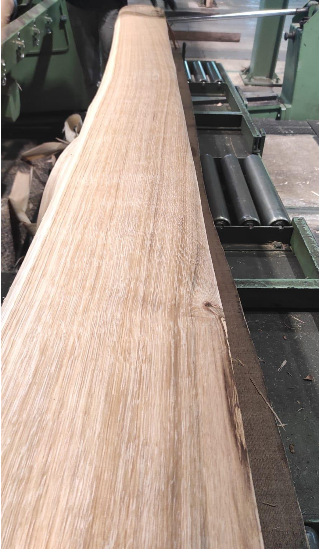
Slika 19 Listovi rezanog furnira radijalne strukture