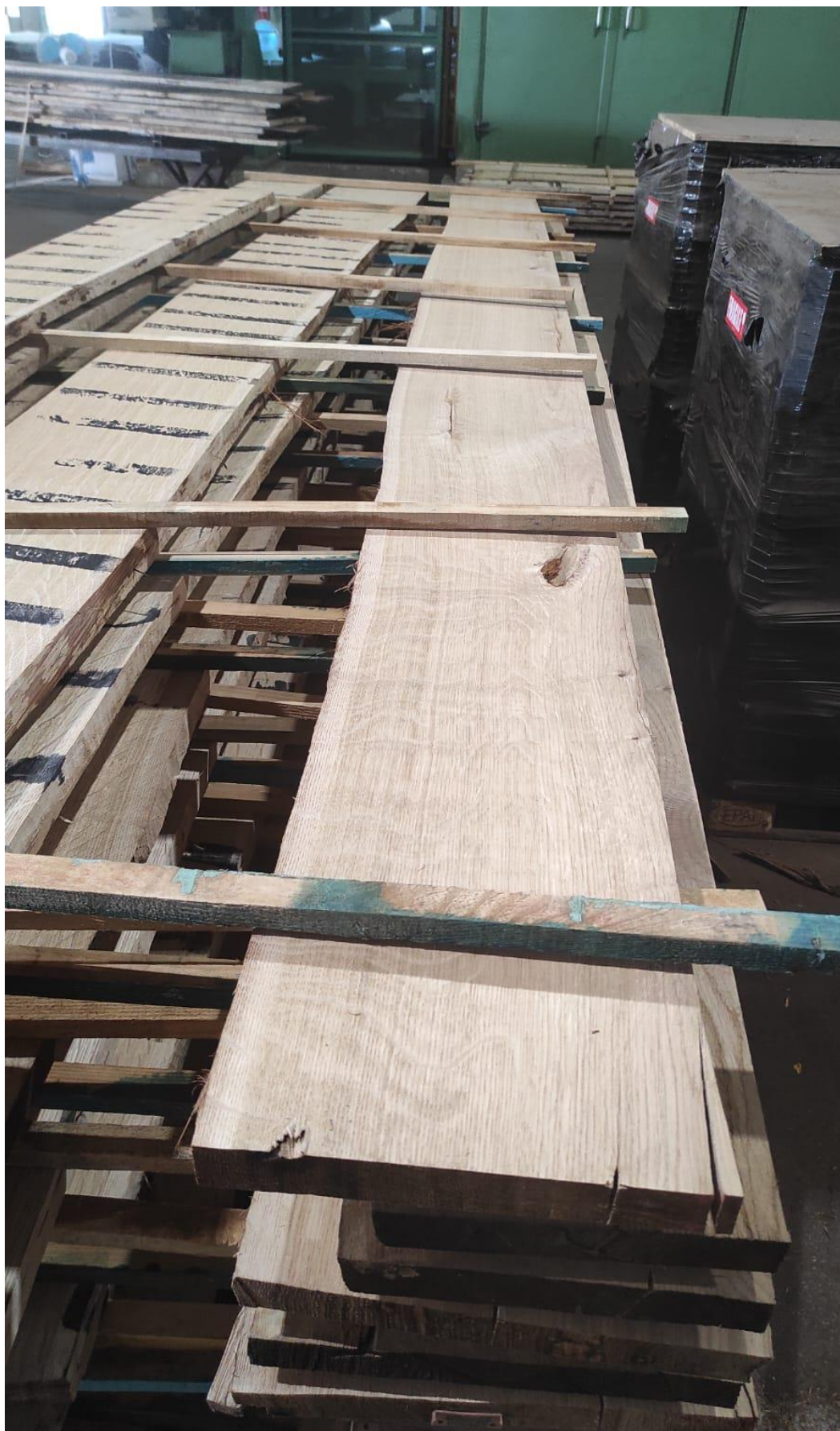
Slika 16 Ostatak Od vertikalnog furnirskog noža (trupac predhodno otvoren u trostrani vančes)