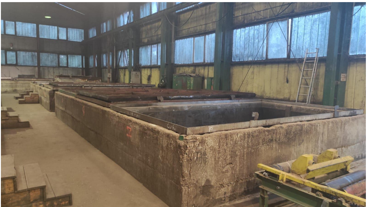
Slika 3 Parne jame

Nakon hidrotermičke obrade sa vrućih fličeva skida se kora i dovršava njihova priprema za preradu furnire na furnirskim strojevima.