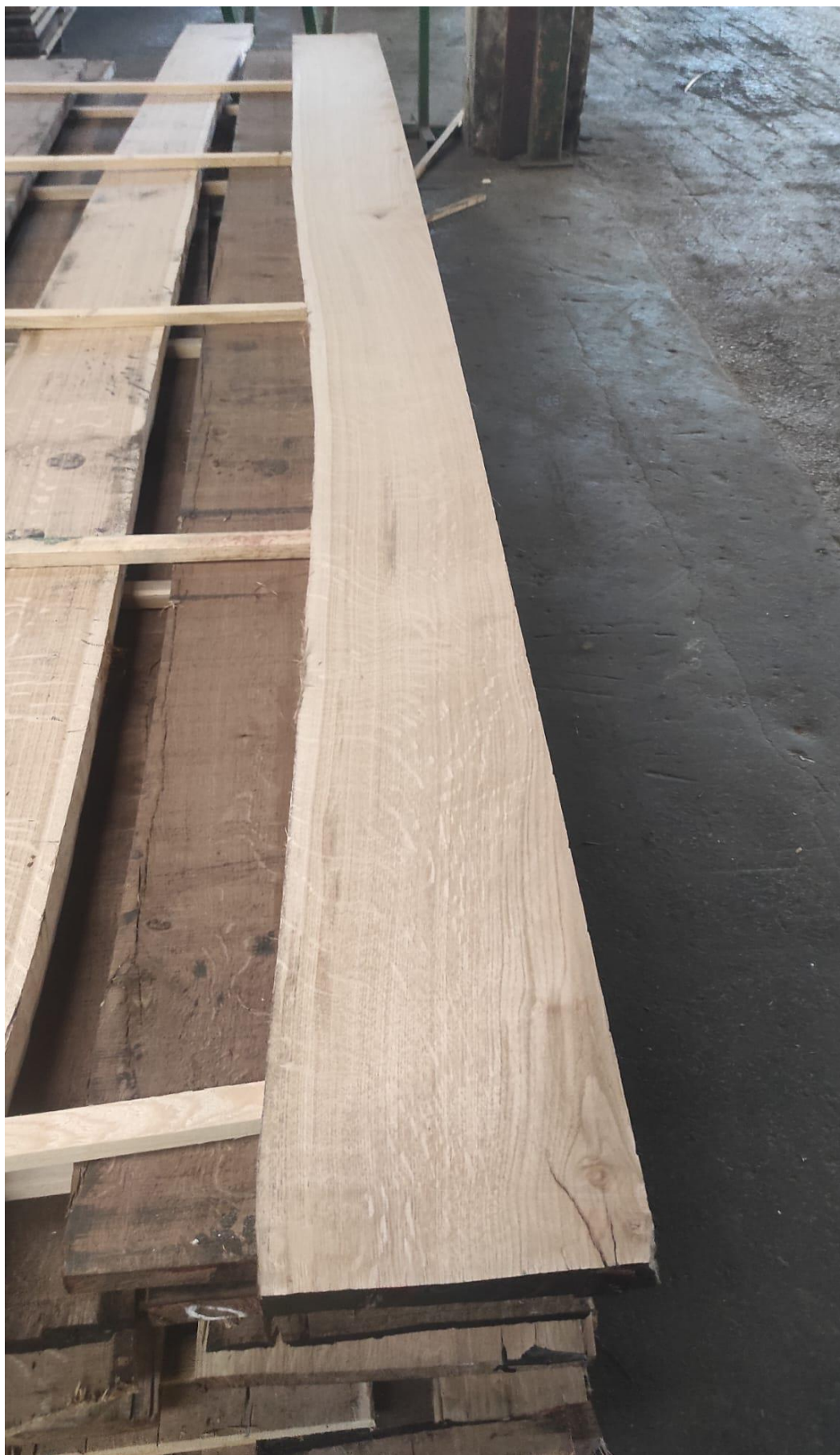
Slika 12 Ostatak od vertikalnog furnirskog noža (meserest)