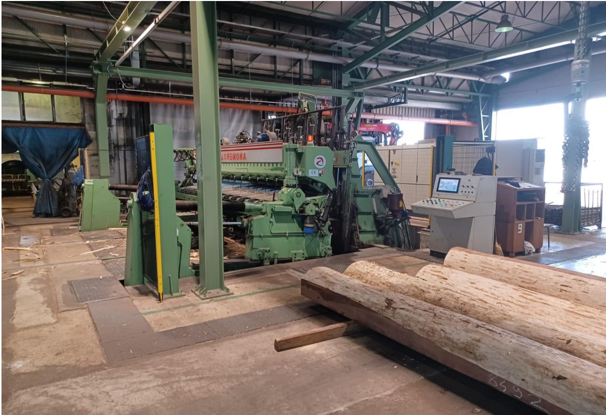
Slika 4 Vertikalni nož CREMONA TZE 02-40