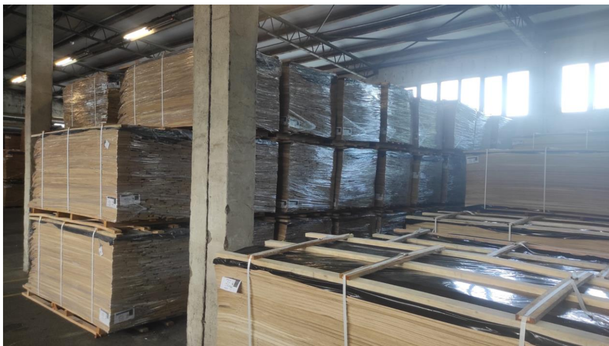
Slika 8 Skladište gotovih furnira