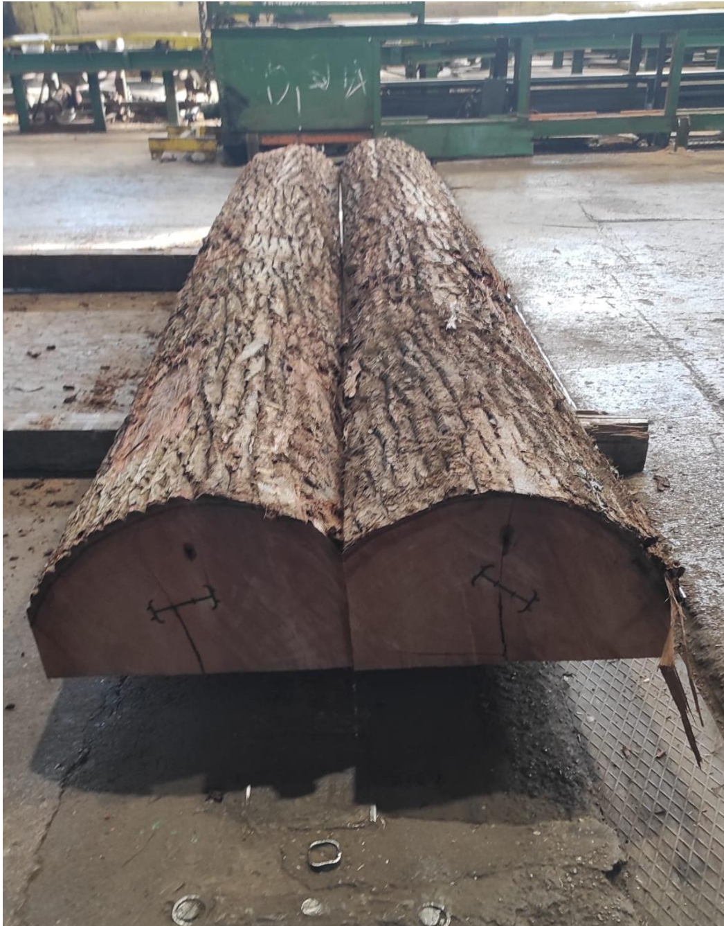
Slika 13 Trupac prizmiran u trostrani vančes

U ovoj debljinskoj grupi trupci su predhodno prizmirani u trostrani vančes (slika 13) i rezani na vertikalnom furnirskom nožu (slika 14). Na ovaj način rezanja dobiva se furnir poluradijalne (polutangentne) i radijalne strukture (slika 15), Prizma se reže od lica prema srčiki do pojave otvorenog špigla, nakon toga prizma se otpušta te se okreće i postupak se ponavlja i sa druge strane.. Na ovaj način dobivamo 2 daske ostatka (slika 16).