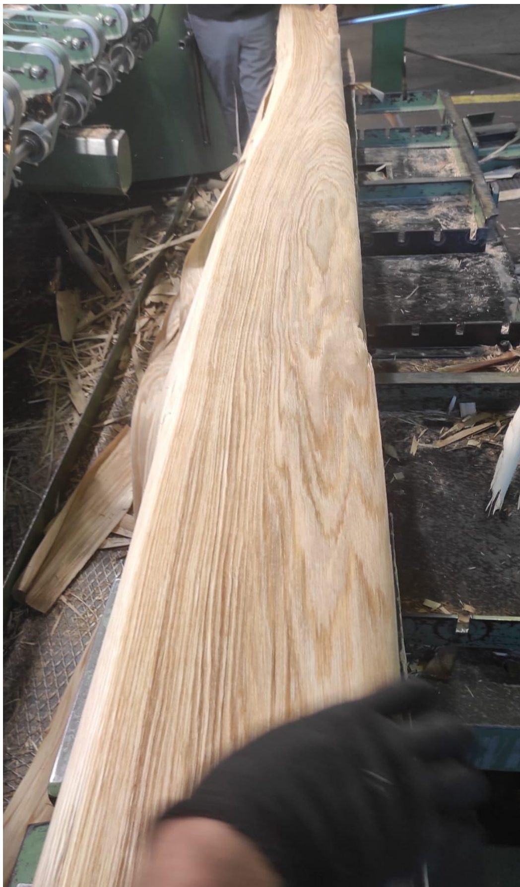
Slika 15 Listovi rezanog furnira poluradijalne i radijalne strukture