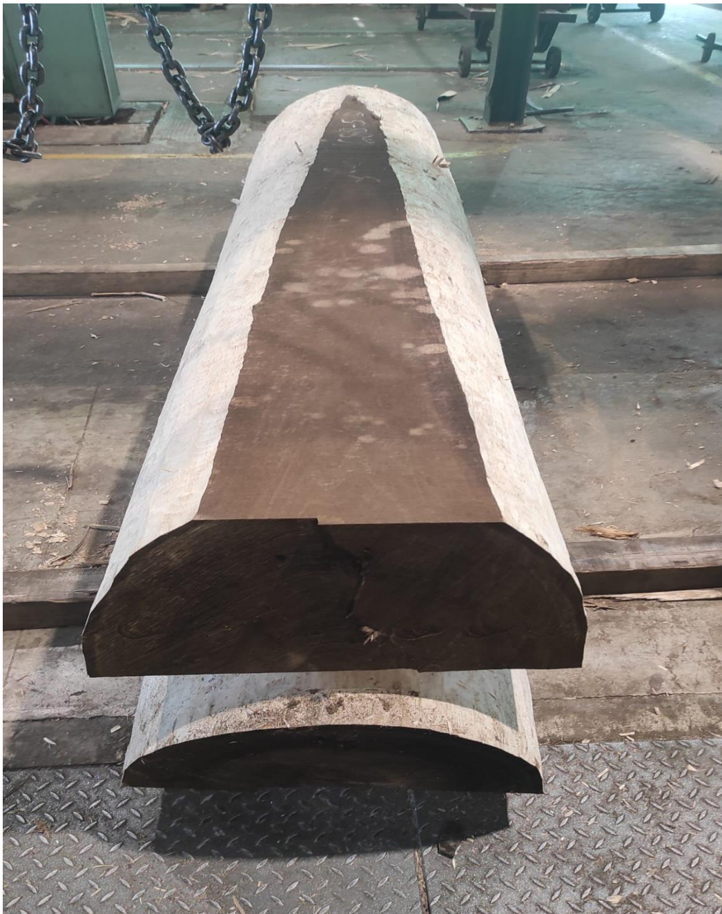
Slika 9 Trupac prizmiran u polovnjake

U ovoj debljinskoj grupi trupci su prethodno prizmirani u polovnjake (slika 9) i rezani na vertikalnom furnirskom nožu (slika 10). Na ovaj način u prvoj fazi rezanja dobiva se furnir tangentne strukture (slika 11), kako se ulazi dublje u polovnjak zbog nepovoljnog kuta rezanja u odnosu na sržne trake dolazi do pojave tzv. otvorenog lista na ulaznoj strani te se flić šalje na uzdužno prorezivanje na tračnu pilu ili pilu povratnog reza. Nakon prorezivanja dobivene polovine od flića vraćaju se na furnirski nož i režu se do debljine daske (slika 12). Od ostataka se dobiva furnir radijalne strukture. Na ovaj način dobivamo 4 daske ostatka.