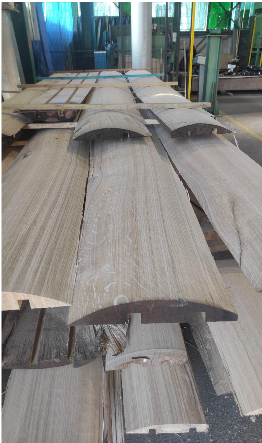
Slika 20 Ostatak (meserest) od prizmi rezanih na STAYLOG furnirskom nožu