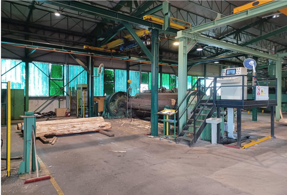
Slika 5 Furnirski nož STAYLOG CREMONA RS 02-400

Nakon rezanja odnosno ljuštenja plemeniti furniri odlaze na sušenje u sušionicu (slika 6) tehničkih karakteristika: