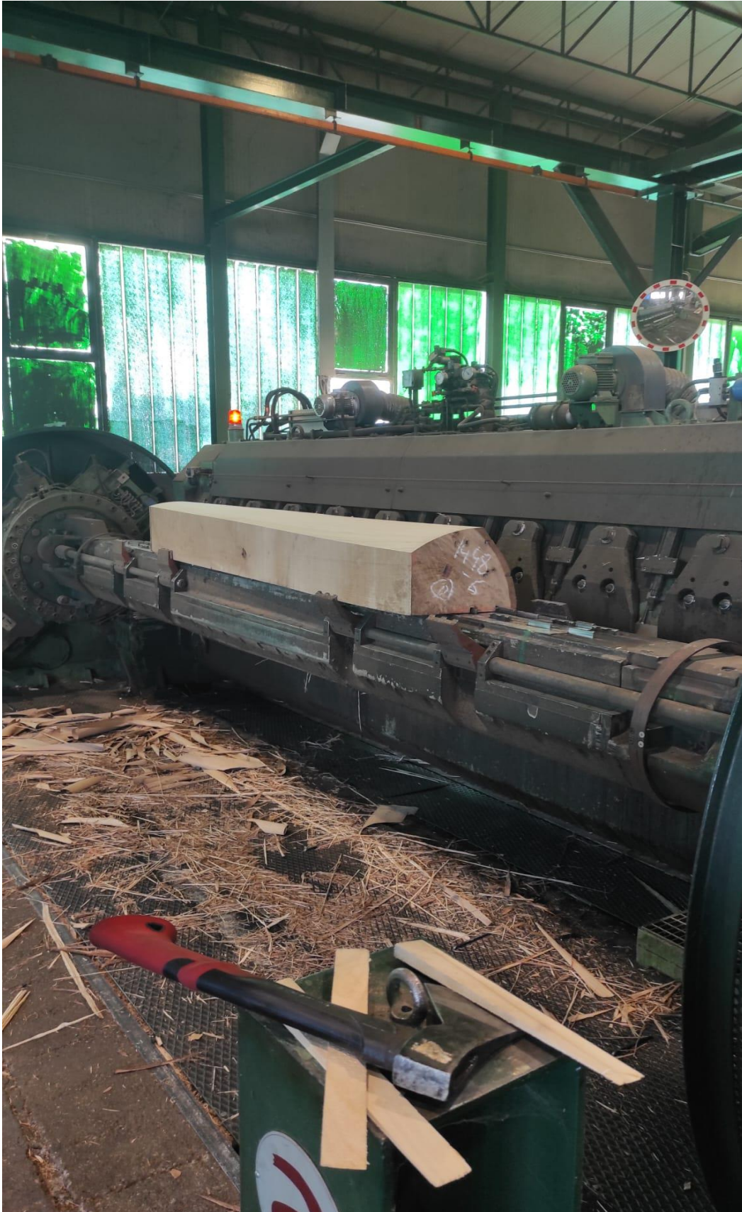
Slika 18 Obrada trupca prizmiranog u četvrtake na STAYLOG furnirskom nožu