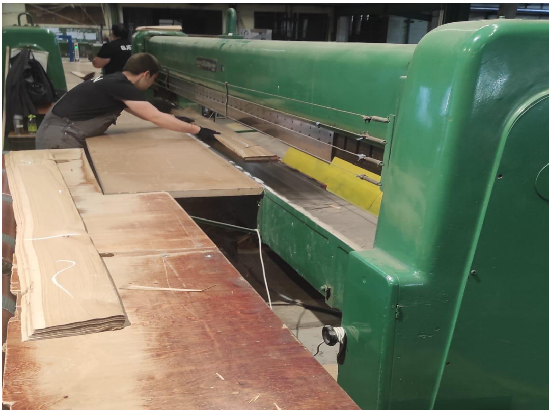
Slika 7 Jednostrane suhe paketne škare CREMONA

Osušeni listovi furnira odlaze na završnu obradu odnosno na paketne škare (slika 7) gdje se složaj obrezuje i prikraćuje te nakon povezivanja u paketu od 32 lista transportira do skladišta. Ako je debljina listova veća od 0,6mm broj listova u paketu se smanjiva npr. debljina furnira 1mm broj listova u paketu 18, debljina furnira 1,5mm broj listova u paketu 12 itd. U skladištu se vrši sortiranje paketa po dužinama i klasama te pakiranje i priprema za otpremu.