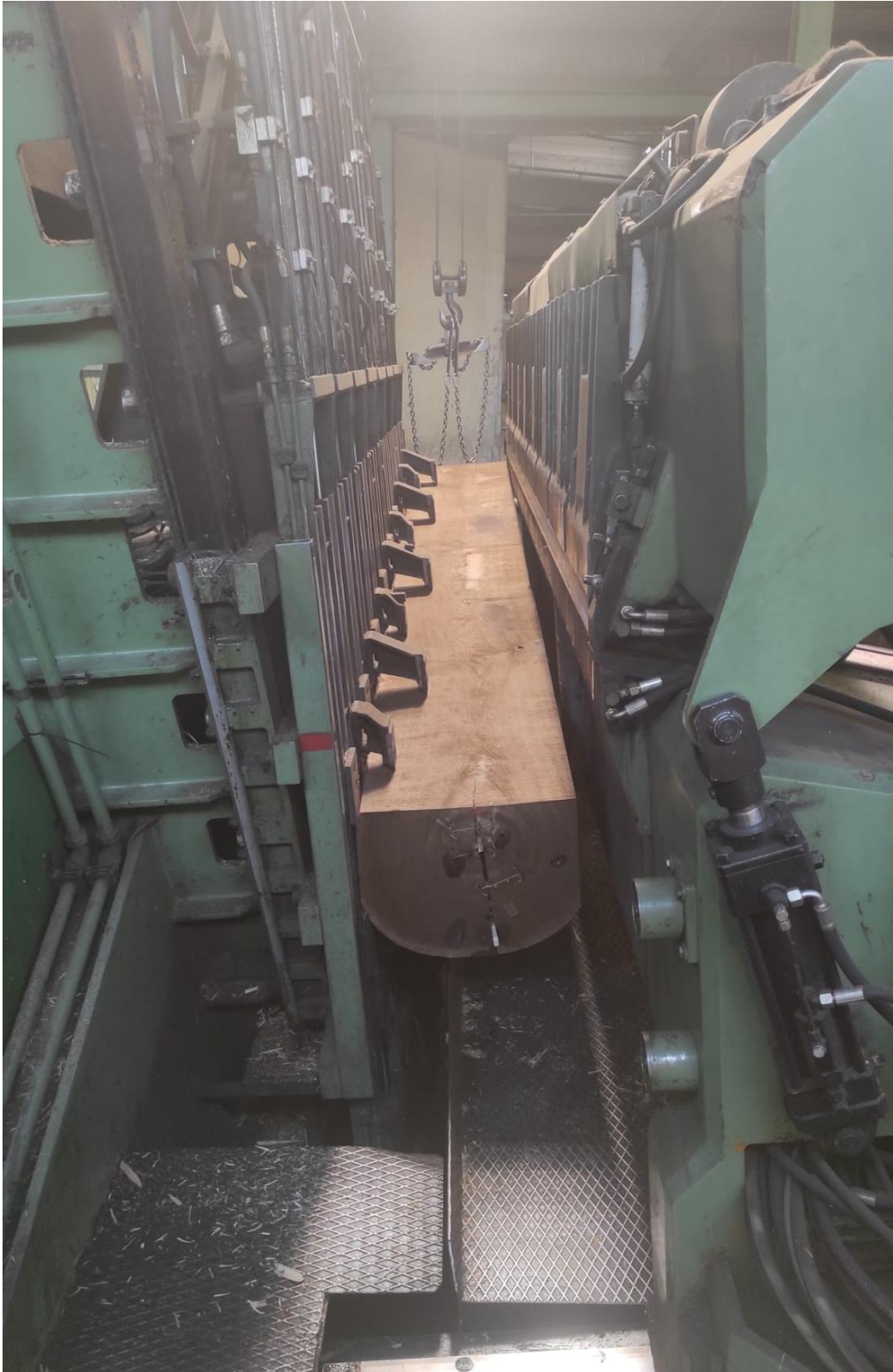
Slika 14 Obrada trupca prizmiranog u trostrani vančes na vertikalnom furnirskom nožu