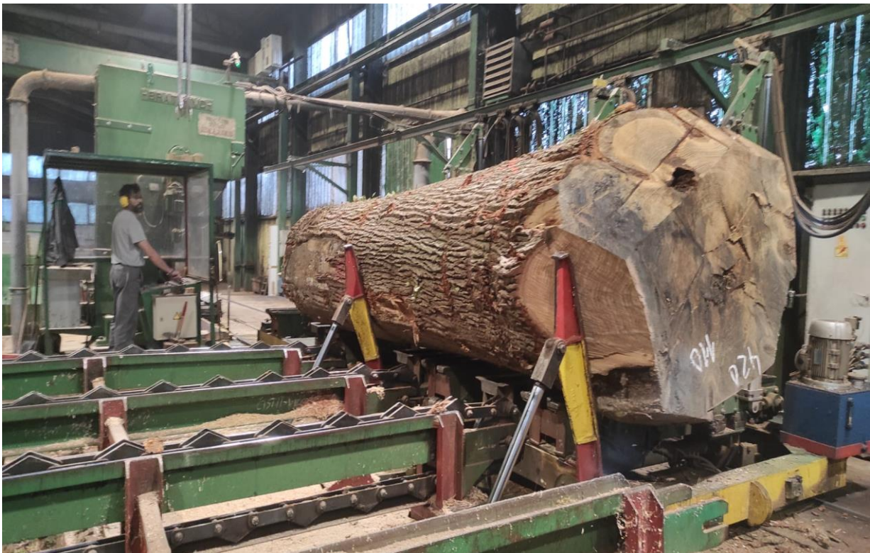
Slika 2 Tračna pila trupčara BRATSTVO TA-1400

Uređaji koji su korišteni prilikom mjerenja su: šumarska klupa (pomična mjerka za mjerenje debljine trupca), ručni metar od 5m, kolna vaga, mikrometar za mjerenje debljine listova furnira te vlagomjer za kontrolu sadržaja vode u listovima furnira. Uređaji korišteni u radu: tračna pila trupčara BRATSTVO TA-1400 (slika 2), vertikalni furnirski nož CREMONA TZE 02-40 (slika 3) i furnirski nož SRAY LOG CREMONA RS 02-400 (slika 4), sušionica furnira CREMONA PD 01-4200 (slika 5), jednostrane suhe paketne škare (slika 6).