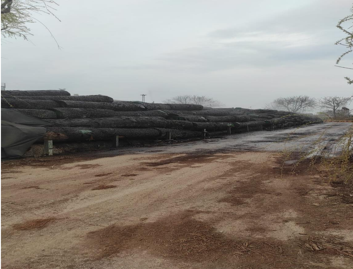
Slika 1 Stovarište trupaca

Posljednja faza proizvodnog procesa se odvija u skladištu gotovih furnira i to je sortiranje paketa osušenog i uvezanog furnira po klasama i dužinama te pakiranje složajeva na palete namijenjene za transport kupcima. U ovom procesu u pravilu ne nastaju gubitci osim u iznimnim slučajevima mehaničkog oštećenja prilikom transporta paleta sa gotovim furnirom.