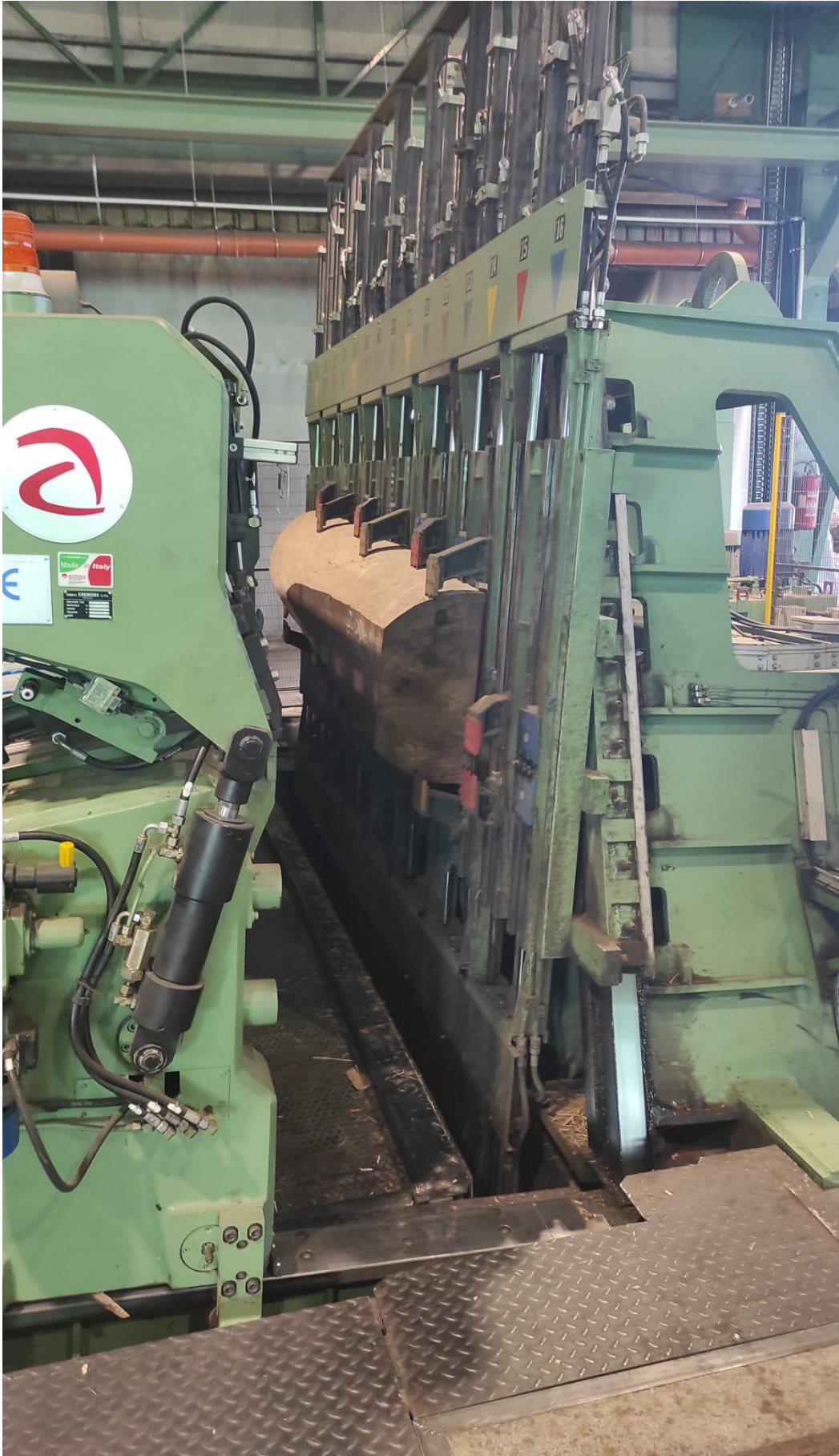
Slika 10 Polovnjak obrađivan na vertikalnom furnirskom nožu