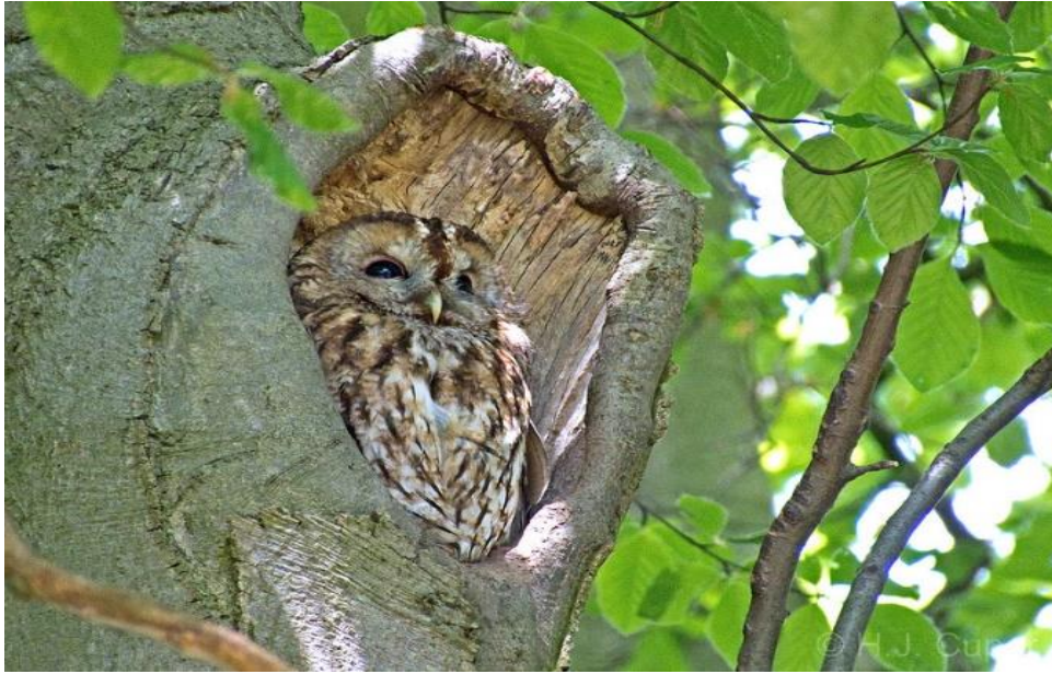
Slika 18. Šumska sova tijekom dana odmara u dupljama