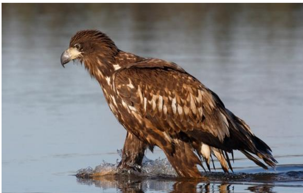
Slika 3. Mladi štekavac. Ruho jednoliko svježe, tamno. Kljun taman