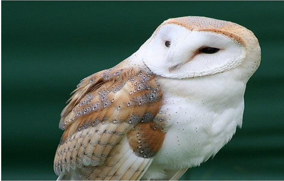
Slika 20. Kukuvija ima karakteristično sroliko lice