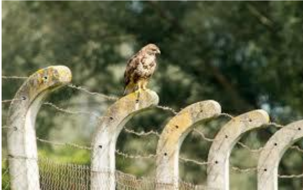
Slika 7. Često sjedi na ogradama čekajući plijen