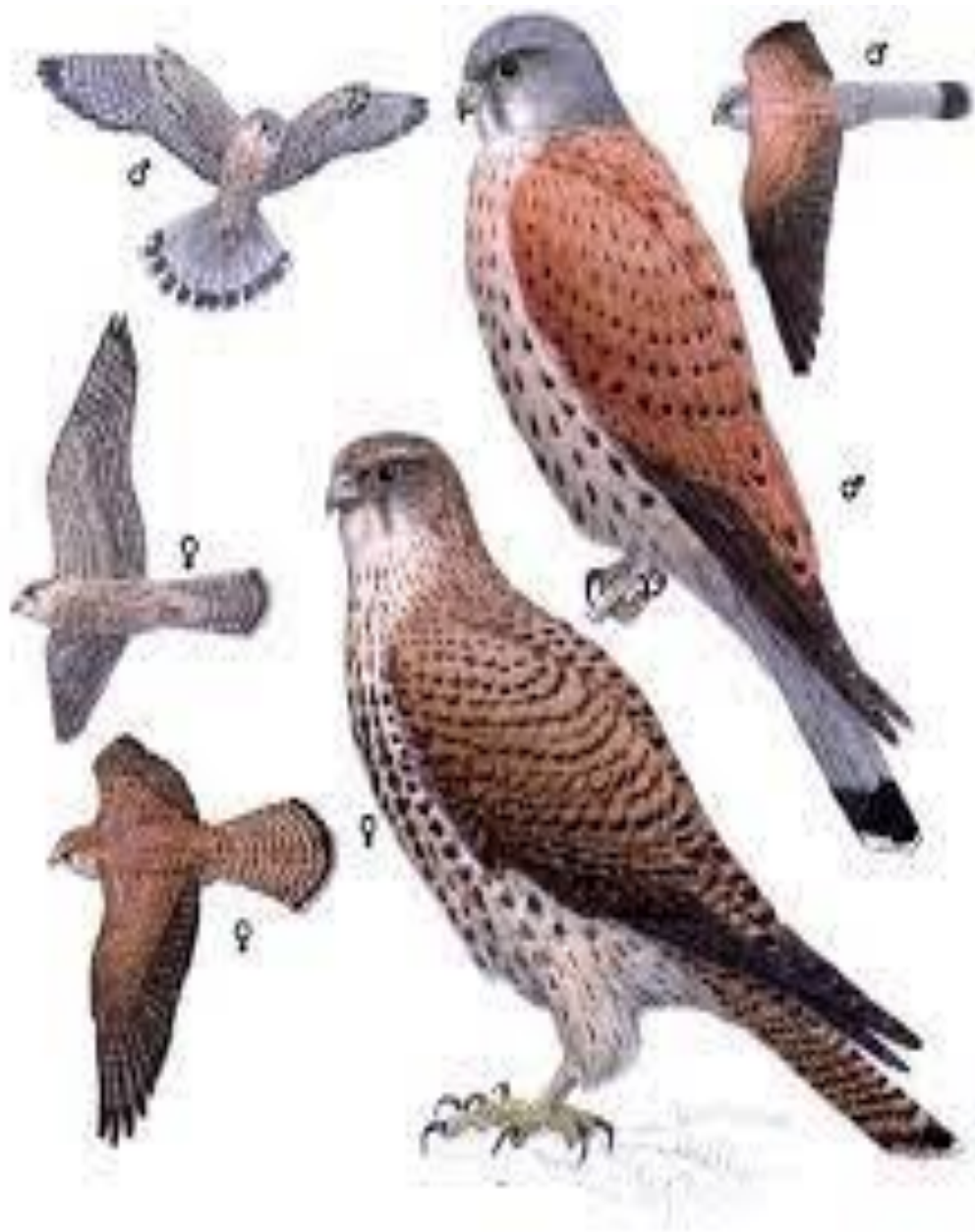
Slika 11. Razlika između ženke i mužjaka vjetruše