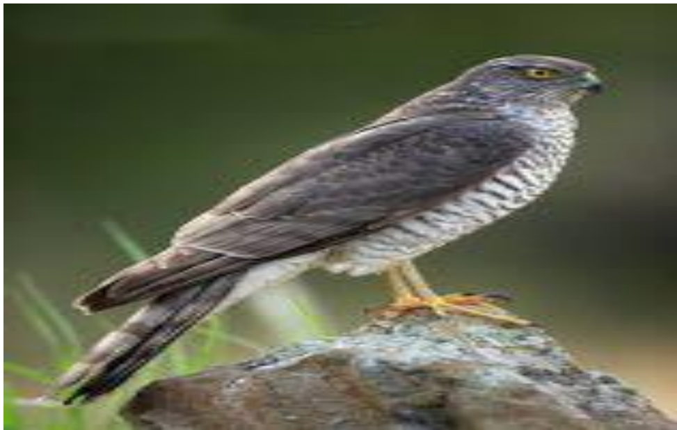
Slika 4. Odrasla ženka kopca