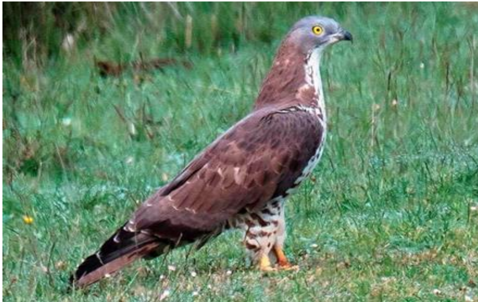
Slika 9. Odrasli mužjak škanjca osaša