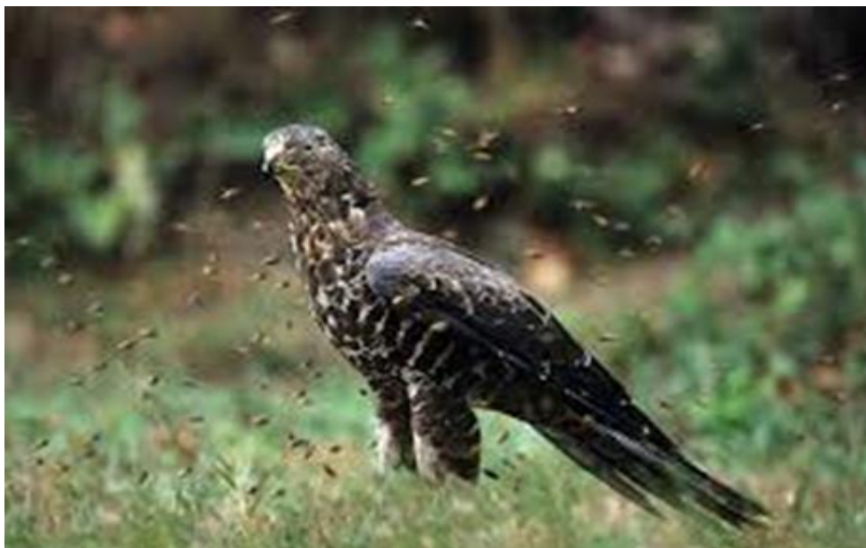
Slika 10. Odrasla ženka škanjca osaša okružena osama