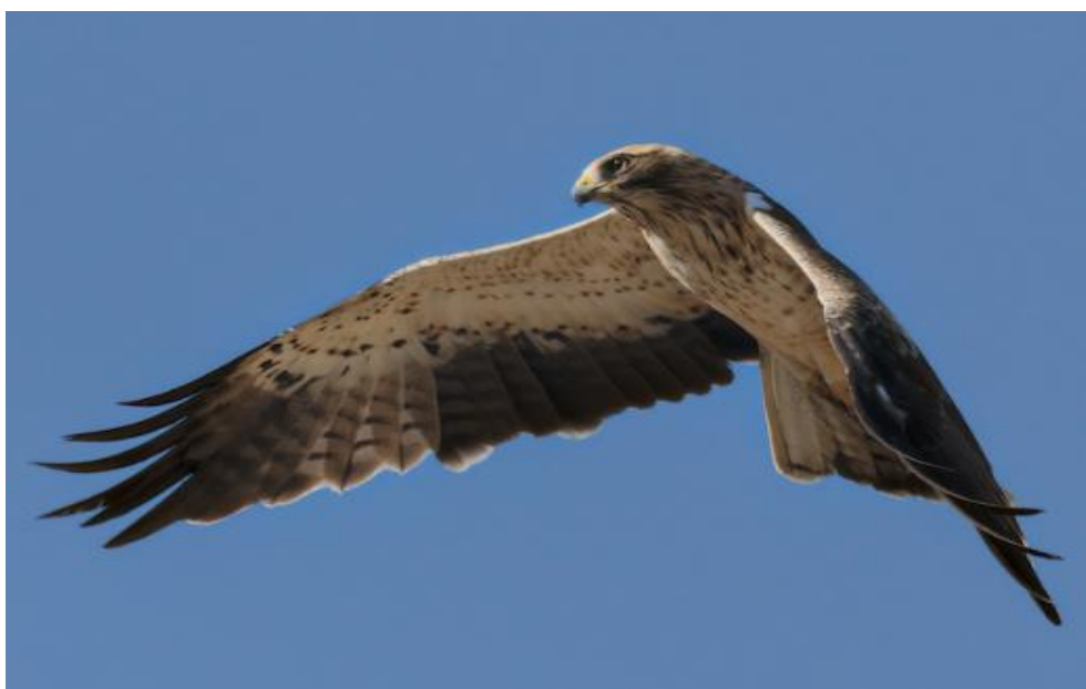
Slika 2. Svjetla varijanta patuljastog orla