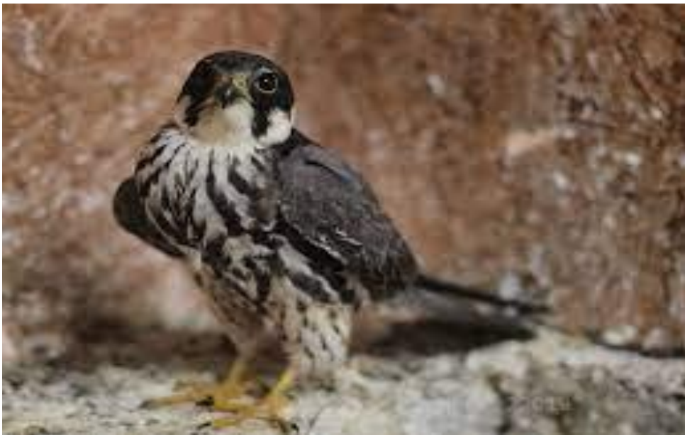
Slika 13. Mladi sokol lastavičar