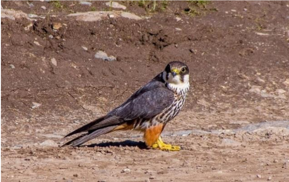
Slika 12. Odrasli sokol lastavičar