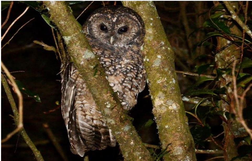
Slika 19. Šumska sova u noćnom lovu