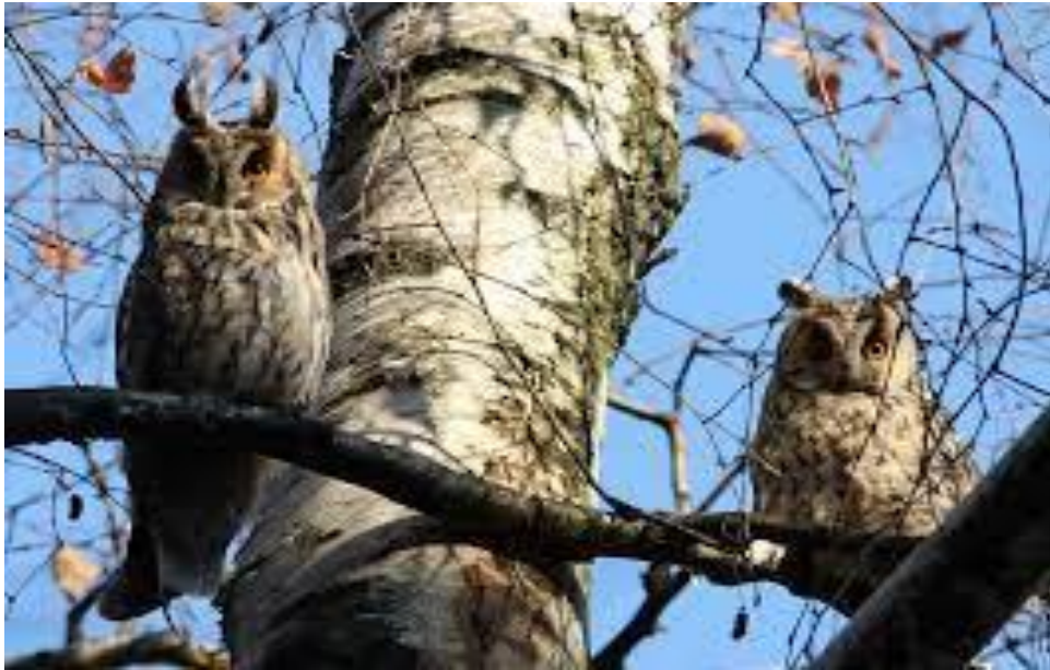
Slika 14. Male ušare zajedno odmaraju tijekom zimske seobe