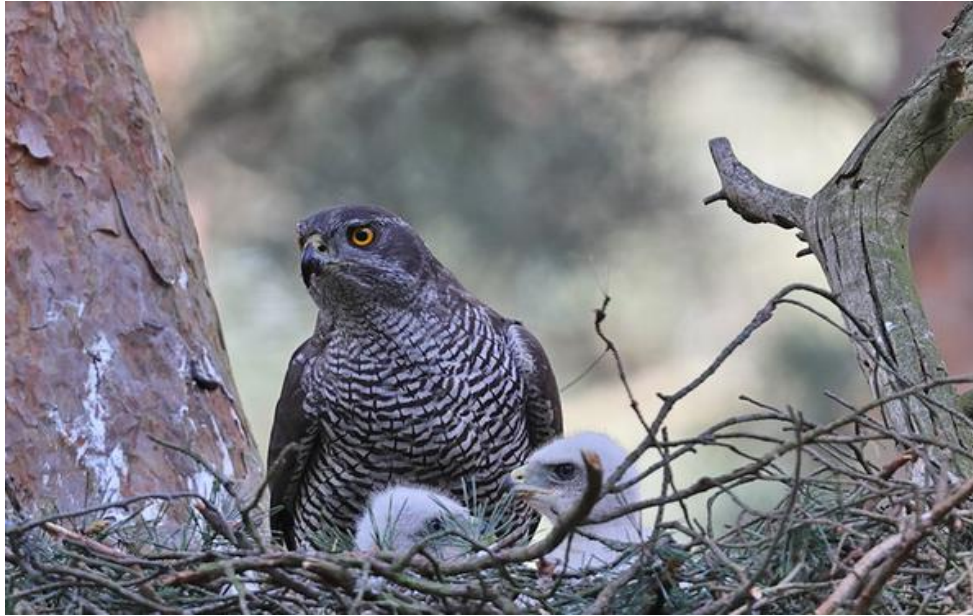
Slika 5. Odrasli mužjak jastreba s ptićima