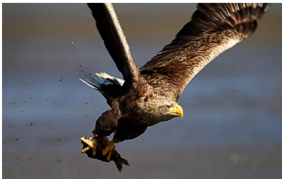
Slika 4. Odrasli štekavac. Glava i vrat su žućkastosmeđi, kljun je žute boje