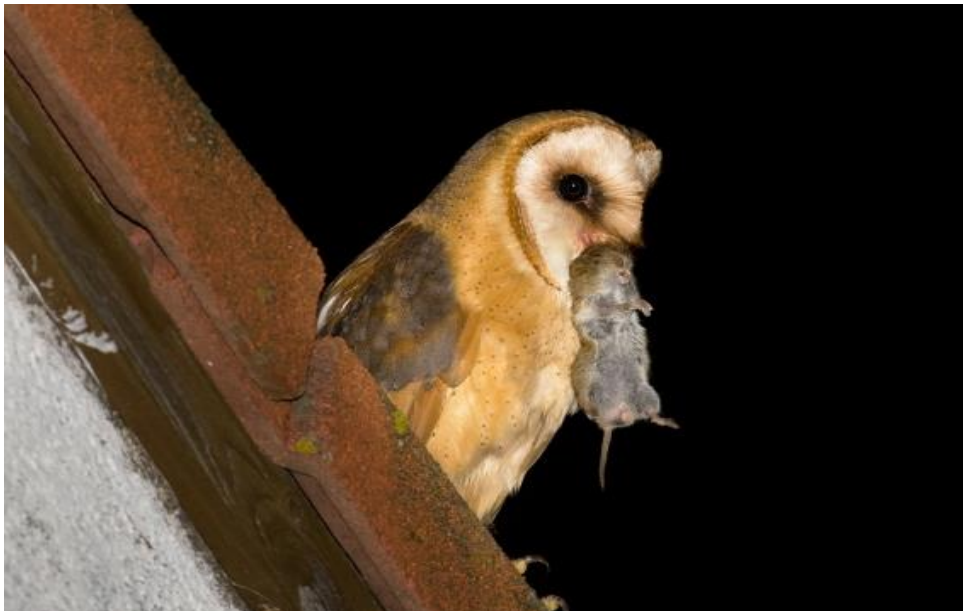
Slika 21. Kukuvije aktivno love noću