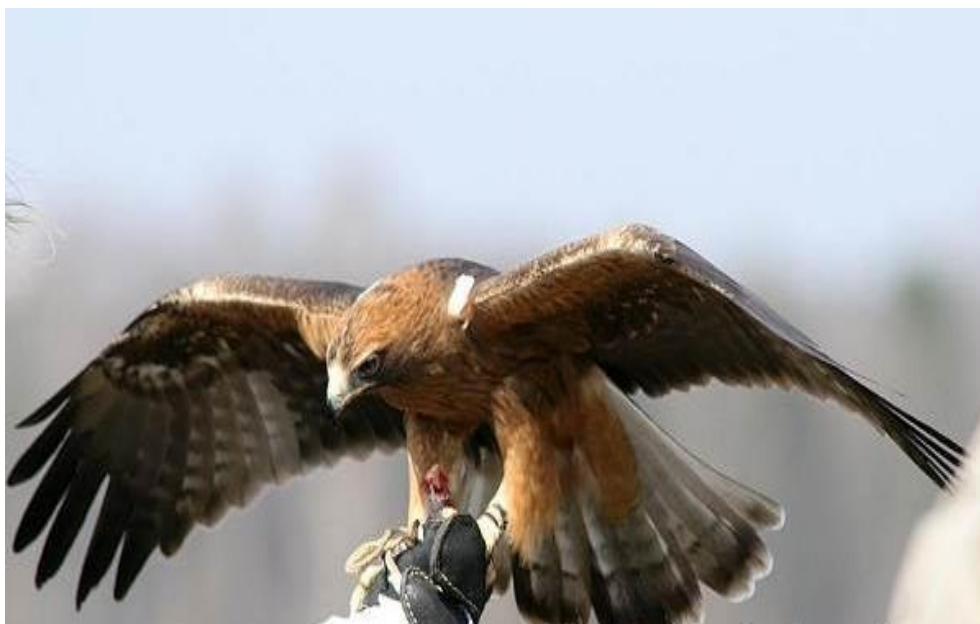
Slika 1. Tamnija varijanta patuljastog orla. Dobro vidljive karakteristične bijele mrlje na bazi vodećeg krila