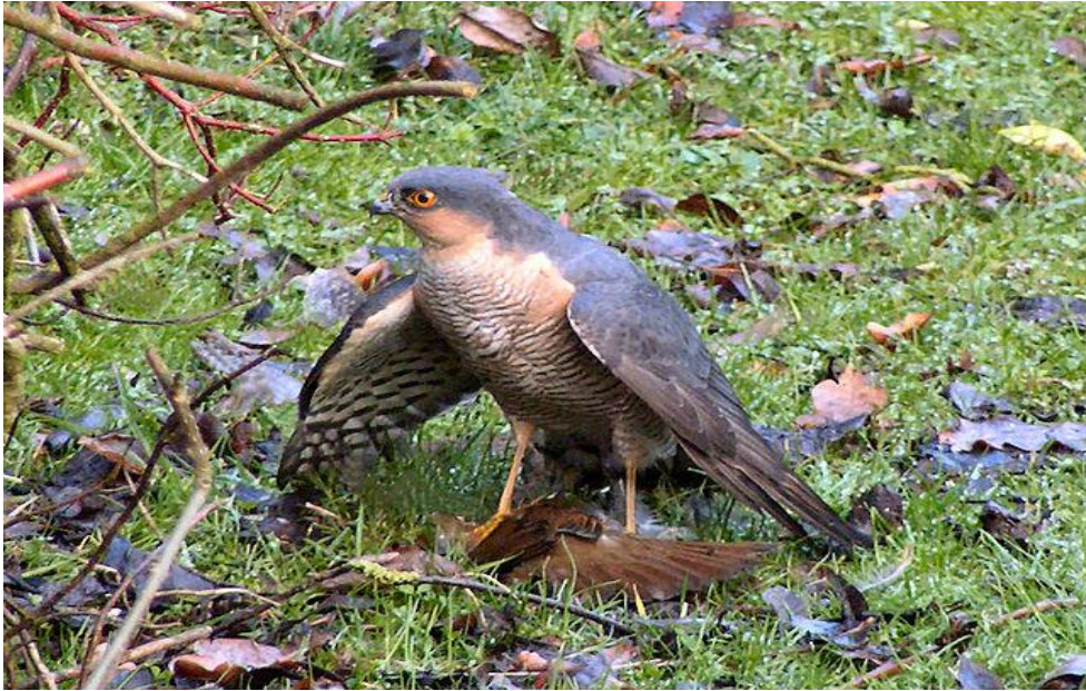
Slika 3. Odrasli mužjak kopca s ulovljenim plijenom