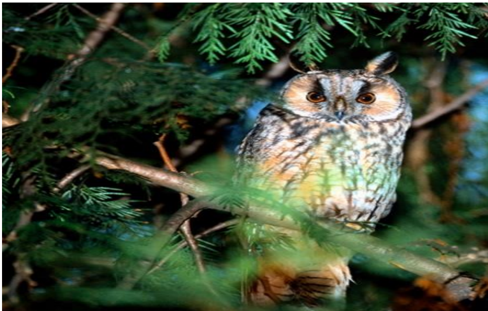
Slika 15. Male ušare često se gnijezde u crnogoričnim šumama