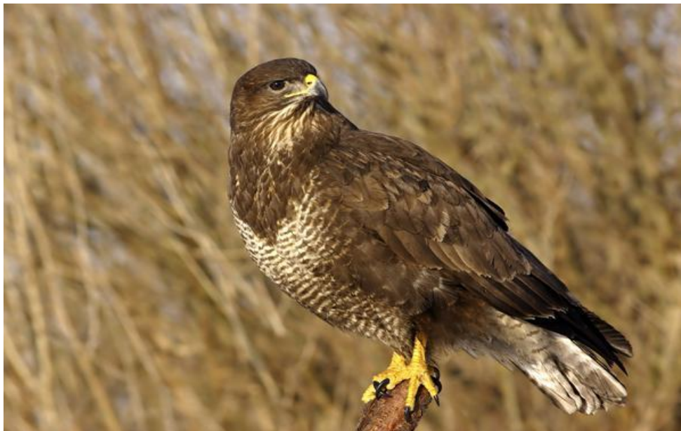
Slika 8. Odrasla ženka škanjca (poprečno prugasta prsa)