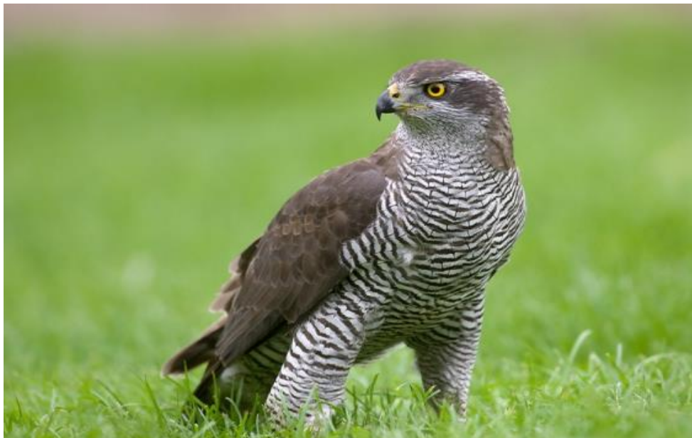
Slika 6. Odrasla ženka jastreba