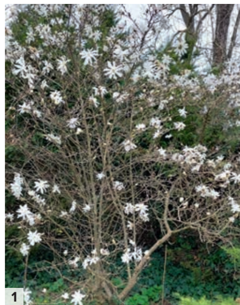
1) Rascvala magnolija 2) Sadnica Magnolia grandiflora u tegli u vrtnom centru

vrijeme kulturom tkiva u suvremenim laboratorijima). Postoji nekoliko prednosti uzgoja magnolija iz sjemena. Generativnim načinom razmnožavanja, kontroliranim i